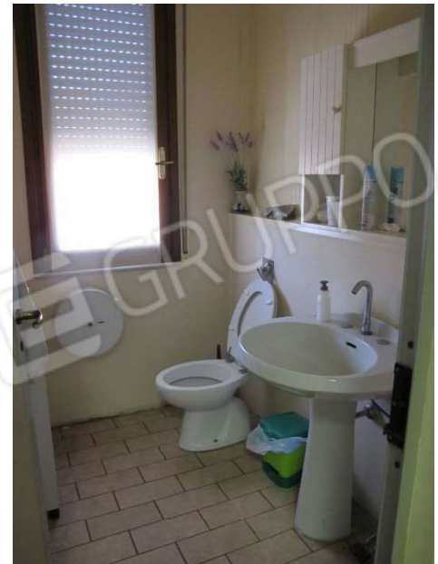
Zona autorizzata nella C.ed. a uso uffici