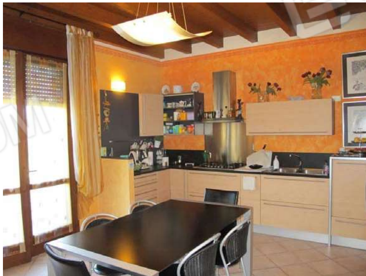
Viste interne PIANO PRIMO e stato di conservazione