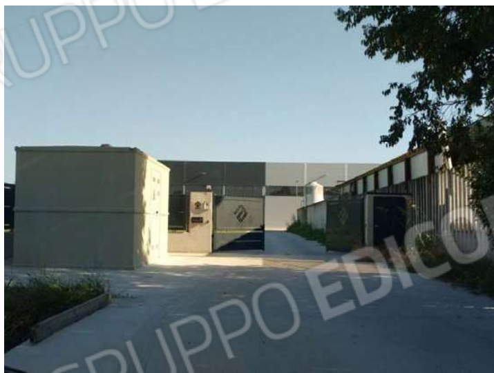
Capannone lotto confinante a ovest