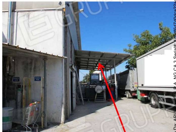
Vista lato nord, paddock esterni