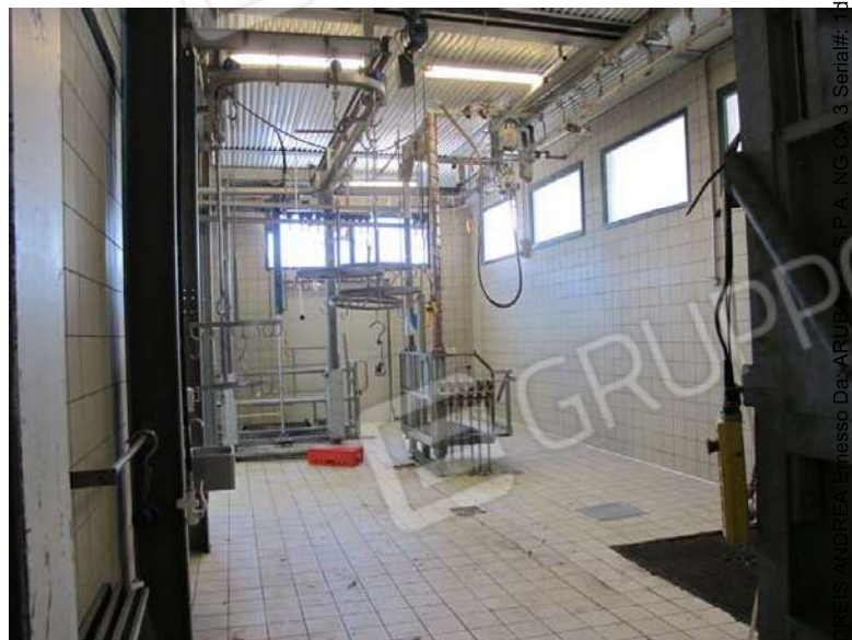
Zone lavorazione carni/macello