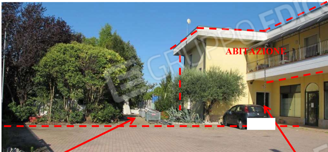
Corte comune all'abitazione e autorimessa sub. 17