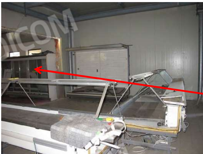
Collegamento con autorimessa difforme rispetto ai titoli autorizzativi