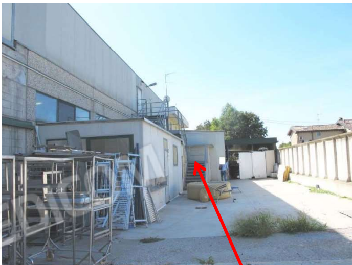
Vista lato ovest del capannone/macello