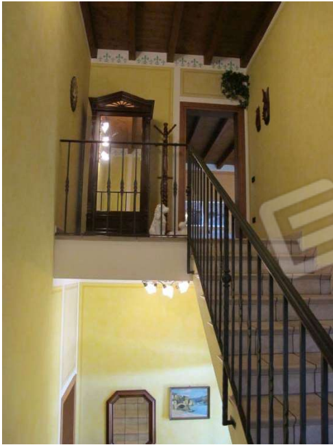
Vano scala di collegamento