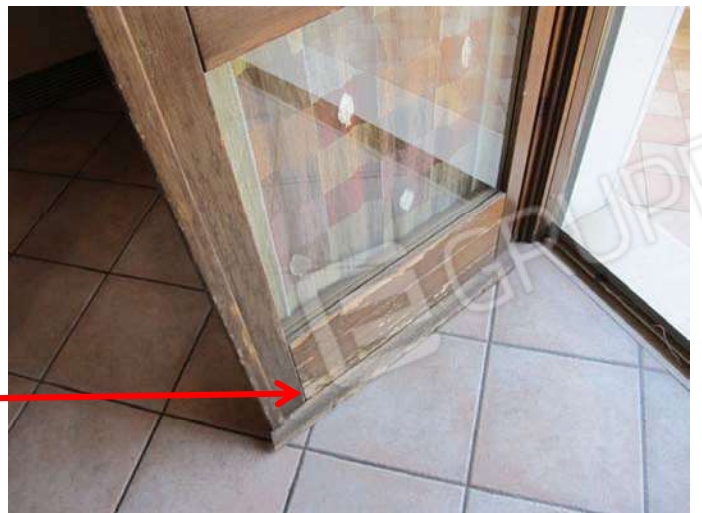
Stato di conservazione dei serramenti lato ovest