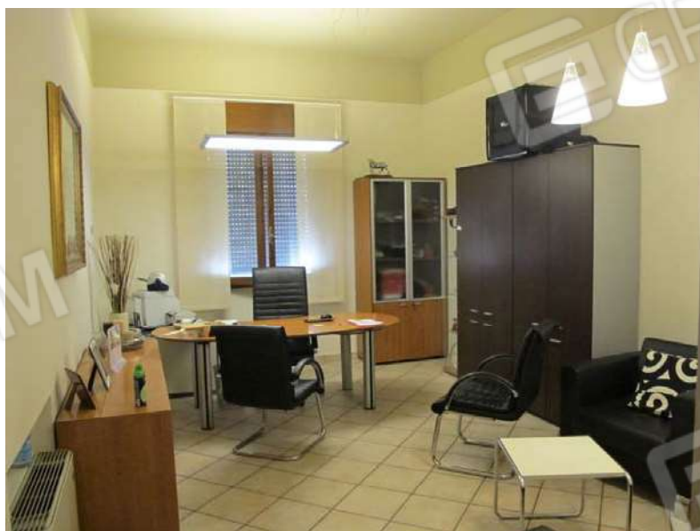
Viste interne PIANO TERRA e stato di conservazione