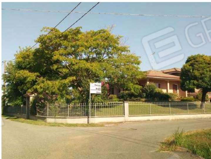
Edificio residenziale nelle vicinanze