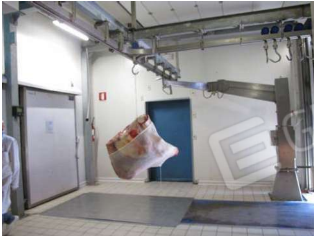
Zone lavorazione carni