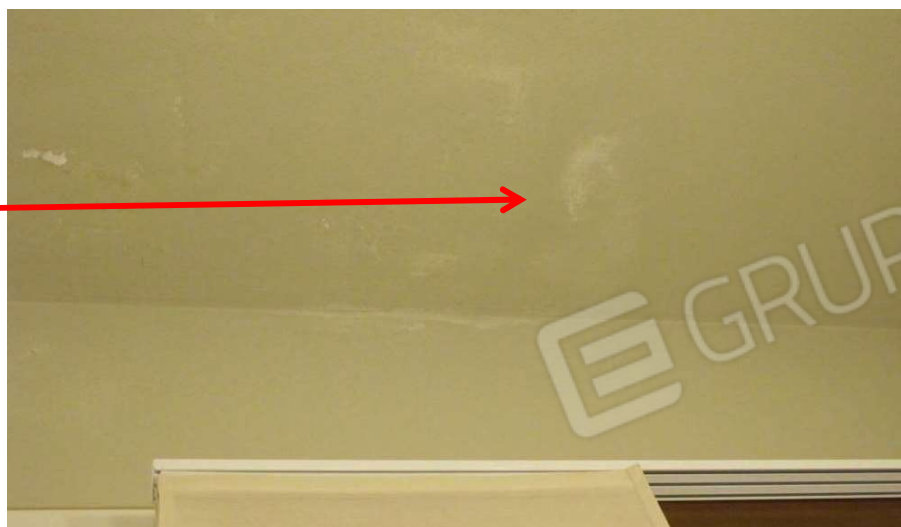
Umidità sul soffitto