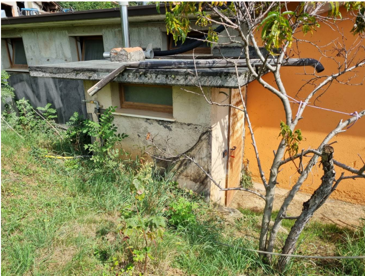
Vano esterno non autorizzato