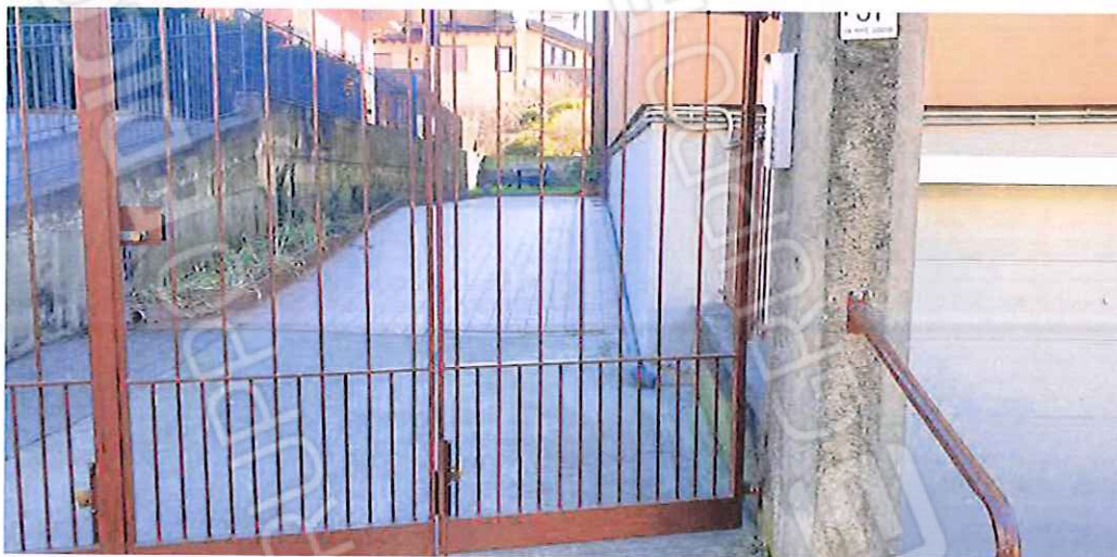
Foto 1 - Ingresso pedonale da via Monte Sabotino