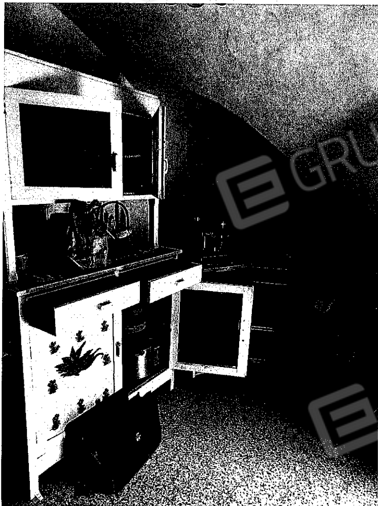
Vista interna particella n.16 sub.1