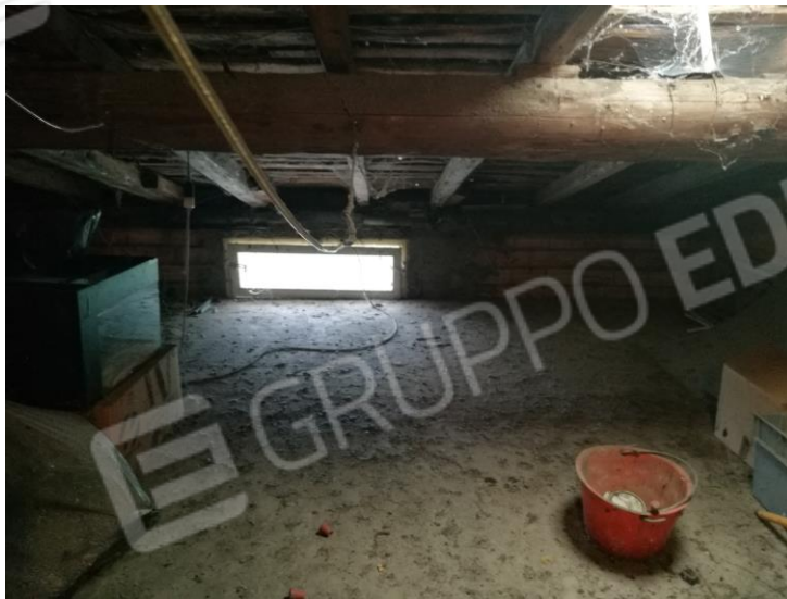
Foto 20 – PIANO SECONDO - vista interna sottotetto e particolare tetto.