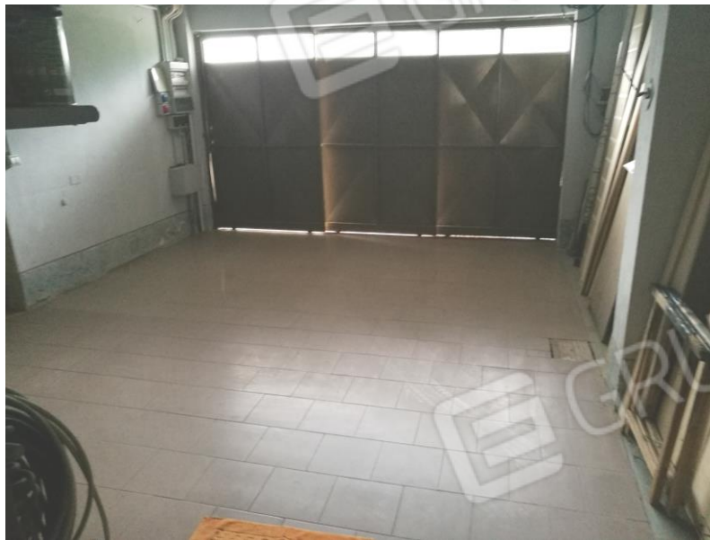
Foto 7 – PIANO TERRA - vista dall'interno del box mappale n. 10 sub. 8.

Studio Tecnico Geom. Cristian Franzoni via Vittorio Veneto n. 46 – 25042 Borno (Bs) - tel. 036441030 – email studiofranzoni@alice.it Pec. cristian.franzoni@geopec.it - Iscritto all'Albo dei Geometri della Provincia di Brescia al n. 4031 Iscritto all'Albo dei Consulenti Tecnici per il Tribunale Ordinario di Brescia al n. 182 Autorizzazione n. BS04031G00550 per certificazioni di cui agli artt. 1 e 2 del D.M. 30/04/1993 pratiche Vigili del Fuoco Tecnico in possesso dei requisiti richiesti dal D.G.R. VIII/8745 del 22 dicembre 2008, al punto 16.2 lettera B (si riceve su appuntamento dal lunedì al venerdì ore 9:00-11:00 ; 14:00-18:00)