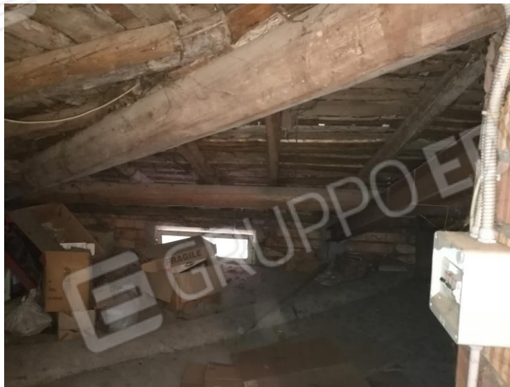
Foto 23 – PIANO SECONDO - vista interna sottotetto e particolare tetto.