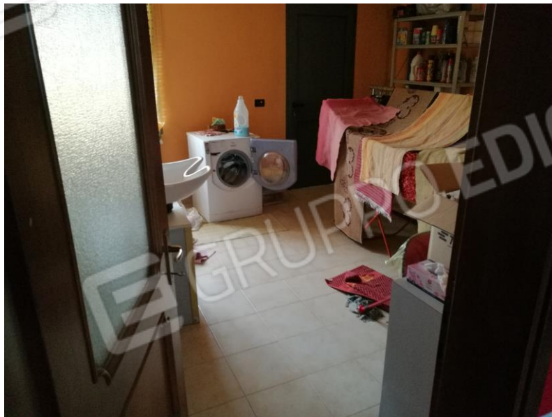
Foto 9 – PIANO TERRA - vista del ripostiglio/lavanderia retrostante il box.