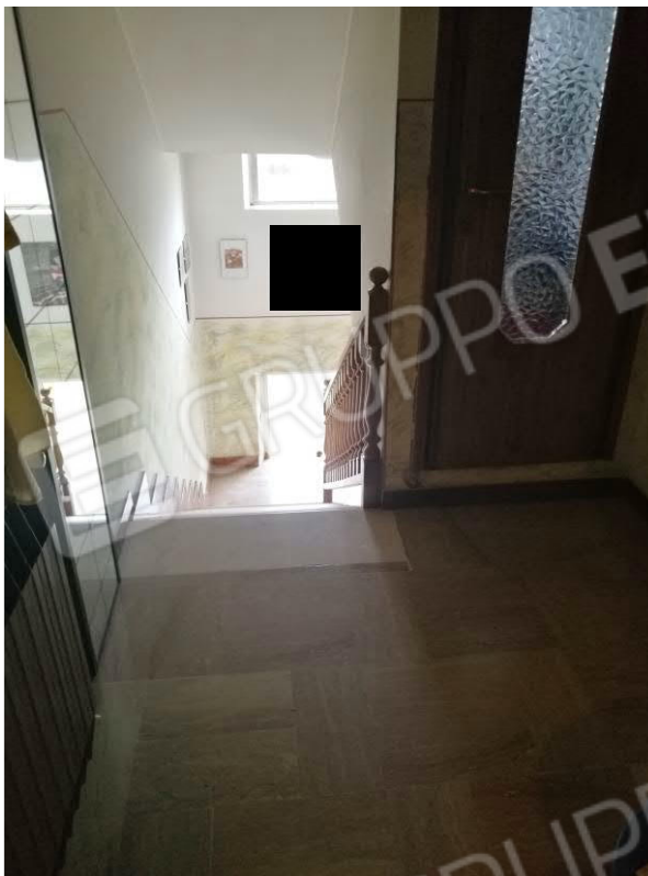
Foto 11 – PIANO PRIMO - vista d'insieme scala interna d'accesso all'appartamento mappale n. 10 sub. 9.