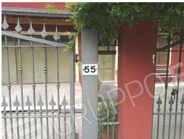
Foto 2 – particolare numero civico 55 di via Valeriana in Comune di Artogno (Bs).