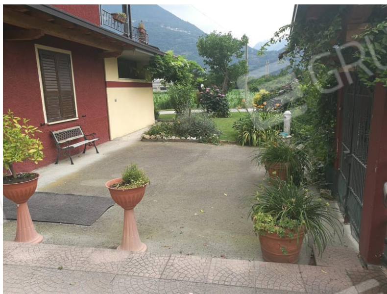
Foto 4 – PIANO TERRA - vista d'insieme cortile antistante prospetto Nord.

Studio Tecnico Geom. Cristian Franzoni via Vittorio Veneto n. 46 – 25042 Borno (Bs) - tel. 036441030 – email studiofranzoni@alice.it