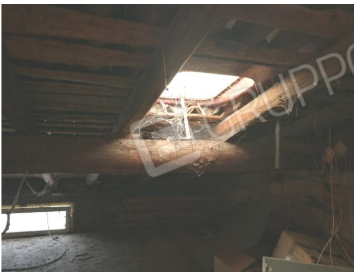
Foto 21 – PIANO SECONDO - vista interna sottotetto e particolare tetto.