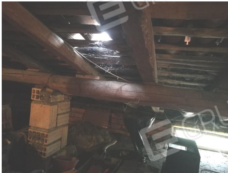
Foto 19 – PIANO SECONDO - vista interna sottotetto e particolare tetto.