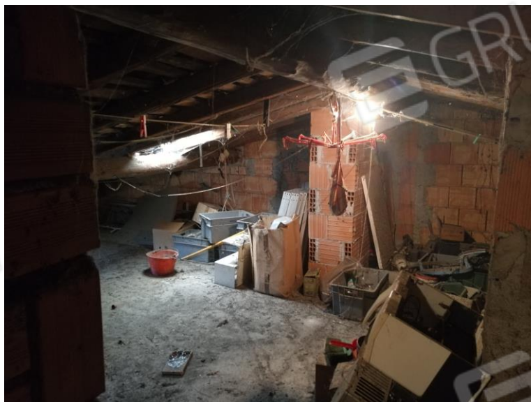
Foto 25 – PIANO SECONDO - vista interna sottotetto e particolare tetto.

Studio Tecnico Geom. Cristian Franzoni via Vittorio Veneto n. 46 – 25042 Borno (Bs) - tel. 036441030 – email studiofranzoni@alice.it