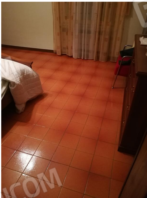
Foto 12 – PIANO PRIMO - vista camera da letto e dettaglio pavimentazione.