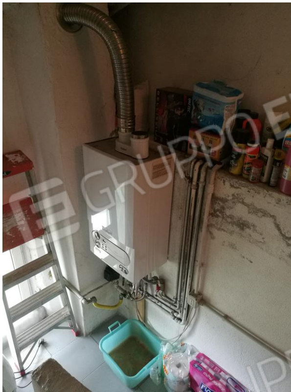
Foto 18 – PIANO PRIMO/SECONDO – particolare caldaia posta su scala interna fra appartamento e solaio.