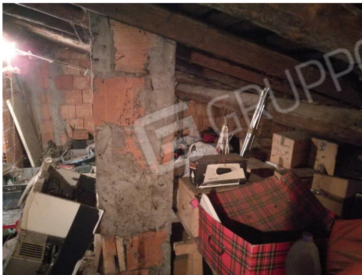
Foto 24 – PIANO SECONDO - vista interna sottotetto e particolare tetto.