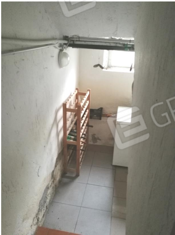
Foto 5 – PIANO TERRA - vista d'insieme sottoscale interno utilizzato a ripostiglio.