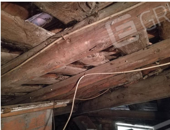
Foto 22 – PIANO SECONDO - vista interna sottotetto e particolare tetto.

Studio Tecnico Geom. Cristian Franzoni via Vittorio Veneto n. 46 – 25042 Borno (Bs) - tel. 036441030 – email studiofranzoni@alice.it