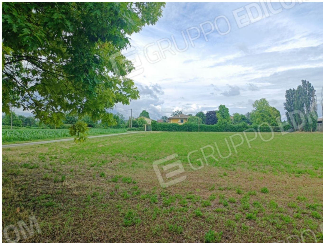
1. Terreno Fg. 15 Mapp. 130 (Cascina Comune)