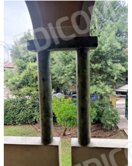
37. Balcone in lato nord