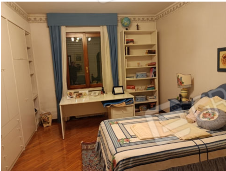
17. Camera in lato est