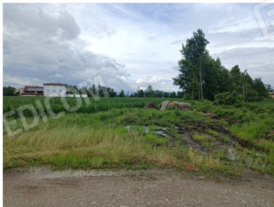
2. Terreno Fg. 15 Mapp. 14