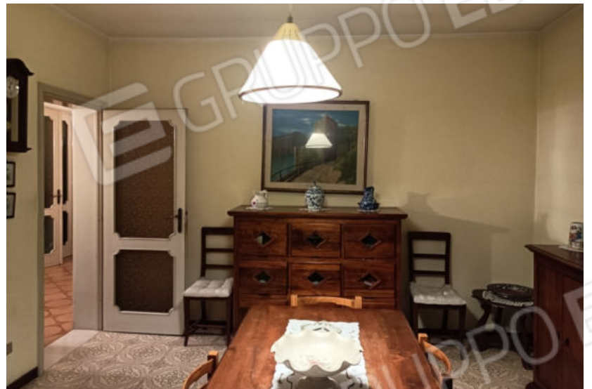
29. Sala da pranzo