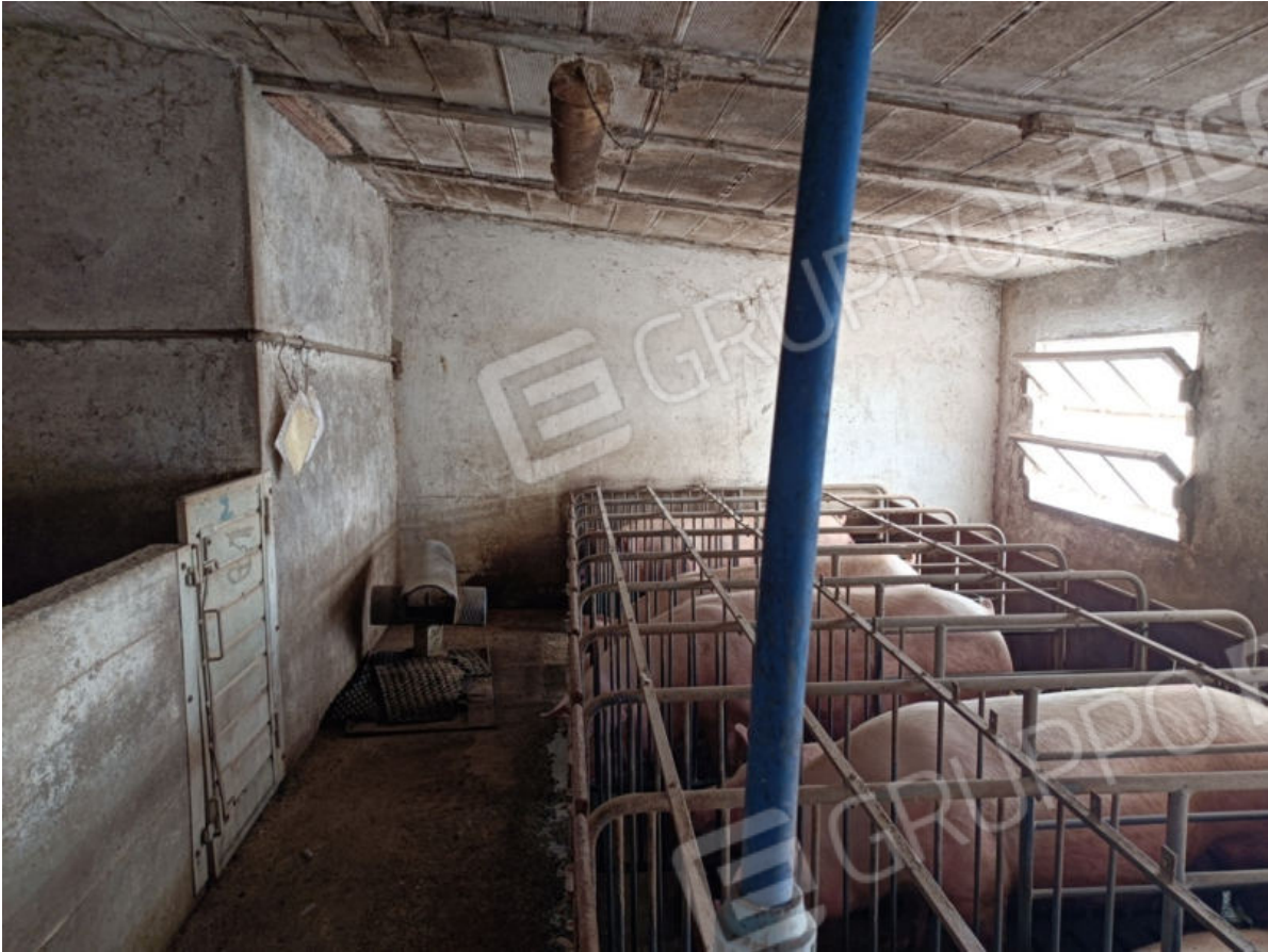
9. Sala di attesa della fecondazione