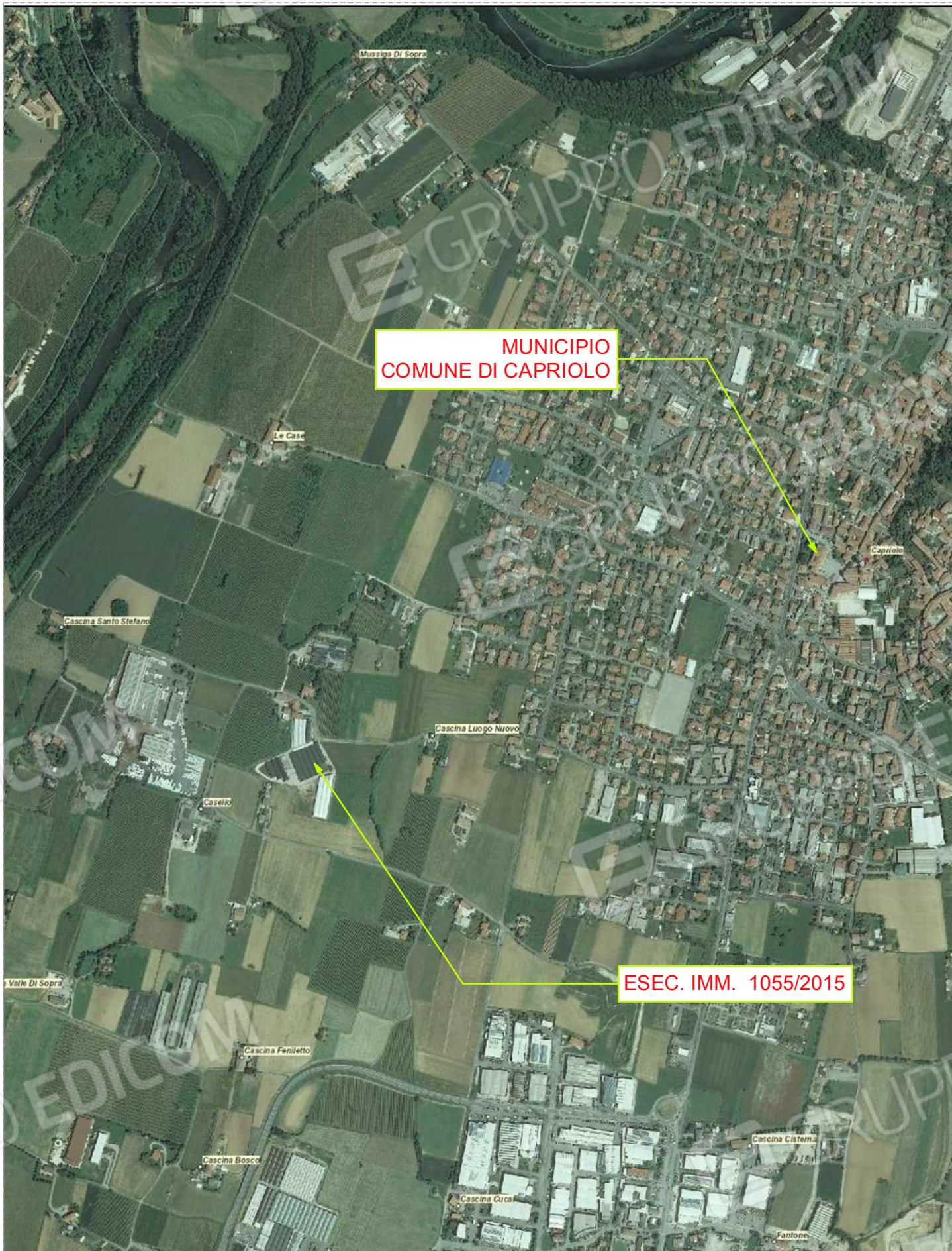
01 - Ortofoto di territorio comunale di Capriolo con individuazione immobile oggetto di ESEC. IMM. 1055/2015