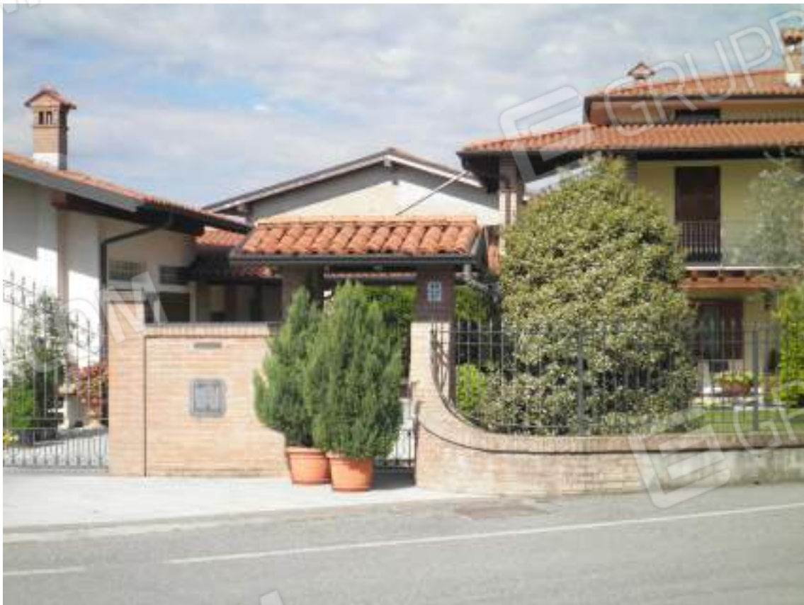
Lato ovest - dettaglio residenza 02