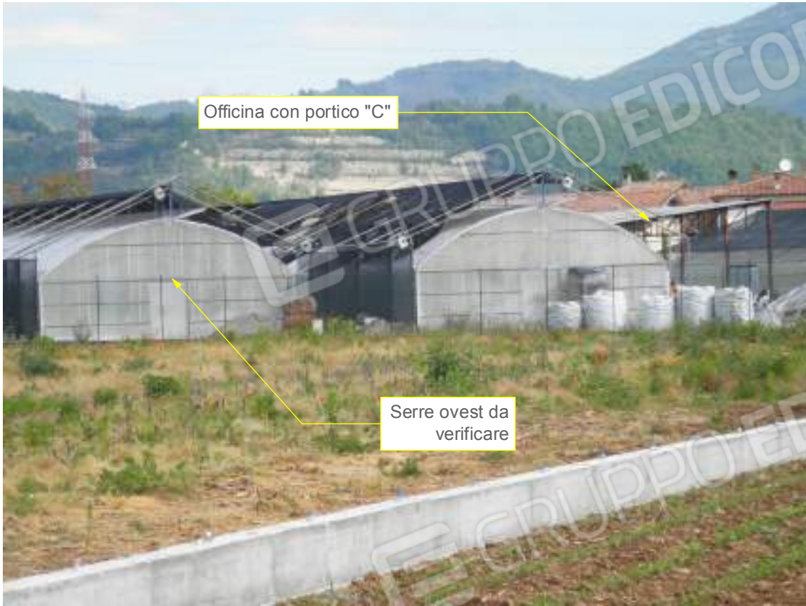
Lato sud 01