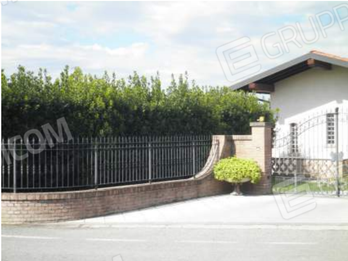
Lato ovest - dettaglio residenza 04 ingresso piano interrato