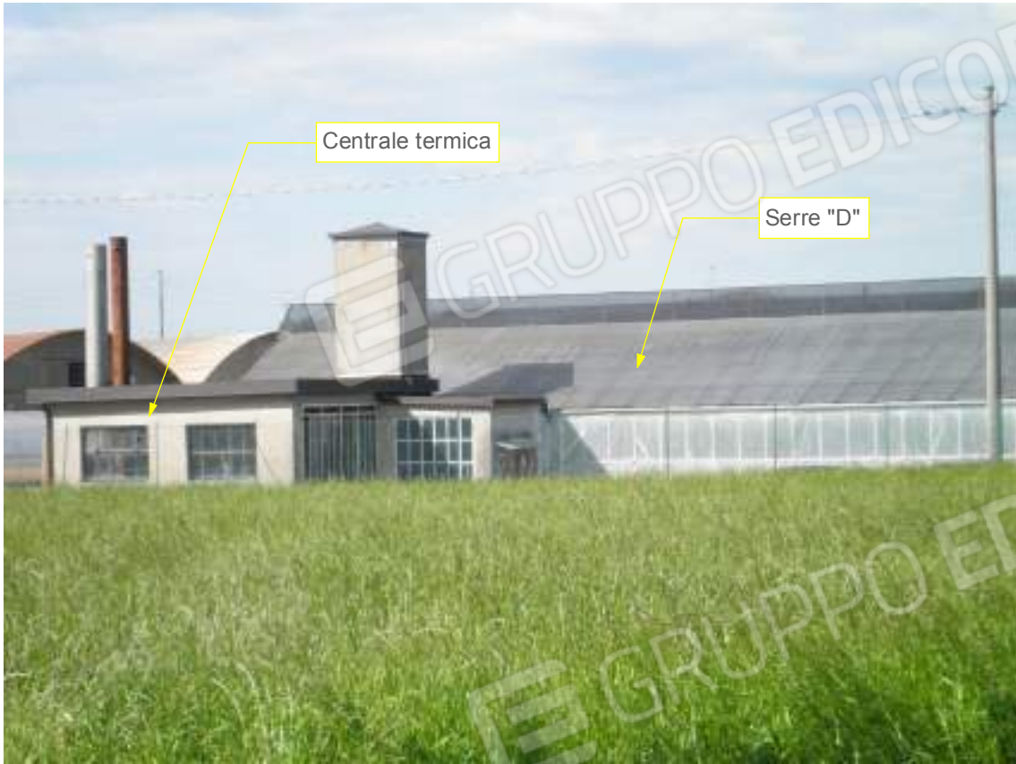
Lato est su via Pozze - dettaglio 03