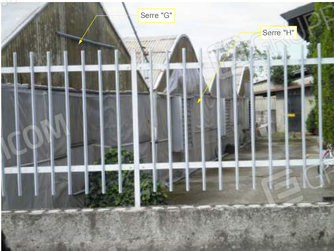
Lato ovest - dettaglio serra "G" e "H"