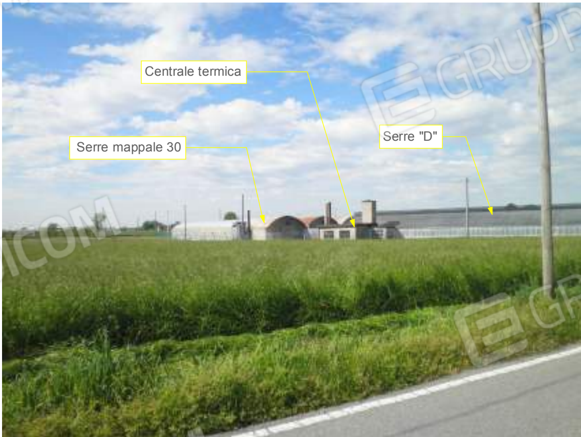
Lato est su via Pozze 04