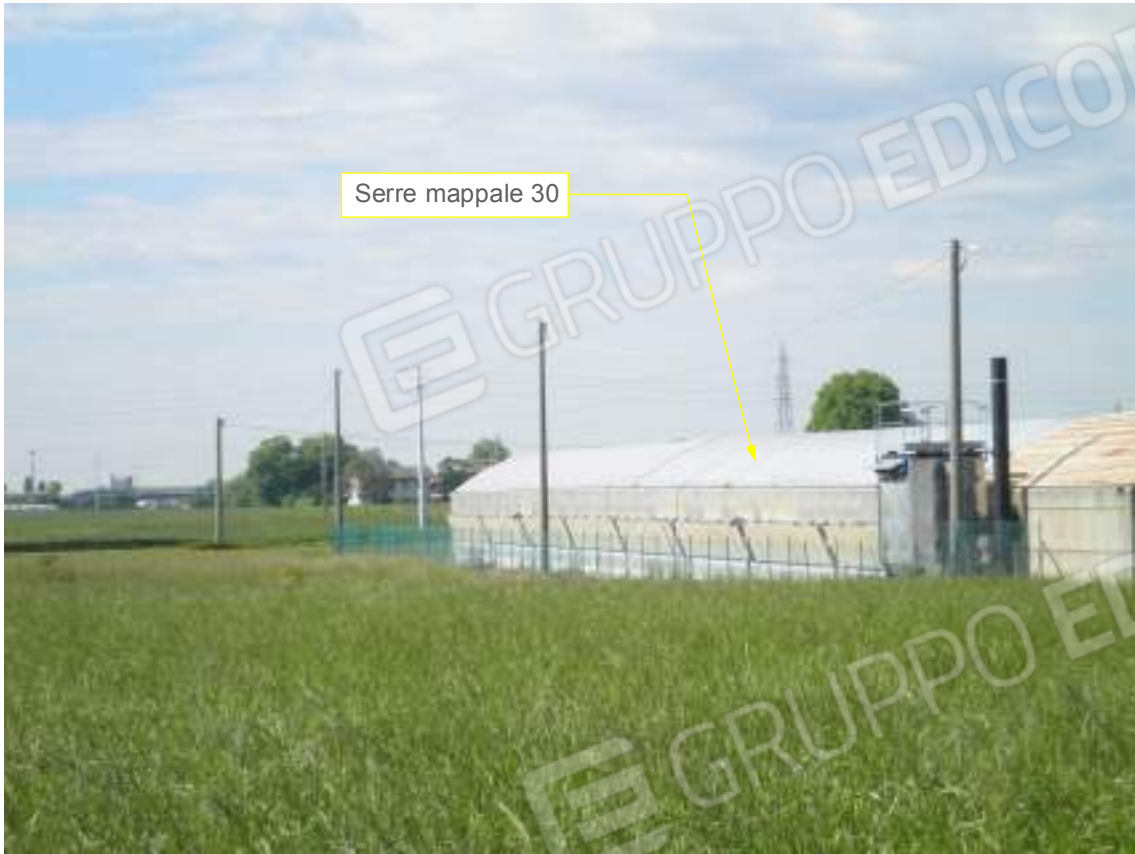
Lato est su via Pozze - dettaglio 01