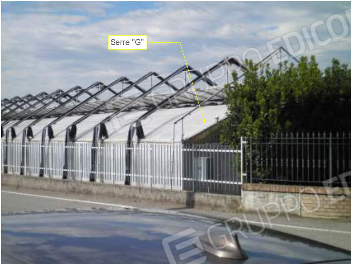
Lato ovest - dettaglio serra "G"