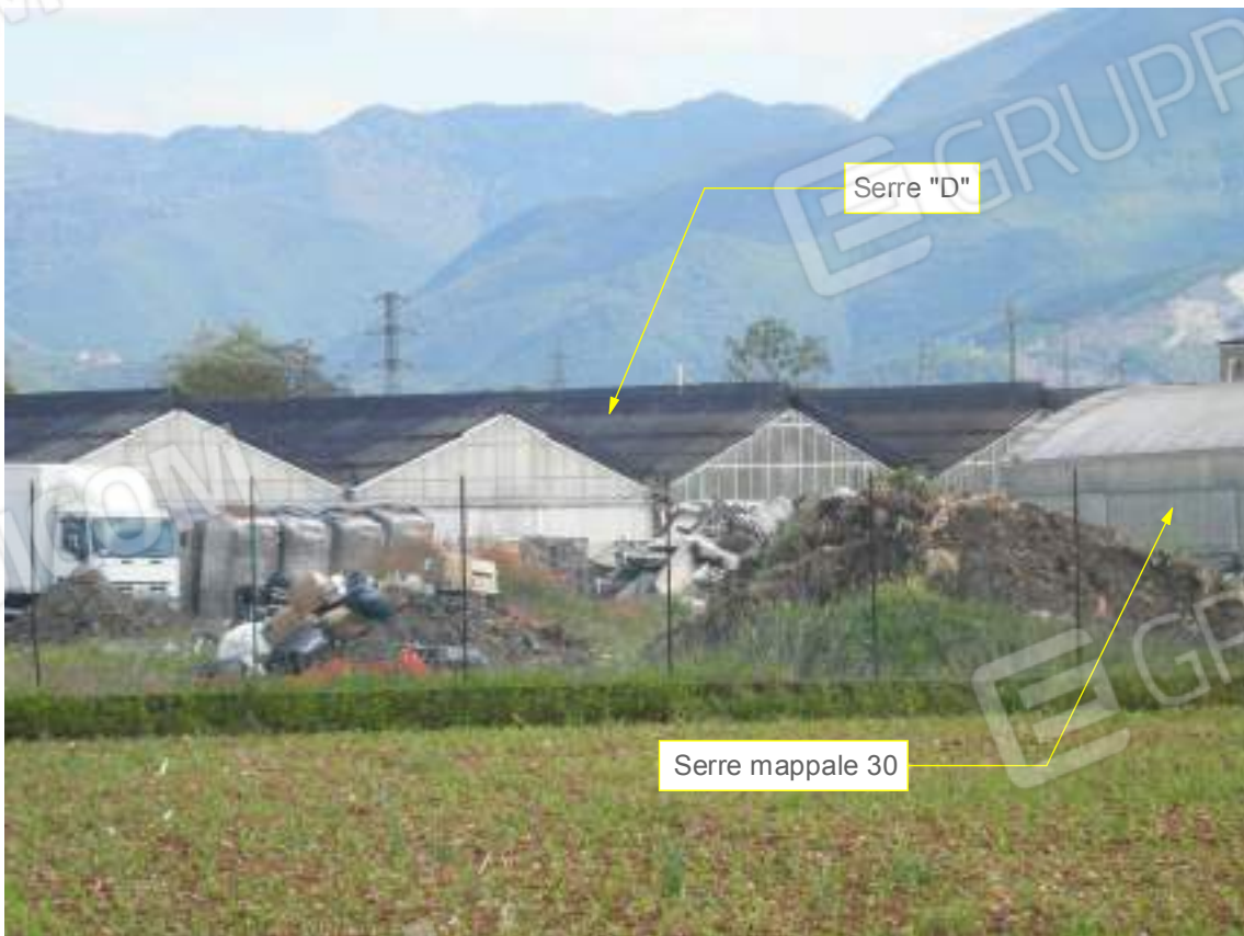
Lato sud 02