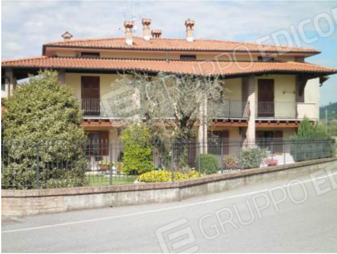
Lato ovest - dettaglio residenza 01