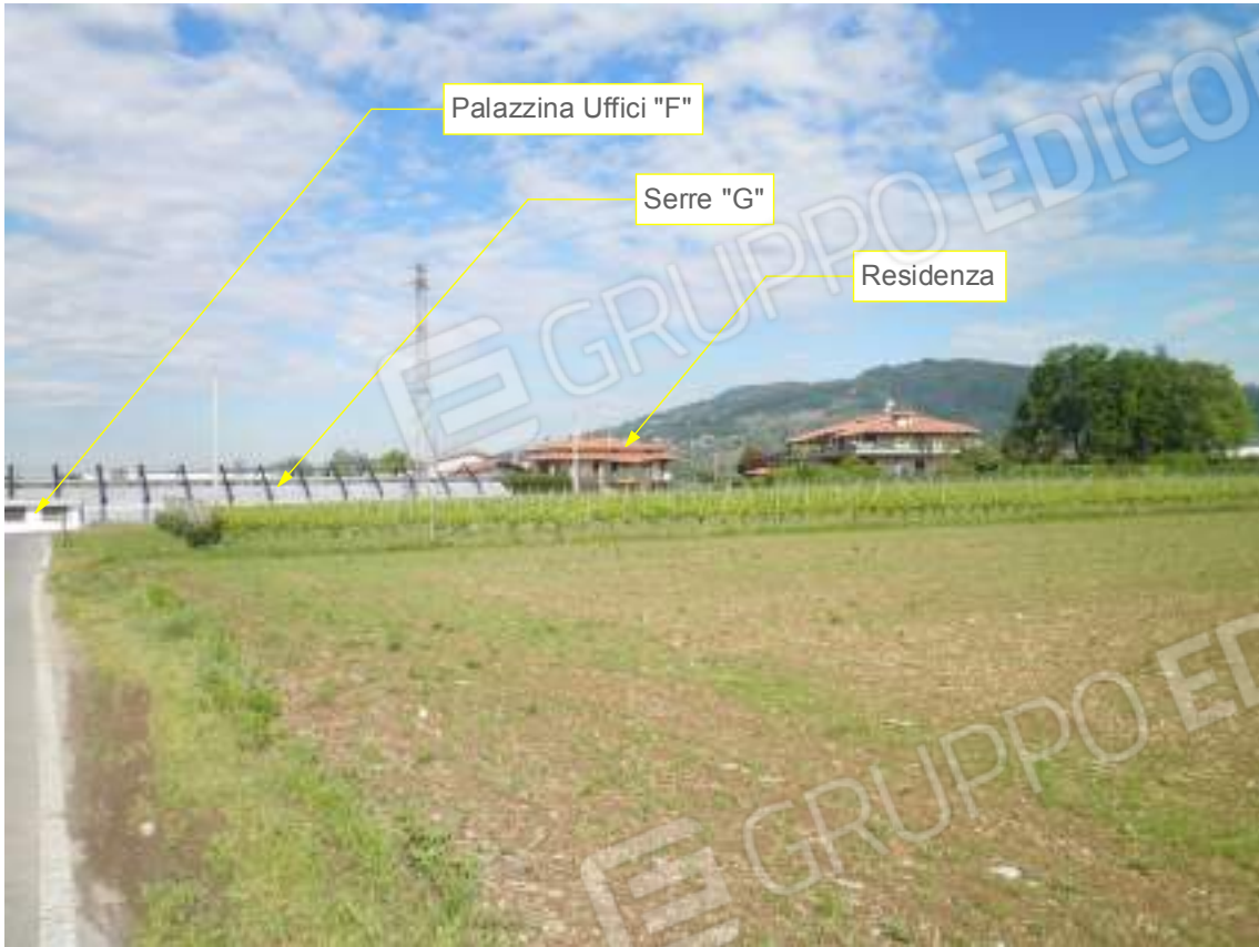
Lato est su via Pozze 01