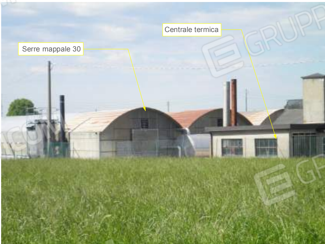
Lato est su via Pozze - dettaglio 02