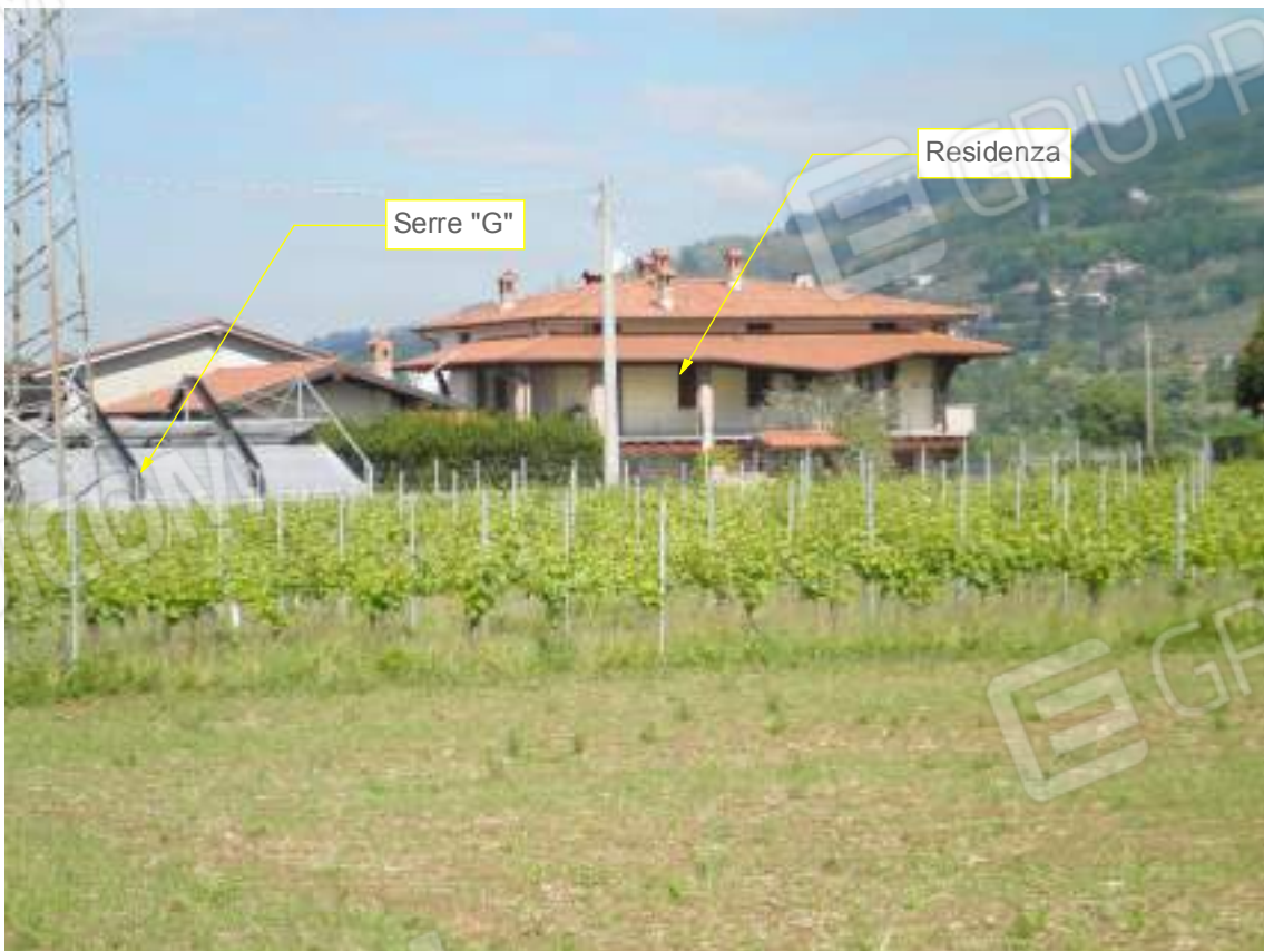
Lato est su via Pozze - dettaglio 05