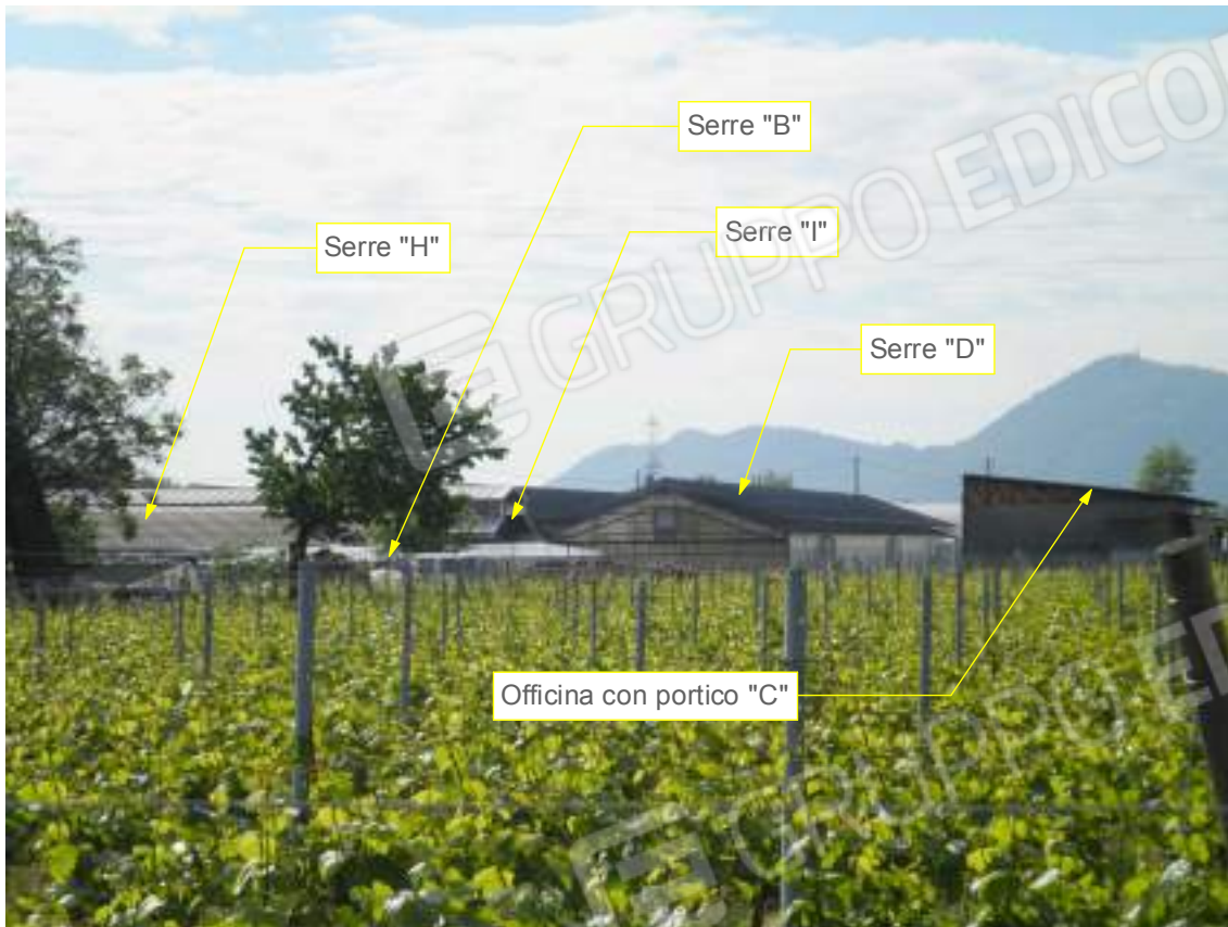
Lato ovest 01