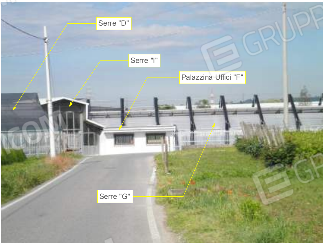
Lato est su via Pozze - dettaglio 04