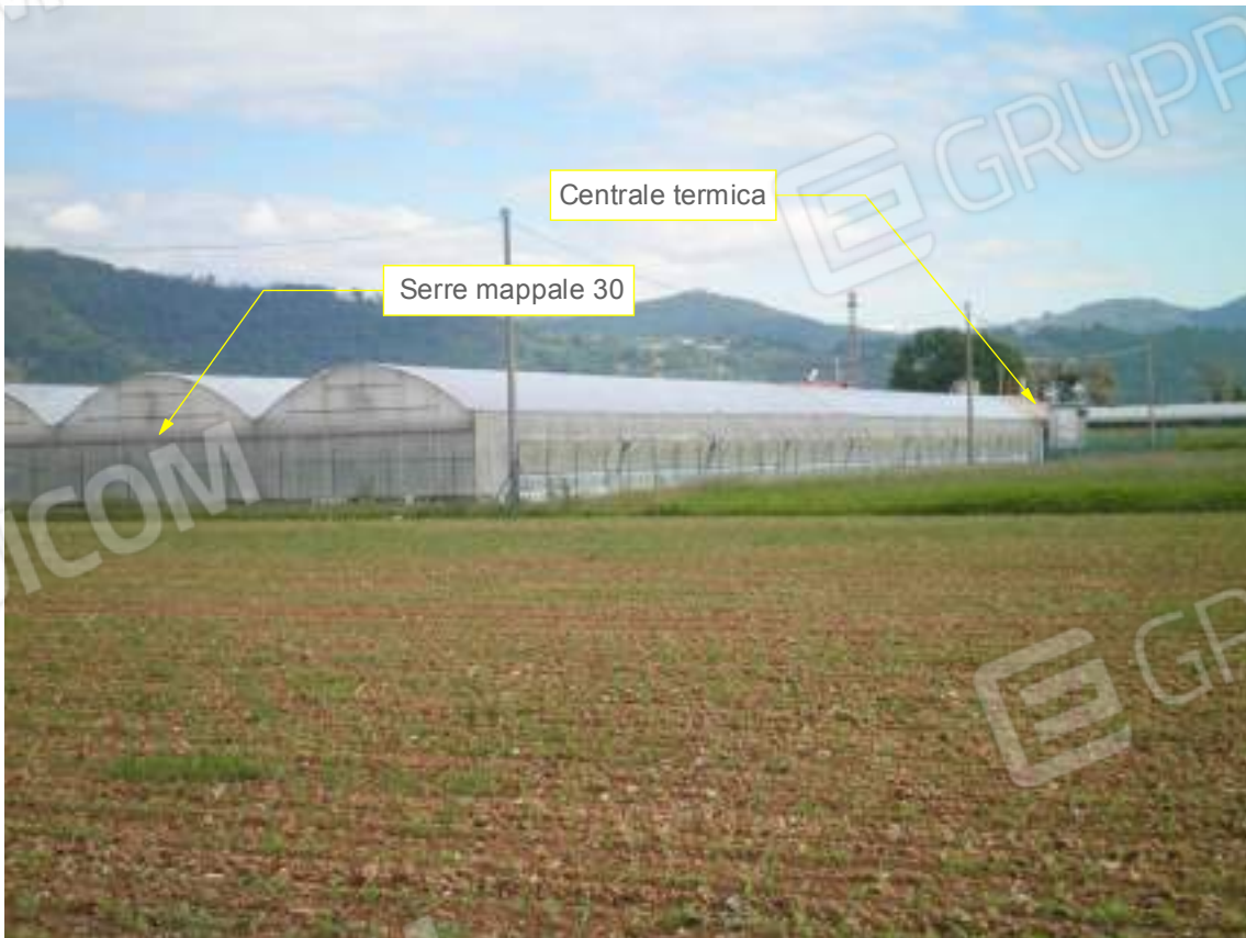
Lato sud 03