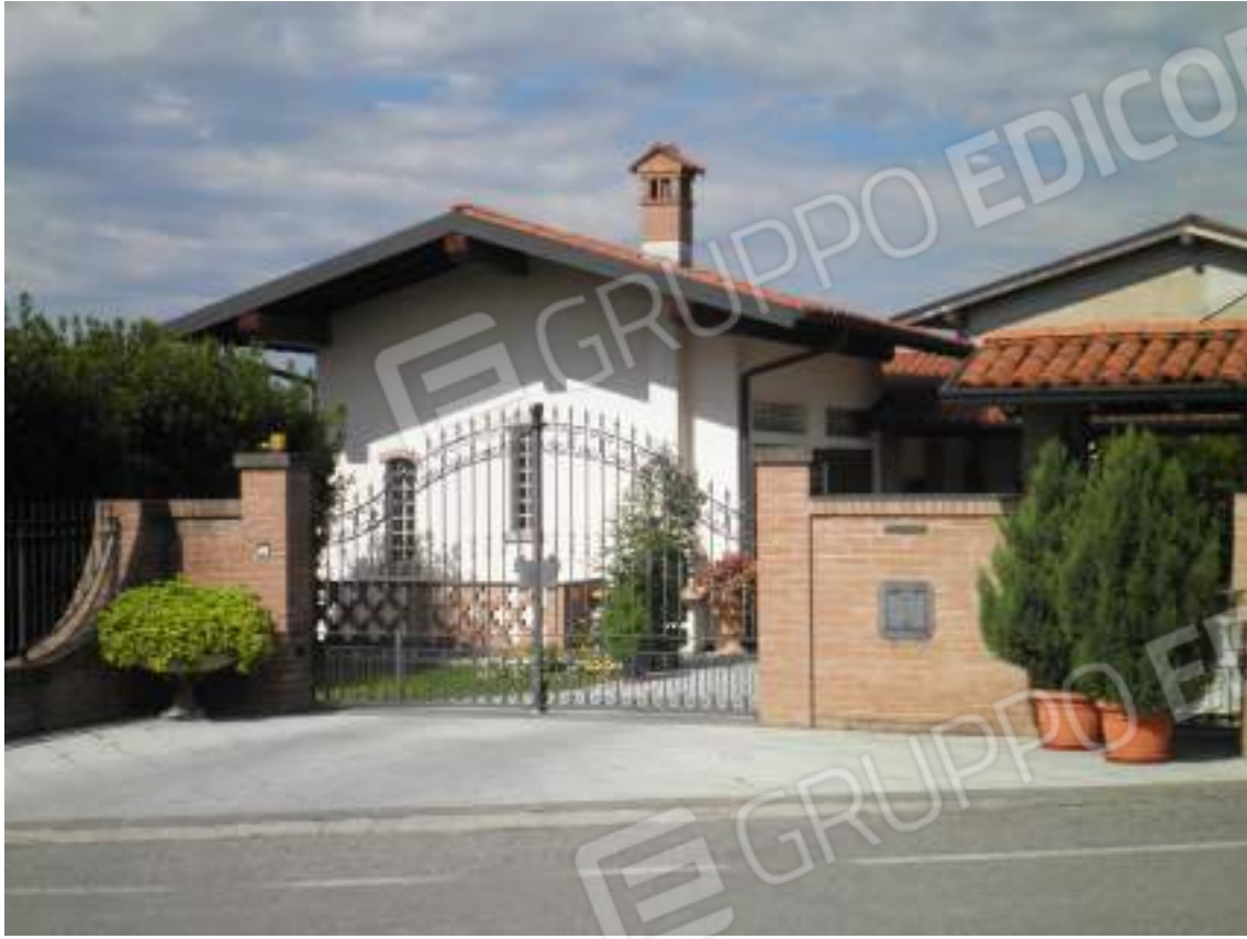
Lato ovest - dettaglio residenza 03 autorimesse e accessori