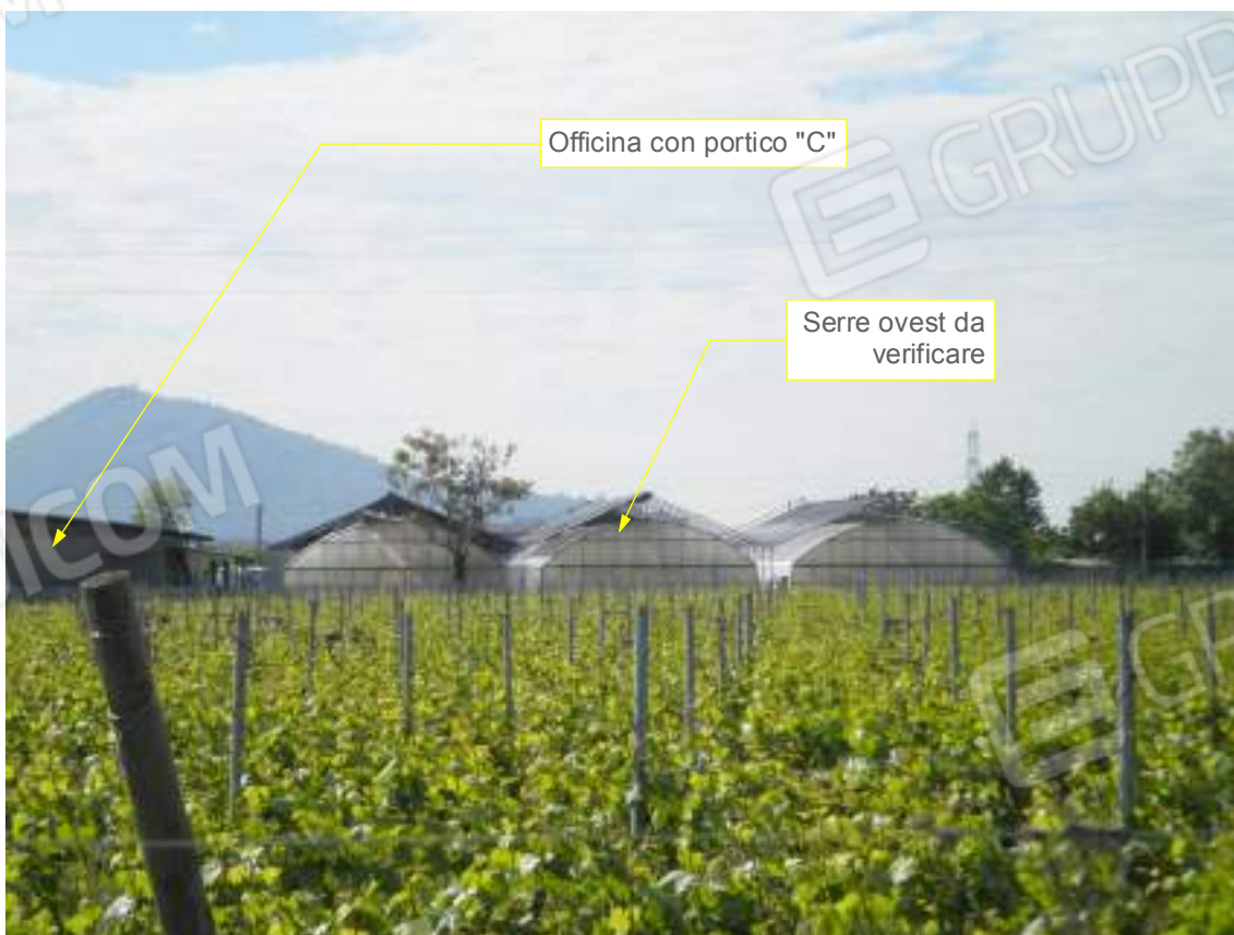
Lato ovest 02