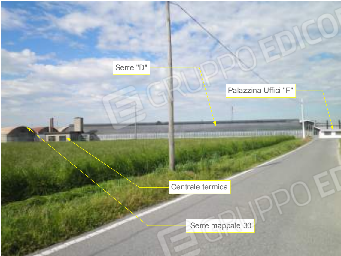
Lato est su via Pozze 03