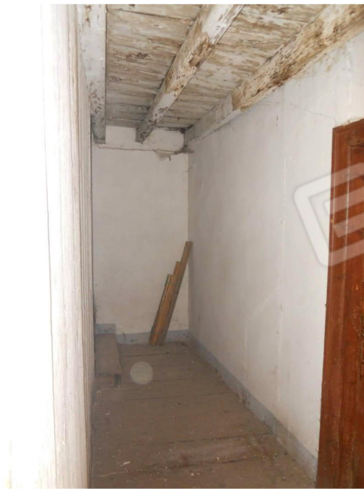
5 – Disimpegno al primo piano