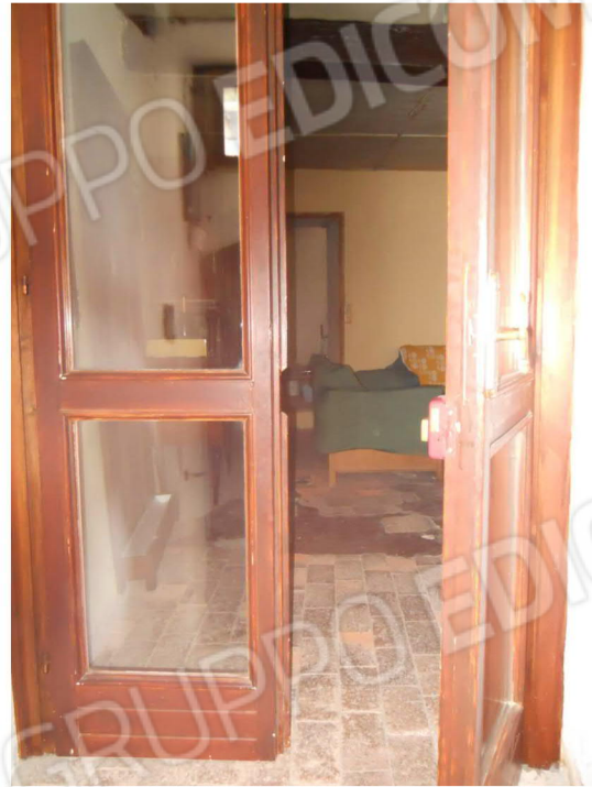
2 - Ingresso all'appartamento