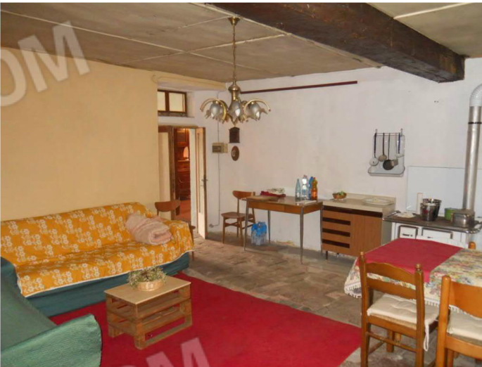
3 - Cucina/soggiorno