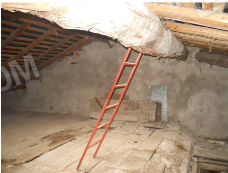
7 – Sottotetto