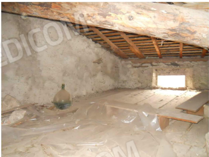
8 – Sottotetto