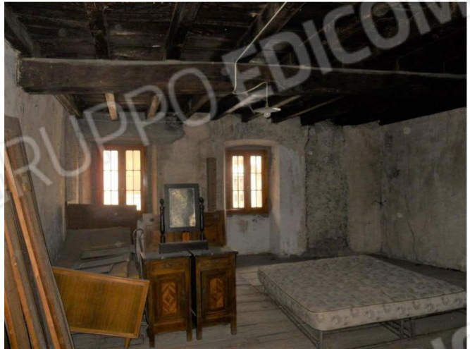
6 – Camera da letto