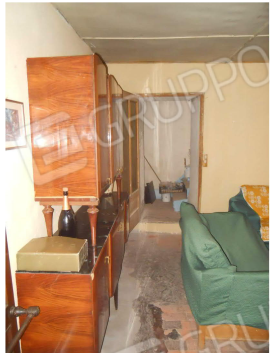
4 - Ingresso alla scala verso il piano superiore