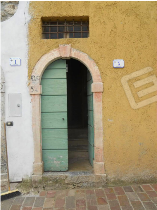
1 - Ingresso da Via delle Galline