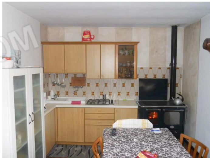
3 - Cucina/soggiorno