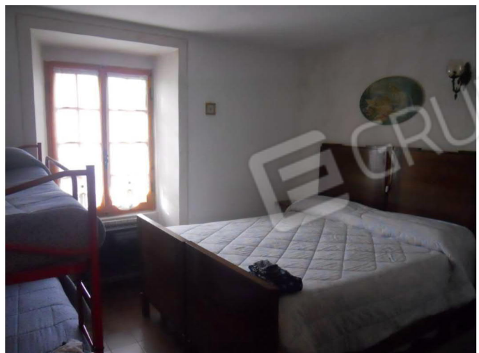
4 – Camera da letto