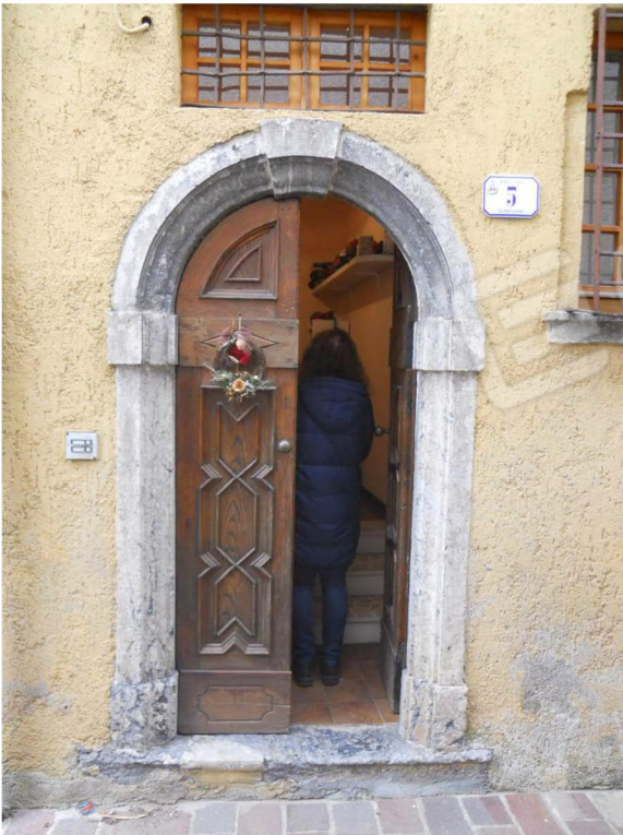
1 – Ingresso da Via delle Galline