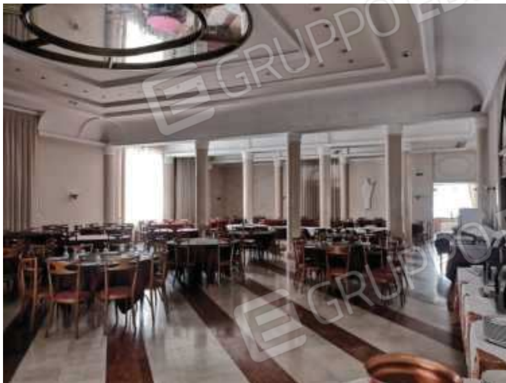
FOTOGRAFIA N.6 Vista sala da pranzo piano terra