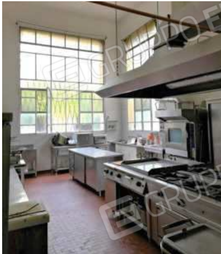
FOTOGRAFIA N.8 Vista cucine piano terra