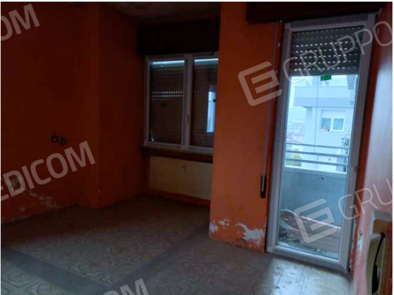
INTERNO vano principale