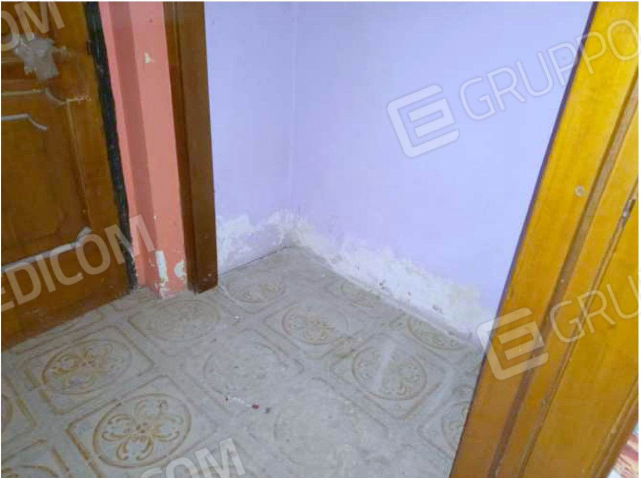
INTERNO atrio ingresso