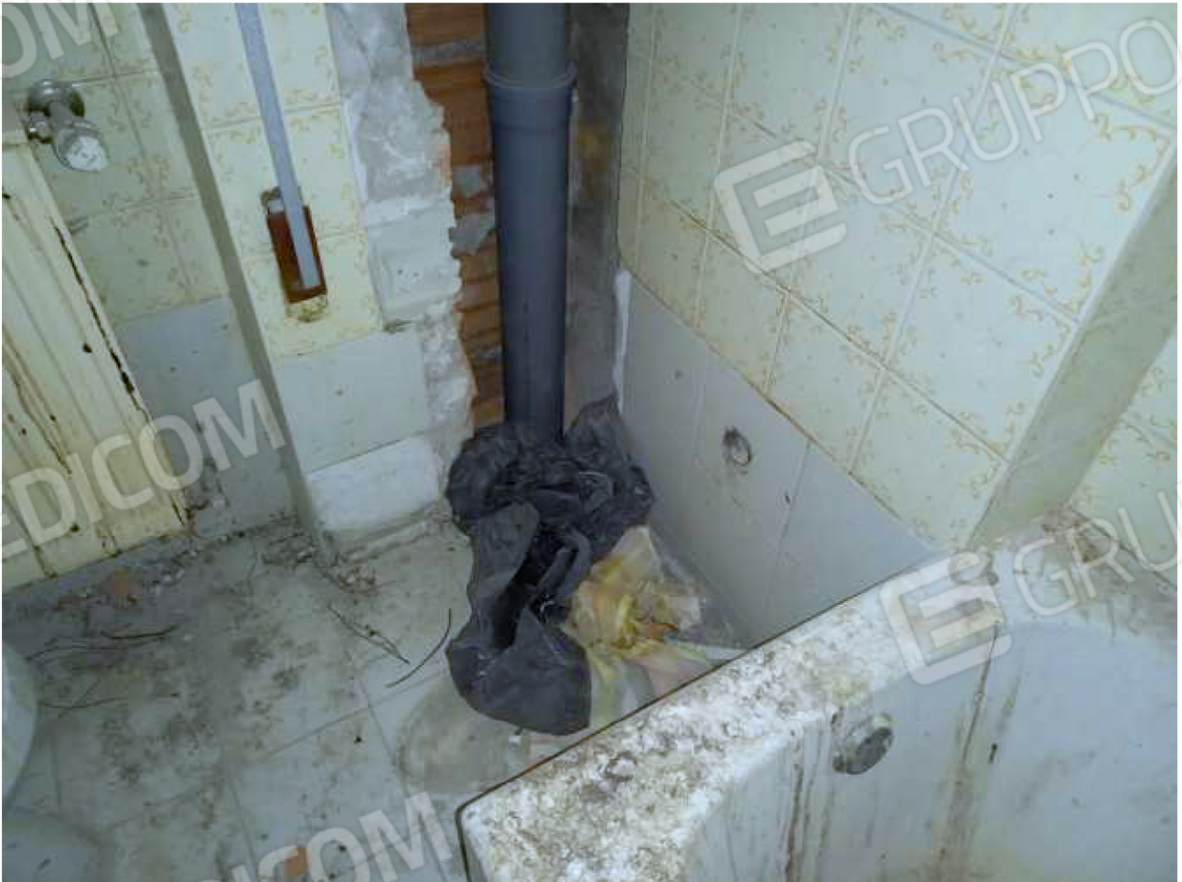
PARTICOLARE stato bagno