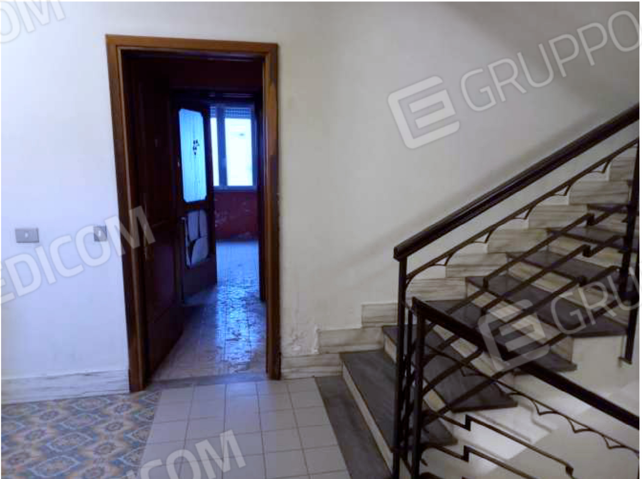
VANO SCALA COMUNE – piano terzo