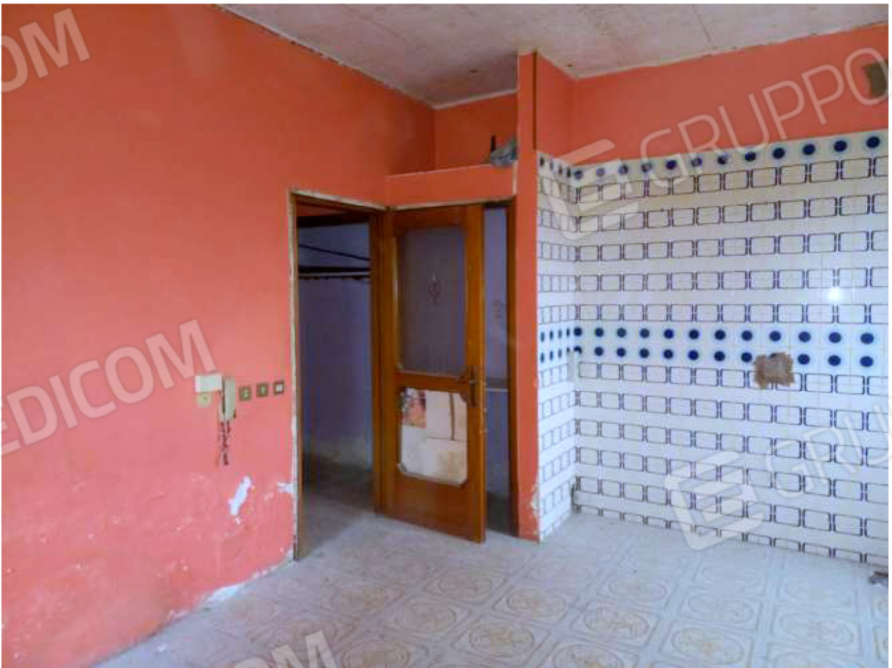
INTERNO vano principale