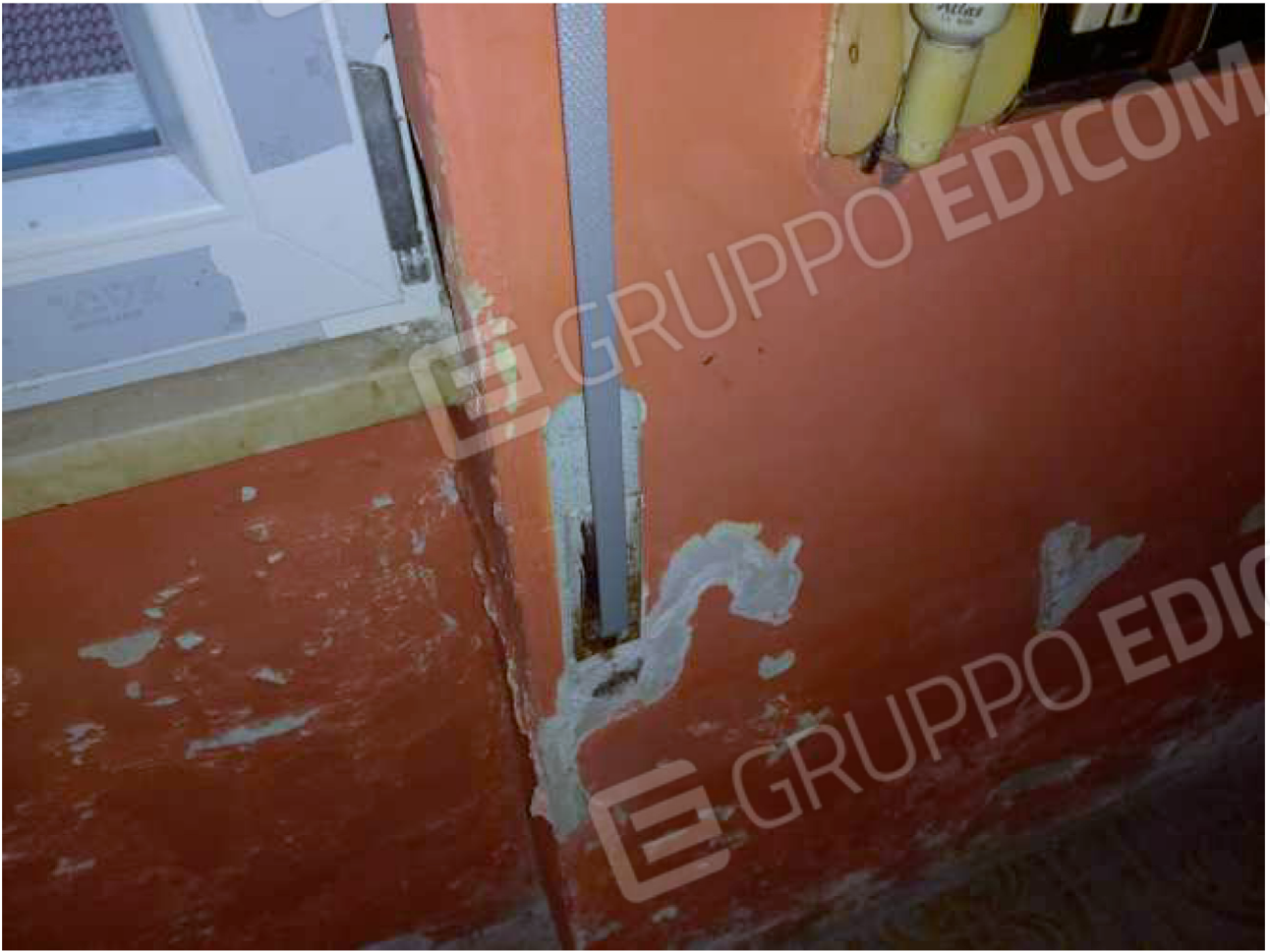
PARTICOLARE muri interni – fascia bassa