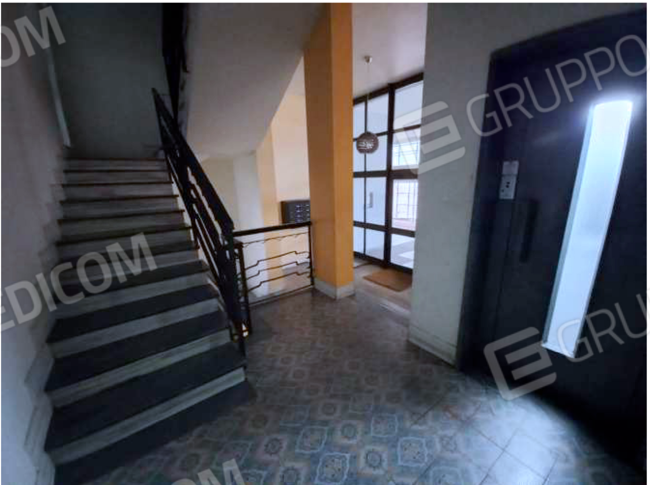
VANO SCALA COMUNE – ingresso p.t.