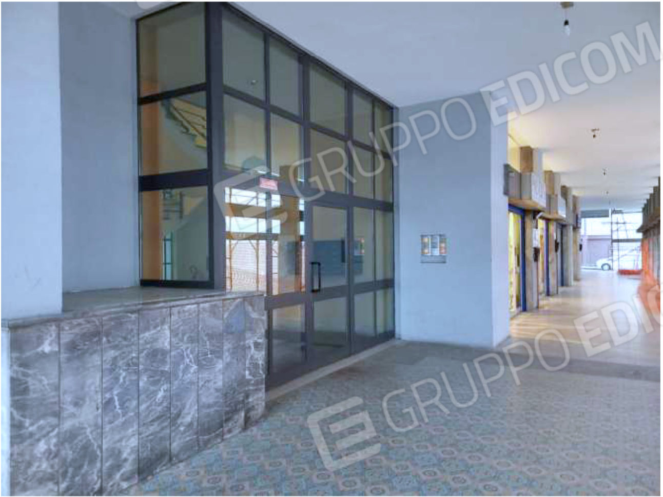
ESTERNO – accesso vano scala A