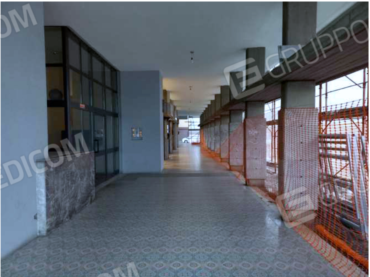
ESTERNO - portico