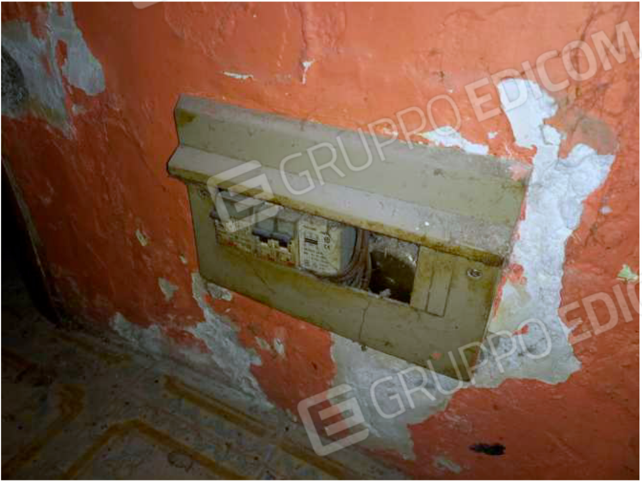
PARTICOLARE impianto elettrico