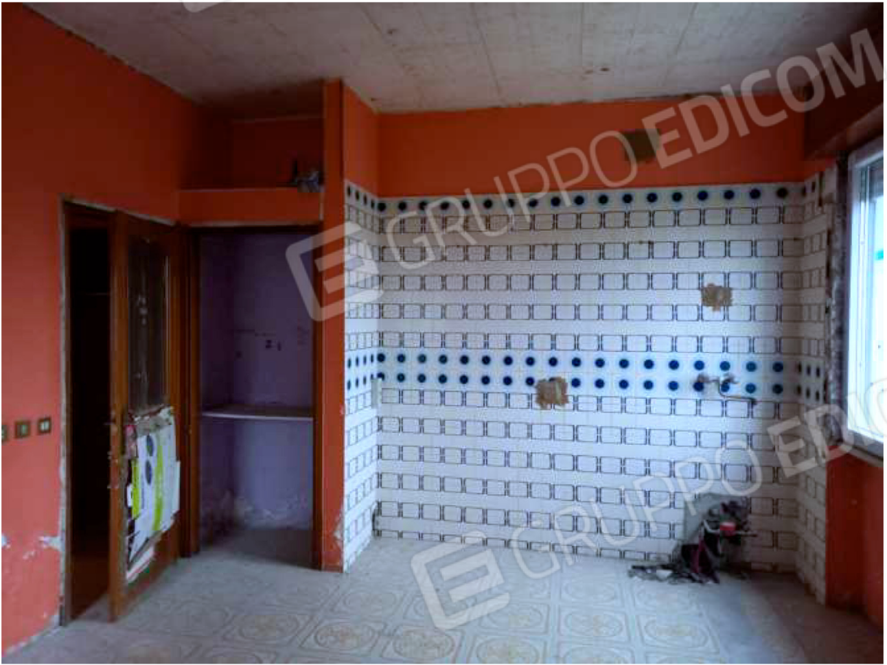
INTERNO vano principale