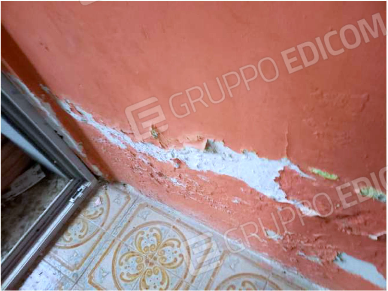
PARTICOLARE muri interni – fascia bassa