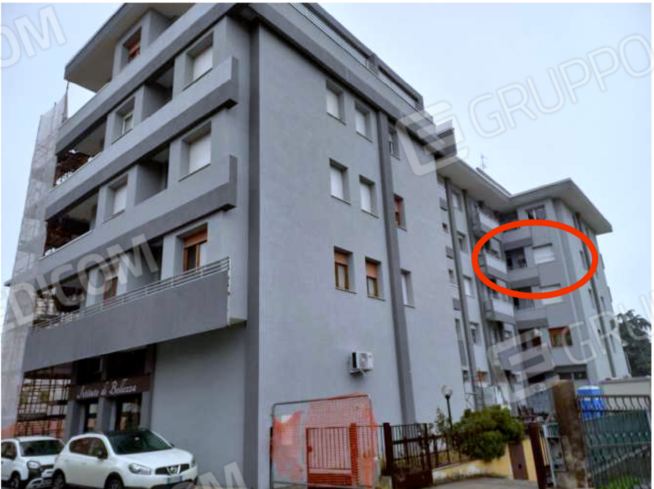
ESTERNO – indicazione u.i. oggetto di stima