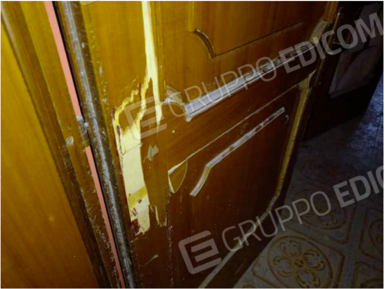
PARTICOLARE porta ingresso