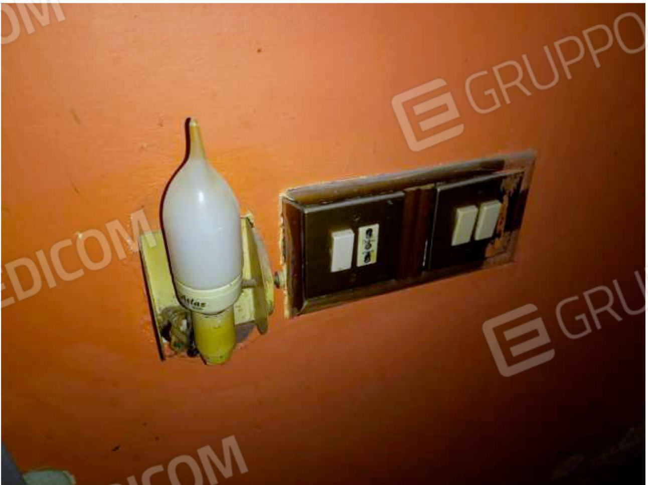
PARTICOLARE impianto elettrico