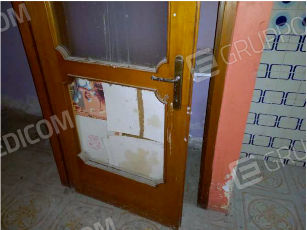
PARTICOLARE porte interne