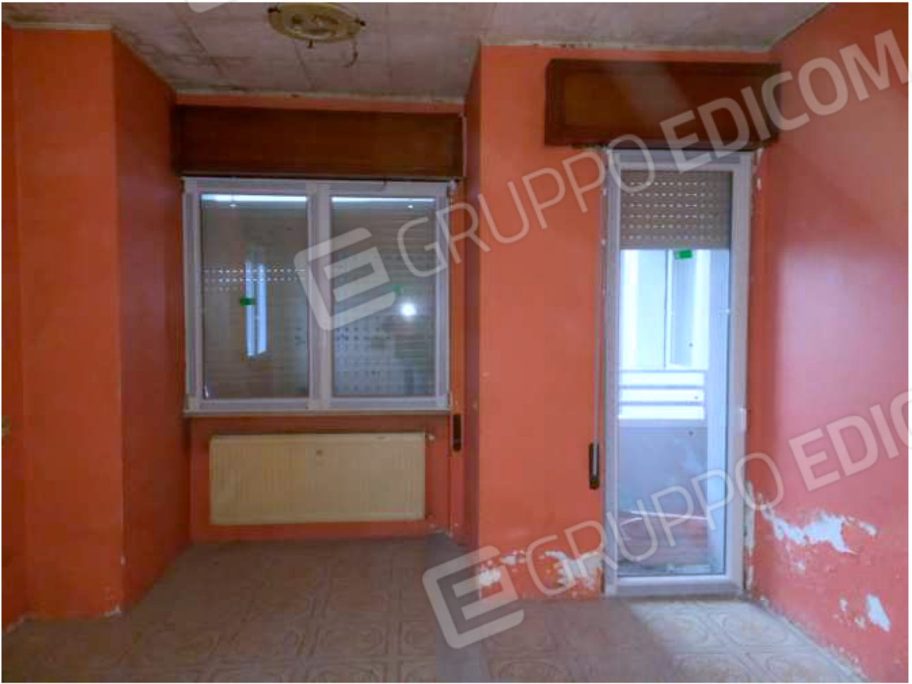
INTERNO vano principale