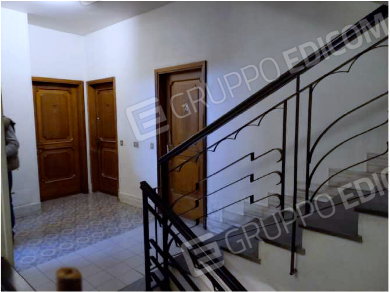
VANO SCALA COMUNE – piano terzo