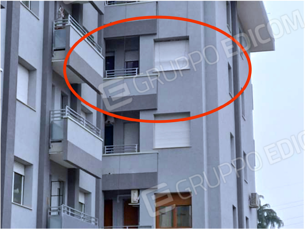
ESTERNO – indicazione u.i. oggetto di stima