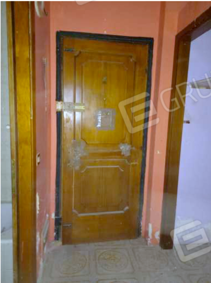
INTERNO atrio ingresso