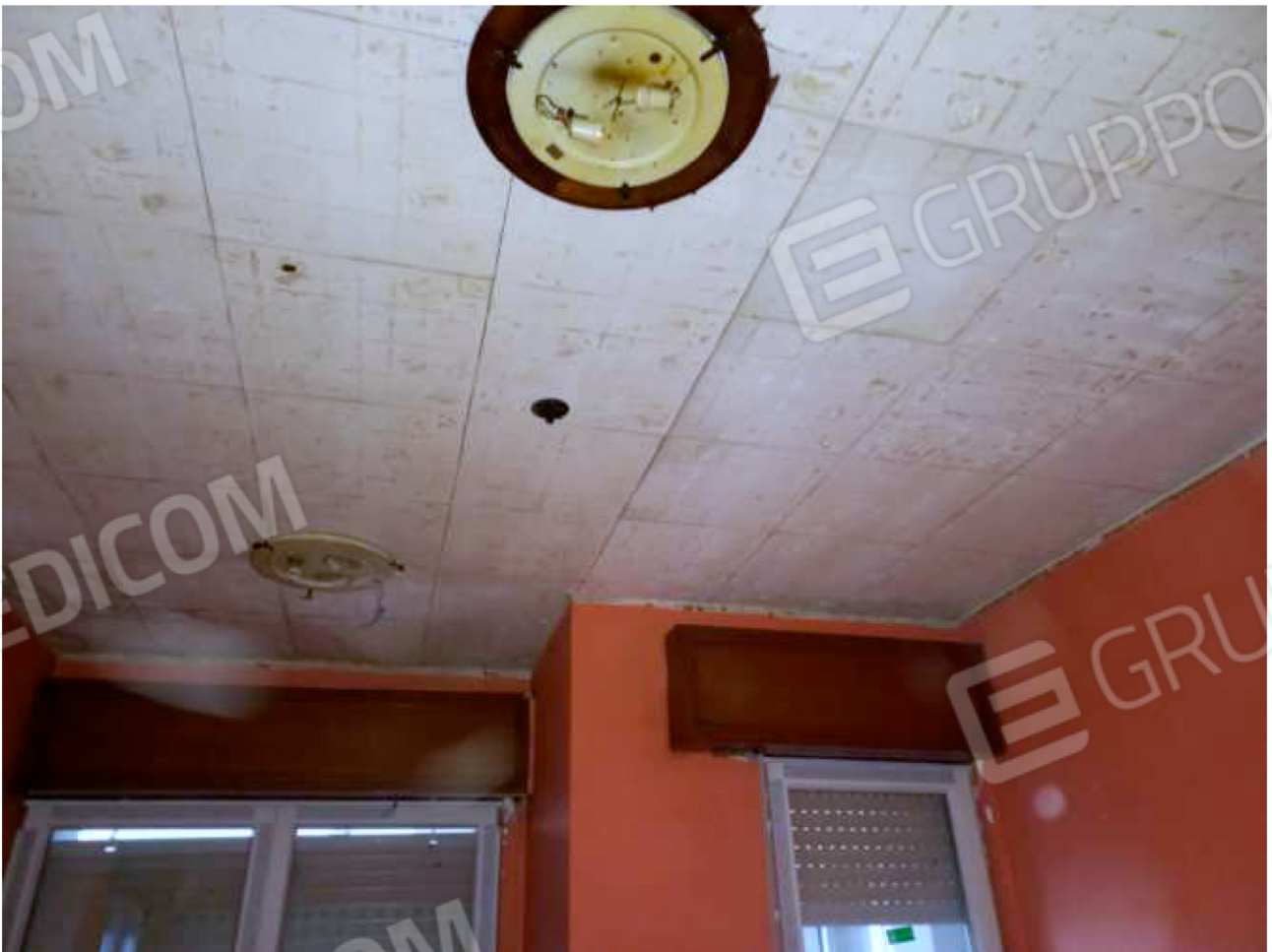
INTERNO vano principale - soffitto