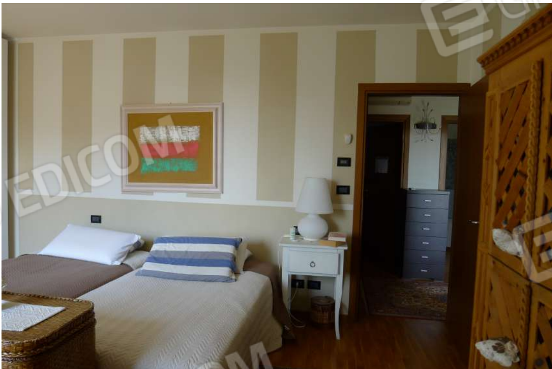
19. Archivio: LaCei n. L1060210