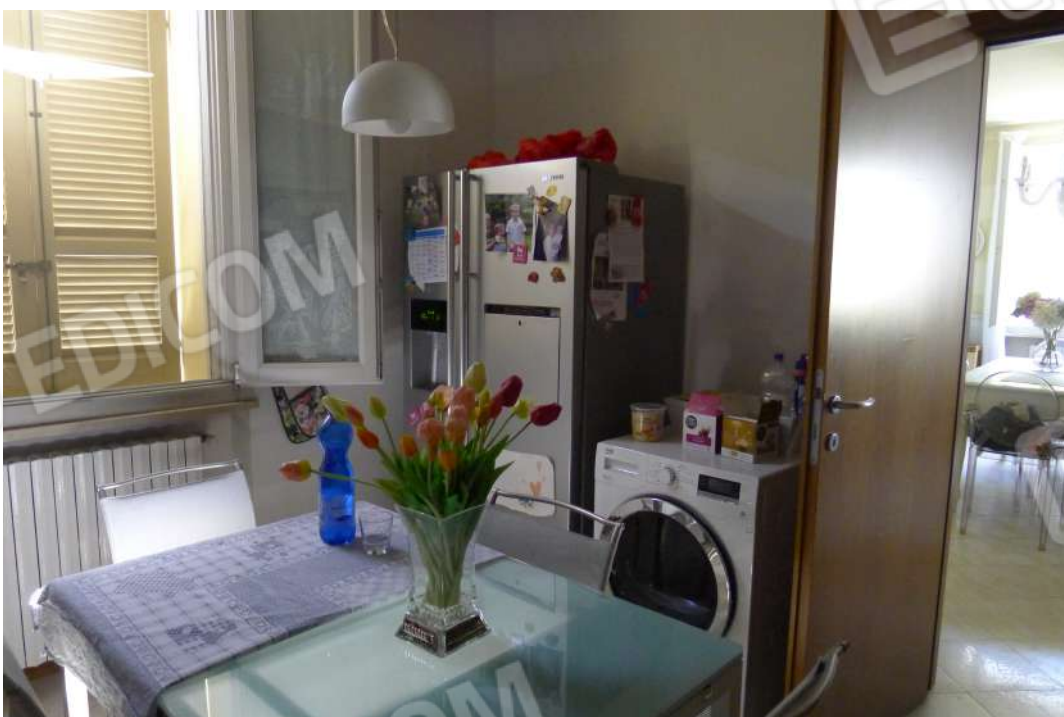
8. n. L1060232