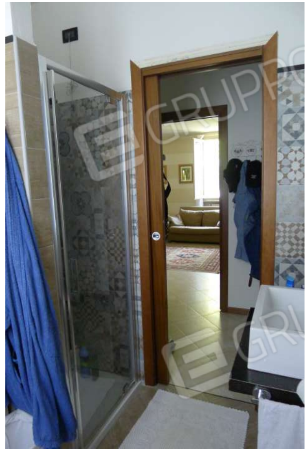
12.  n. L1060230