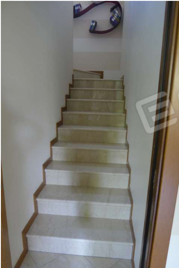
9. Archivio: LaCei n. L1060234