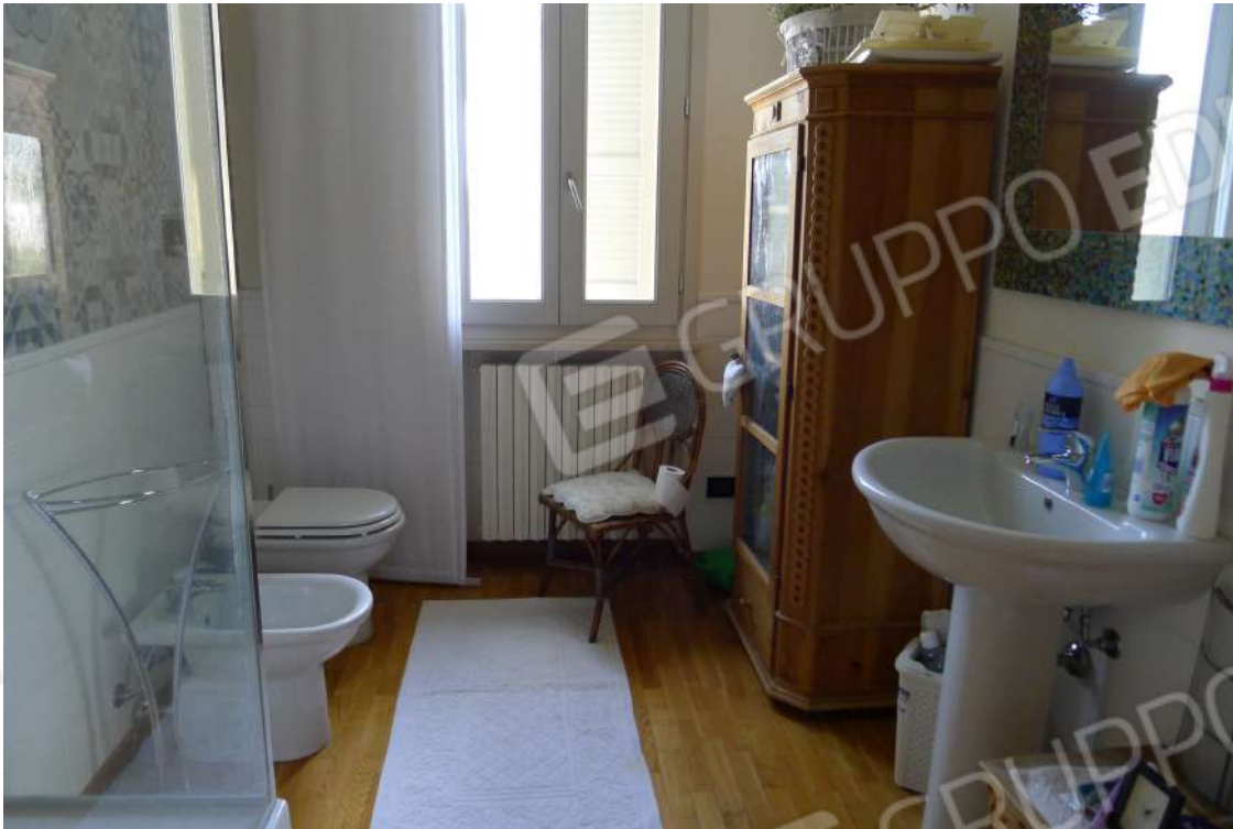
20. Archivio: LaCei n. L1060208