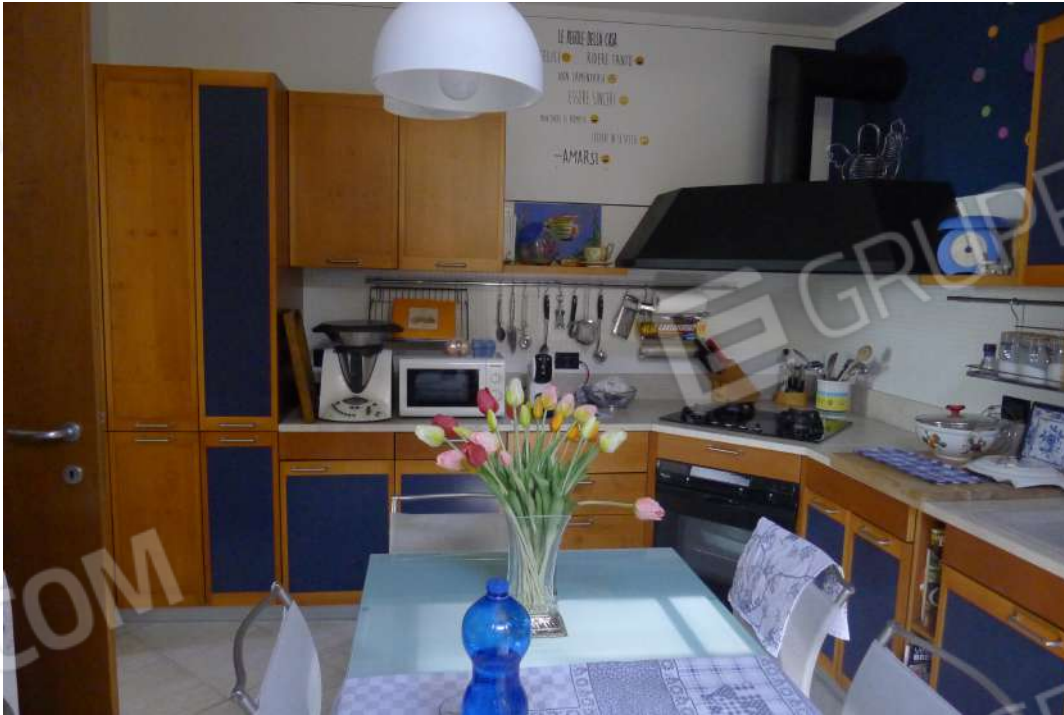
7. Archivio: LaCei n. L1060233