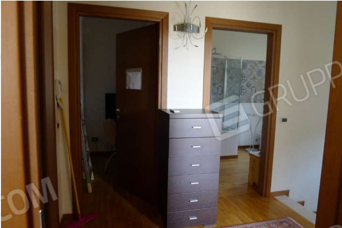
18. Archivio: LaCei n. L1060211