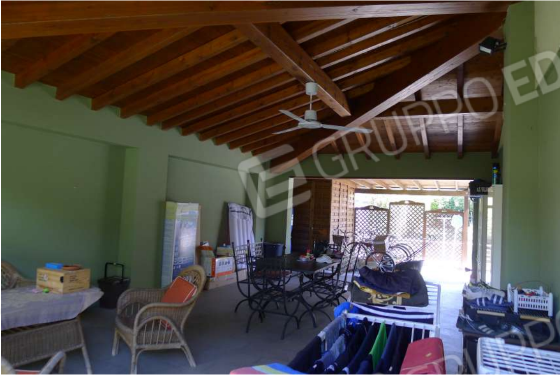
16. Archivio: LaCei n. L1060217