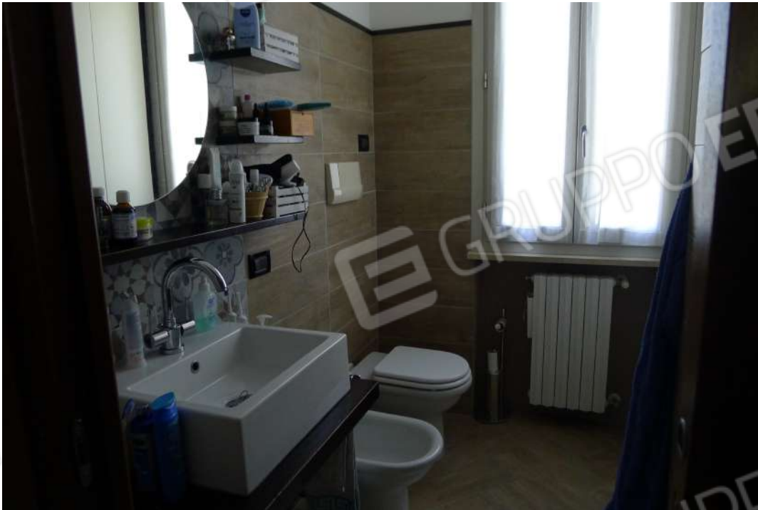
13. Archivio: LaCei n. L1060231