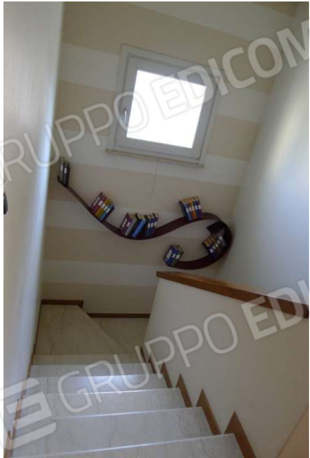
10. Archivio: LaCei n. L1060209