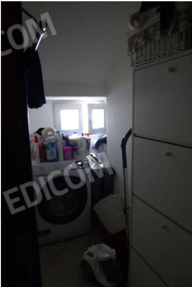
11. Archivio: LaCei n. L1060229