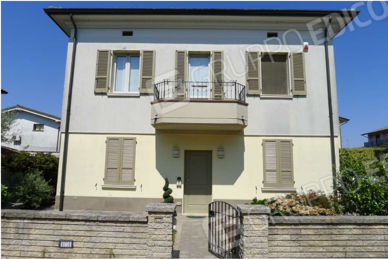
1. n. L1060235