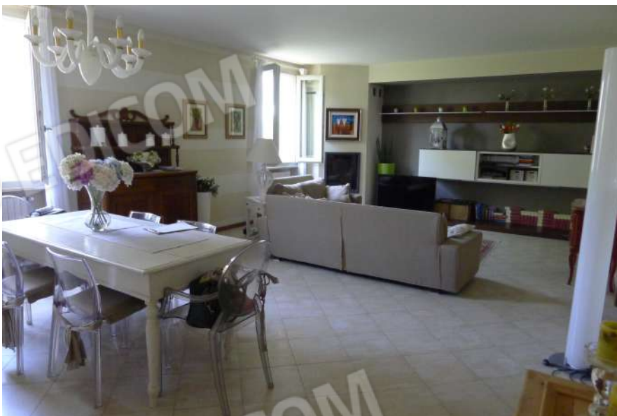
15. Archivio: LaCei n. L1060227