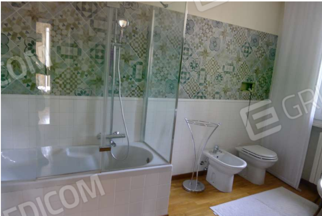
21. Archivio: LaCei n. L1060207