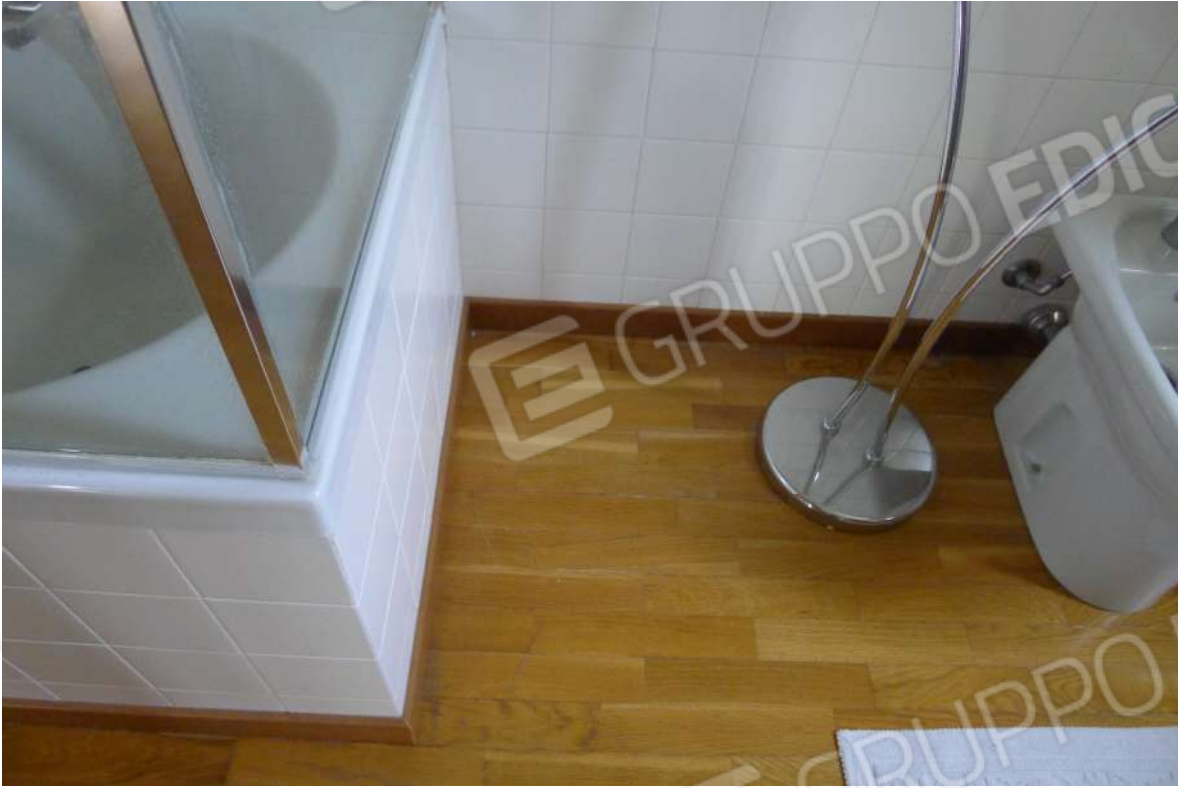
22.  n. L1060206