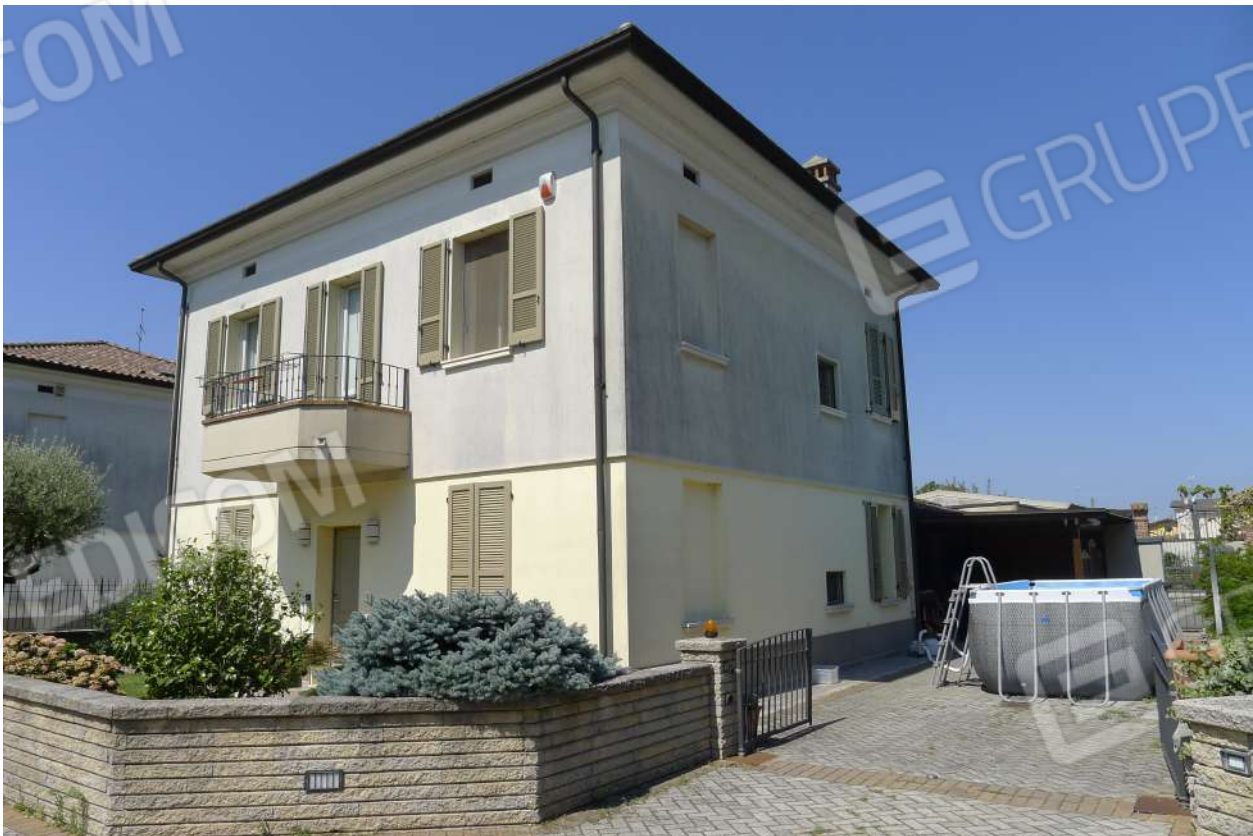
2.  n. L1060222