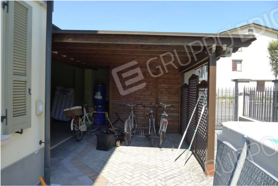
3. Archivio: LaCei n. L1060215