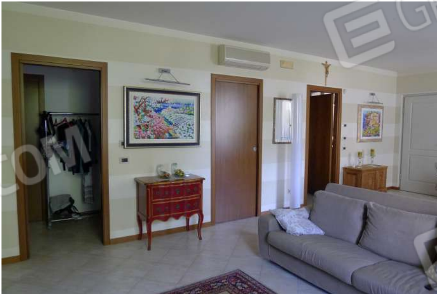
14. Archivio: LaCei n. L1060228