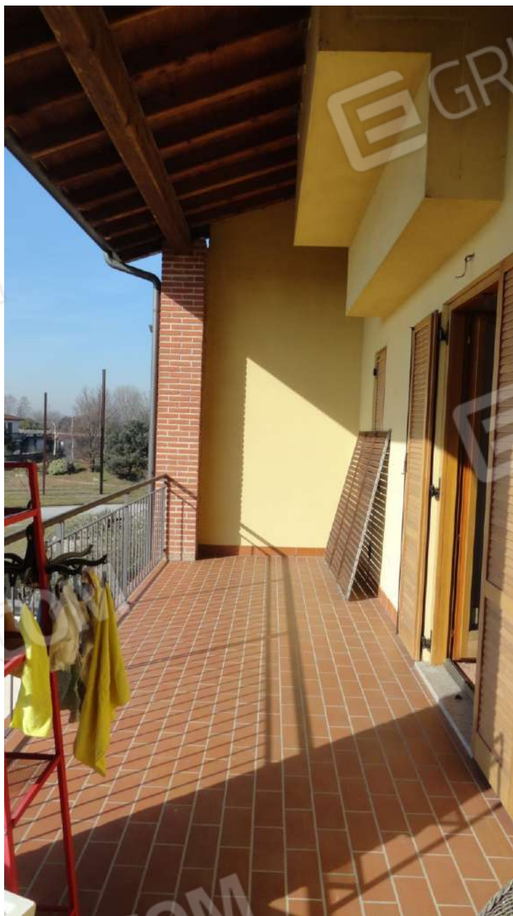
FOTOGRAFIA - N. 53 - LOGGIA /BALCONE AL PIANO PRIMO