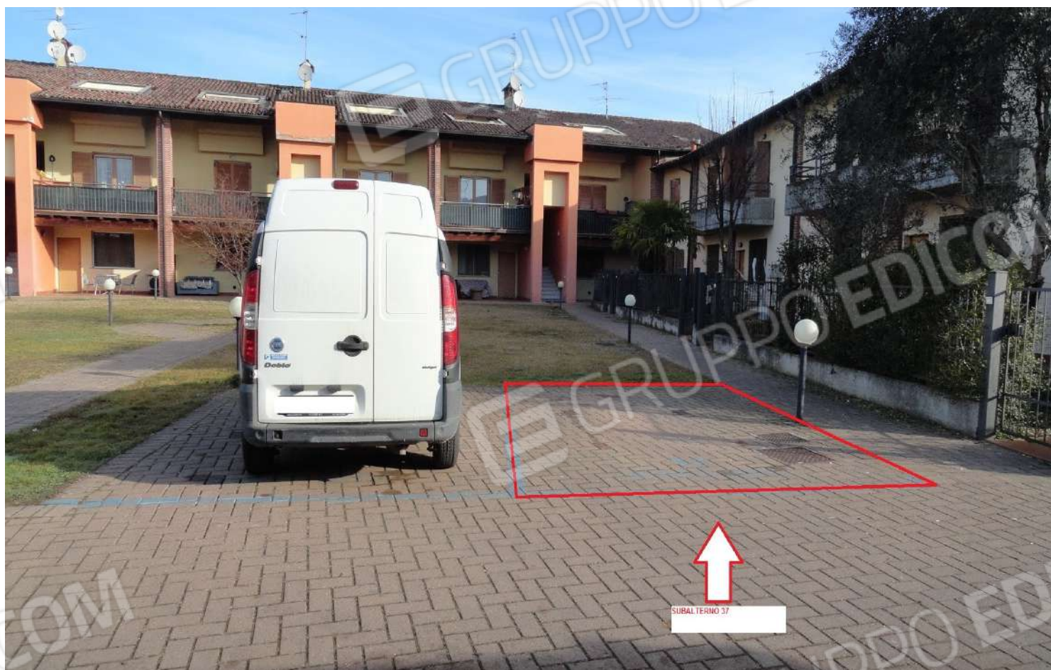
FOTOGRAFIA - N. 35- INDIVIDUAZIONE POSTO AUTO ESTERNO SUBALTERNO N. 37