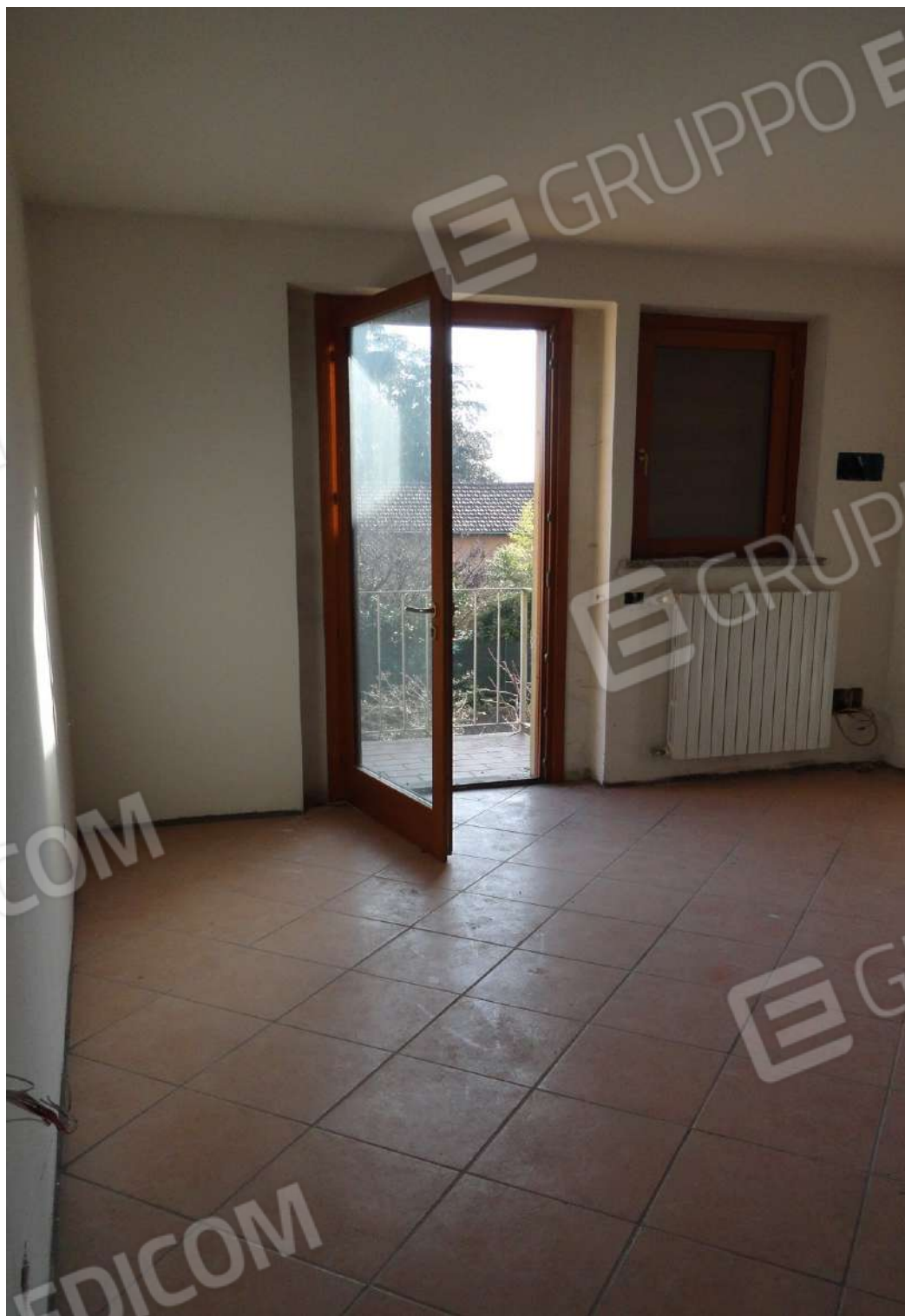
FOTOGRAFIA - N. 16 L'ACCESSO AL PIANO PRIMO