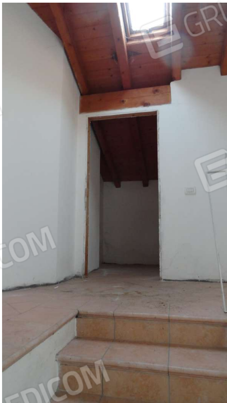
FOTOGRAFIA - N. 58 – ARRIVO AL PIANO SECONDO