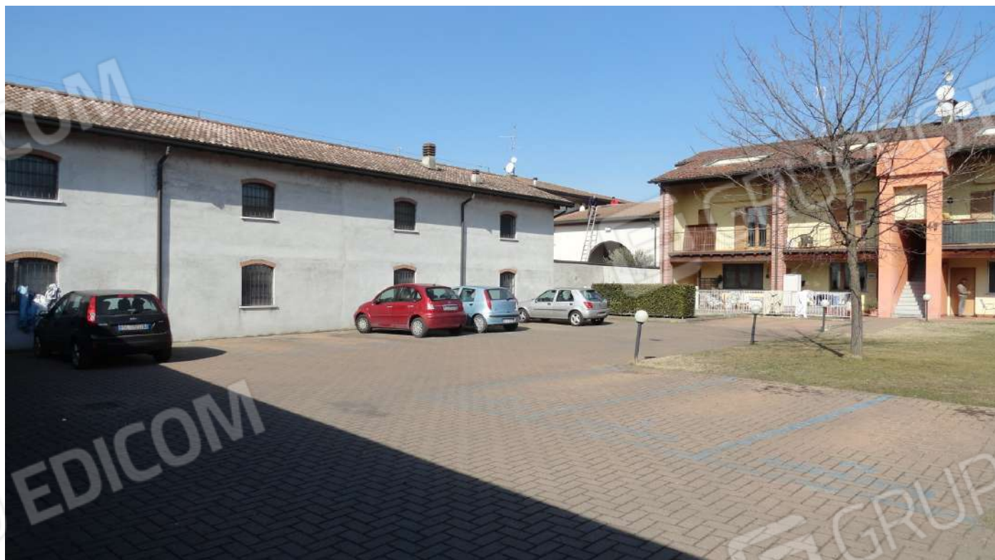
FOTOGRAFIA - N. 9 FACCIATA INTERNA NORD / OVEST COMPLESSO RESIDENZIALE