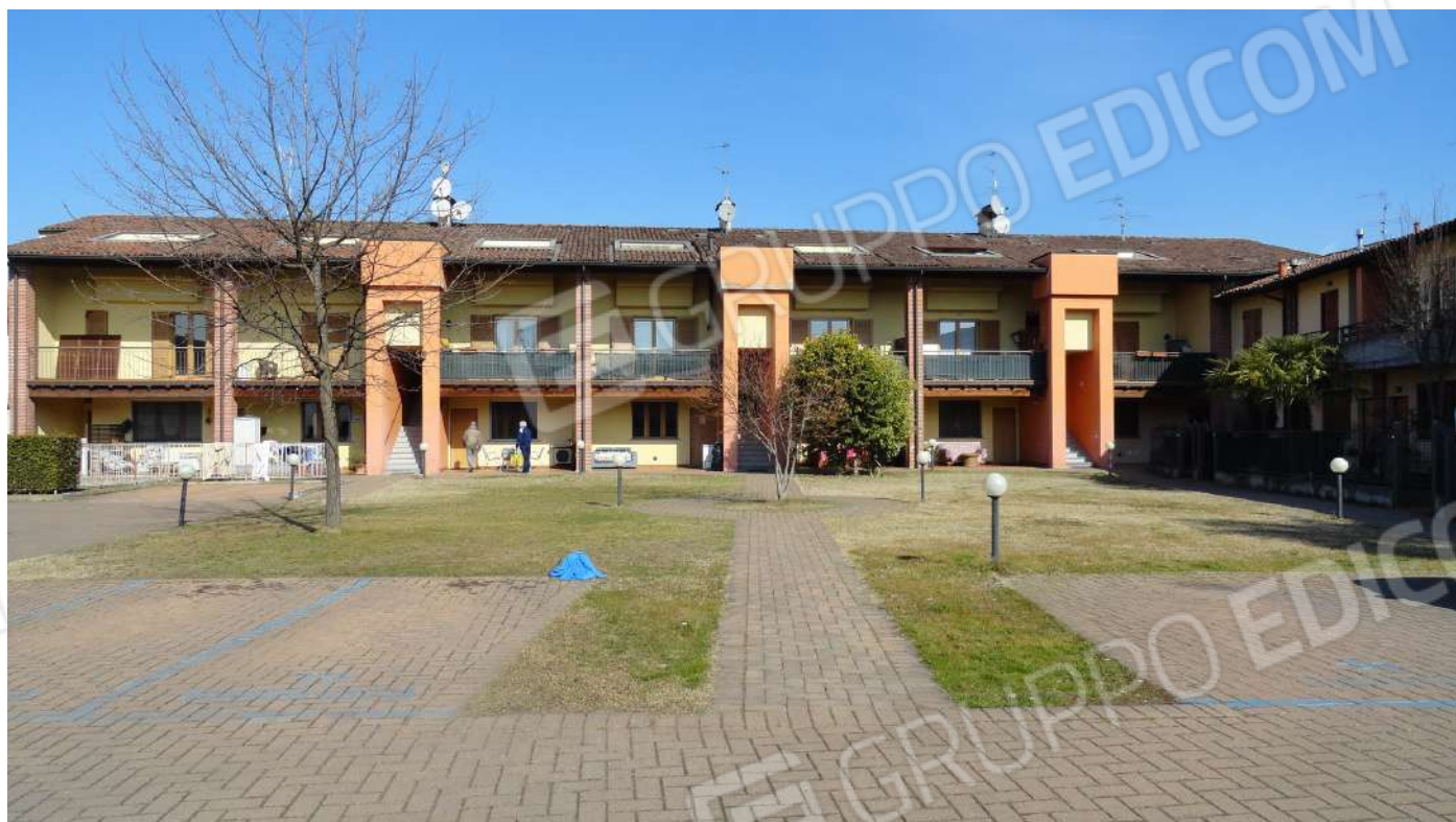
FOTOGRAFIA - N. 8 FACCIATA INTERNA NORD COMPLESSO RESIDENZIALE