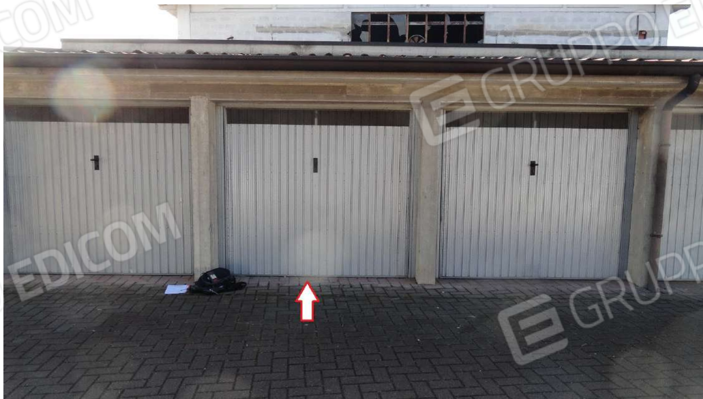
FOTOGRAFIA - N. 40 – AUTORIMESSA IN ESTERNO SUBALTERNO N. 46