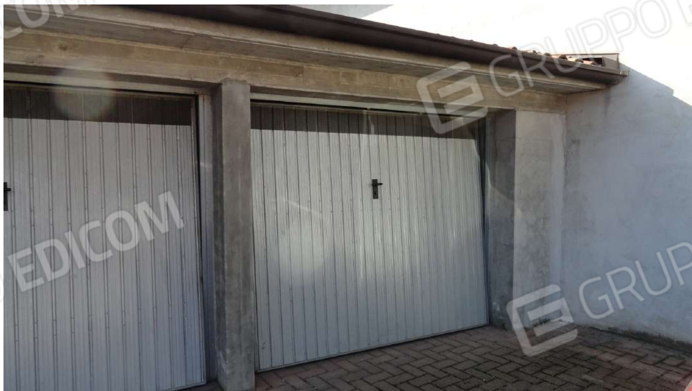
FOTOGRAFIA - N. 37 – AUTORIMESSA IN ESTERNO SUBALTERNO N. 38