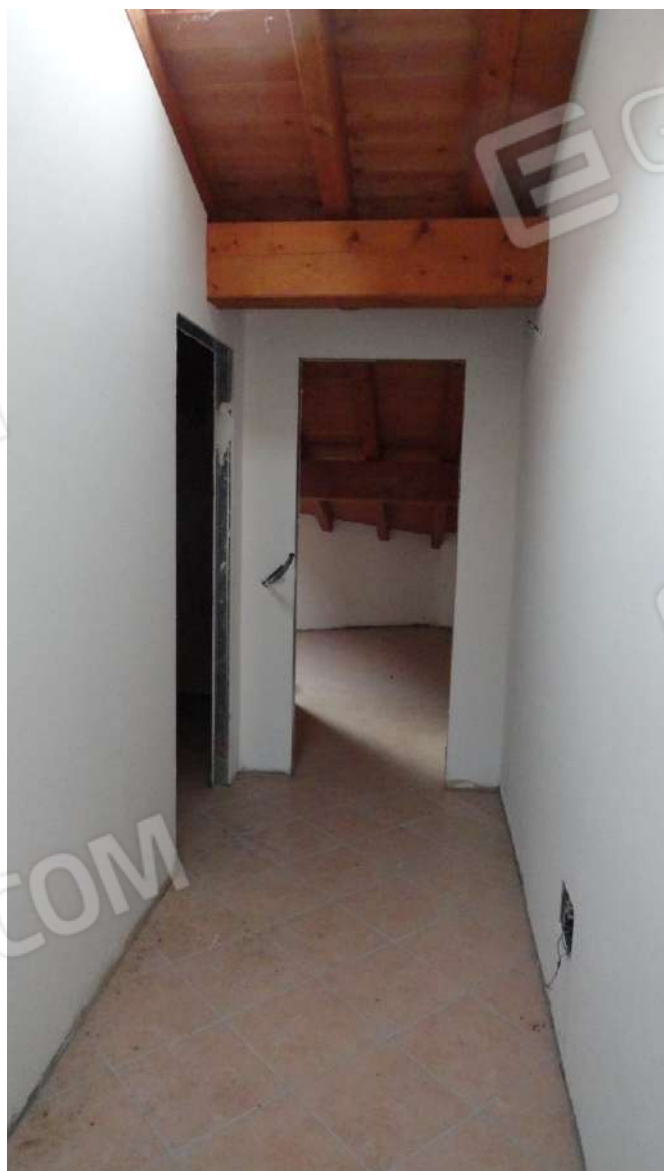
FOTOGRAFIA - N. 27 DISIMPEGNO VERSO SECONDA CAMERA ( SINISTRA) E RIPOSTIGLIO ( DI FRONTE) PIANO SECONDO