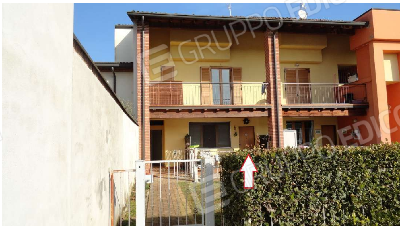
FOTOGRAFIA - N. 44 – L'ACCESSO ALL'UNITA' SUB. N. 69 SOTTO IL PORTICO