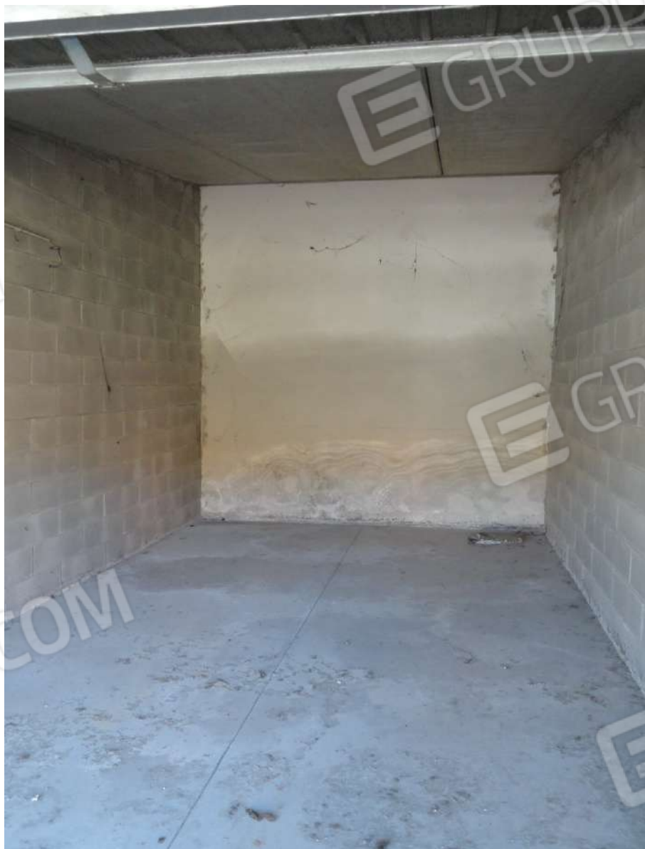
FOTOGRAFIA - N. 41 – AUTORIMESSA INTERNO SUBALTERNO N. 46