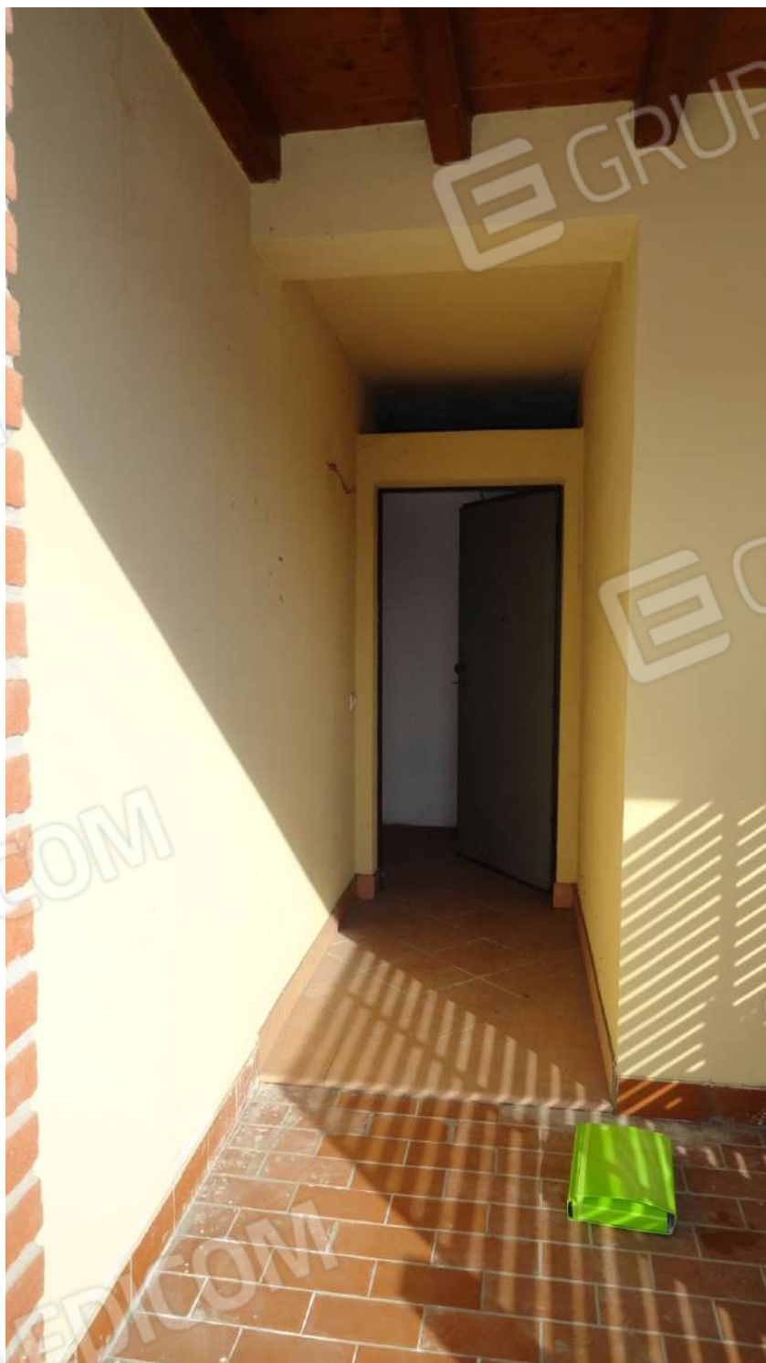
FOTOGRAFIA - N. 50 PARTICOLARE INGRESSO A PIANO TERRA PER SUBALTERNO N.70