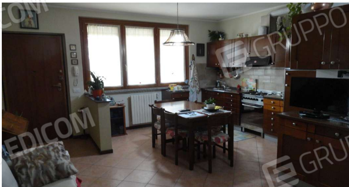
FOTOGRAFIA - N. 46 – IL SOGGIORNO CON L'ANGOLO COTTURA