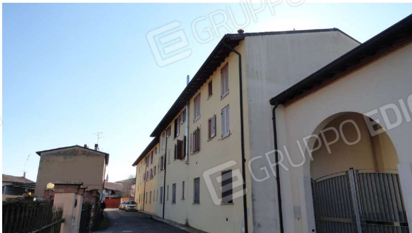
FOTOGRAFIA - N. 11bis FACCIATA ESTERNA NORD COMPLESSO RESIDENZIALE