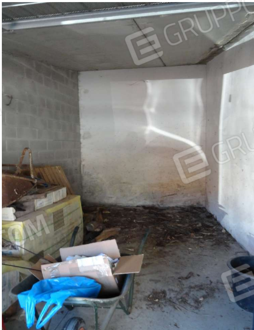
FOTOGRAFIA - N. 38 – INTERNO AUTORIMESSA SUBALTERNO N. 38