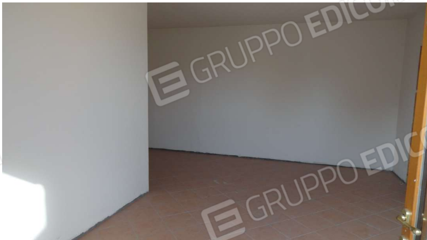
FOTOGRAFIA - N. 17 SOGGIORNO PIANO PRIMO