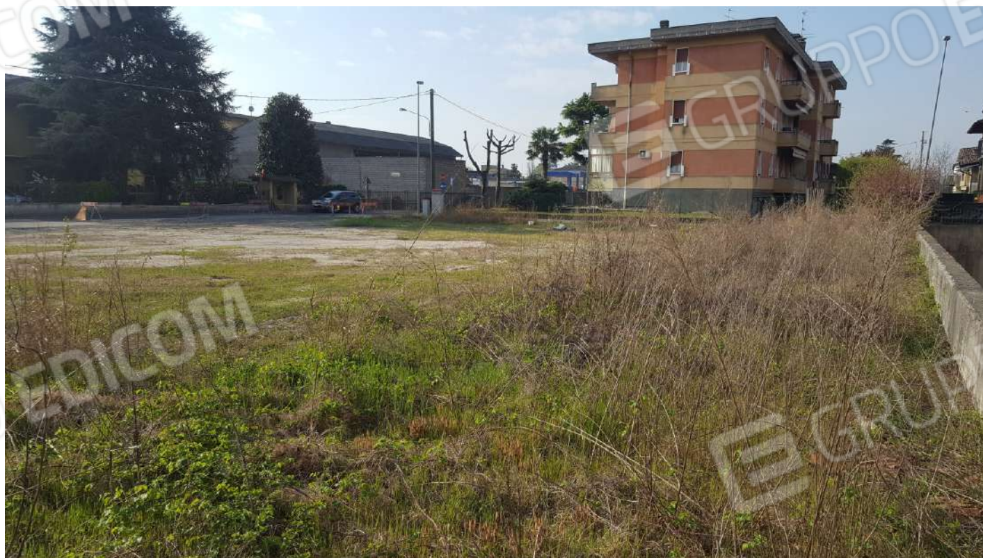
FOTOGRAFIA - N. 70 – AREA DI TERRENO IN DELLO dall'angolo nord-ovest