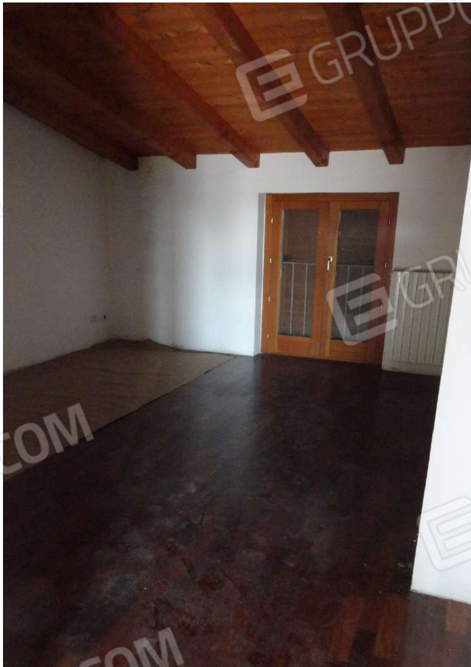
FOTOGRAFIA - N. 64 - CAMERA