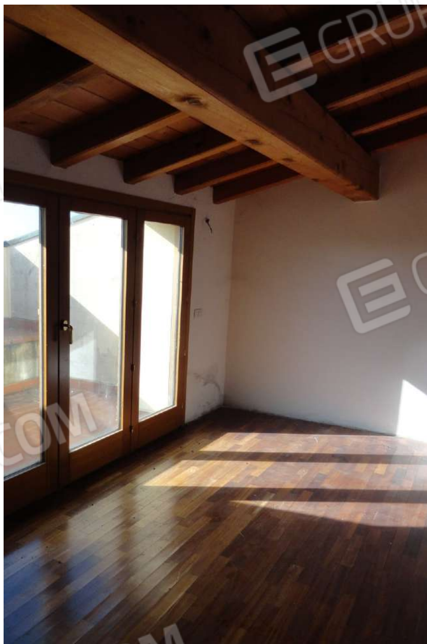
FOTOGRAFIA - N. 62 – CAMERA CON USCITA NELLA TERRAZZA A TETTO