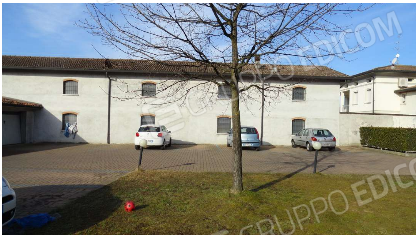
FOTOGRAFIA - N. 10 FACCIATA INTERNA OVEST COMPLESSO RESIDENZIALE