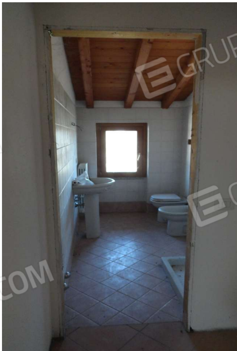
FOTOGRAFIA - N. 63 – SERVIZIO IGIENICO