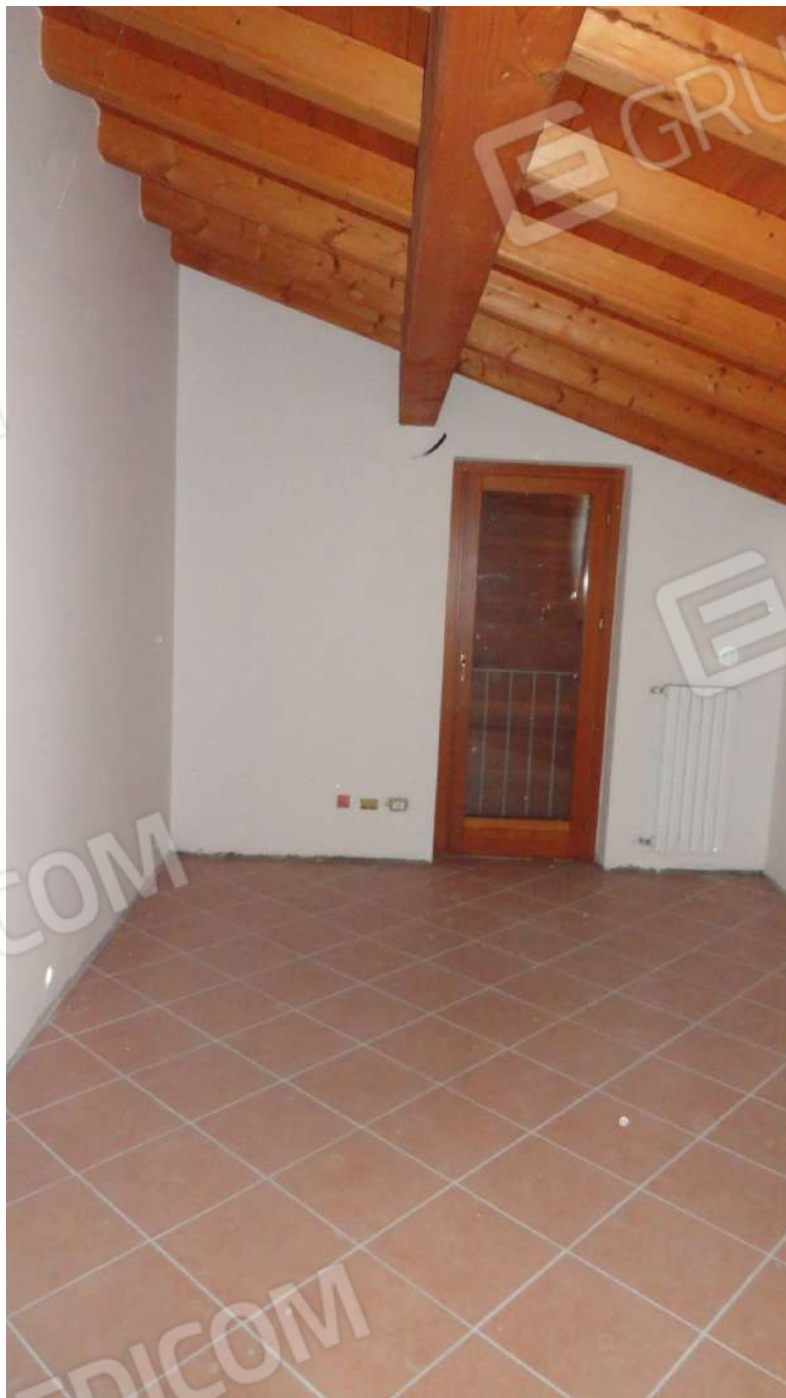
FOTOGRAFIA - N. 28 CAMERA PIANO SECONDO