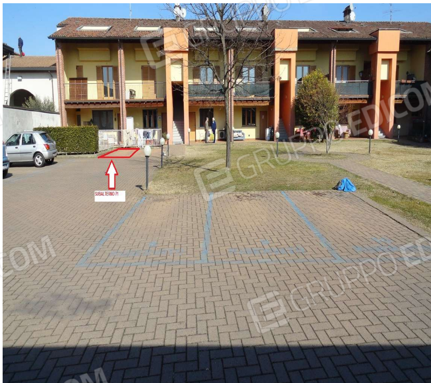
FOTOGRAFIA - N. 67 – INDIVIDUAZIONE POSTO AUTO ESTERNO SUBALTERNO N.71