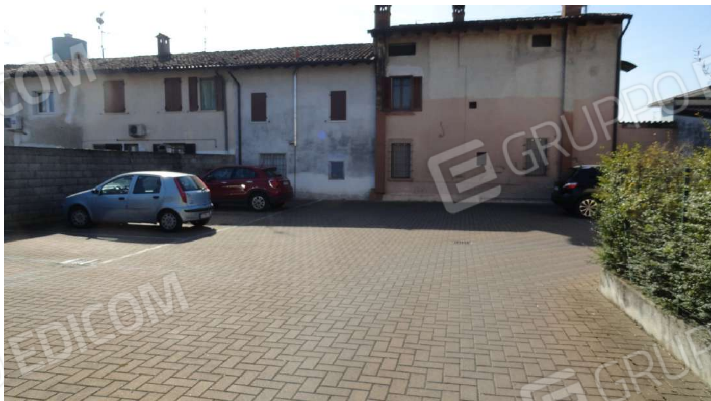
FOTOGRAFIA - N. 3 L'ACCESSO CARRAIO E PEDONALE AL COMPLESSO RESIDENZIALE