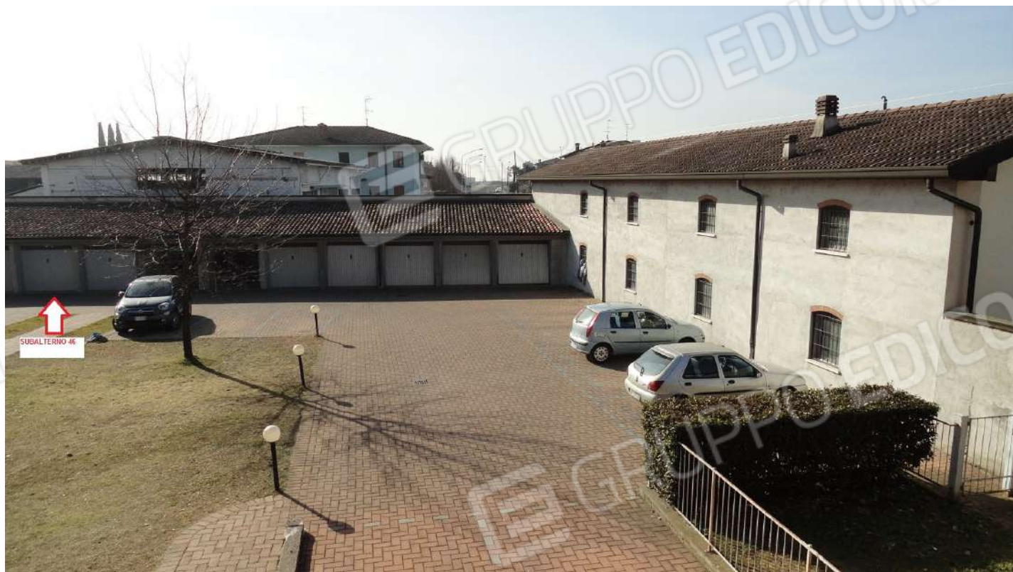
FOTOGRAFIA - N. 39 – L'UBICAZIONE DELL'AUTORIMESSA SUBALTERNO N. 46 ALL'INTERNO DELLA CORTE