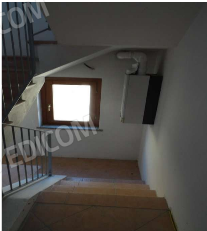
FOTOGRAFIA - N. 23 SCALA INTERNA/ SOTTOSCALA PIANO PRIMO