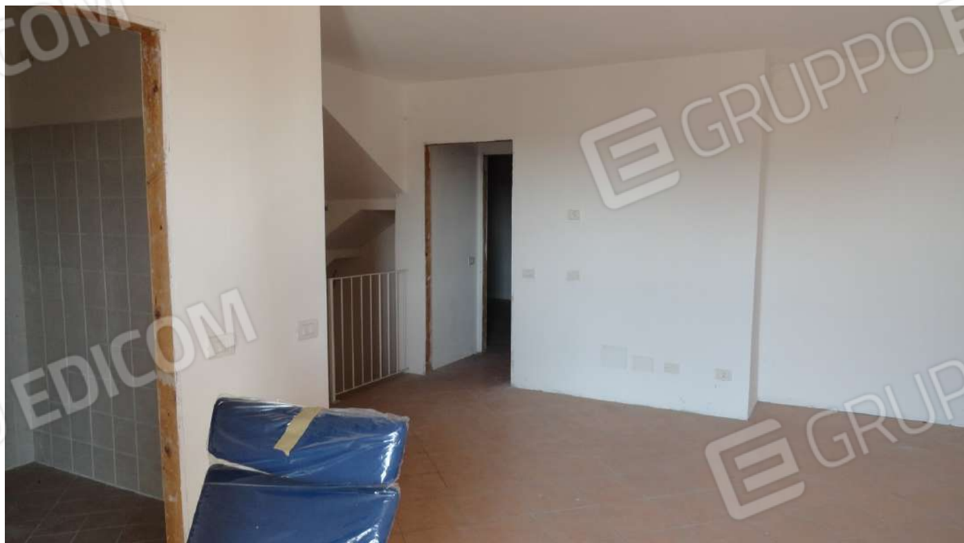
FOTOGRAFIA - N. 52 SOGGIORNO E SULLA SINISTRA INGRESSO LOCALE COTTURA