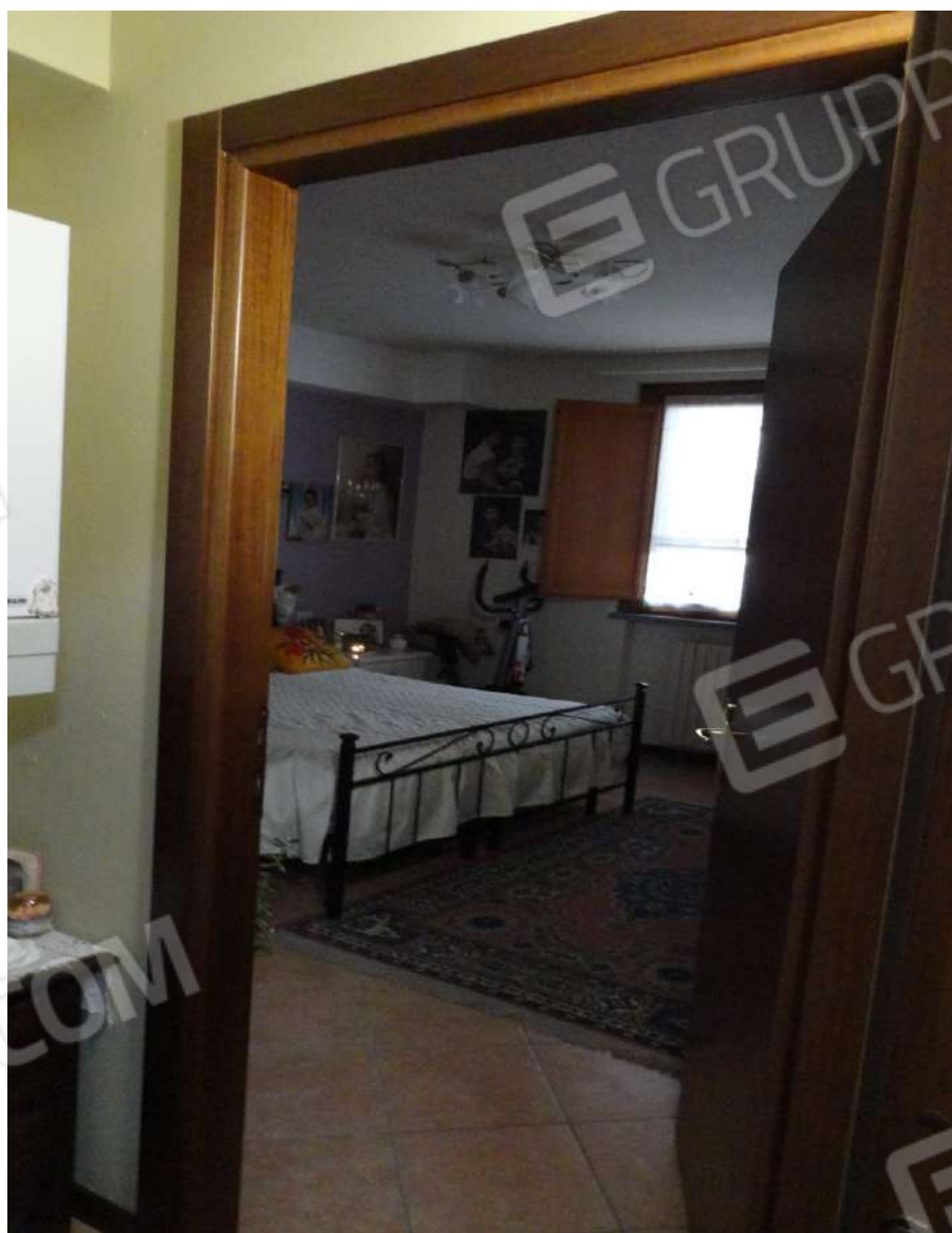
FOTOGRAFIA - N. 47 – CAMERA DA LETTO