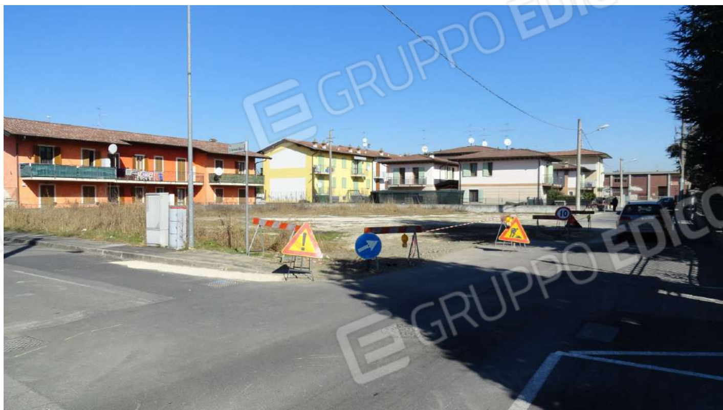
FOTOGRAFIA - N. 69 – AREA DI TERRENO IN DELLO dall'angolo sud-est