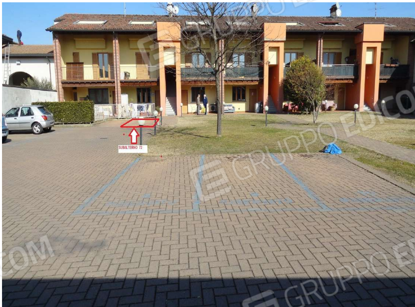
FOTOGRAFIA - N. 68 – INDIVIDUAZIONE POSTO AUTO ESTERNO SUBALTERNO N. 72