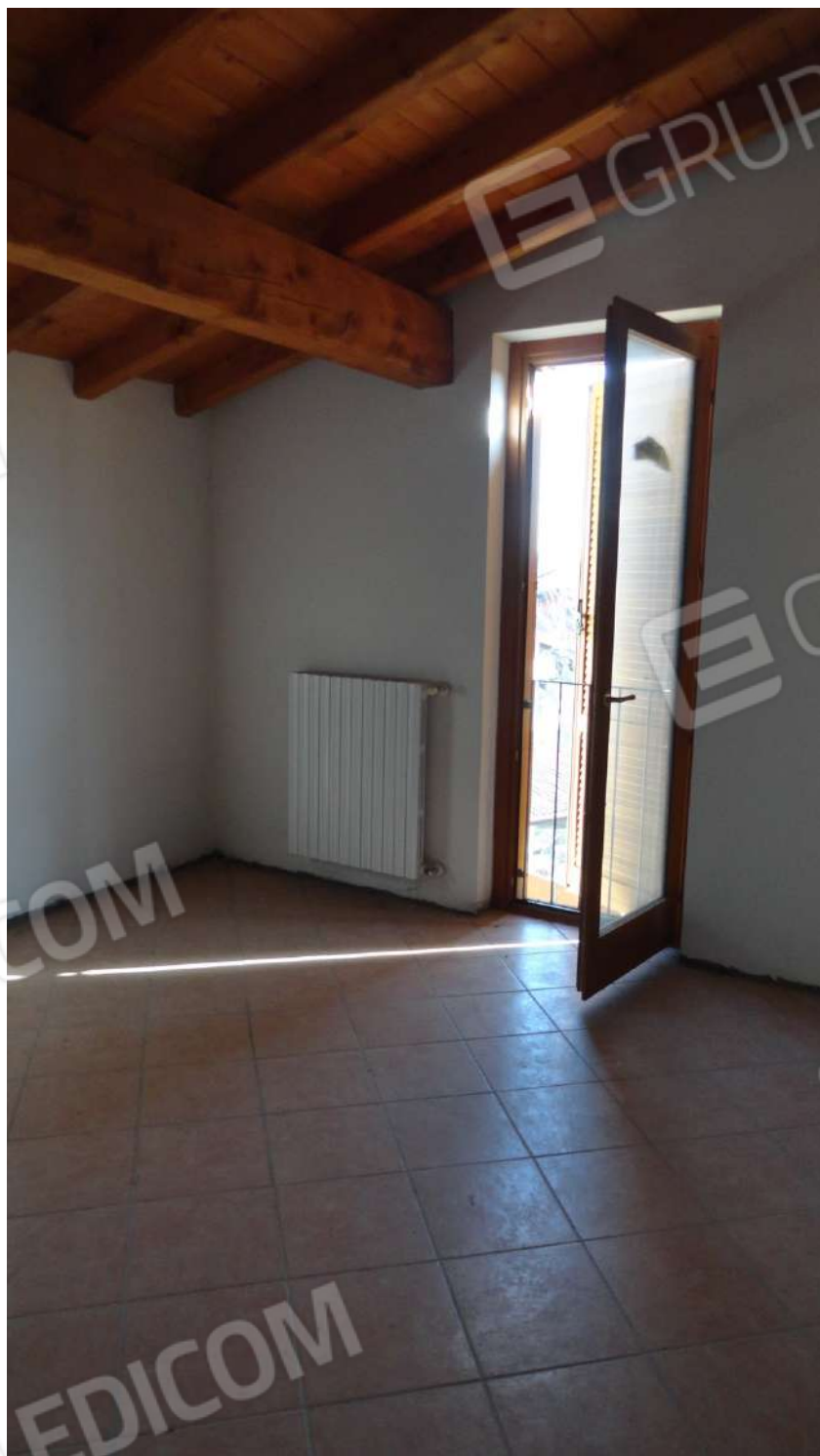
FOTOGRAFIA - N. 25 CAMERA GUARDAROBA PIANO SECONDO