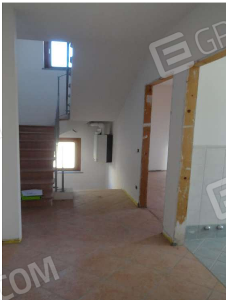
FOTOGRAFIA - N. 19 DISIMPEGNO PIANO PRIMO