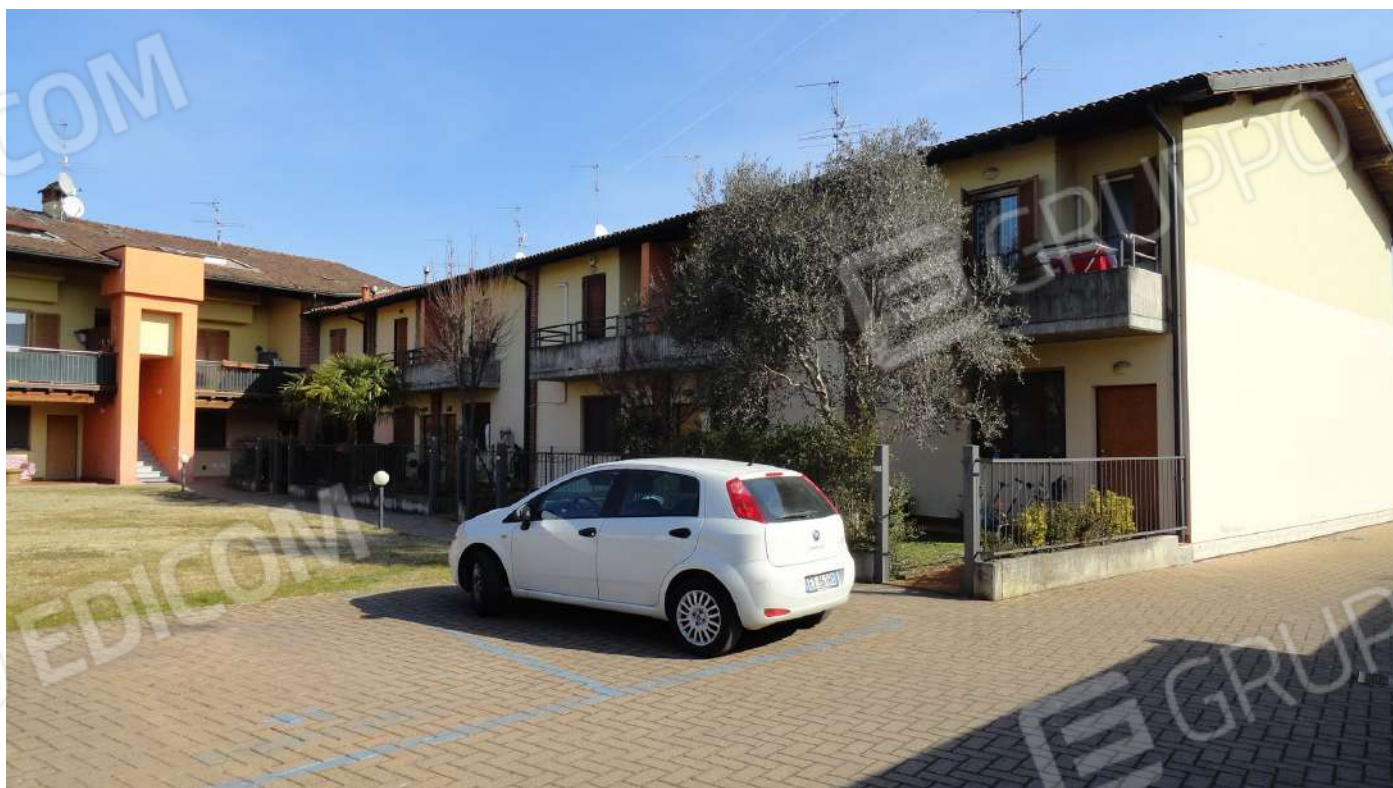
FOTOGRAFIA - N. 7 FACCIATA INTERNA EST COMPLESSO RESIDENZIALE