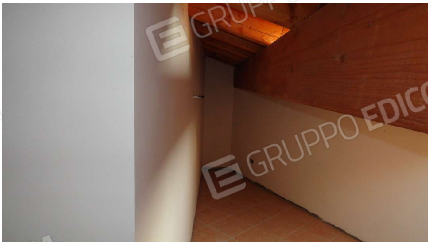
FOTOGRAFIA - N. 30 RIPOSTIGLIO PIANO SECONDO