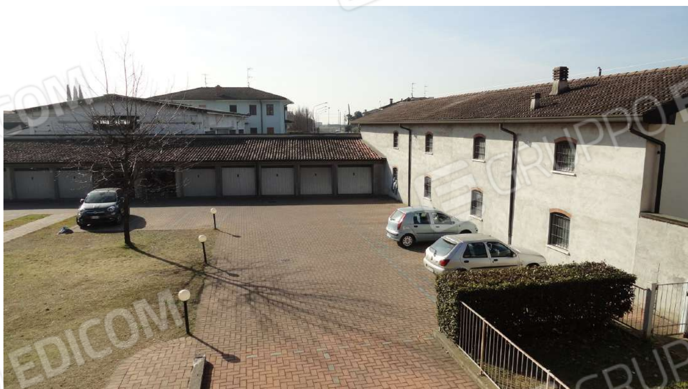
FOTOGRAFIA - N. 11 FACCIATA INTERNA SUD COMPLESSO RESIDENZIALE