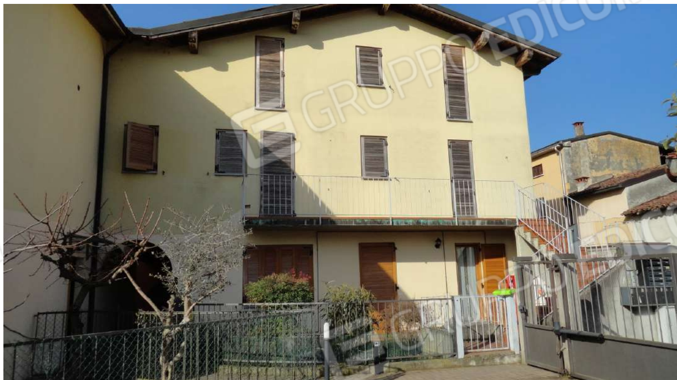
FOTOGRAFIA - N. 12 PARTE DELLA FACCIATA ESTERNA EST

PIANO PRIMO E SECONDO e alla sinistra passaggio pedonale per l'interno del complesso residenziale