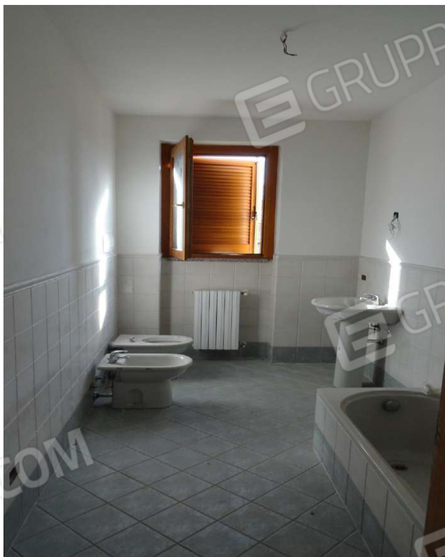
FOTOGRAFIA - N. 20 SERVIZIO IGIENICO PIANO PRIMO