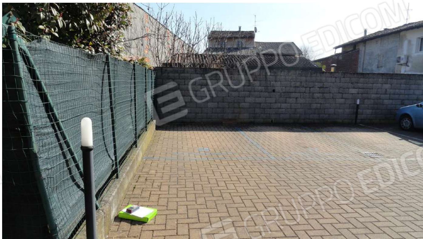
FOTOGRAFIA - N. 4 L'ACCESSO CARRAIO E PEDONALE AL COMPLESSO RESIDENZIALE slargo sud- est