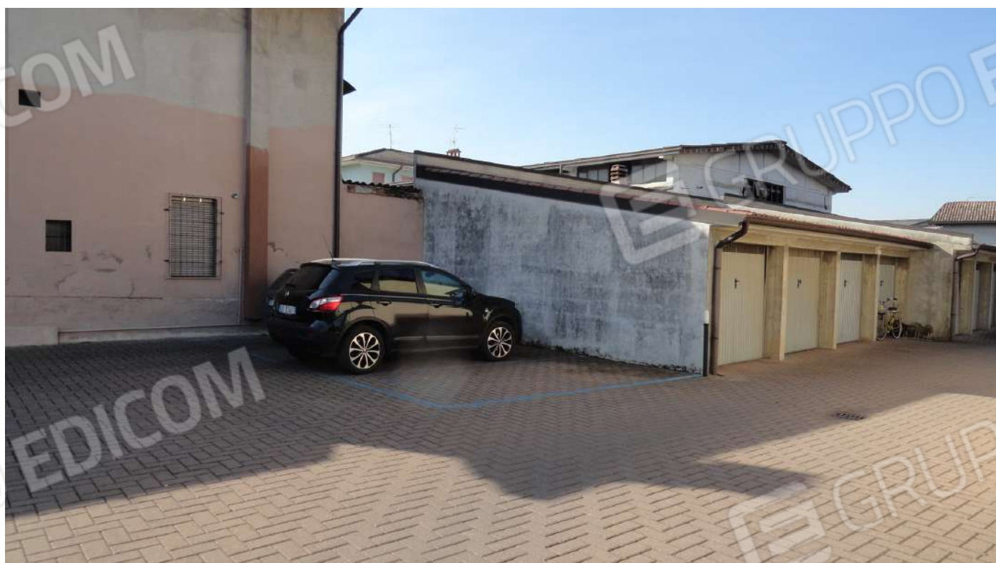
FOTOGRAFIA - N. 5 L'ACCESSO CARRAIO E PEDONALE AL COMPLESSO RESIDENZIALE slargo sud