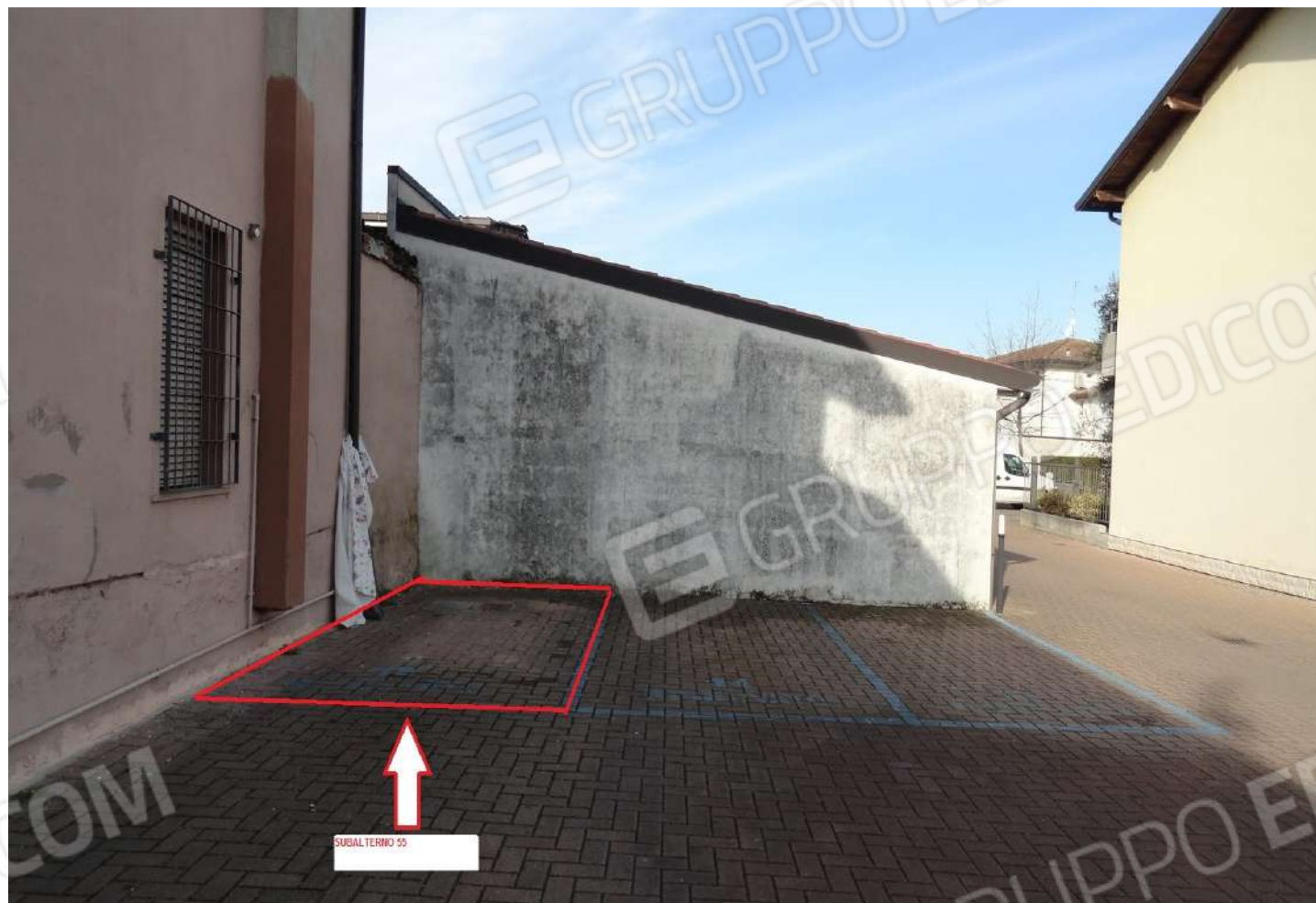
FOTOGRAFIA - N. 42 – INDIVIDUAZIONE POSTO AUTO ESTERNO SUBALTERNO N. 55