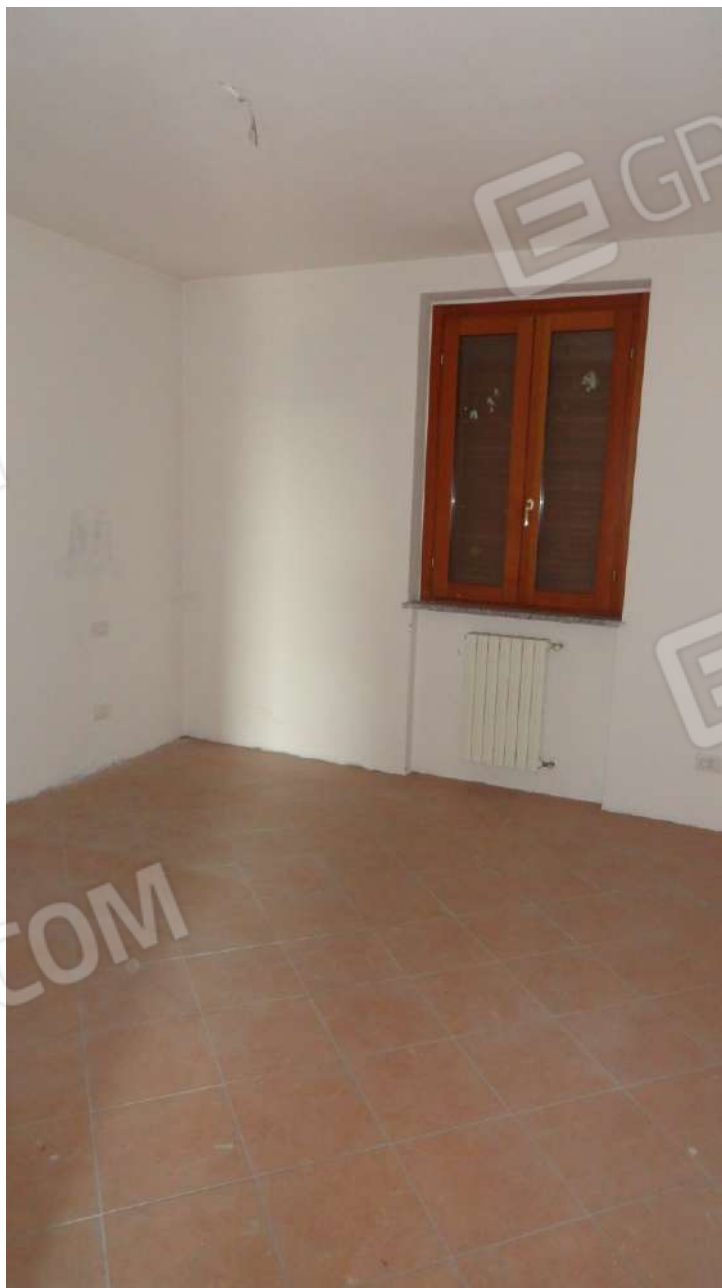
FOTOGRAFIA - N. 56 CAMERA LETTO