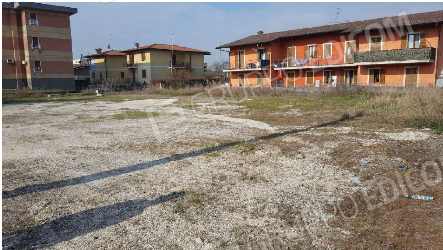
FOTOGRAFIA - N. 71 – AREA DI TERRENO IN DELLO dall'angolo nord-est