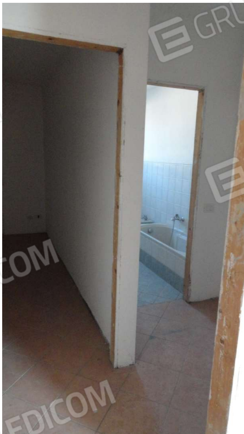
FOTOGRAFIA - N. 54 DISIMPEGNO NOTTE