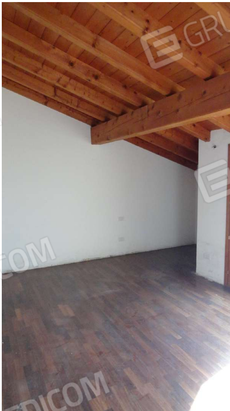
FOTOGRAFIA - N. 60 – CAMERA