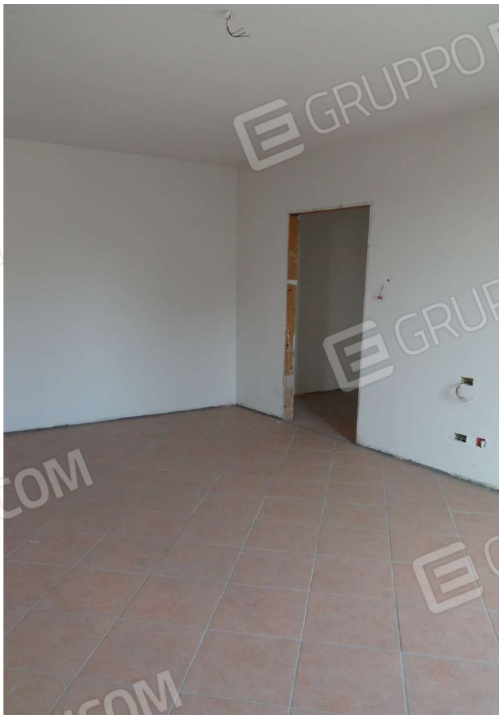
FOTOGRAFIA - N. 18 SOGGIORNO PIANO PRIMO