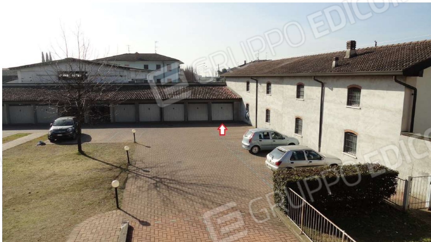
FOTOGRAFIA - N. 36 – L'UBICAZIONE DELL'AUTORIMESSA SUBALTERNO N. 38 AL'INTERNO DELLA CORTE