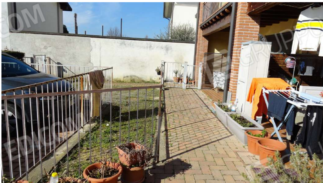
FOTOGRAFIA - N. 66 – PARTE DEL GIARDINO QUALE PERTINENZA ED IL CAMMINAMENTO