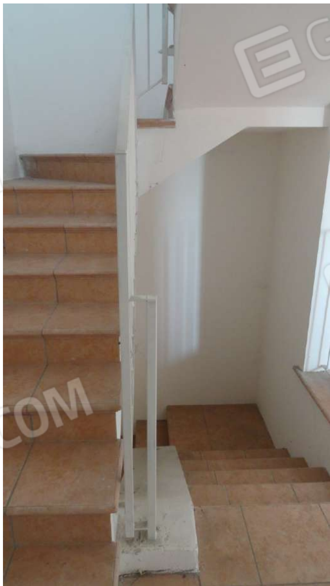
FOTOGRAFIA - N. 57- SCALA INTERNA RAMPA DA PIANO TERRA (DX) RAMPA AL PIANO SECONDO(SX)