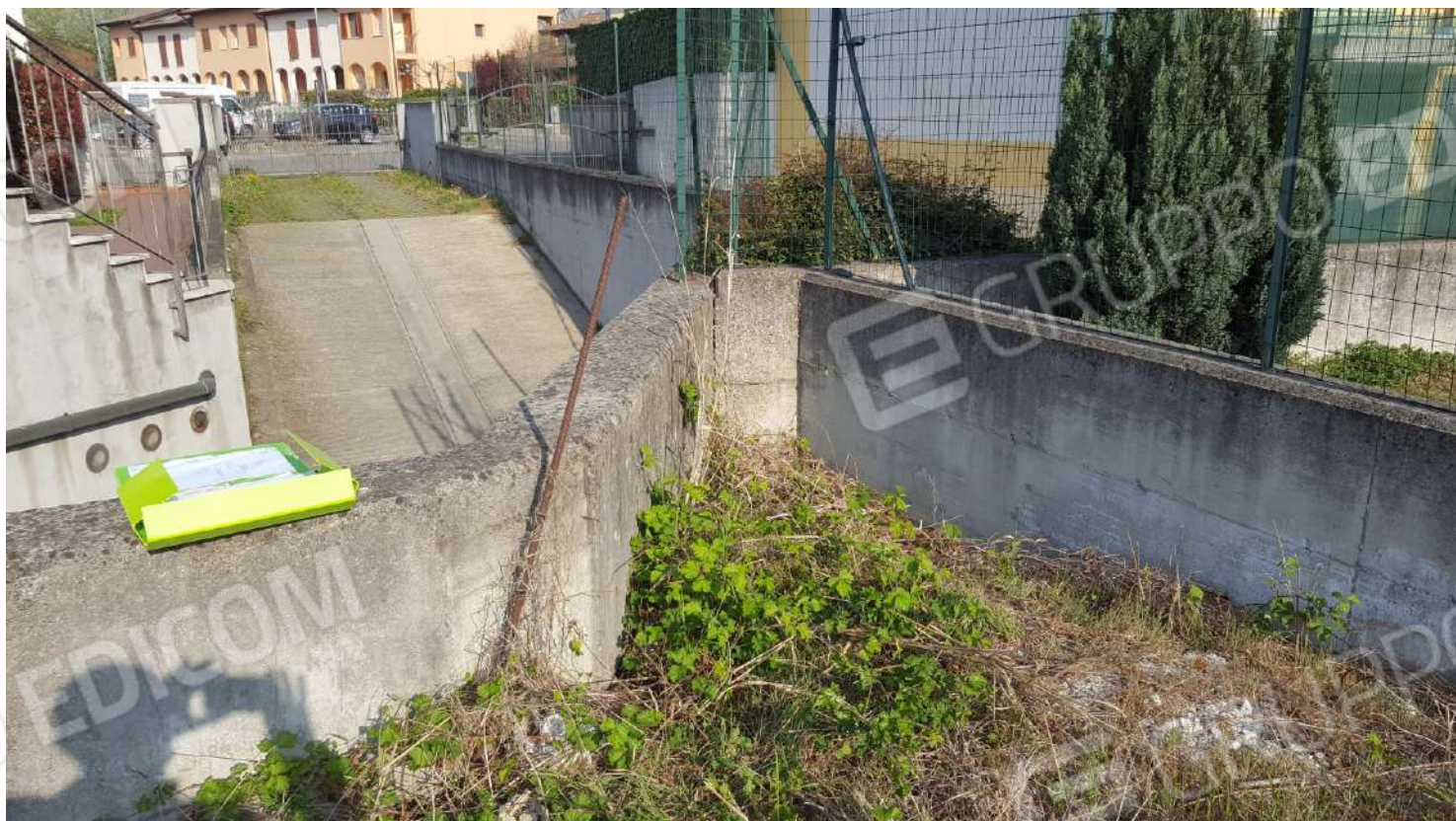
FOTOGRAFIA - N. 72 – AREA DI TERRENO IN DELLO : particolare a confine nord-ovest