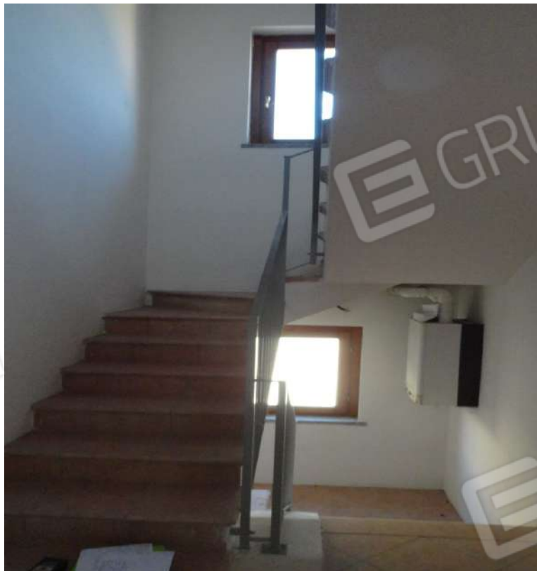
FOTOGRAFIA - N. 22 SCALA INTERNA PIANO PRIMO