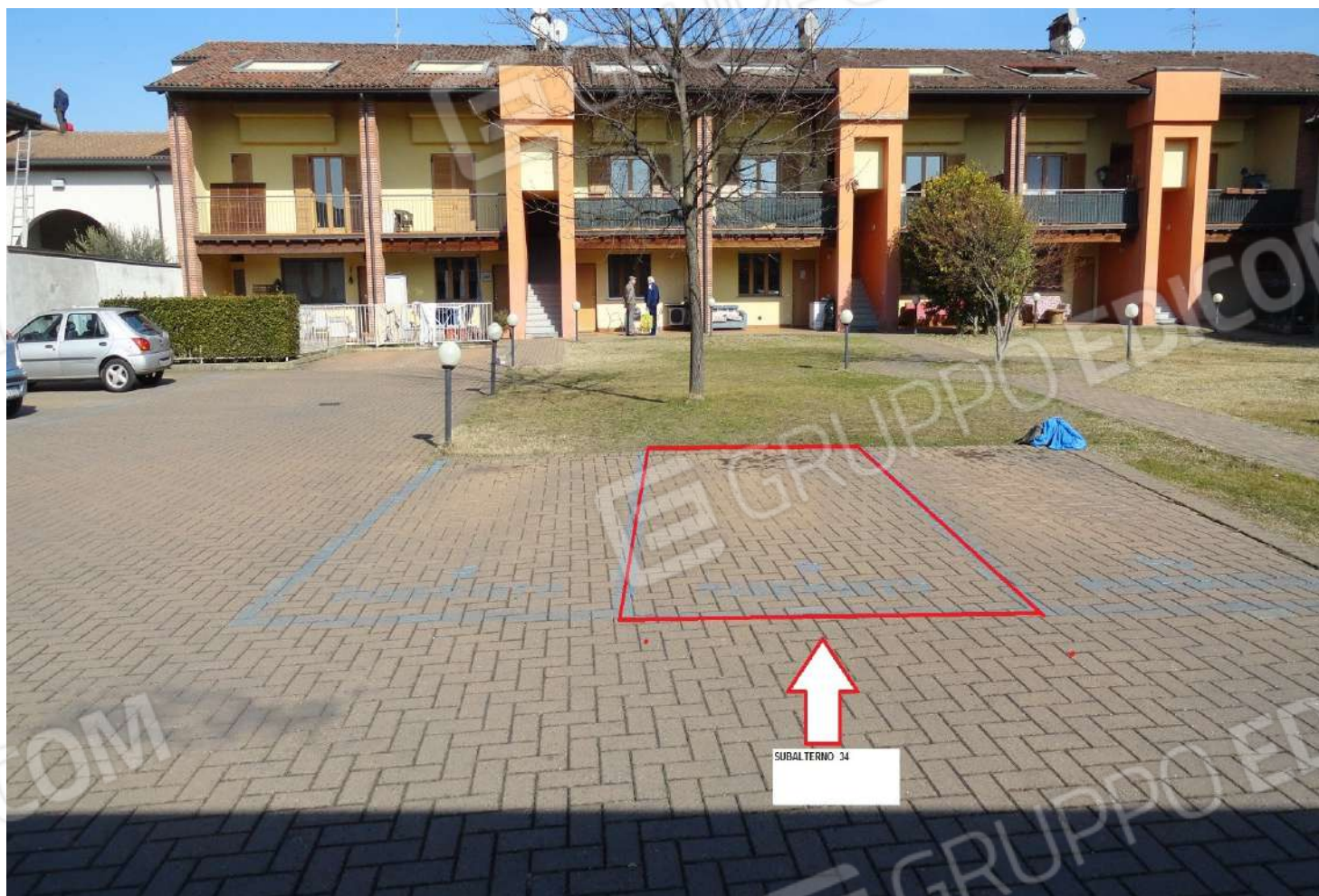
FOTOGRAFIA - N. 34 – INDIVIDUAZIONE POSTO AUTO ESTERNO SUBALTERNO N. 34