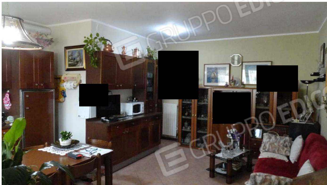
FOTOGRAFIA - N. 45 – IL SOGGIORNO