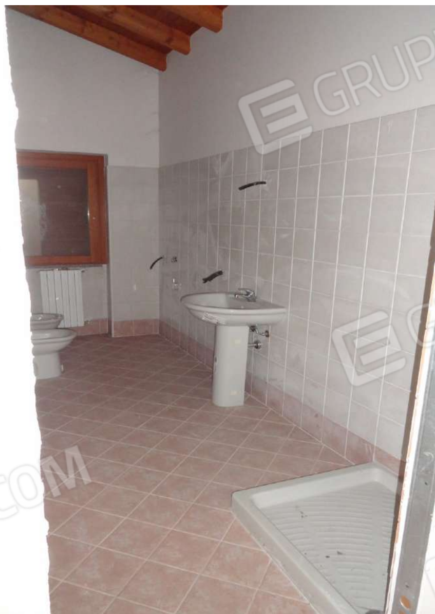
FOTOGRAFIA - N. 26 SERVIZIO IGIENICO PIANO SECONDO