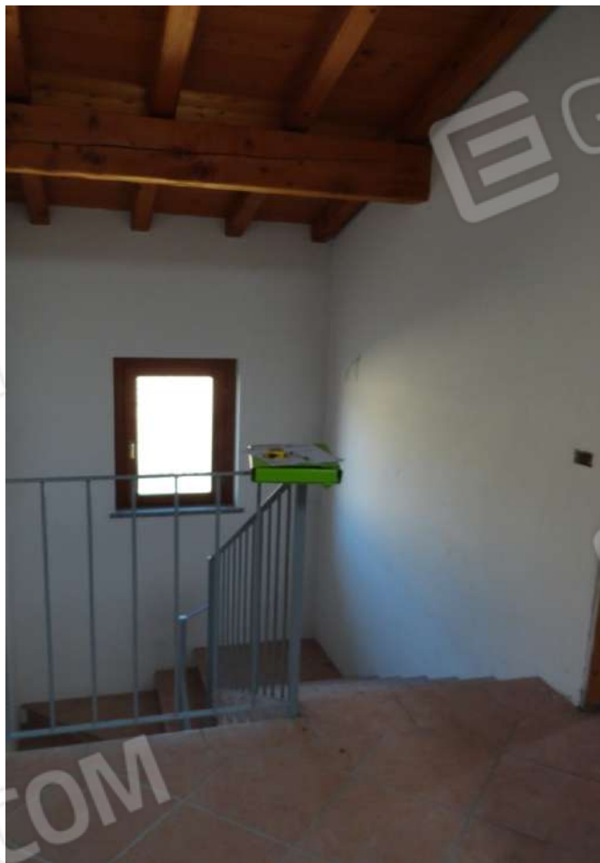
FOTOGRAFIA - N. 24 SCALA INTERNA ARRIVO PIANO SECONDO