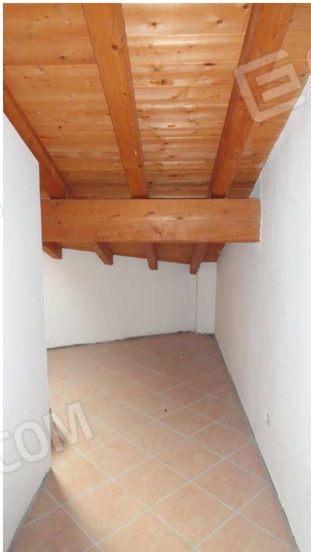
FOTOGRAFIA - N. 29 RIPOSTIGLIO PIANO SECONDO