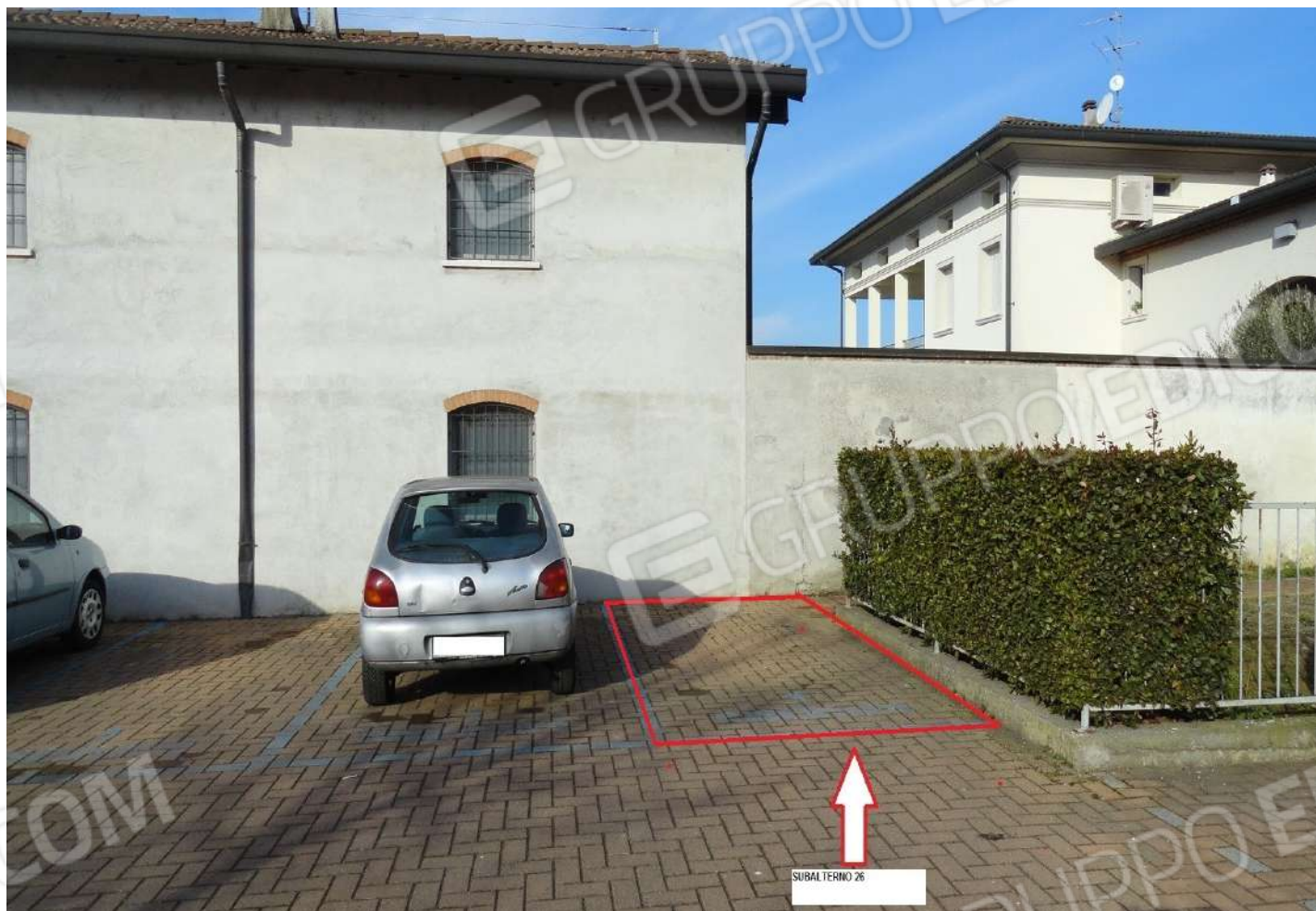
FOTOGRAFIA - N. 31 – INDIVIDUAZIONE POSTO AUTO ESTERNO SUBALTERNO N. 26