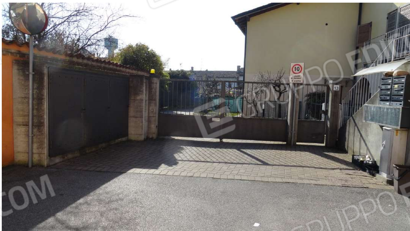
FOTOGRAFIA - N. 1 L'ACCESSO AL COMPLESSO RESIDENZIALE