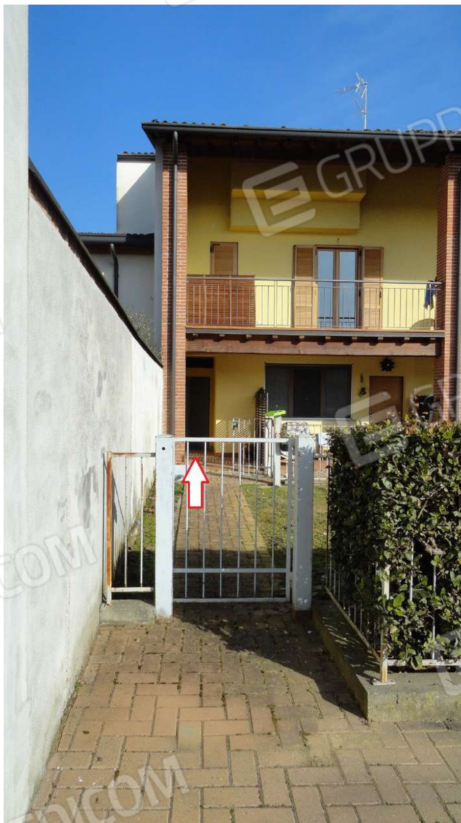
FOTOGRAFIA - N. 49BIS INGRESSO DAL CORTILE INTERNO PER SUB. 70