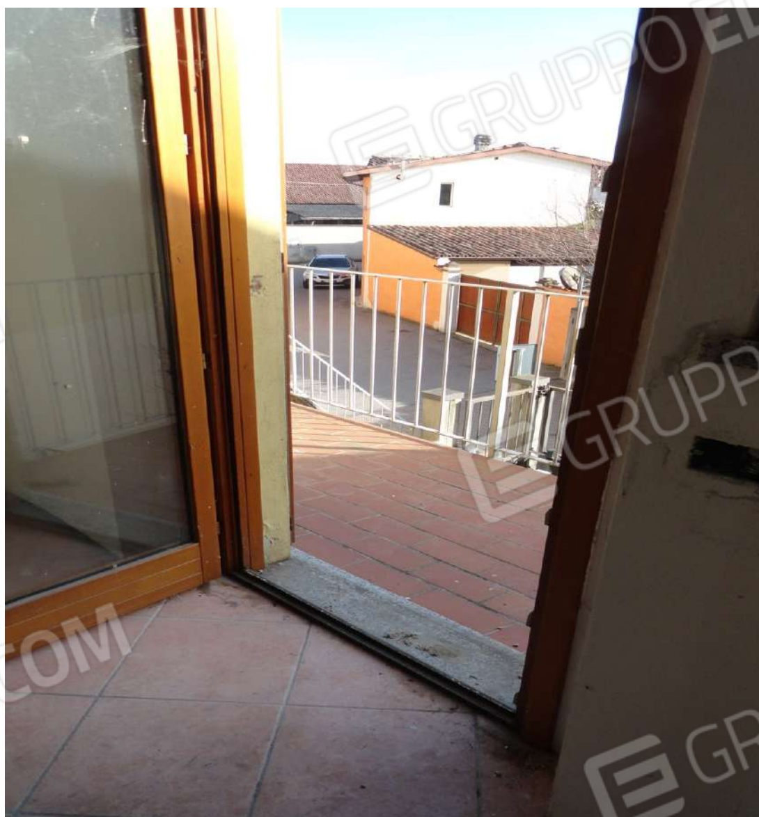
FOTOGRAFIA - N. 15 L'ACCESSO AL PIANO PRIMO UNITA' ESECUTATA