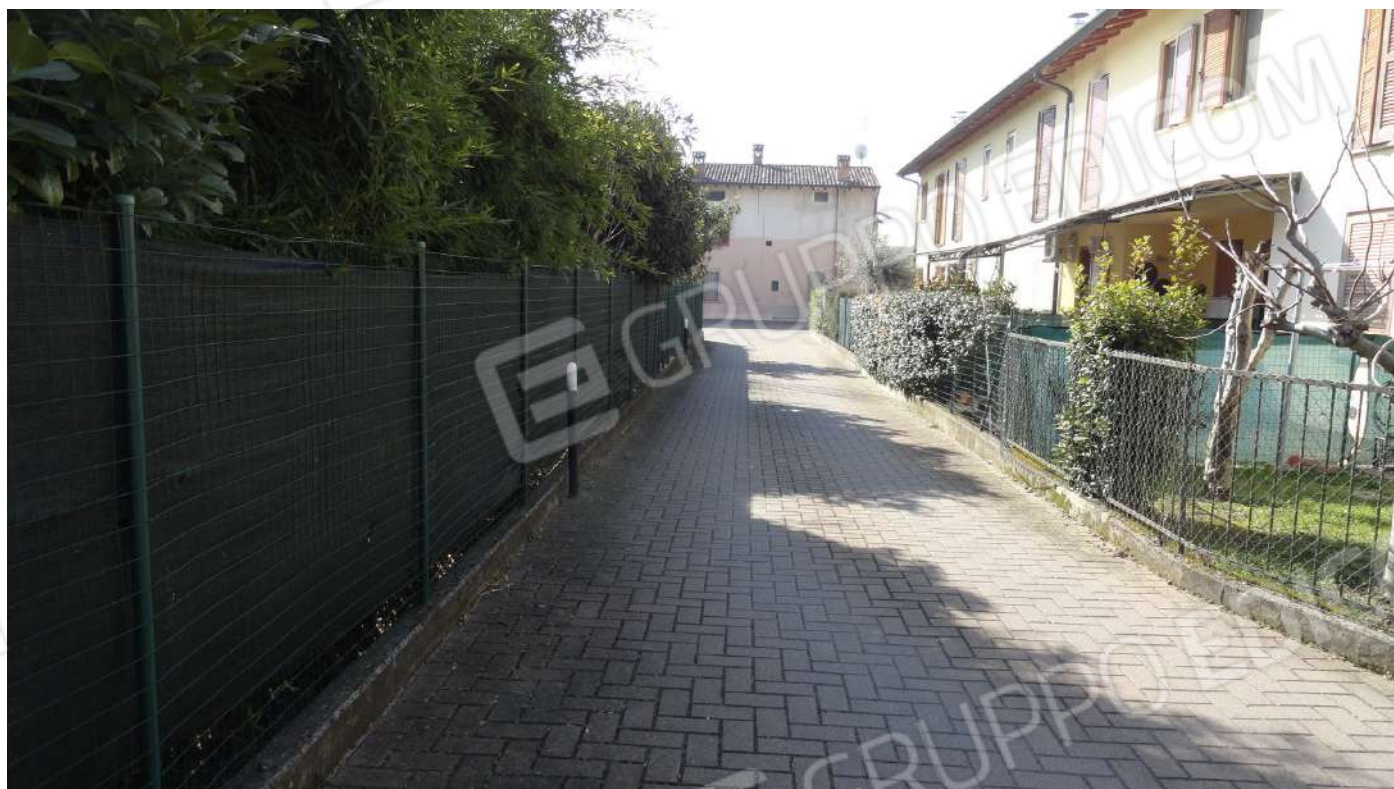
FOTOGRAFIA - N. 2 L'ACCESSO CARRAIO E PEDONALE AL COMPLESSO RESIDENZIALE