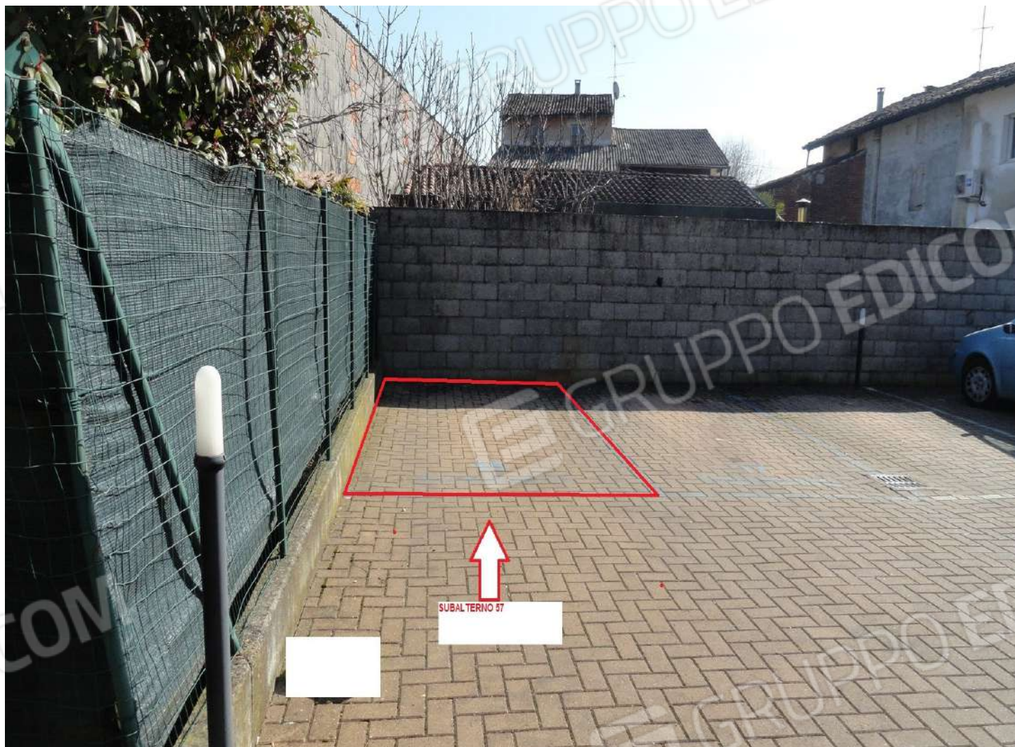
FOTOGRAFIA - N. 43- INDIVIDUAZIONE POSTO AUTO ESTERNO SUBALTERNO N. 57