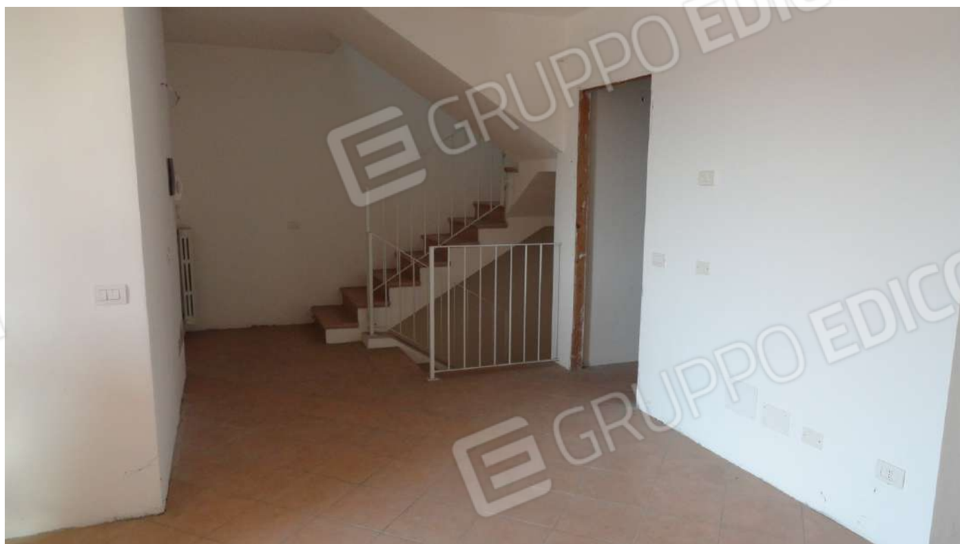
FOTOGRAFIA - N. 51 PARTICOLARE INGRESSO AL PIANO PRIMO E PARTE SOGGIORNO