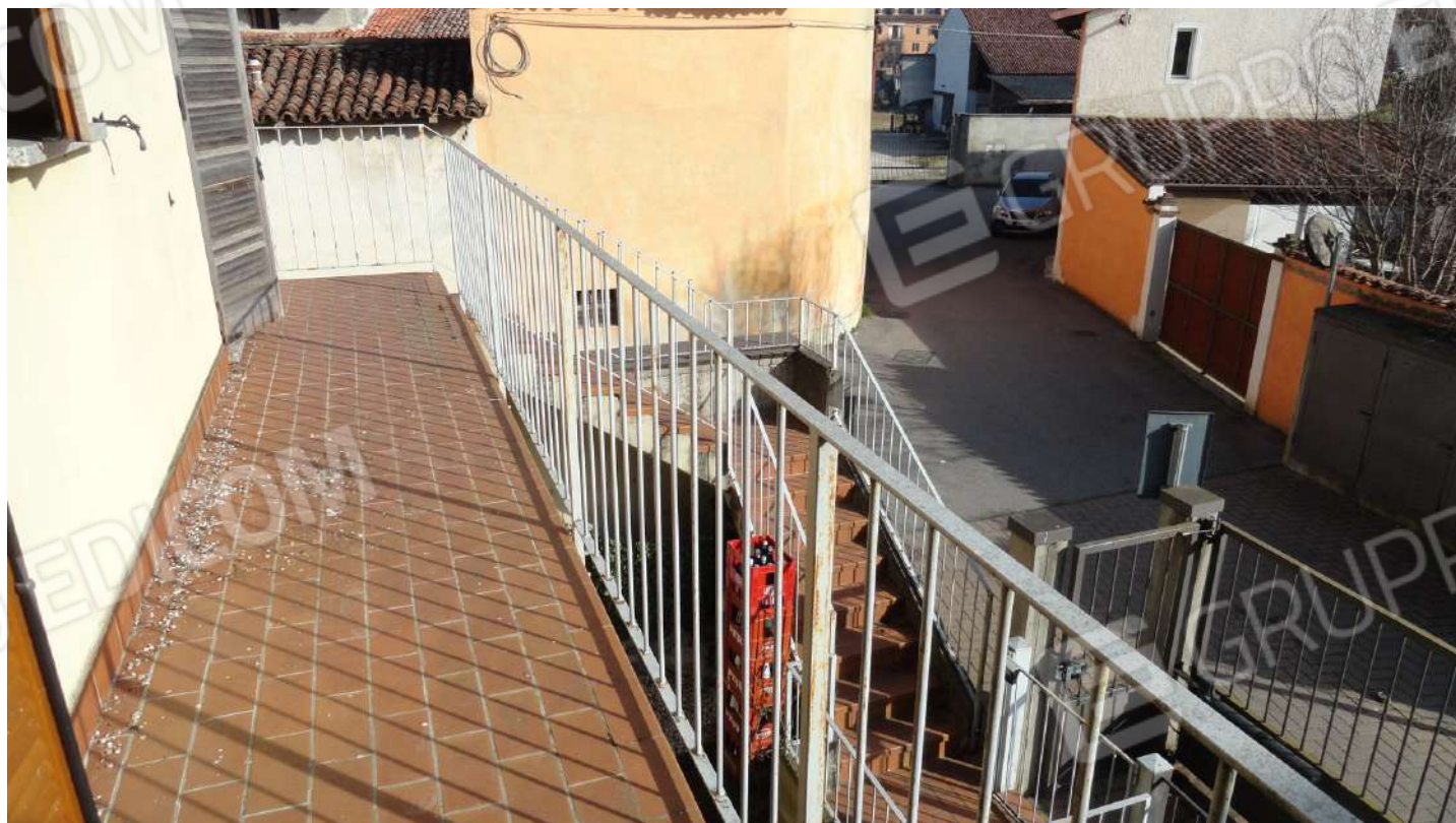
FOTOGRAFIA - N. 13 L'ACCESSO TRAMITE SCALA ESTERNA E BALCONE AL PIANO PRIMO E SECONDO

PIANO PRIMO E SECONDO e alla sinistra passaggio pedonale per l'interno del complesso residenziale