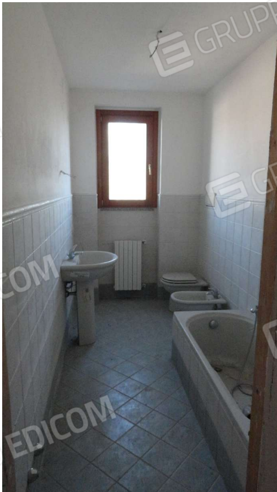
FOTOGRAFIA - N. 55 SERVIZIO IGIENICO