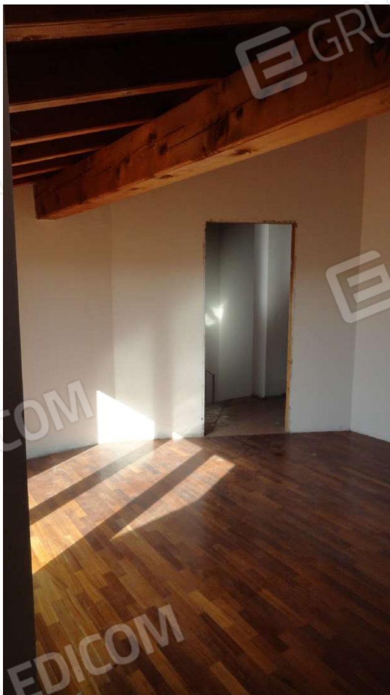
FOTOGRAFIA - N. 61 – CAMERA