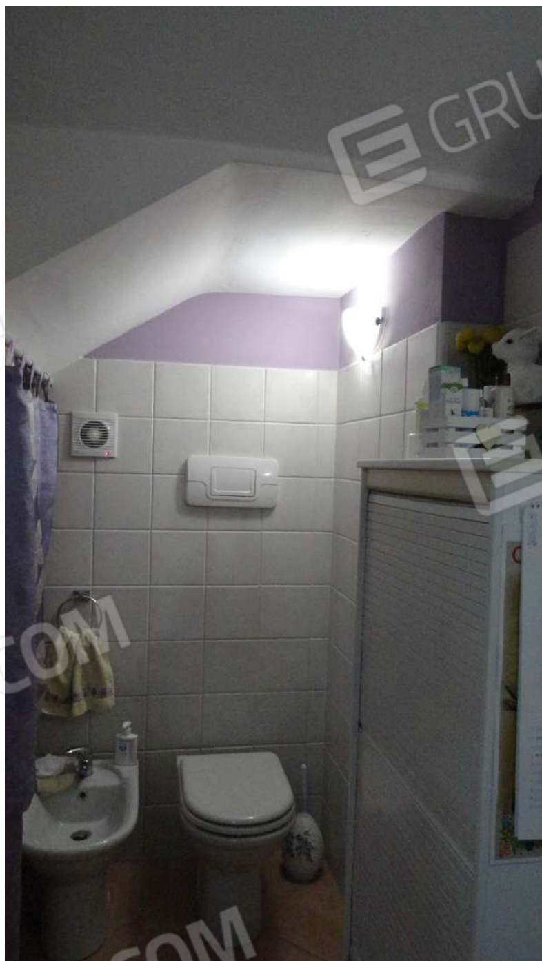
FOTOGRAFIA - N. 48 – IL SERVIZIO IGIENICO