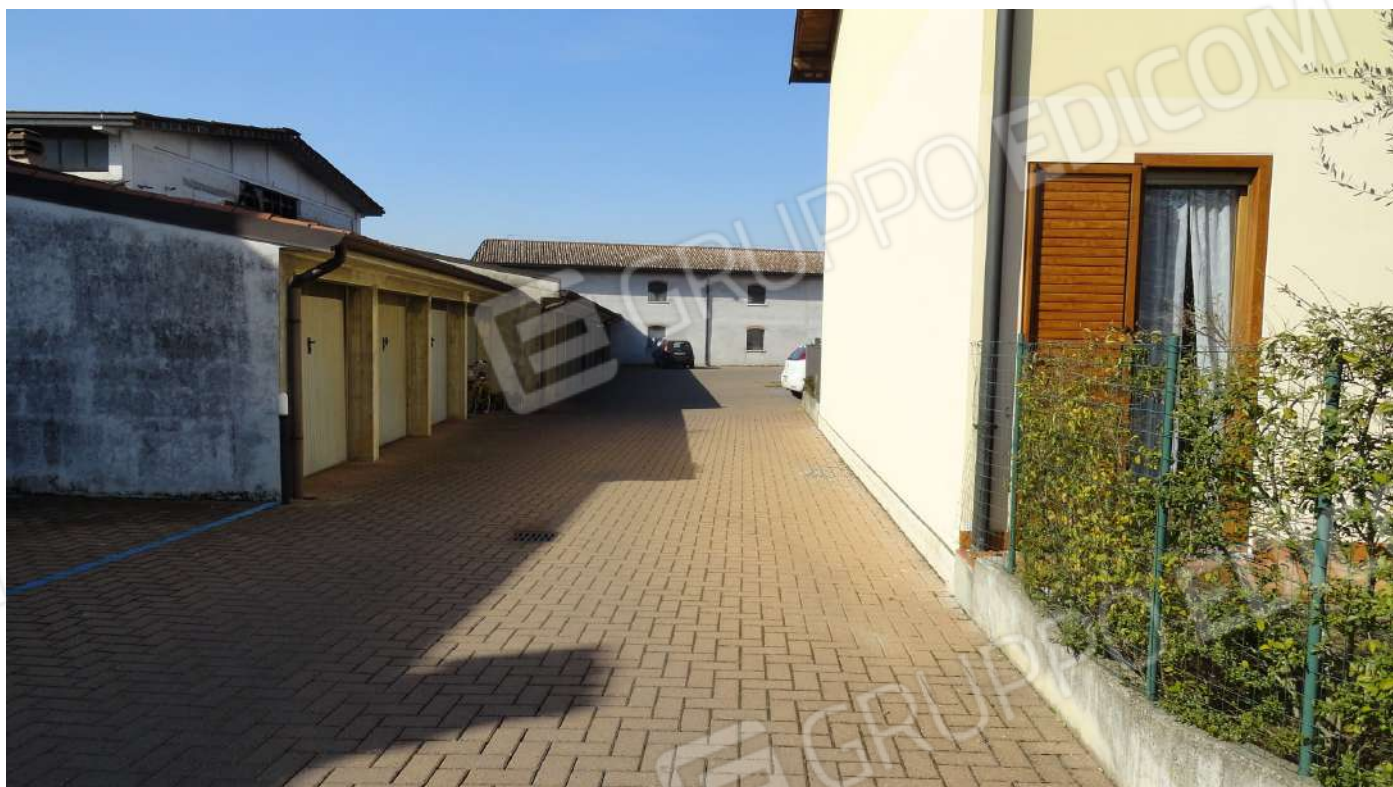
FOTOGRAFIA - N. 6 L'ACCESSO CARRAIO E PEDONALE AL COMPLESSO RESIDENZIALE slargo sud