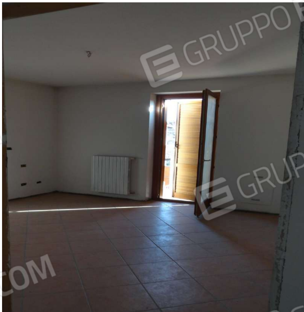
FOTOGRAFIA - N. 21 CUCINA TINELLO PIANO PRIMO