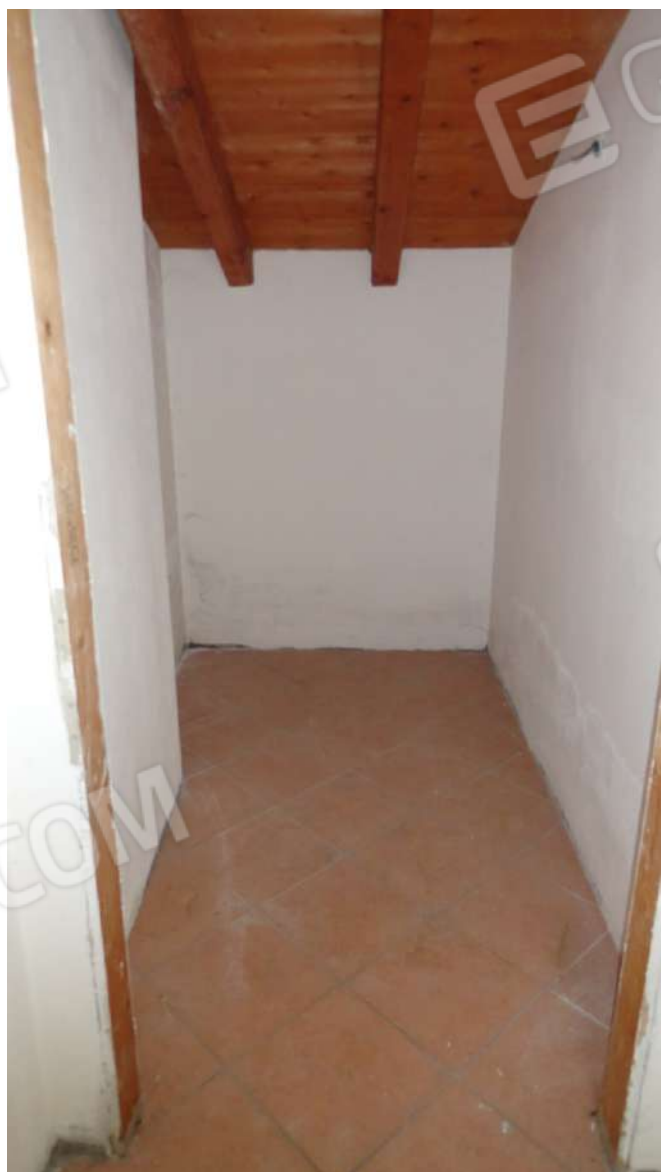
FOTOGRAFIA - N. 59 – SPAZIO A DISOSIZIONE PIANO SECONDO di fronte allo sbarco scala