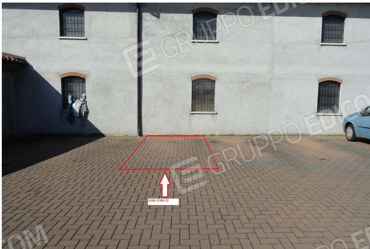
FOTOGRAFIA - N. 32 – INDIVIDUAZIONE POSTO AUTO ESTERNO SUBALTERNO N. 32