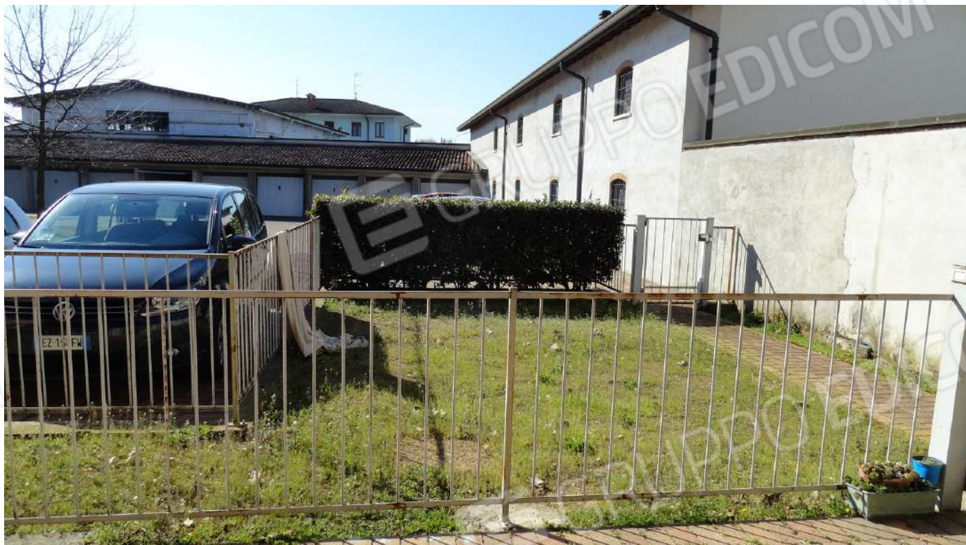
FOTOGRAFIA - N. 65 – IL GIARDINO QUALE PERTINENZA