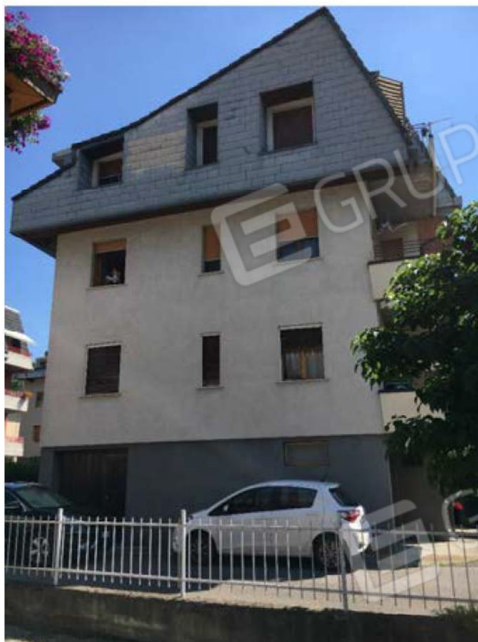
Facciata Ovest non interessata dall'esecuzione