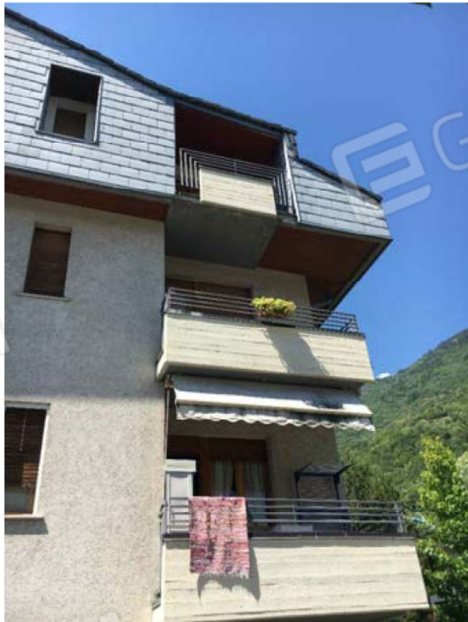
Particolare balconi facciata Est