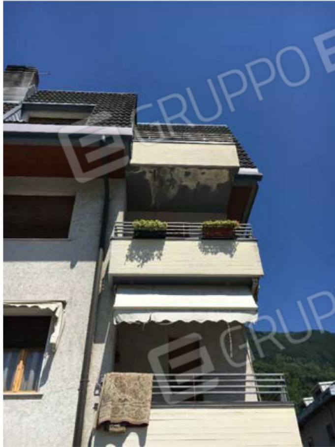
Particolare balconi facciata SUD