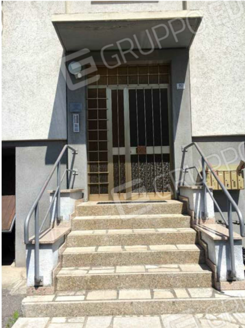
PARTICOLARE INGRESSO CONDOMINIO SU SCALA COMUNE