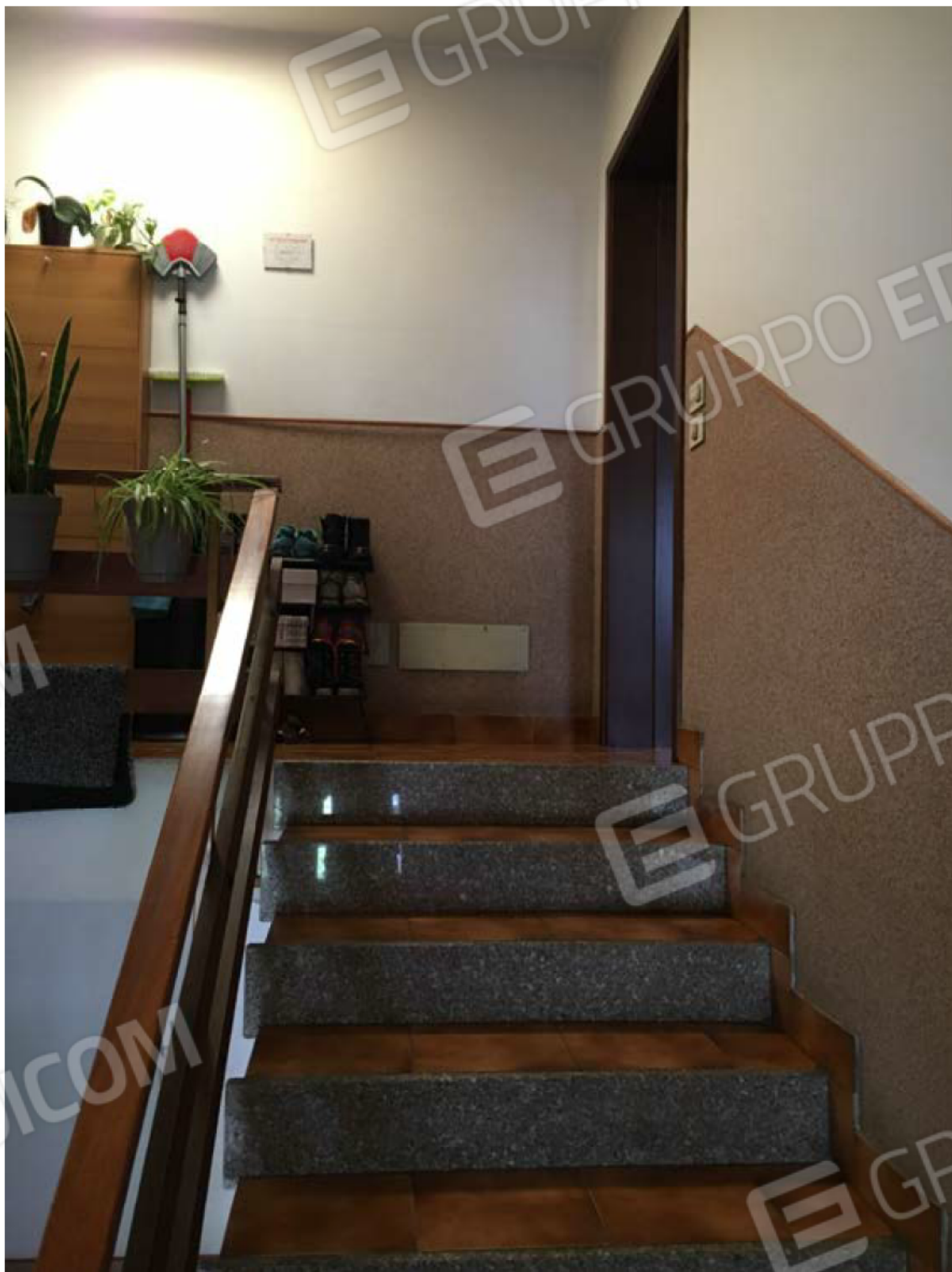
Ingresso dal vano scala comune