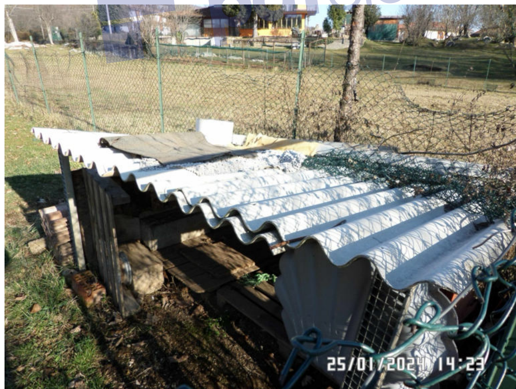
Foto 5: Lastre "B" disposte in piano l'una sull'altra, sopra una sorta di cuccia/pollaio