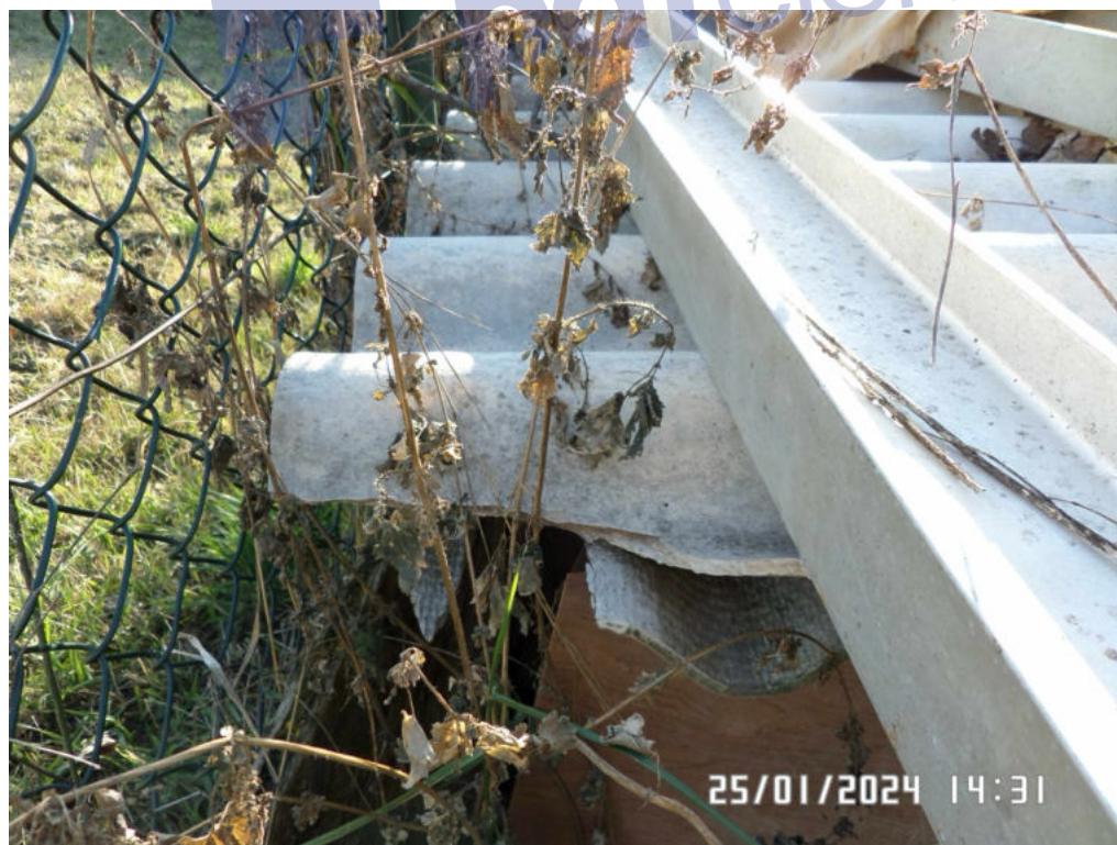
Foto 10: Lastre "B", particolare delle estremità friabili e degli sfridi