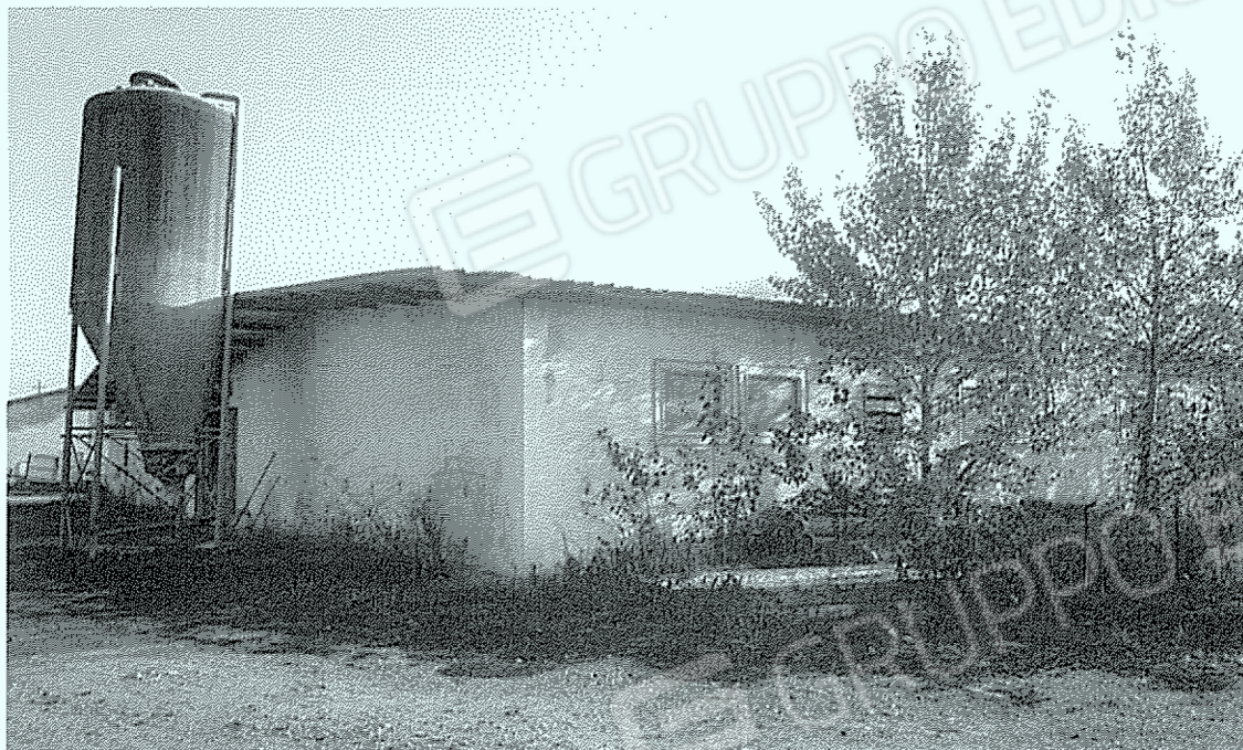
Corpo "12": svezramento e deposito attrezzi