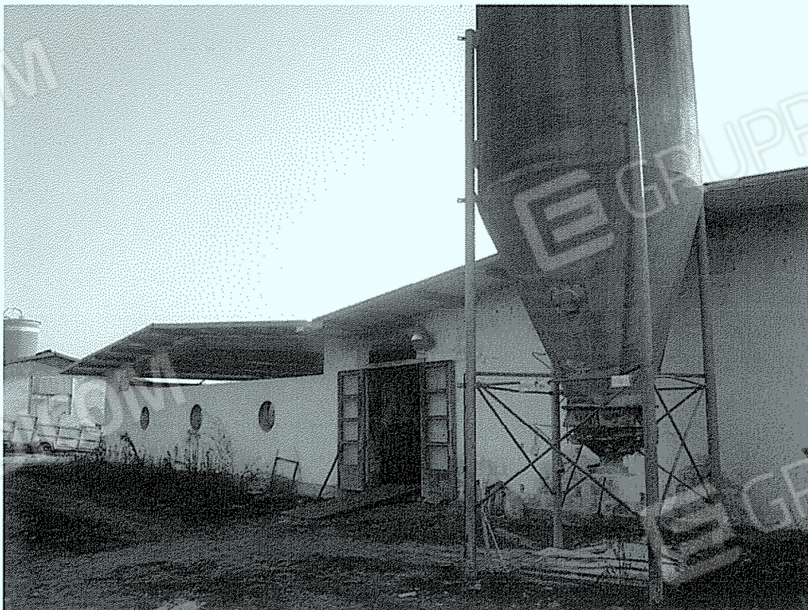
Corpo "12": svezramento e deposito attrezzi