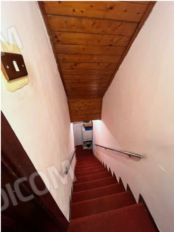
Vano scala di collegamento tra i piani