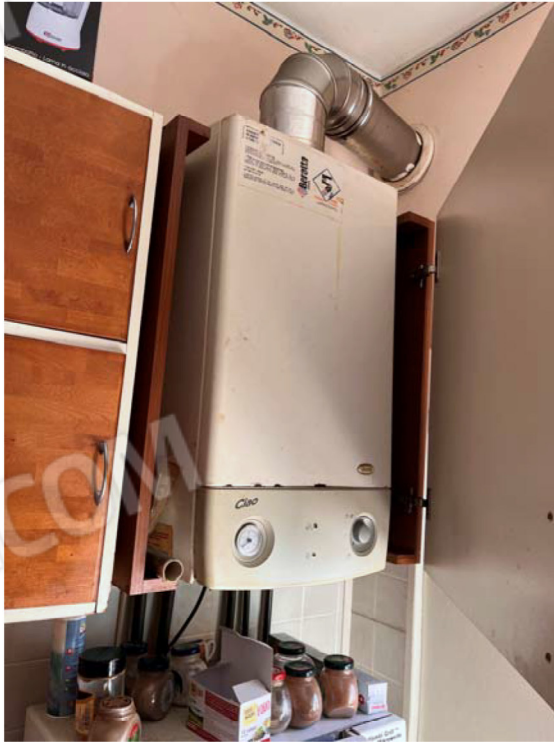
Caldaia pensile posta in cucina