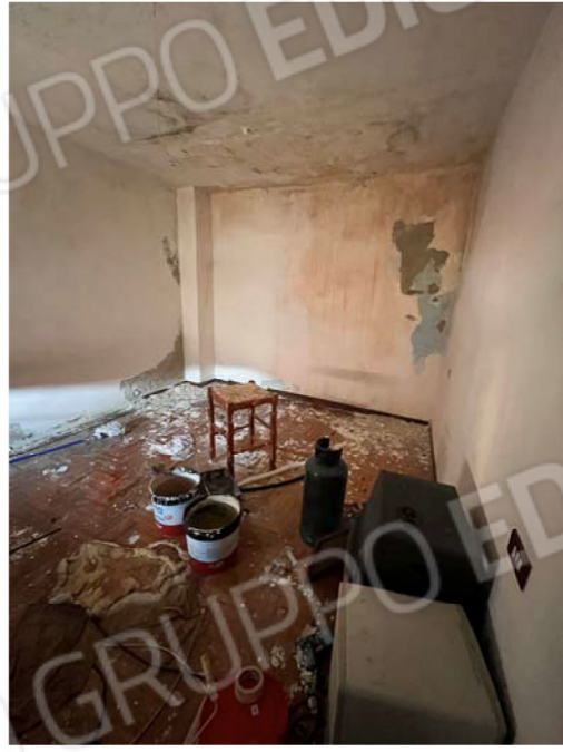
Camera 3 (si noti l'infiltrazione d'acqua dal soffitto)