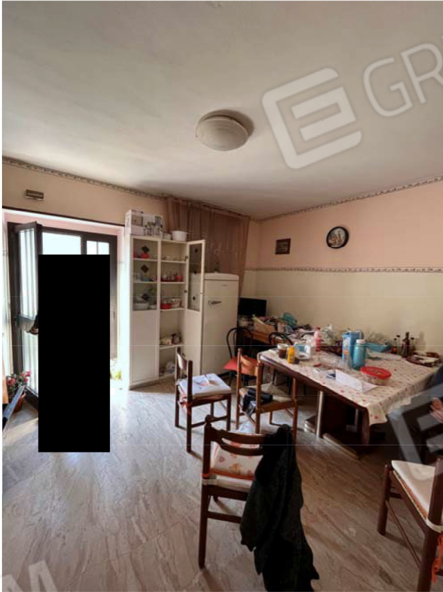
Cucina/pranzo con ingresso dal civico 7