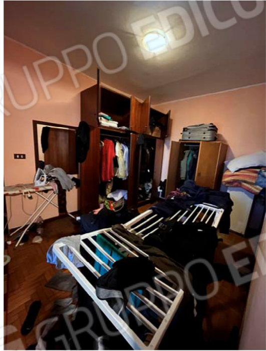
Camera 1 (adiacente al vano scala)