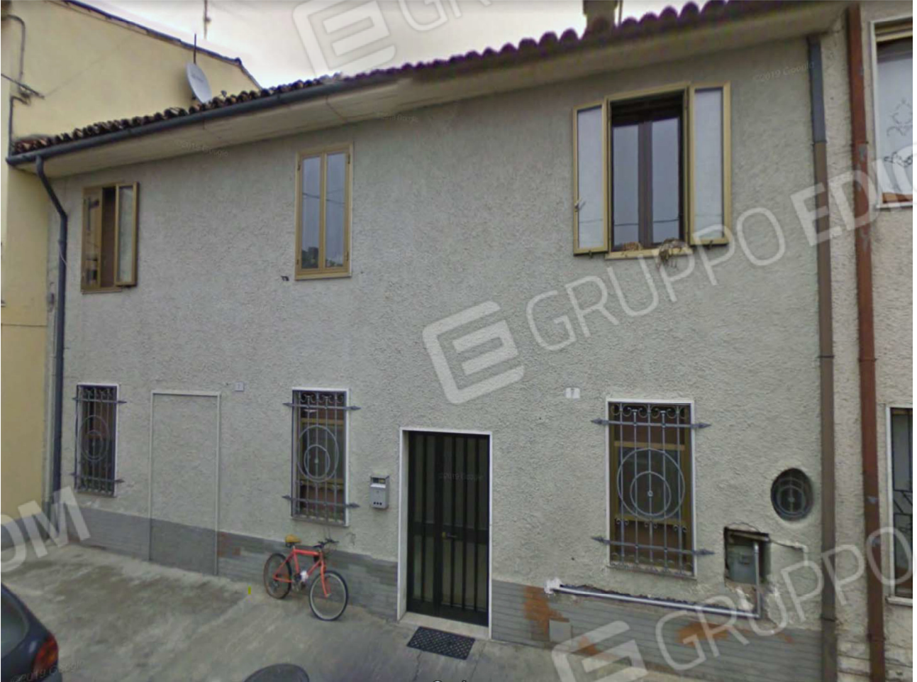
Prospetto est