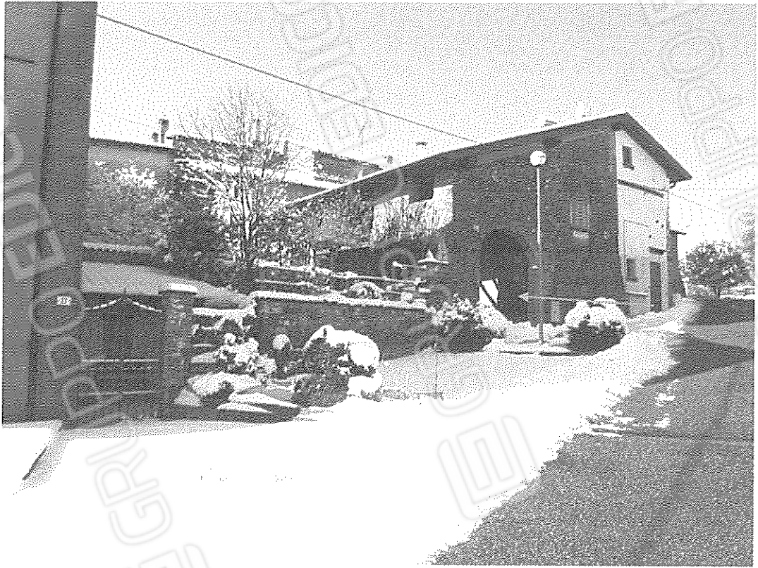
Veduta del complesso immobiliare di cui parte è oggetto di esecuzione: in evidenza l'ingresso da Via Villa n. 9