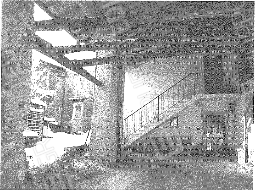
Ingresso dal porticato e veduta corte interna