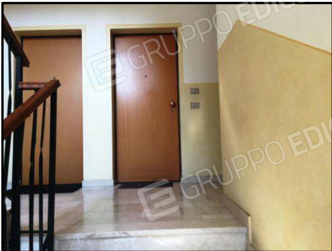
Fotografia n. 3