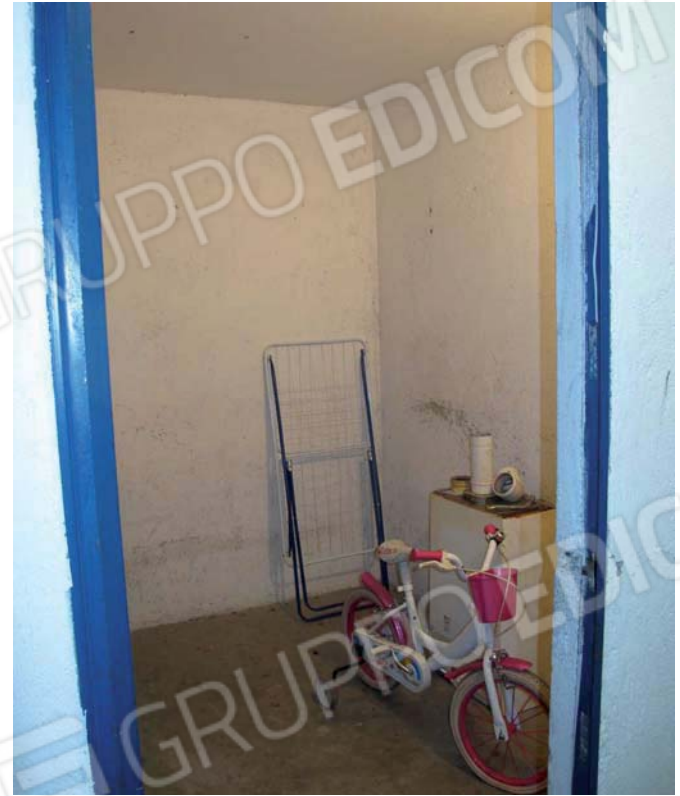
Viste della cantina cieca a piano terra