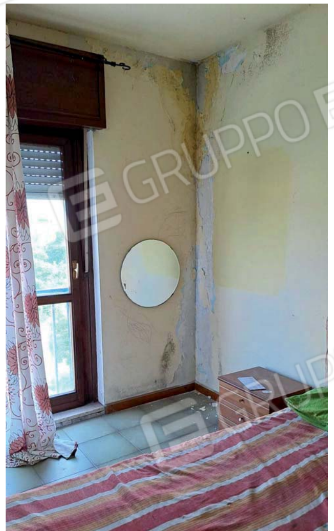
Viste interne dell'appartamento bagno e camera da letto