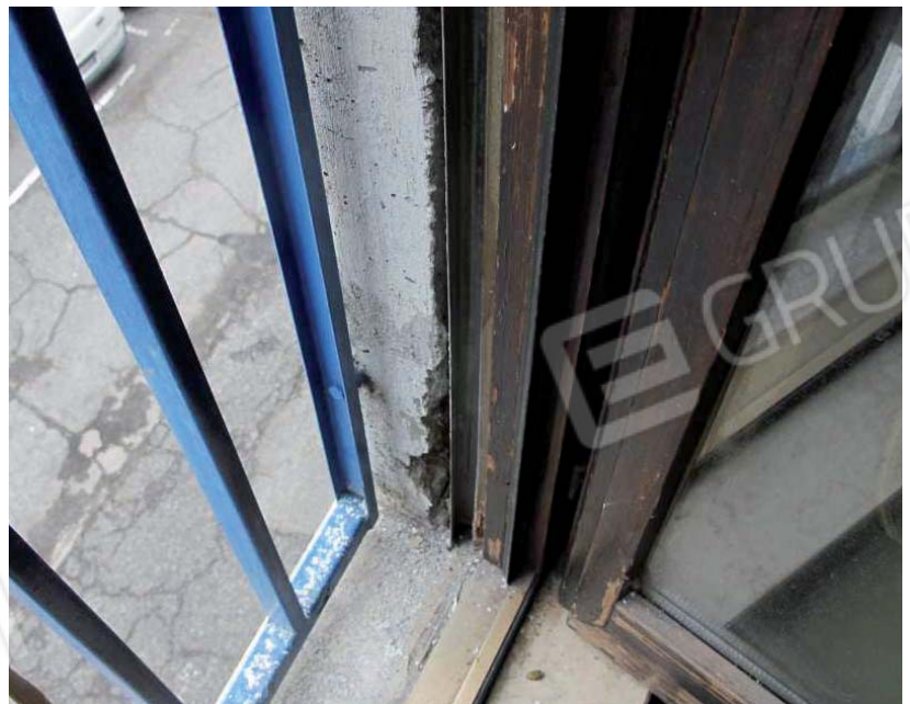
Stato di degrado diffuso in tutti gli ambienti dell'appartamento