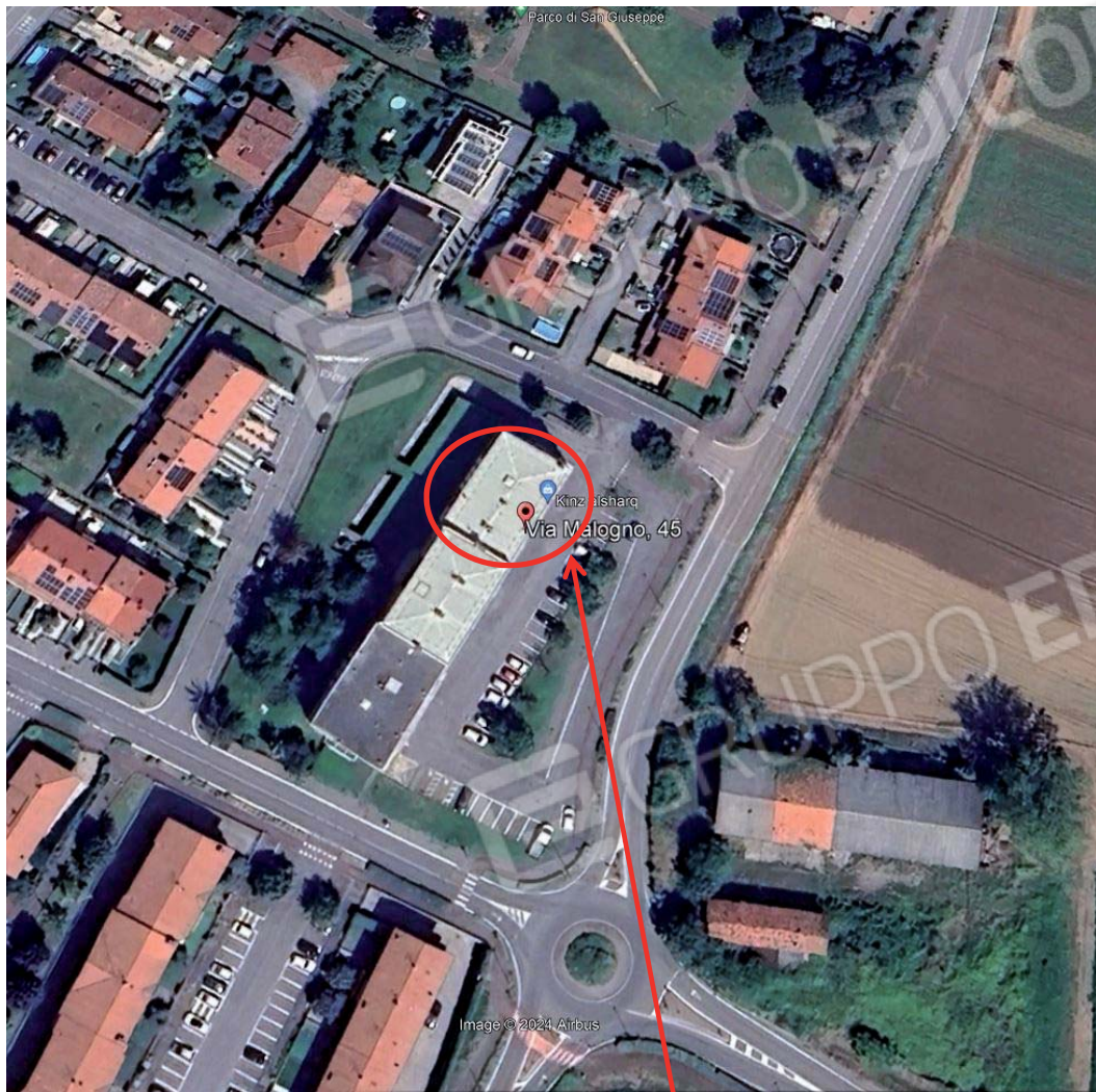
Condominio Malogno 2