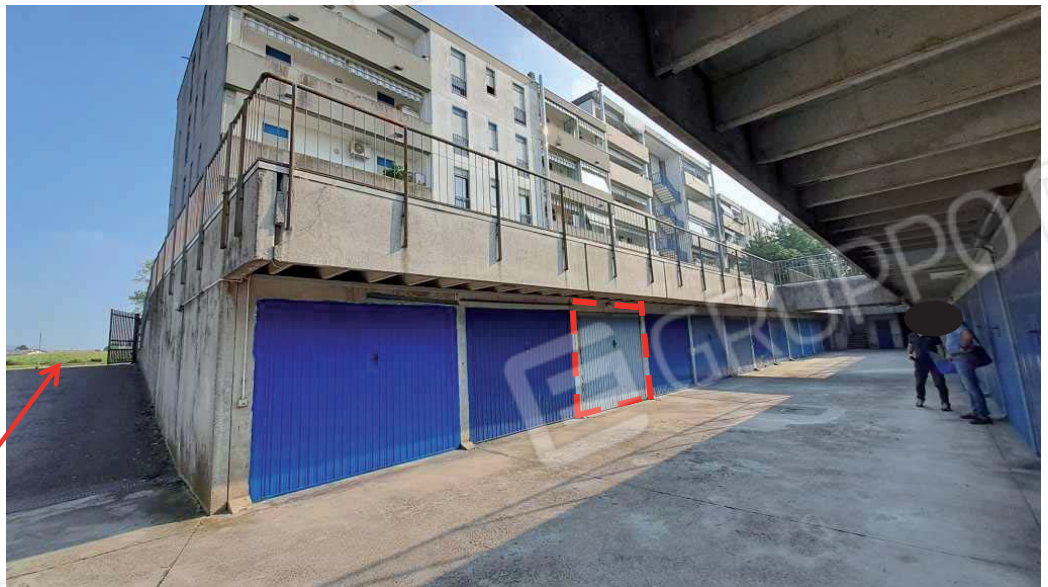
Accesso carraio all'autorimessa