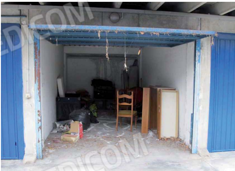
Viste dell'autorimessa e stato di conservazione, segni di infiltrazioni sulla muratura di fondo