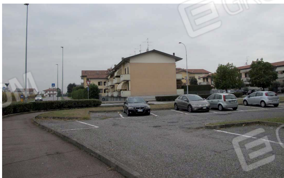
Viste dell'intorno ove si inserisce il bene