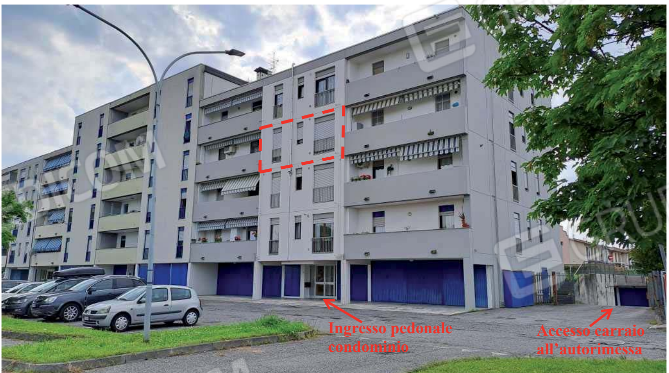
Vista generale del condominio Malogno 2 e individuazione dell'unità abitativa