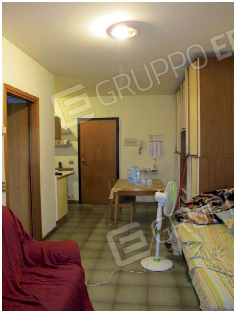
Viste interne dell'appartamento soggiorno/cucina