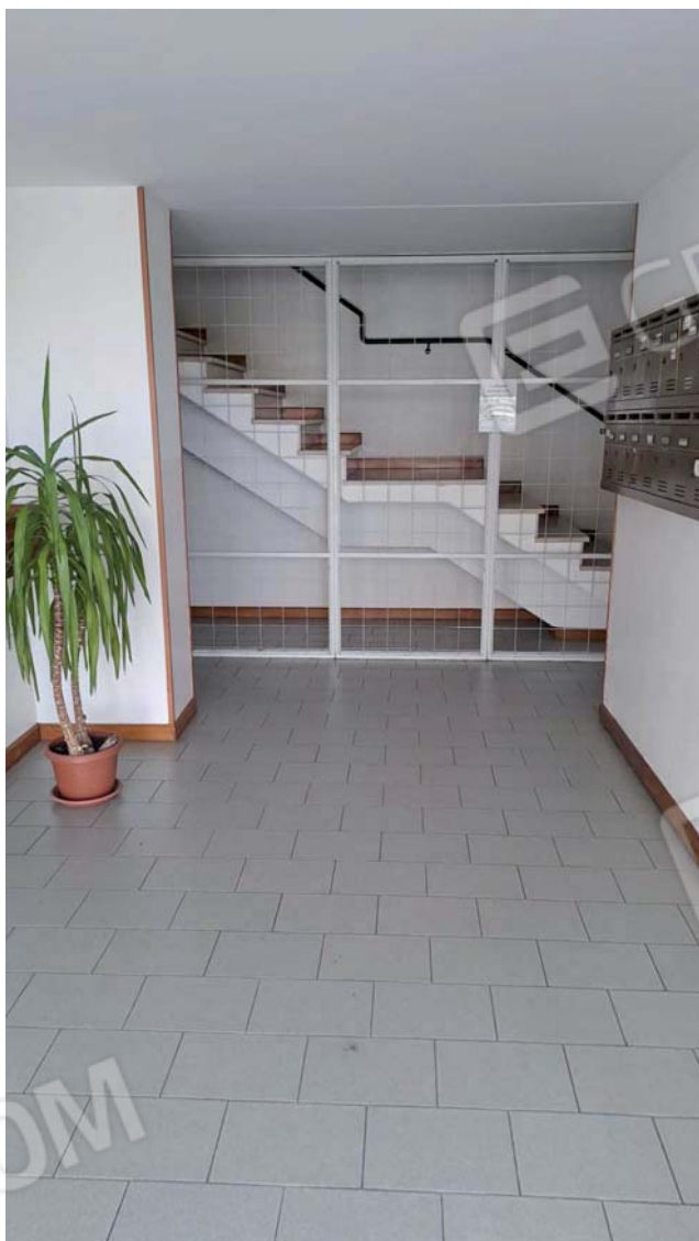
Viste delle parti comuni