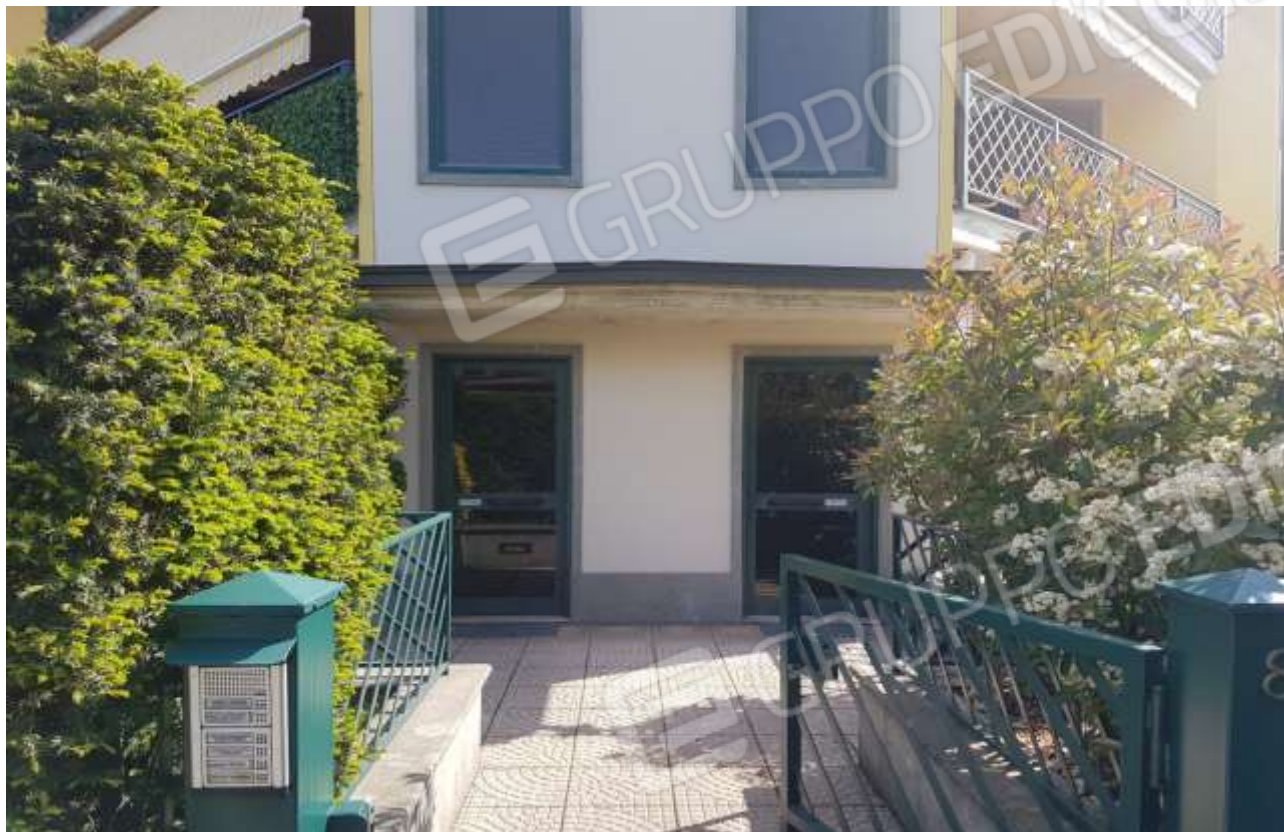
Vista portoni d'ingresso del condominio.