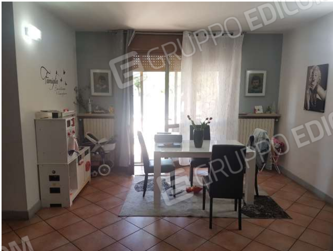
Vista soggiorno con porta finestra d'accesso al portico.