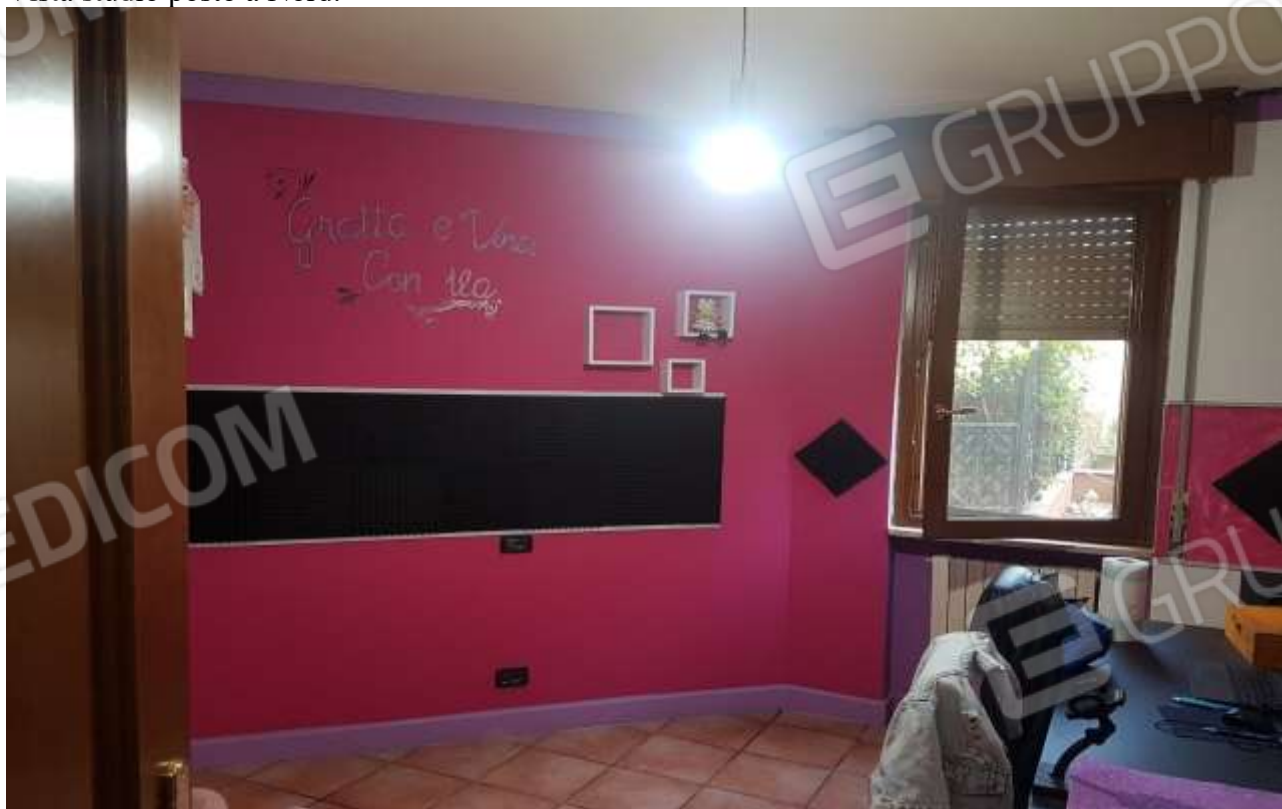
Vista studio posto a Nord.