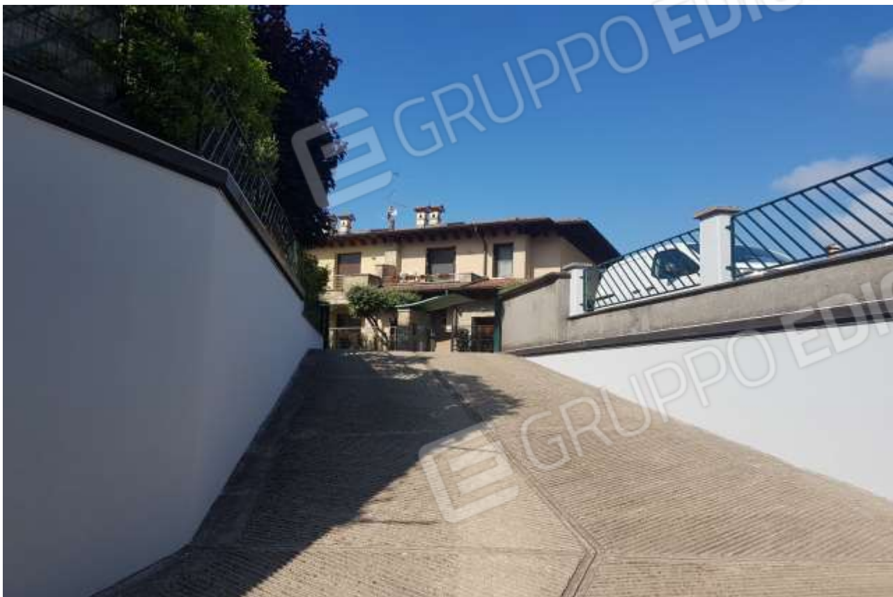
Vista rampa accesso interrato.