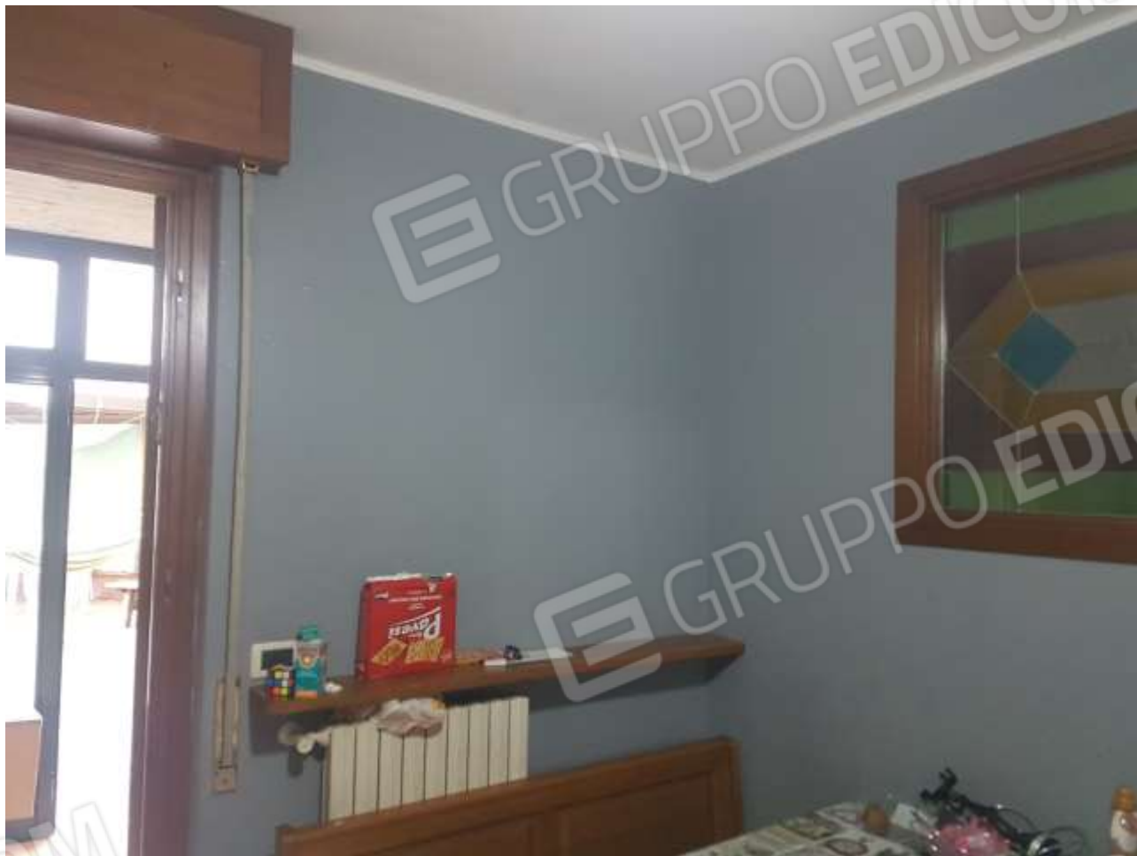
Vista cucina e porta d'accesso al balcone a Nord.