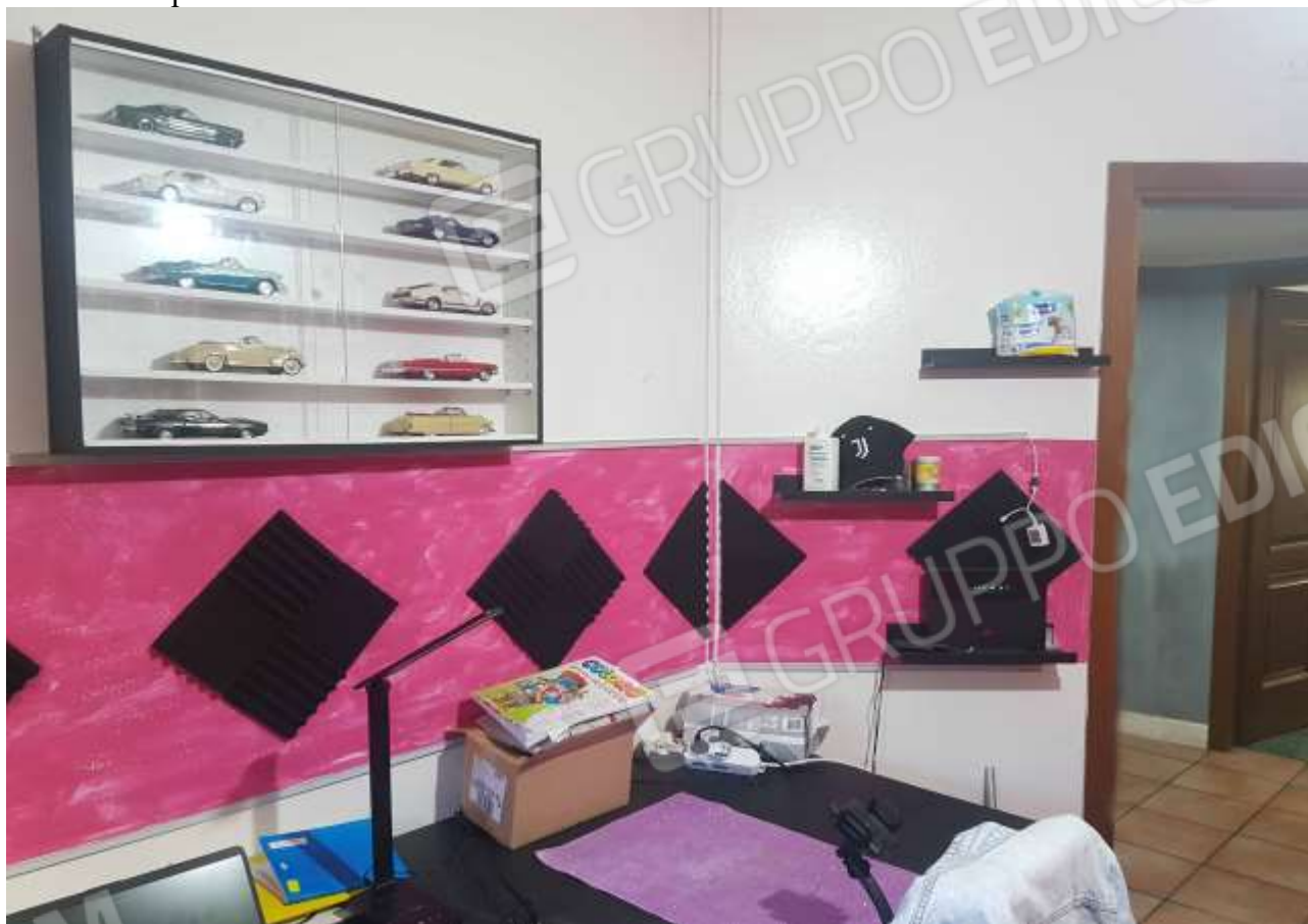
Vista studio posto a Nord.