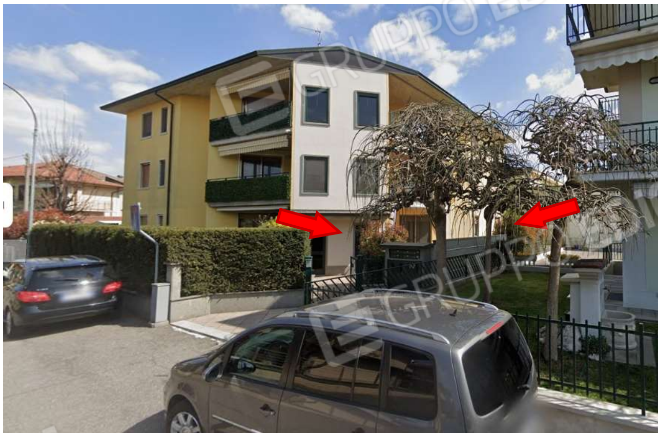
Vista esterna da via Don Donina.