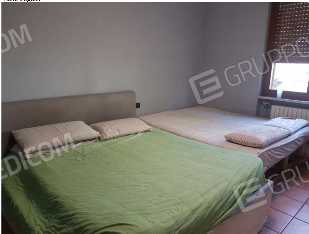
Vista camera posta Sud.