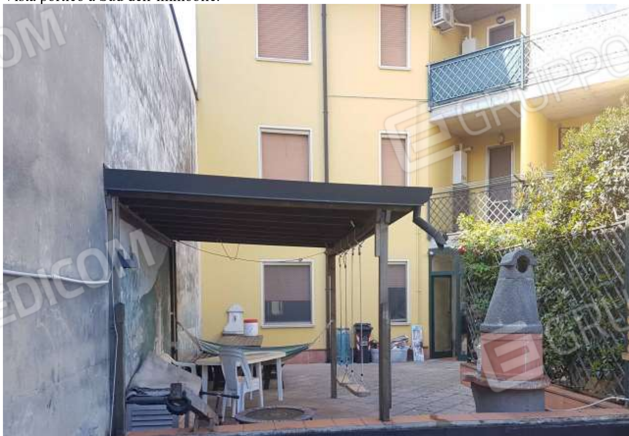
Vista corte esclusiva a Nord dell'immobile.