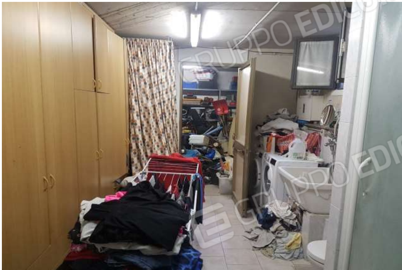
Vista cantina/lavanderia con porta d'accesso all'autorimessa.