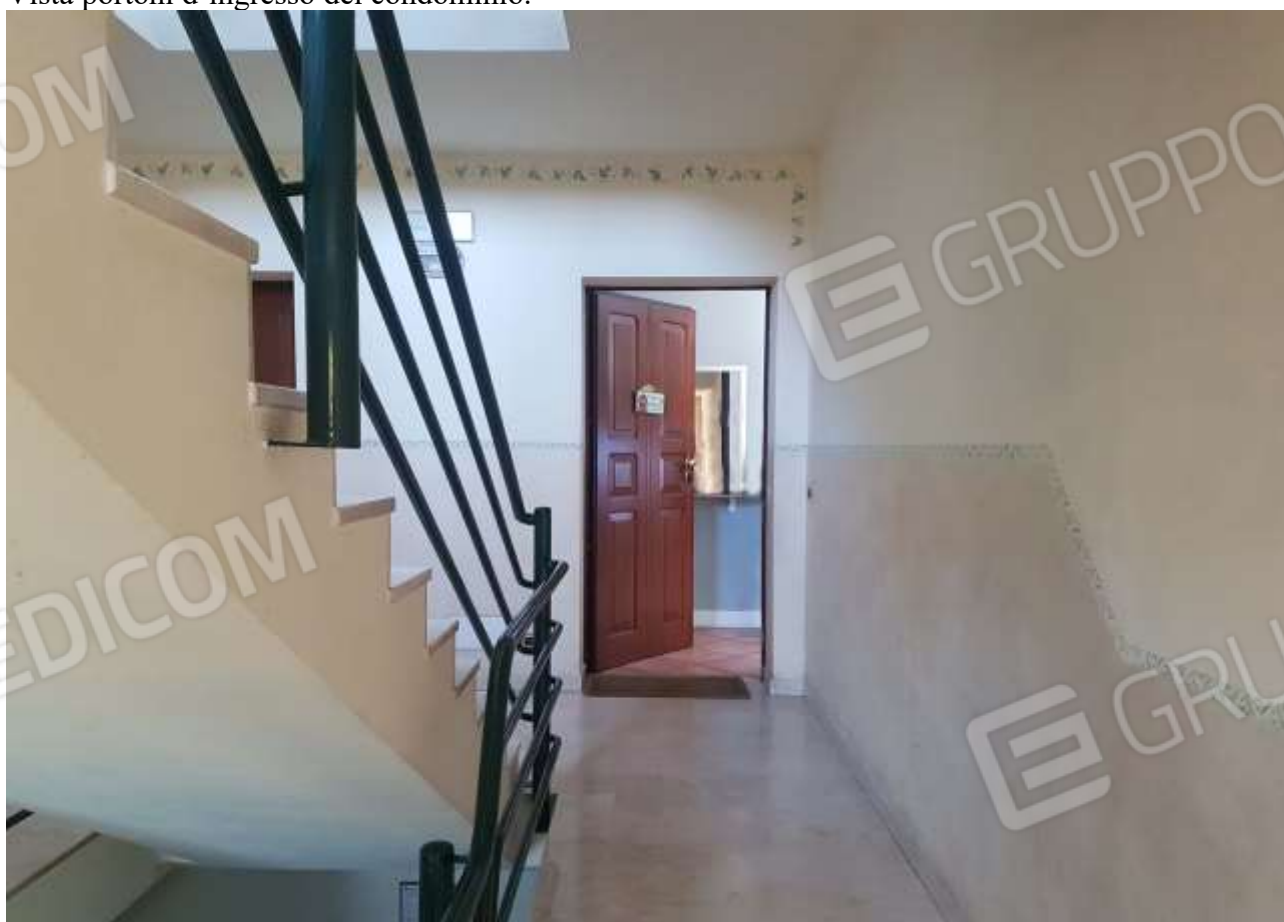
Vista porta d'ingresso dell'immobile.