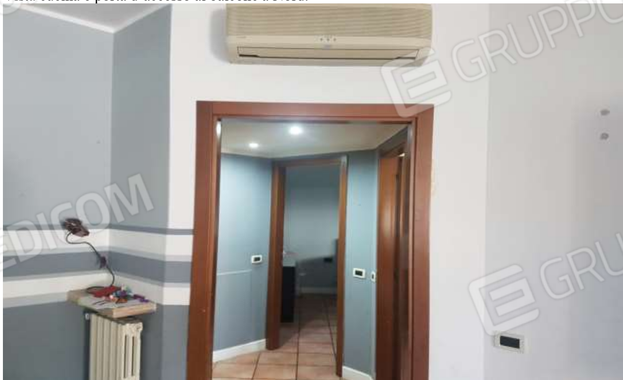
Vista dal soggiorno al disbrigo delle camere e del bagno.