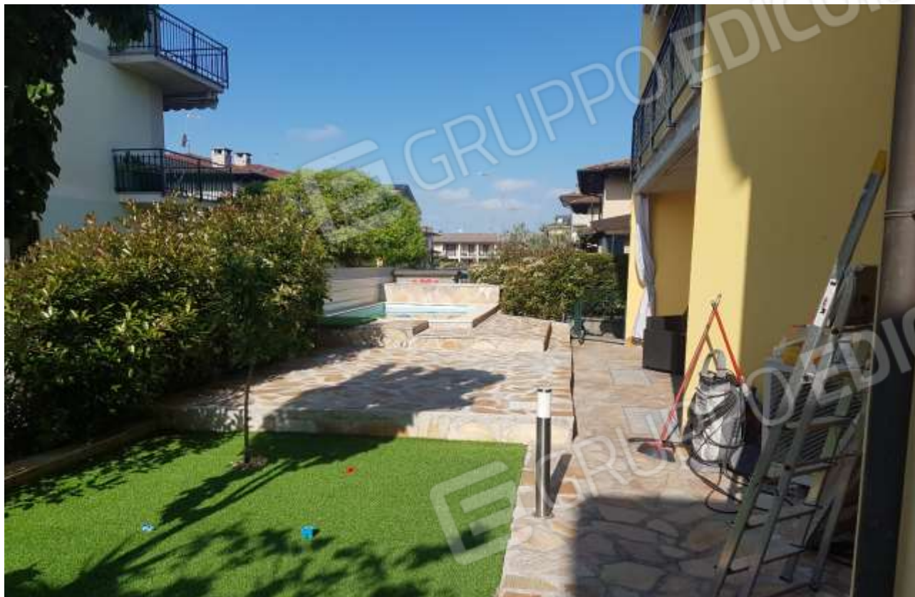
Vista corte esclusiva Sud dell'immobile.