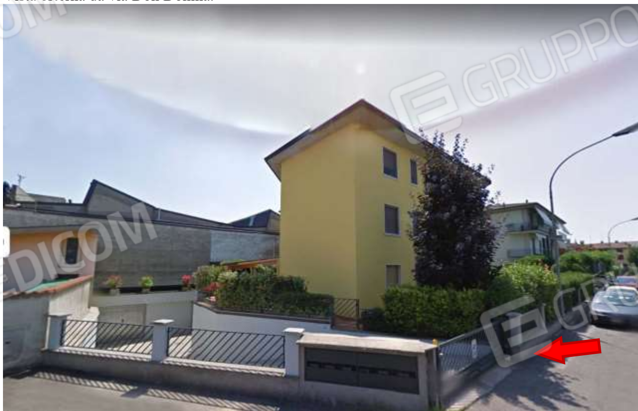
Vista accesso carraio di accesso al corsello interrato dello stabile.