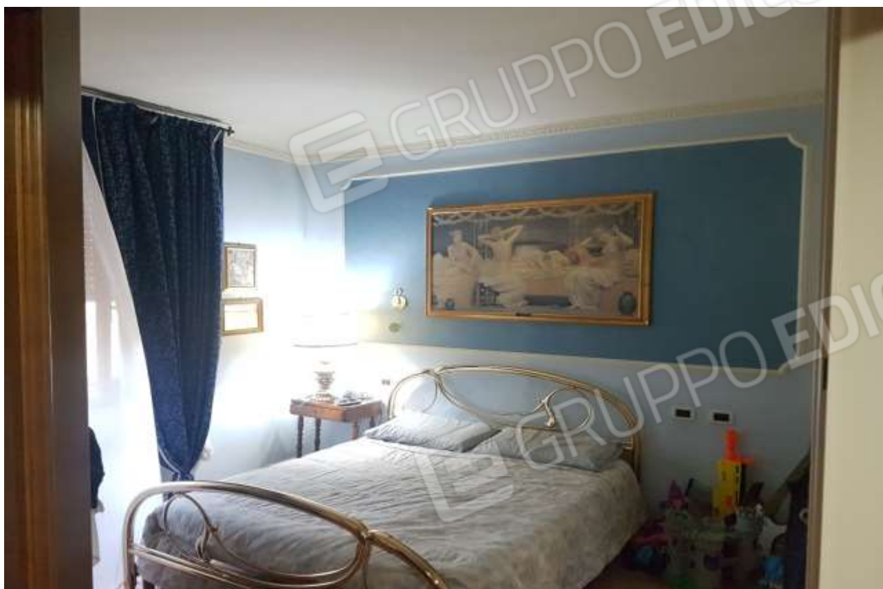
Vista camera posta a Nord.