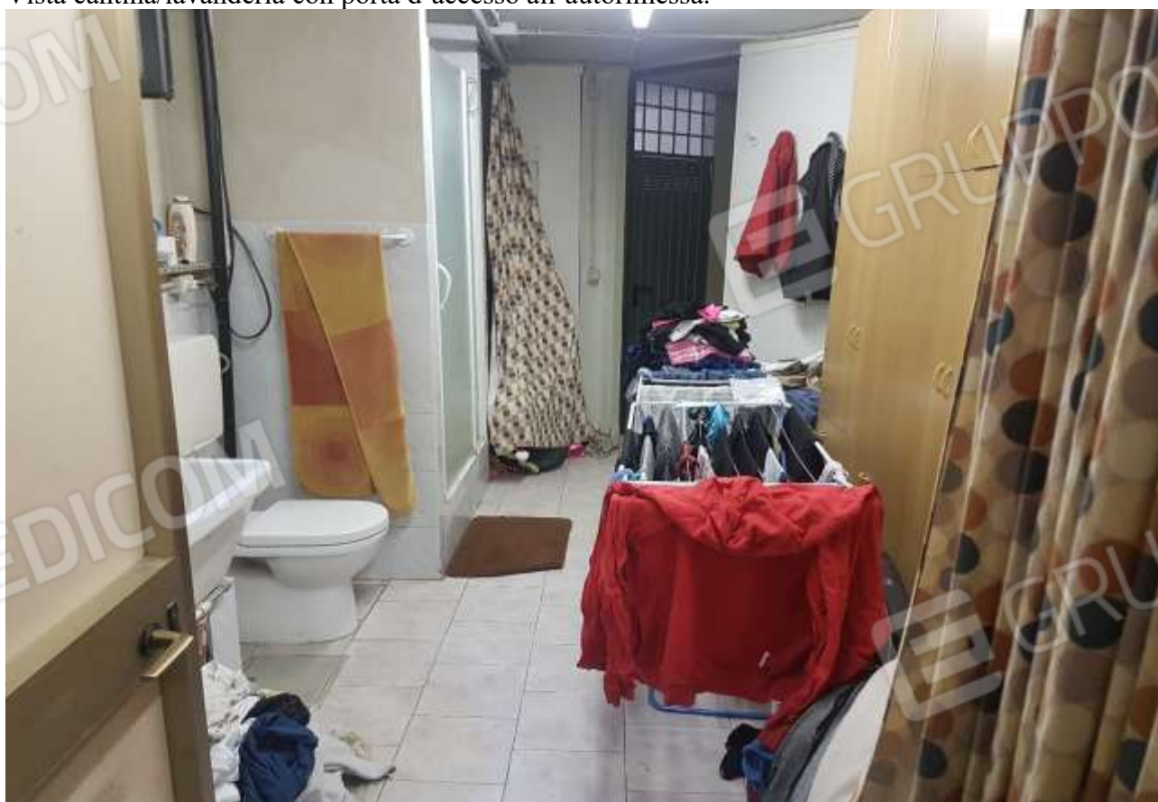
Vista cantina/lavanderia con porta d'accesso da disbrigo condominiale.