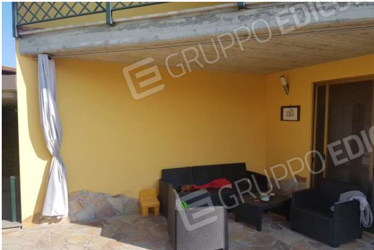
Vista portico a Sud dell'immobile.