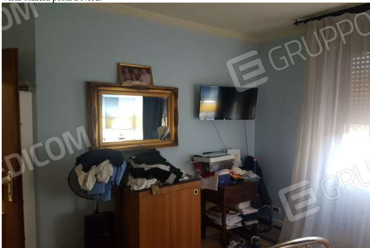
Vista camera posta a Nord.