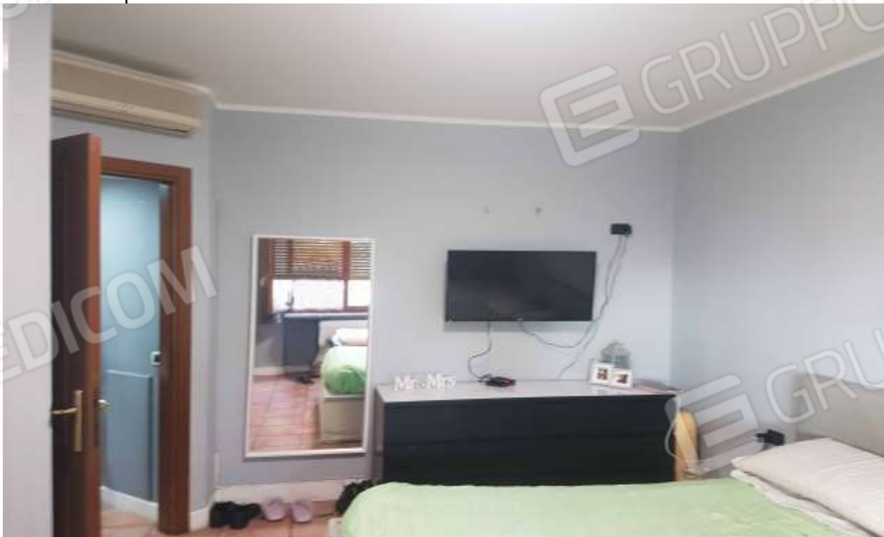
Vista camera posta a Sud.