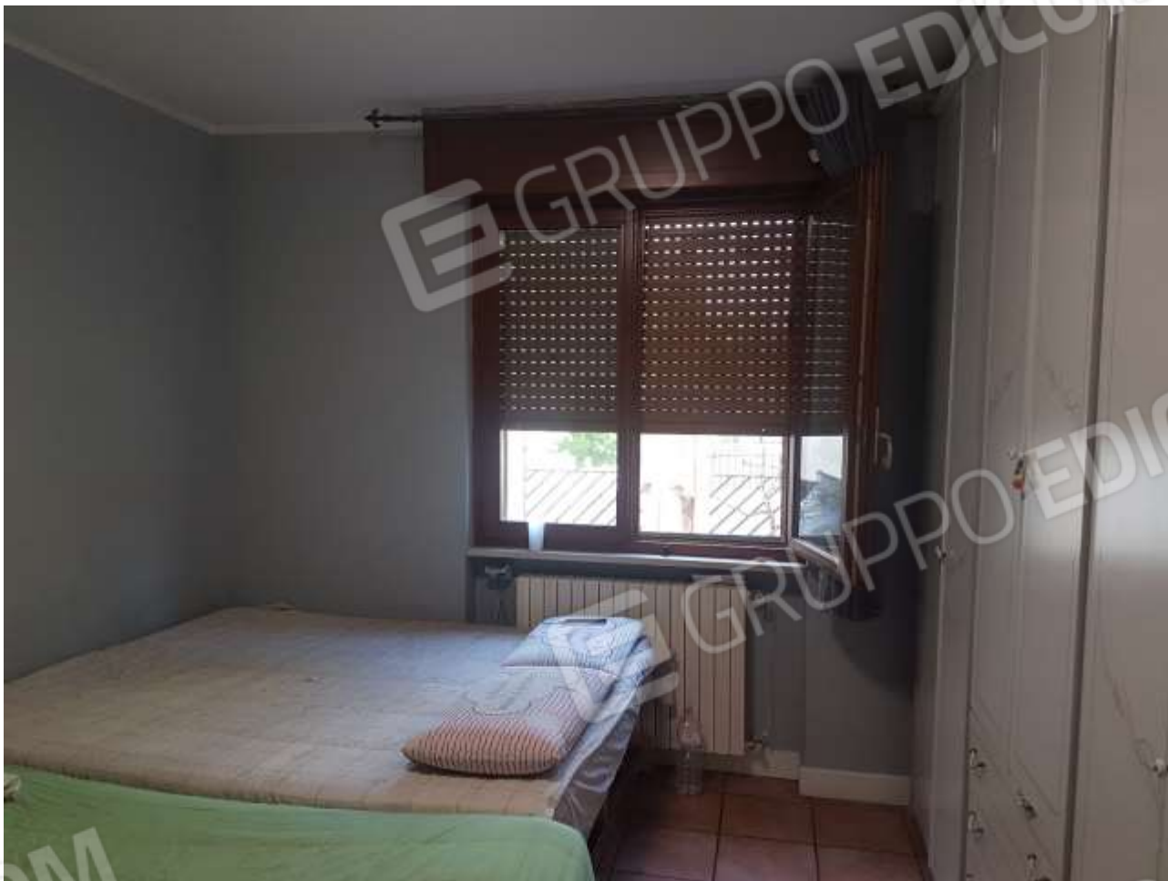
Vista camera posta a Sud.