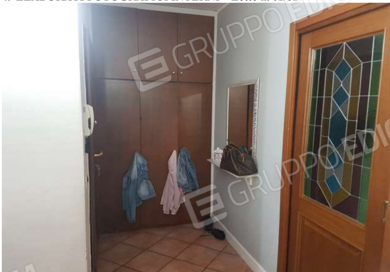
Vista ingresso e porta cucina.