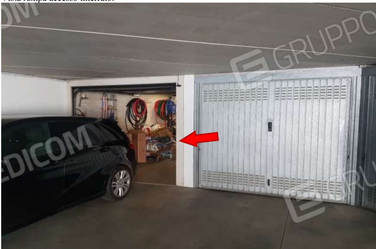
Vista accesso autorimessa.