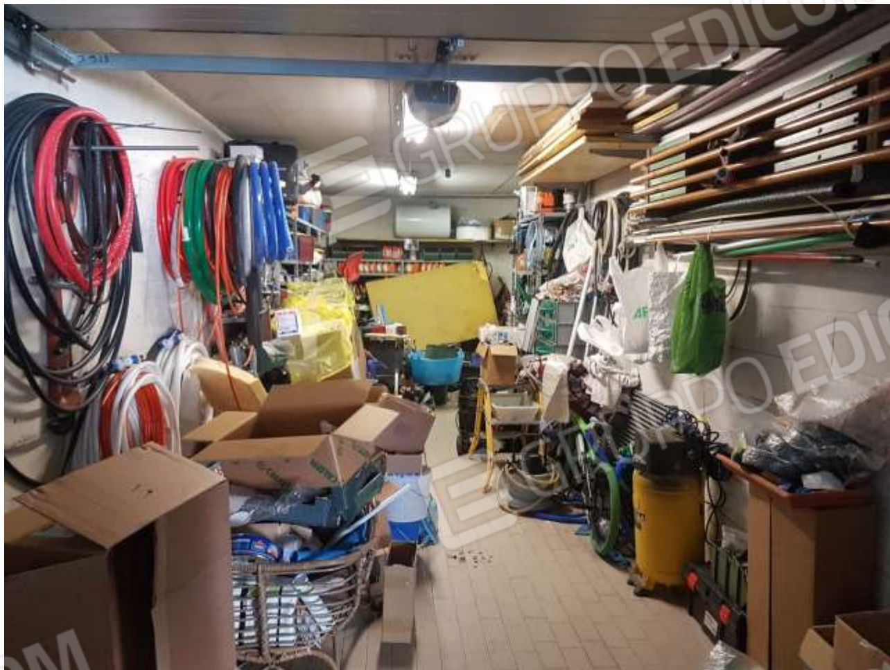
Vista interno autorimessa piano primo interrato.