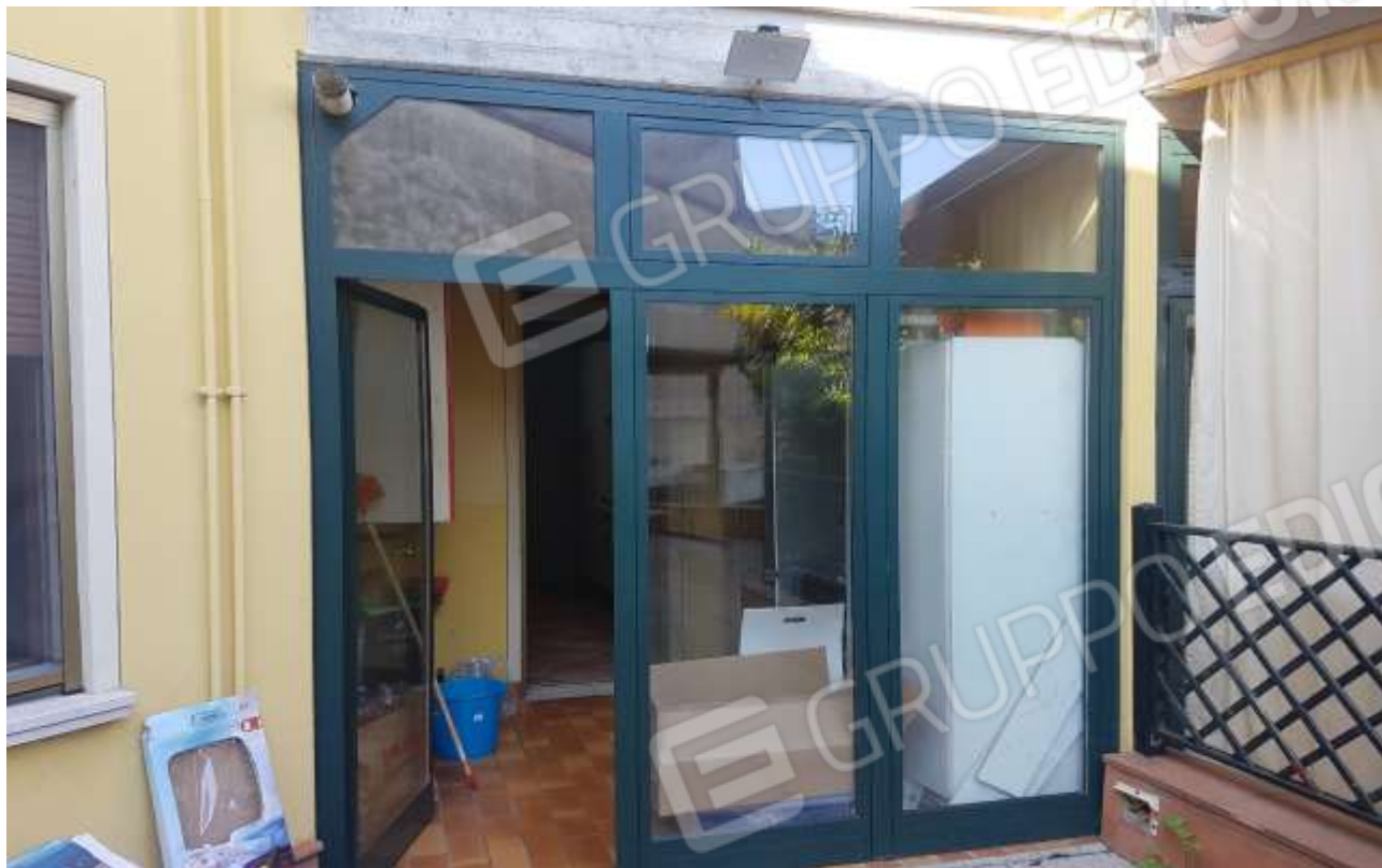
Vista balcone chiuso