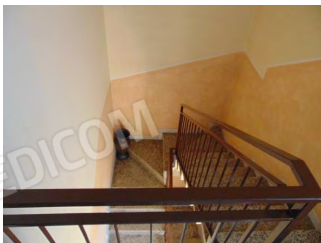
Vano scala comune