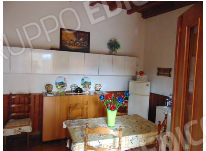
Interno corpo accessorio