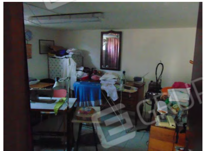
Locale cantina esclusiva