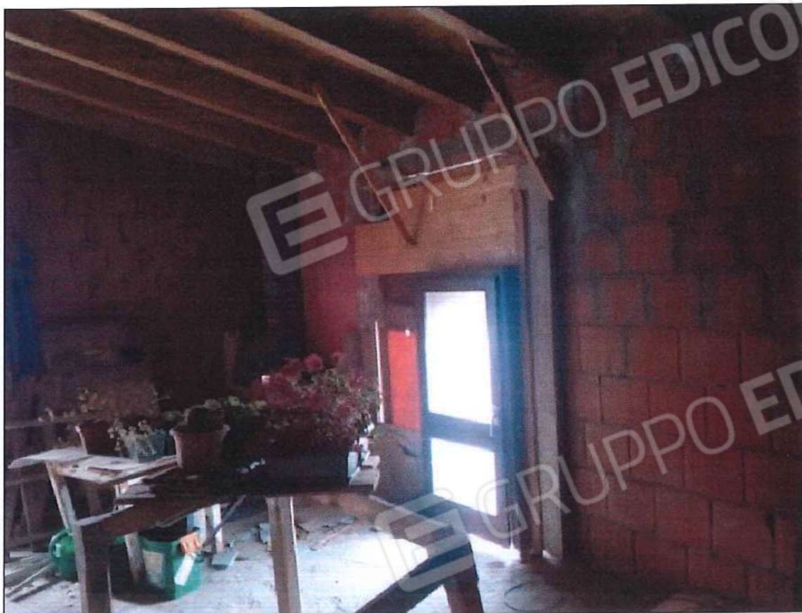
Immobile oggetto di perizia di stima (lotto n. 3) sez. urb. NCT, foglio n. 25, particella 632, sub. n. 3