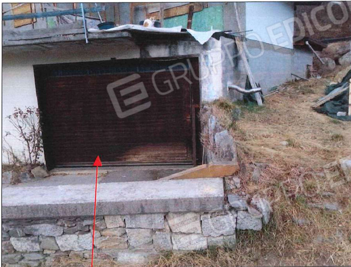
Ingresso magazzino piano terra immobile oggetto di stima sez. urb. NCT, foglio n. 25, particella n. 632, sub. n. 2 (lotto n. 2)