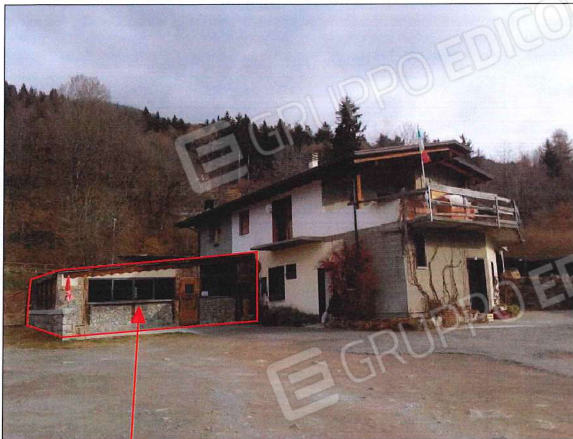
Parte di edificio realizzato senza autorizzazioni edilizie ed in parte costruito sulla proprietà comunale