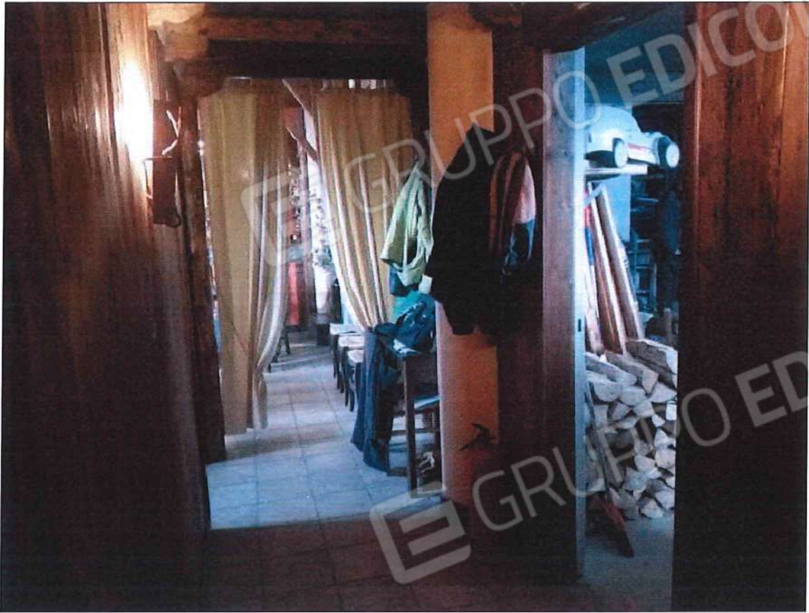
Immobile oggetto di perizia di stima (lotto n. 1) sez. urb. NCT, foglio n. 25, particella 632, sub. n. 1