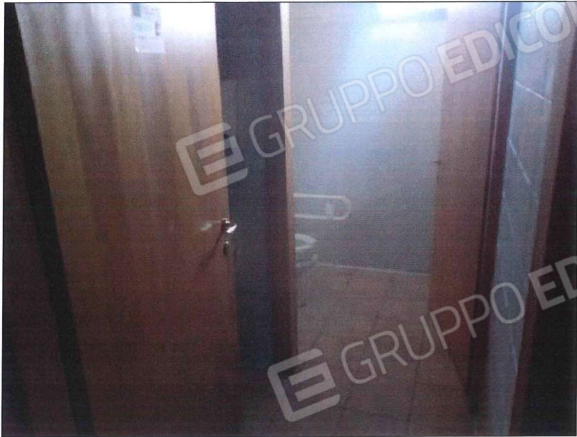
Immobile oggetto di perizia di stima (lotto n. 1) sez. urb. NCT, foglio n. 25, particella 632, sub. n. 1