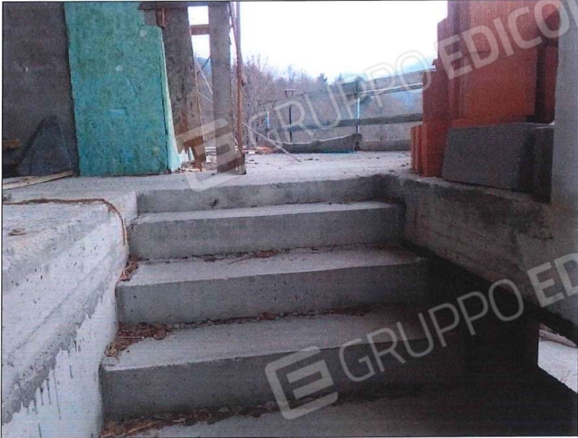
Accesso all'immobile oggetto di perizia di stima (lotto n. 3) sez. urb. NCT, foglio n. 25, particella 632, sub. n. 3