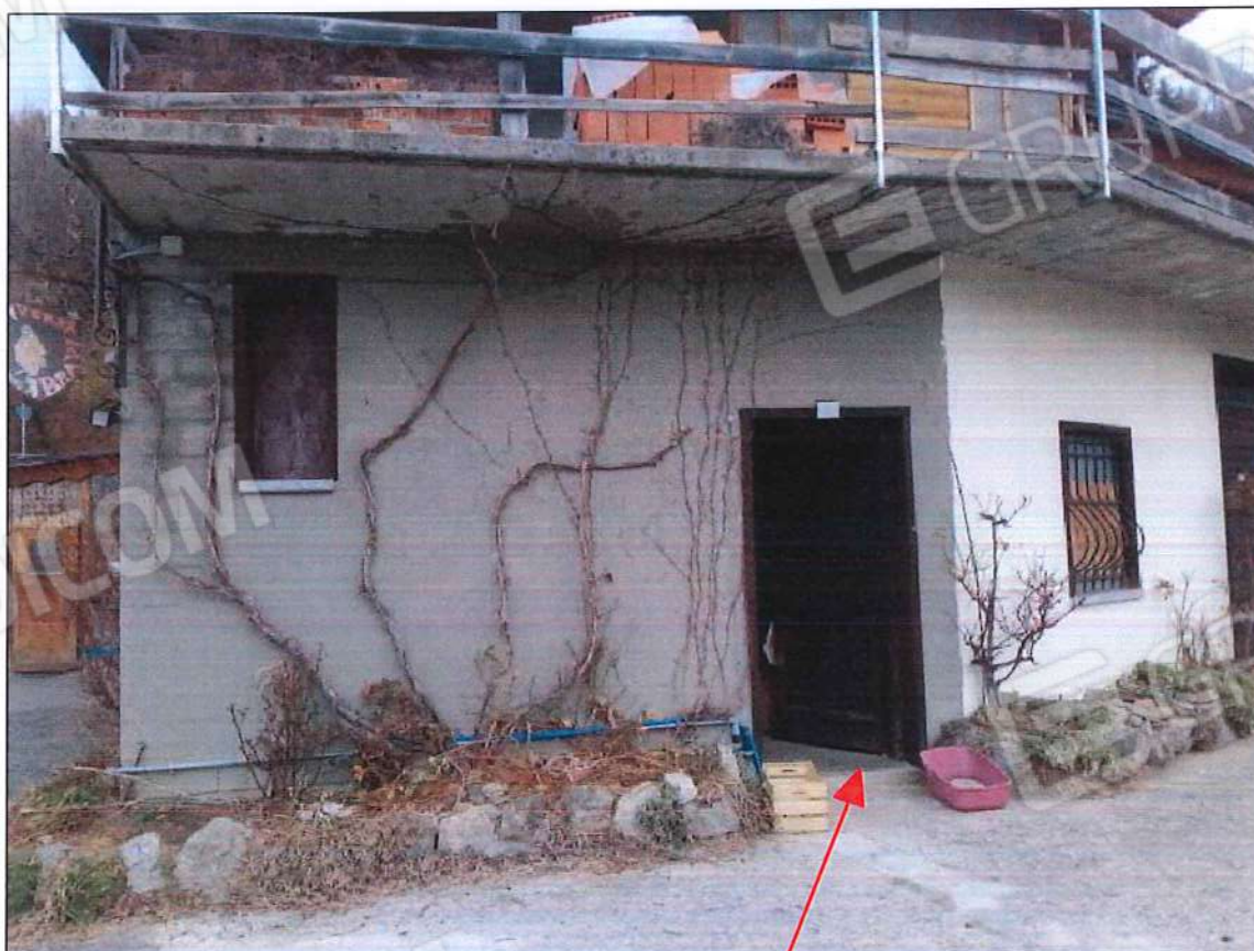
Ingresso unità immobiliare in corso di costruzione piano primo immobile oggetto di stima, sez. urb. NCT, foglio n. 25, particella n. 632, sub. n. 3 (lotto n. 3)