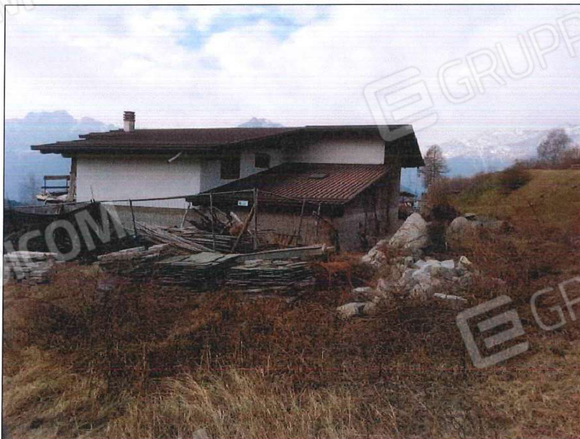
PROSPETTO EST E NORD