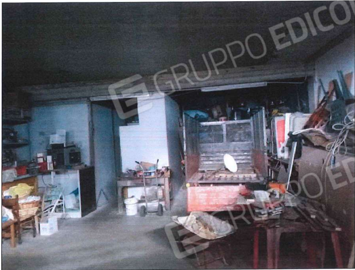
Immobile oggetto di perizia di stima (lotto n. 2) sez. urb. NCT, foglio n. 25, particella 632, sub. n. 2