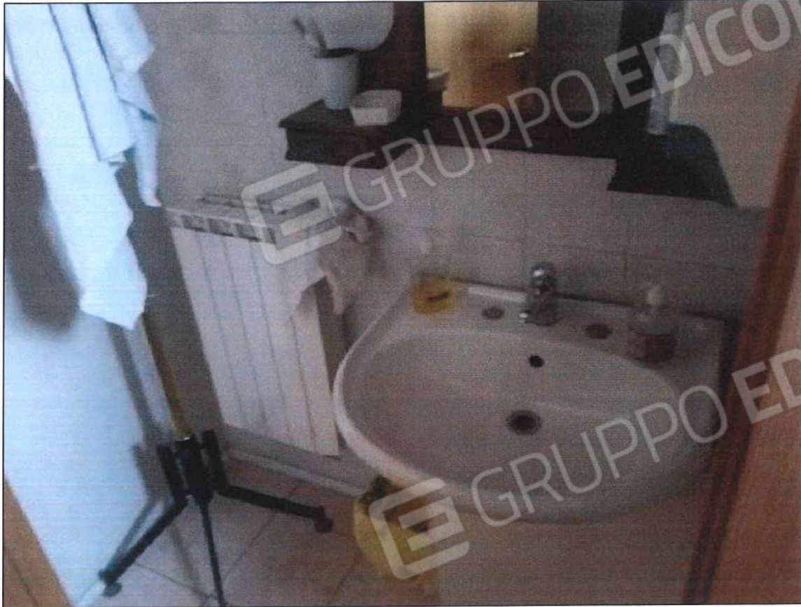
Immobile oggetto di perizia di stima (lotto n. 1) sez. urb. NCT, foglio n. 25, particella 632, sub. n. 1