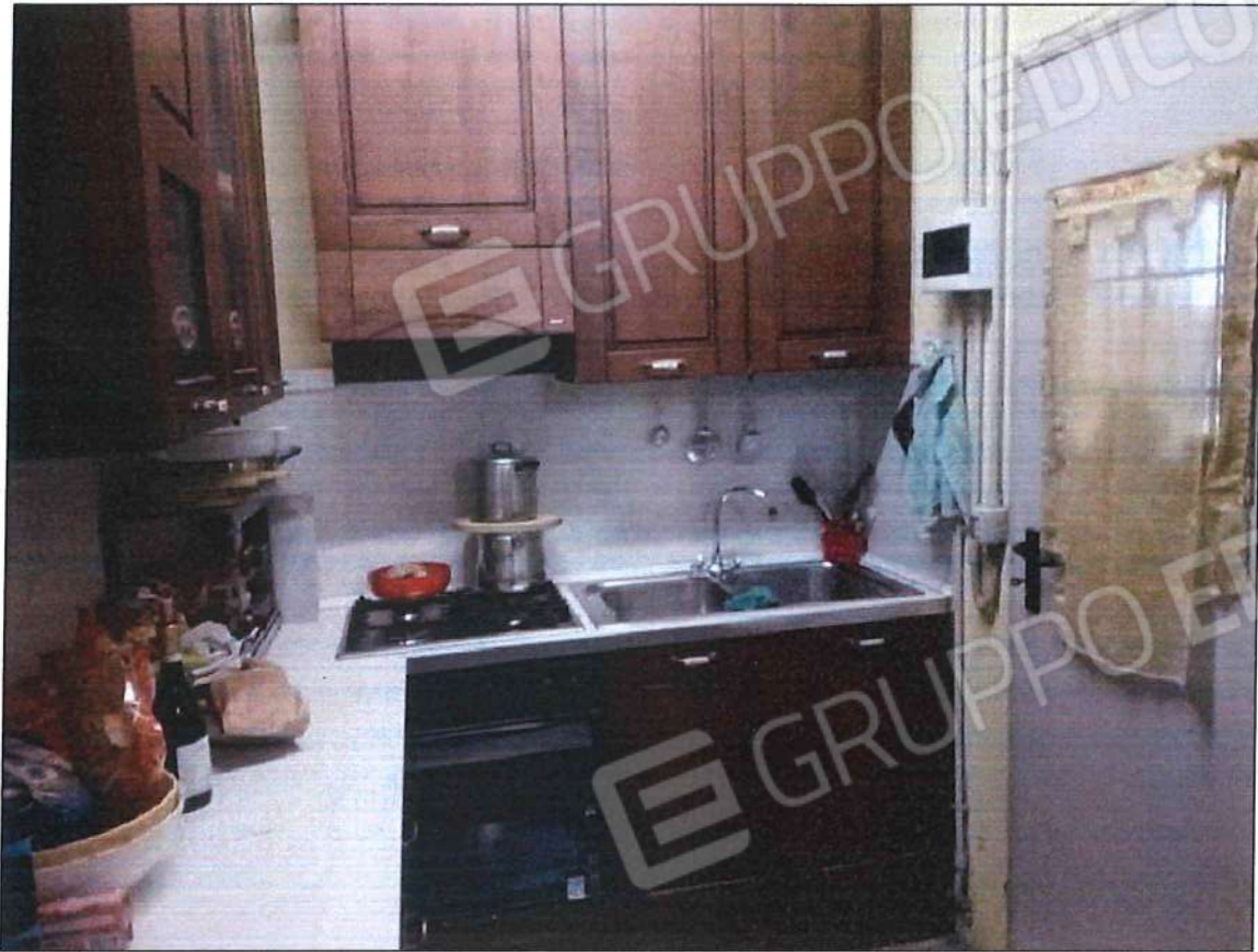
Immobile oggetto di perizia di stima opere interne realizzate senza autorizzazione edilizia sez. urb. NCT, foglio n. 25, particella 632, sub. n. 2