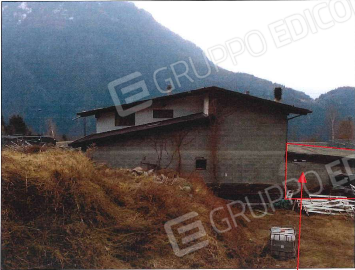
Parte di edificio realizzato senza autorizzazioni edilizie e in parte costruito sulla proprietà comunale