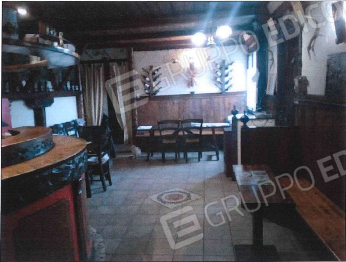
Immobile oggetto di perizia di stima (lotto n. 1) sez. urb. NCT, foglio n. 25, particella 632, sub. n. 1