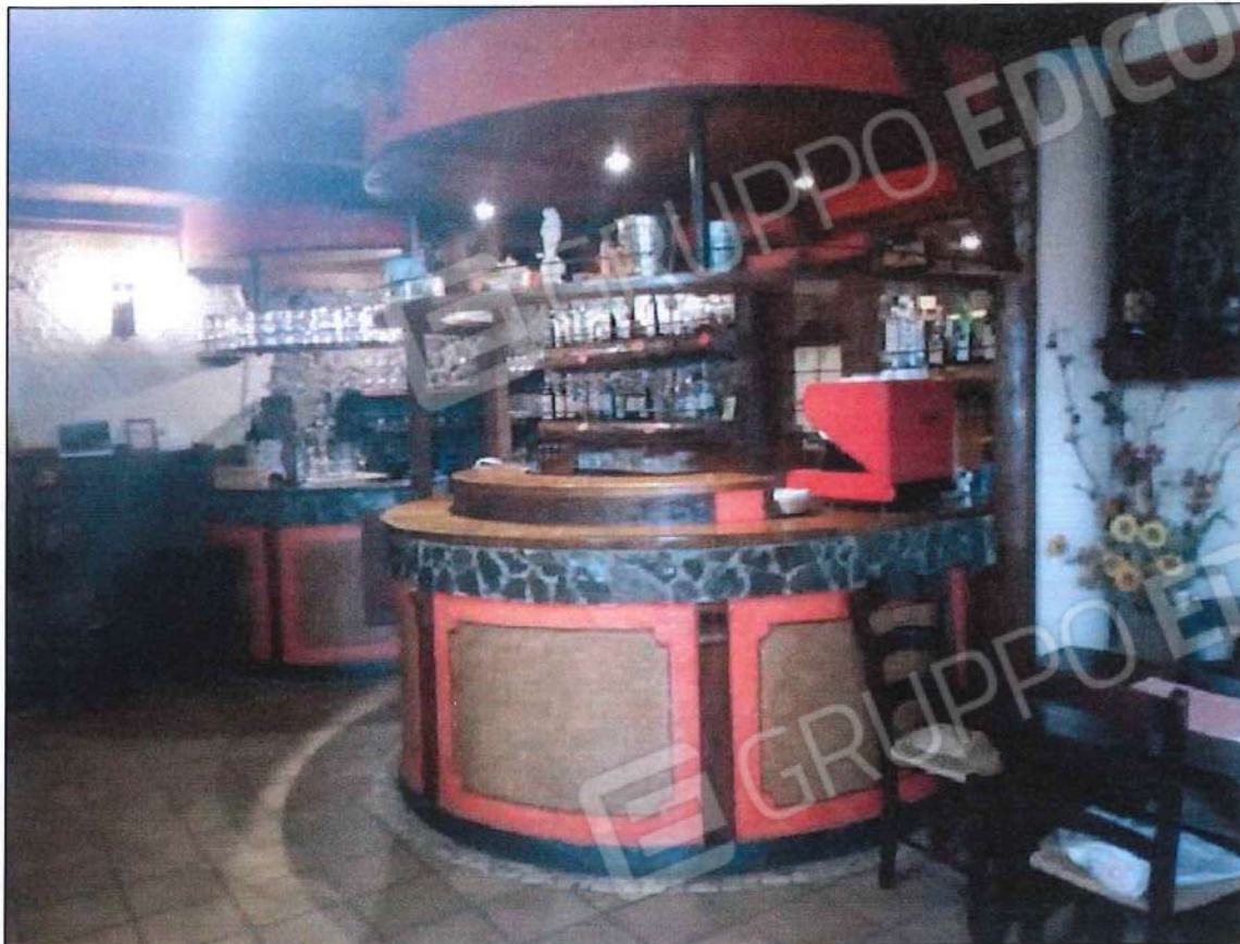
Immobile oggetto di perizia di stima (lotto n. 1) sez. urb. NCT, foglio n. 25, particella 632, sub. n. 1