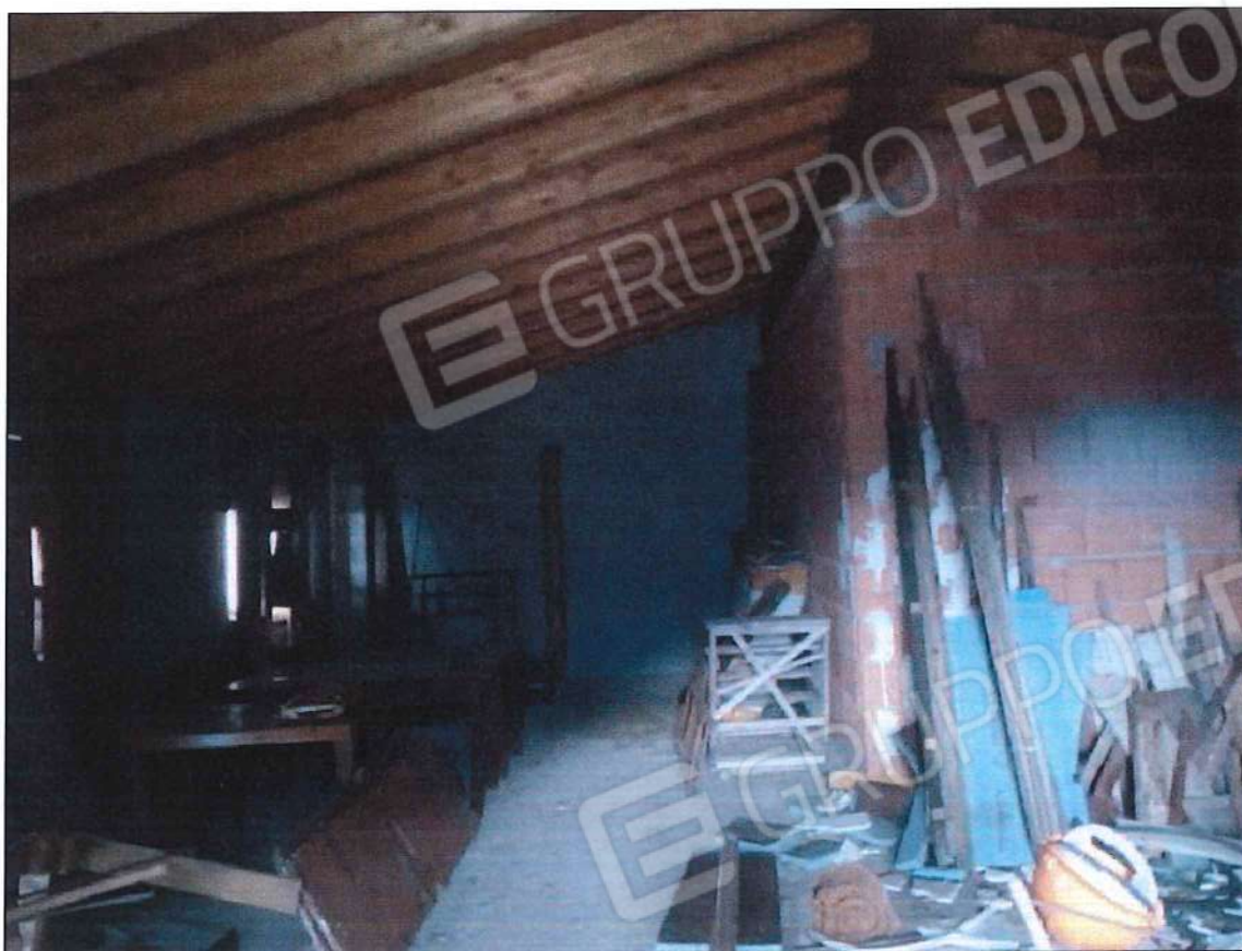
Immobile oggetto di perizia di stima (lotto n. 3) sez. urb. NCT, foglio n. 25, particella 632, sub. n. 3