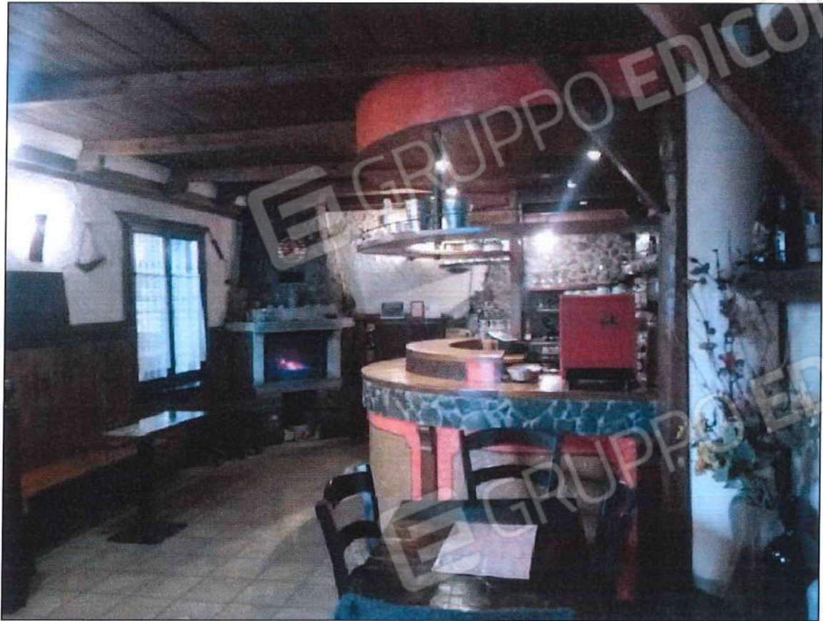
Immobile oggetto di perizia di stima (lotto n. 1) sez. urb. NCT, foglio n. 25, particella 632, sub. n. 1