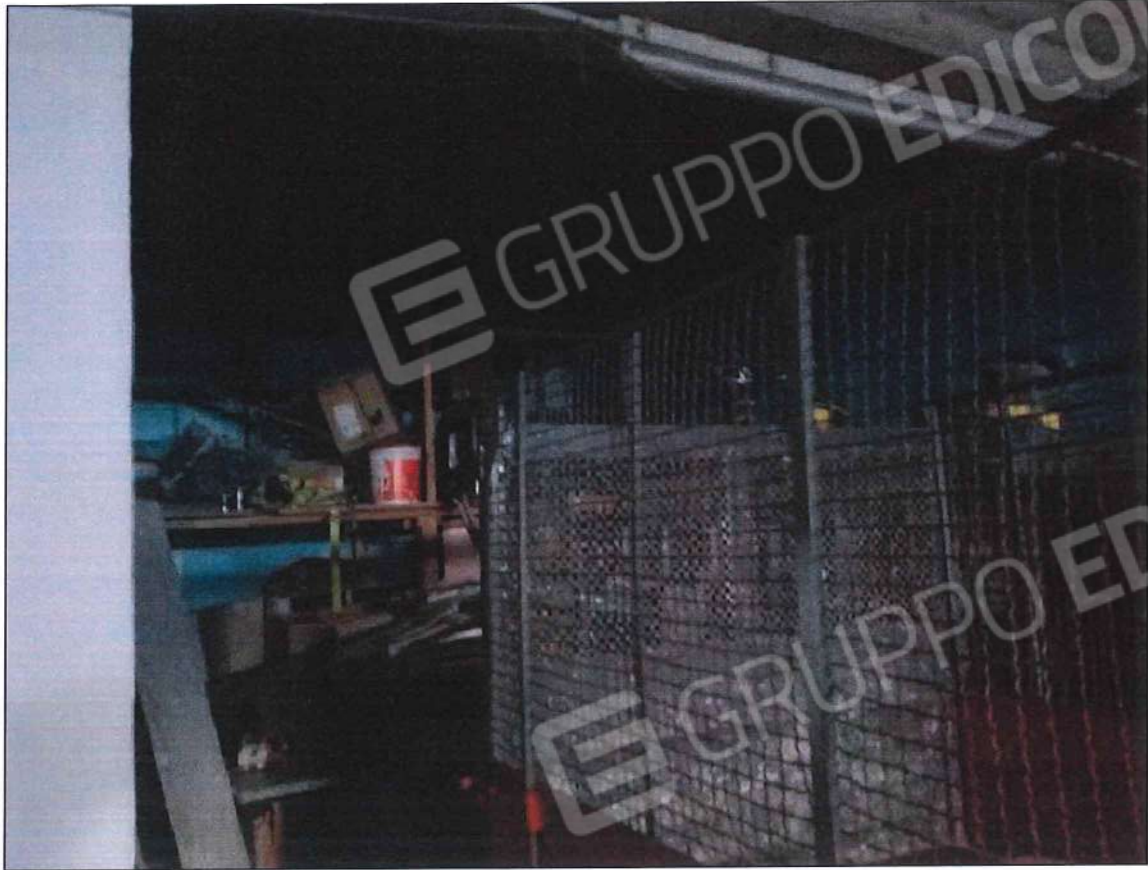
Immobile oggetto di perizia di stima (lotto n. 2) sez. urb. NCT, foglio n. 25, particella 632, sub. n. 2