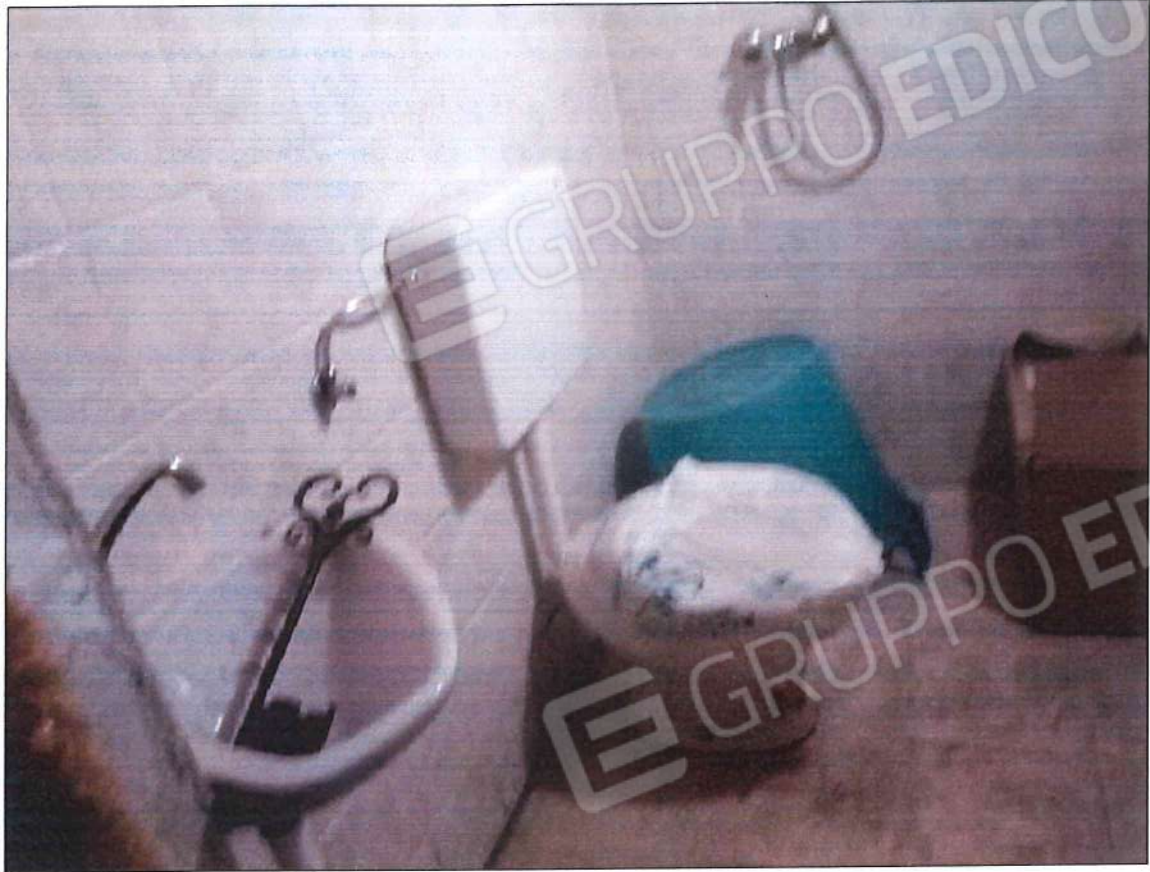
Immobile oggetto di perizia di stima opere interne realizzate senza autorizzazione edilizia sez. urb. NCT, foglio n. 25, particella 632, sub. n. 2