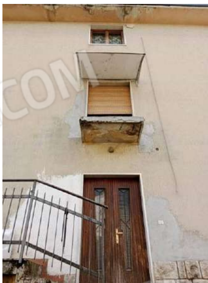
Fig. 23: Accesso al vano scale comune dalla corte