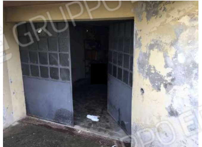
Fig. 22: Ingresso all'autorimessa