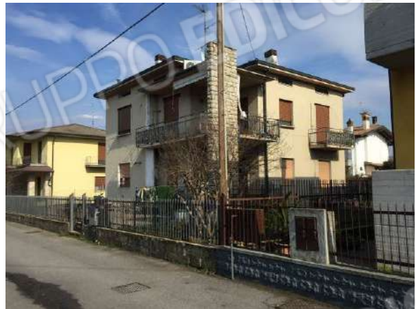
Fig. 04: Vista del fabbricato da Sud-Ovest da via Ortigara