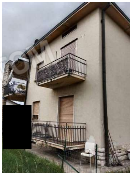
Fig. 07: Prospetto sud