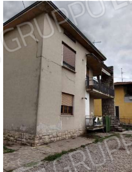
Fig. 06: Prospetto Ovest