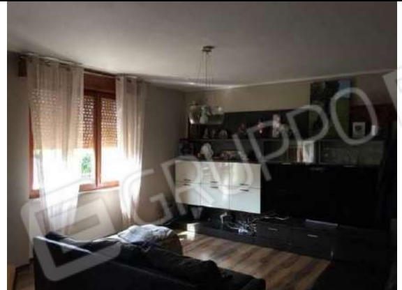
Fig. 16: Soggiorno