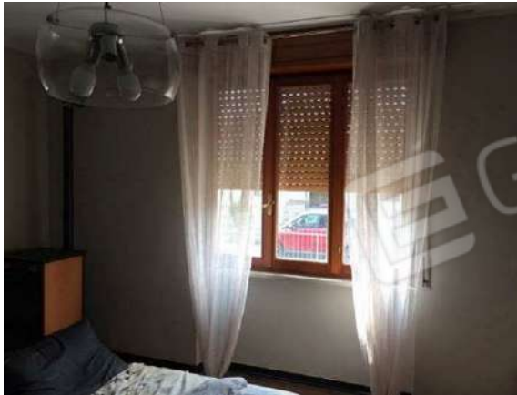
Fig. 19: Camera