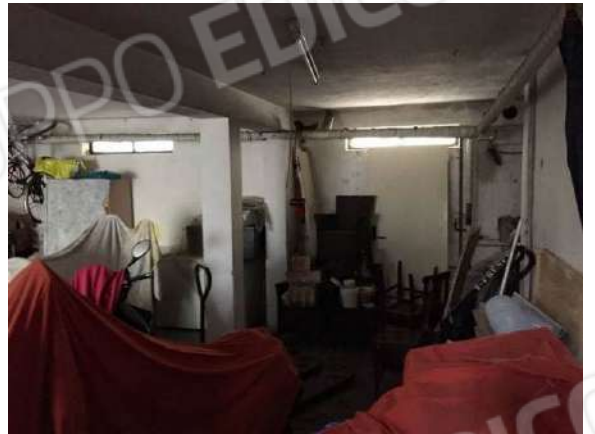
Fig. 20: Autorimessa seminterrata