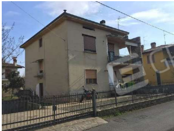
Fig. 03: Vista del fabbricato da Nord-Ovest da via Ortigara