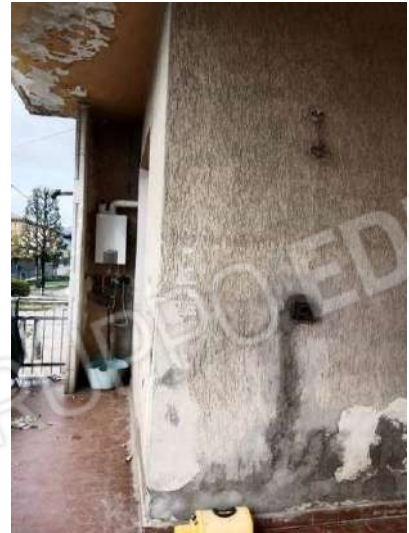
Fig. 14: Portico esclusivo