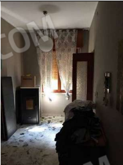
Fig. 17: Corridoio