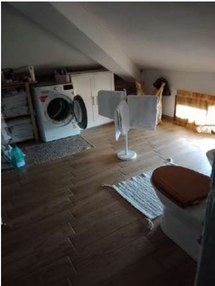
Fig. 27: Bagno lavanderia piano sottotetto/soffitta (trasformato in abitazione)