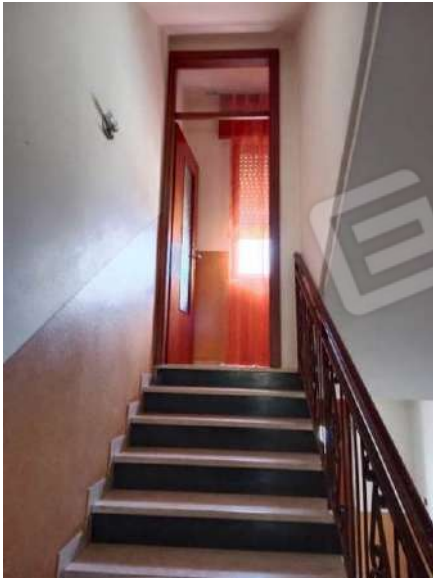
Fig. 25: Scala comune con accesso precluso