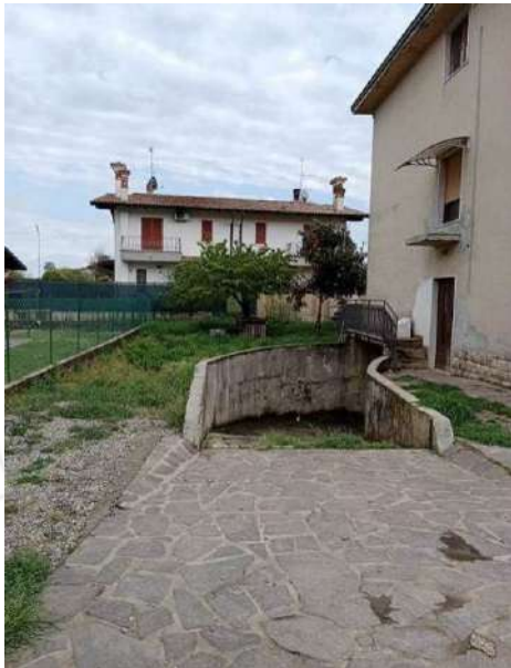
Fig. 05: Prospetto Nord con scivolo di accesso al piano interrato