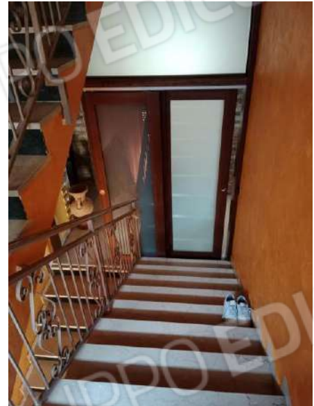
Fig. 26: Scala comune piano primo con accesso precluso al piano sottotetto