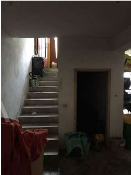
Fig. 21: Piano seminterrato