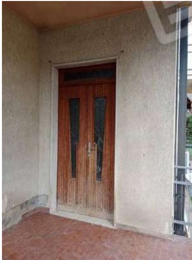
Fig. 13: Ingresso esclusivo all'abitazione dal portico