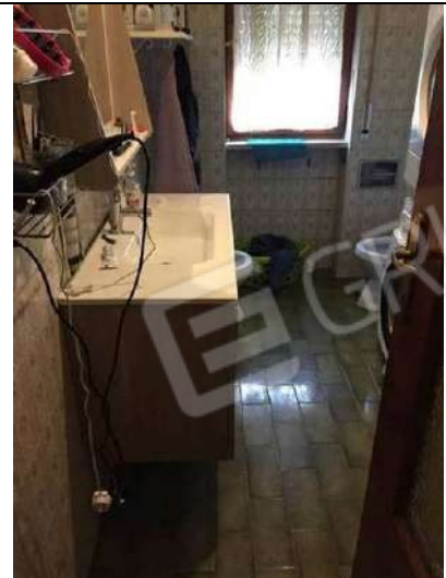
Fig. 18: Bagno