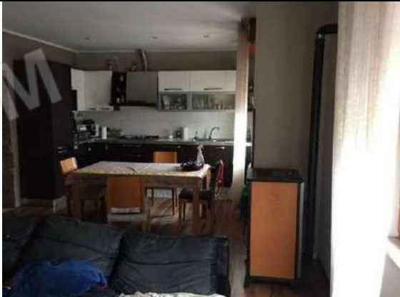
Fig. 15: Soggiorno /cucina