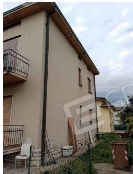
Fig. 08: Prospetto est