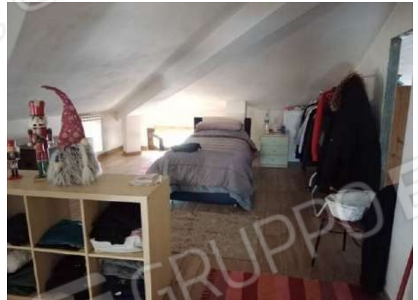
Fig. 28: Sottotetto/soffitta comune (trasformata in abitazione)