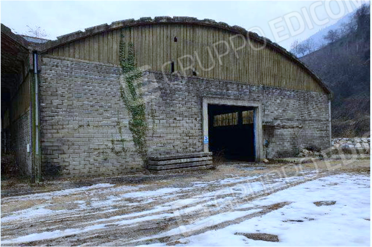
Immagine 7 – Vista verso Sud-Ovest - area deposito vuoti - capannone chiuso.