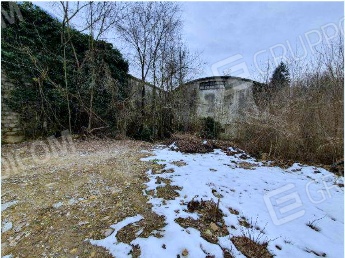
Immagine 71 - Terreno.