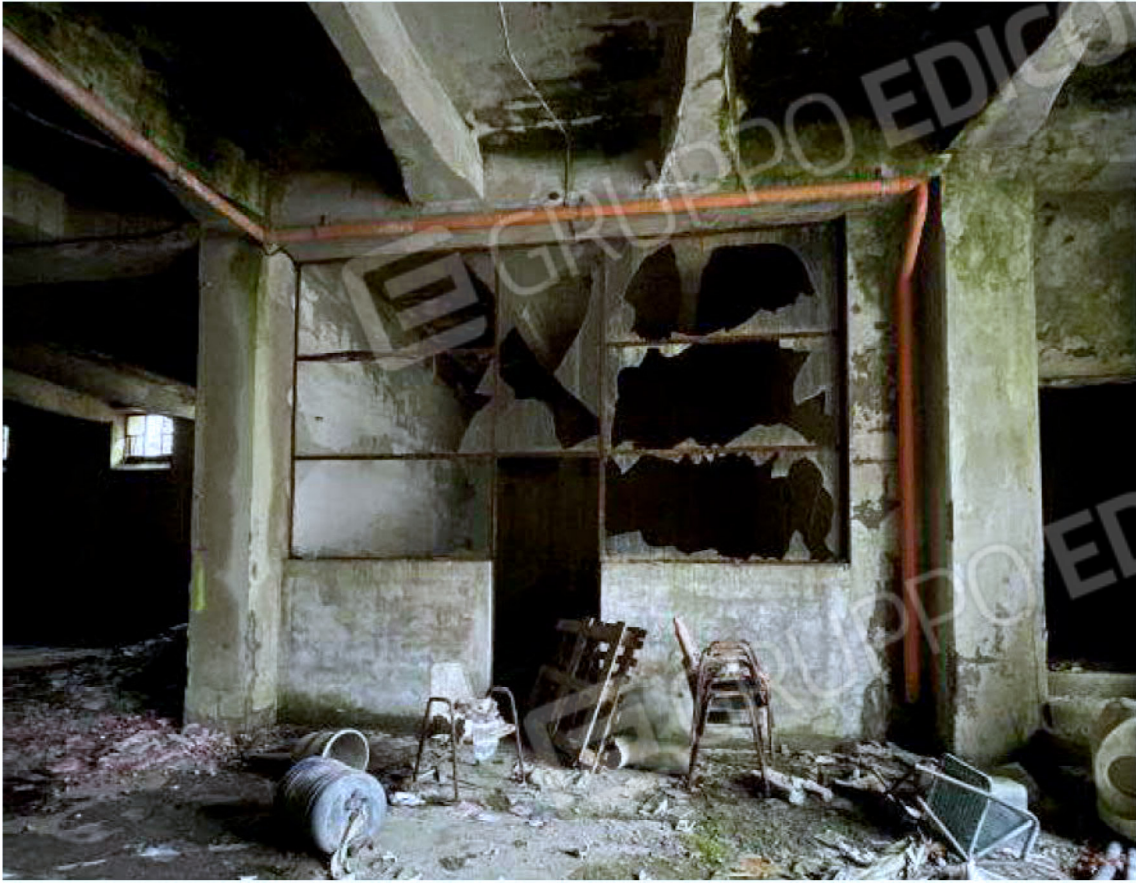
Immagine 49 – Piano Sottostrada - Area magazzino.