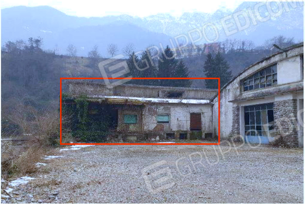
Immagine 33 – Vista verso Sud-Ovest - in evidenza l'area magazzino- zona uffici al Piano Rialzato.