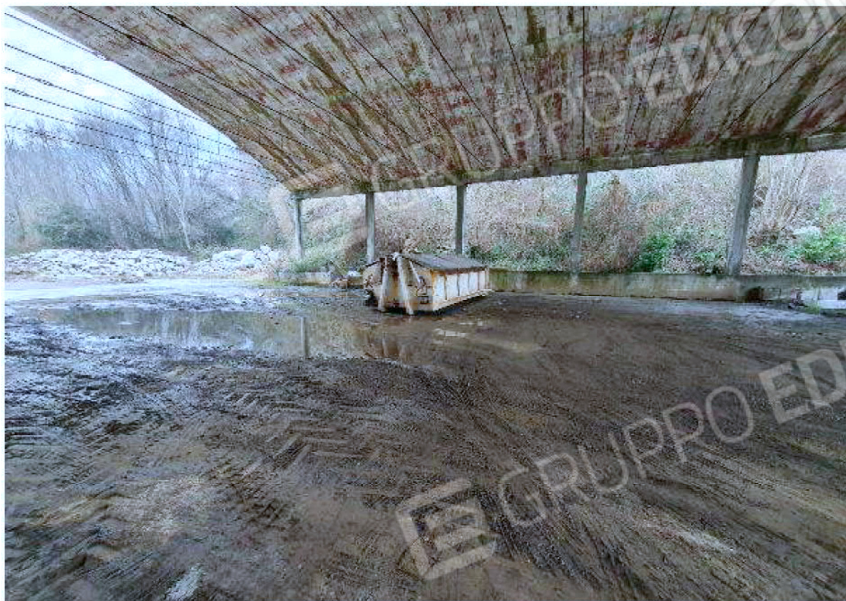
Immagine 5 – area deposito vuoti - capannone aperto.