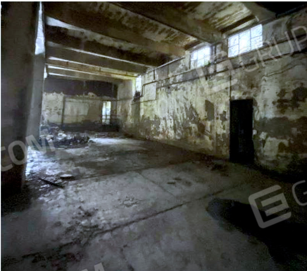
Immagine 60 – Piano Sottostrada - Area magazzino.