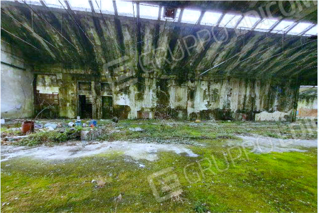
Immagine 13 – area reparti di confezione – stoccaggio e consegna.