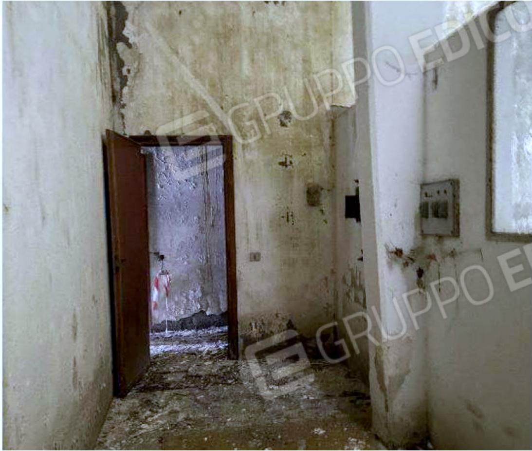
Immagine 31 – Piano rialzato - Area magazzino - Zona uffici.