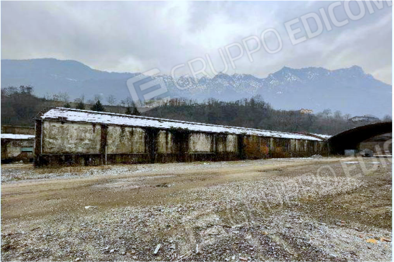
Immagine 11 – Vista verso Sud-Ovest - area reparti di confezione – stoccaggio e consegna.