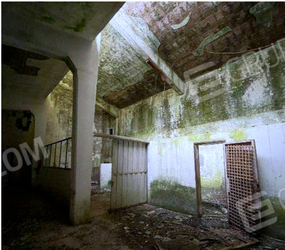
Immagine 30 – Piano rialzato - Area magazzino - Zona uffici (locale non presente sulle planimetrie).