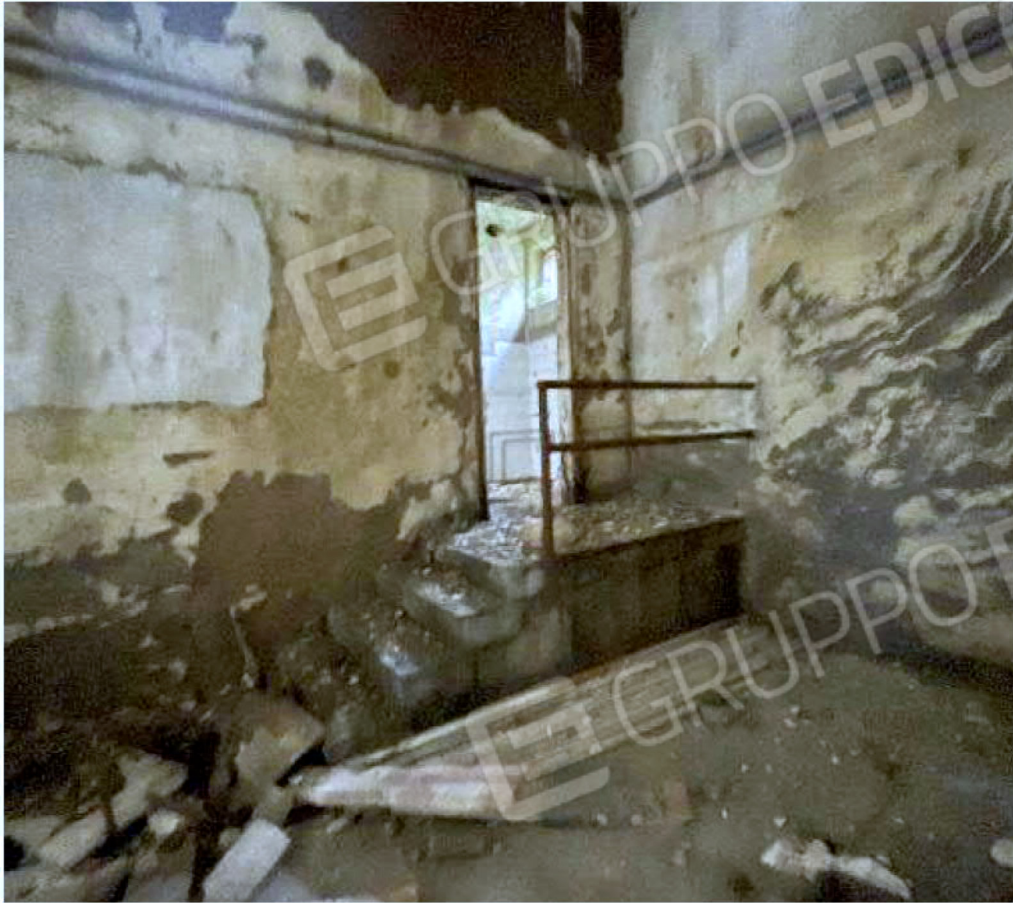
Immagine 62 – Piano Sottostrada - Area magazzino.