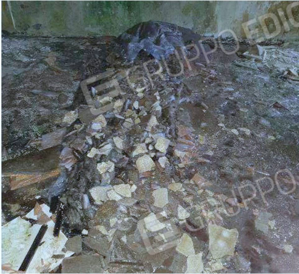
Immagine 41 – Piano rialzato - Area magazzino - Zona uffici Materiale derivante da buco nella soletta.