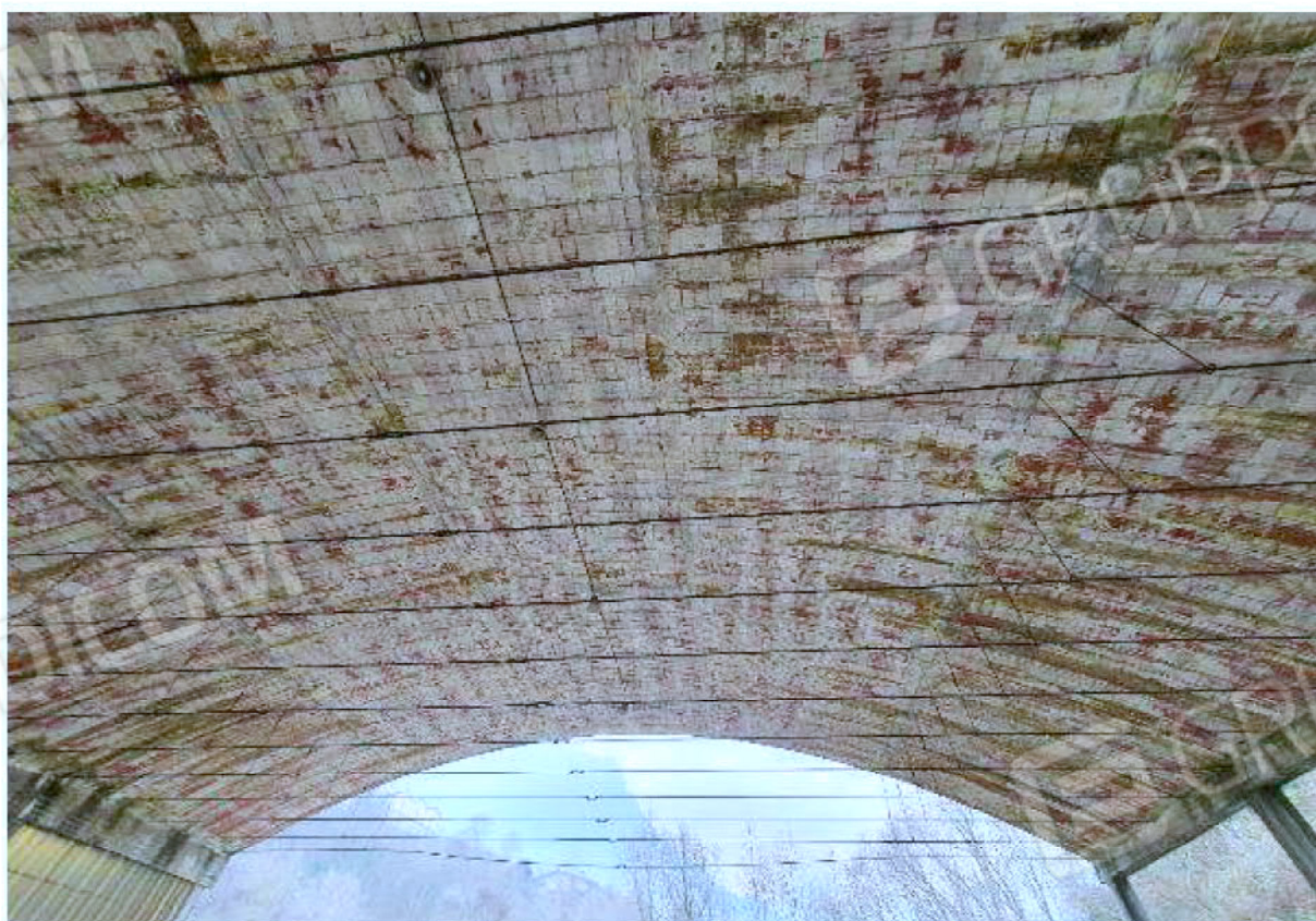
Immagine 6 – Vista copertura - area deposito vuoti - capannone aperto.