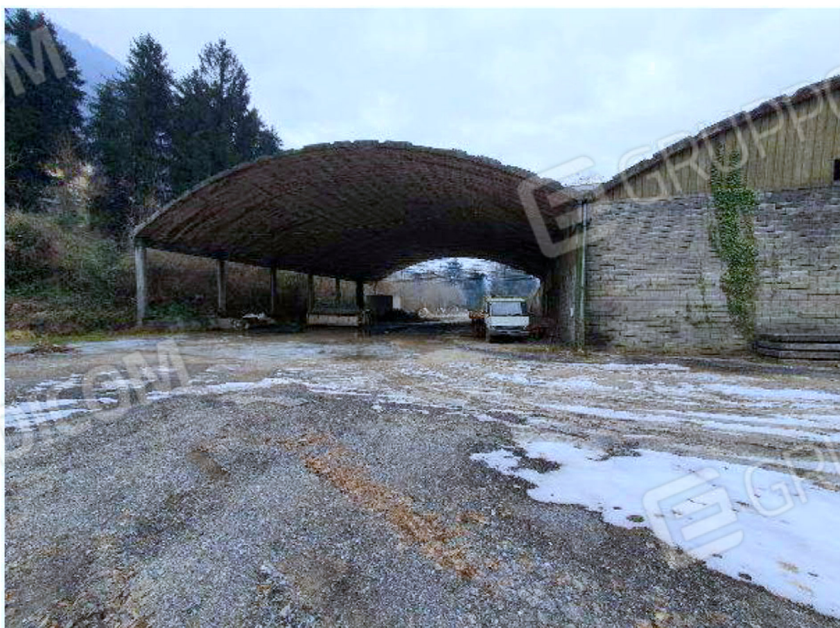
Immagine 4 – Vista verso Sud-Ovest - area deposito vuoti - capannone aperto.