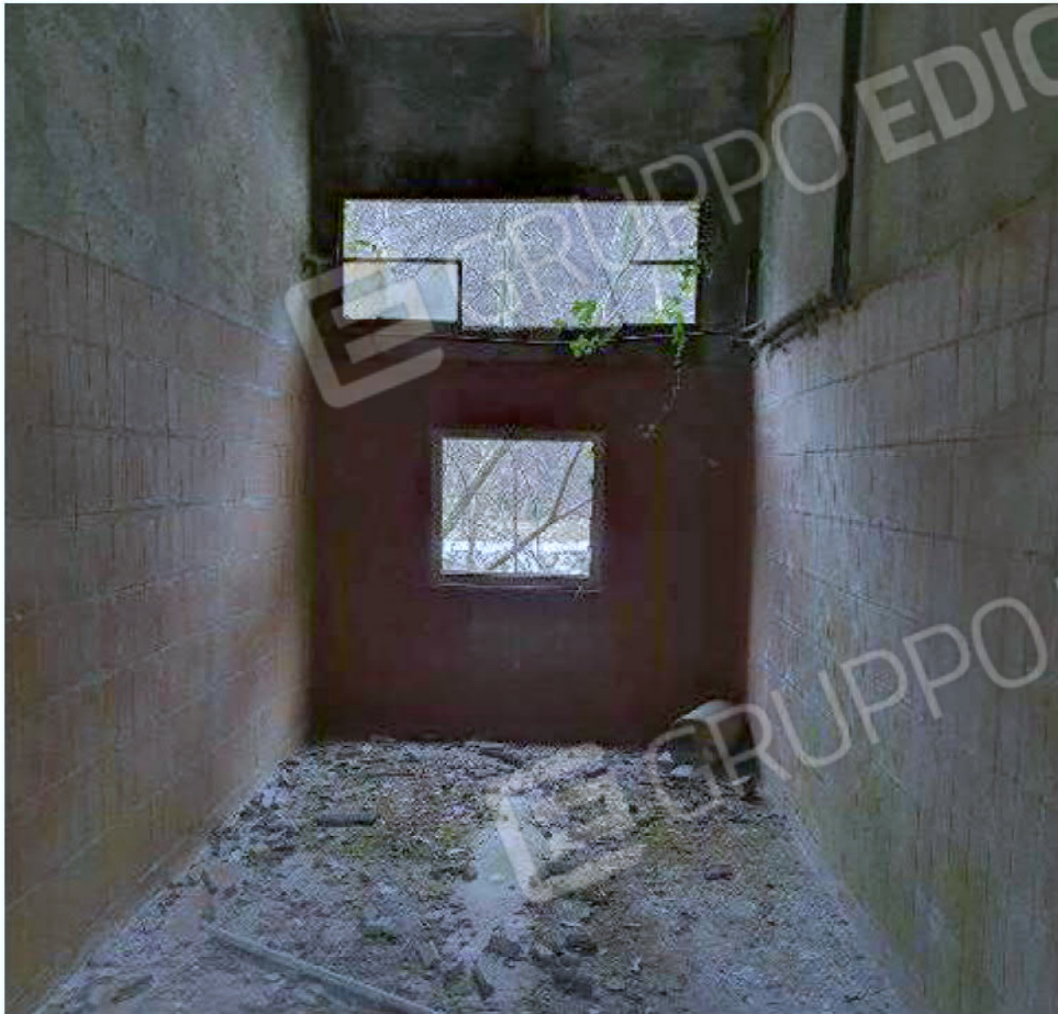
Immagine 17 – reparto lavaggio ed imbottigliamento Locale Centrale frigorigena e compressori aria.