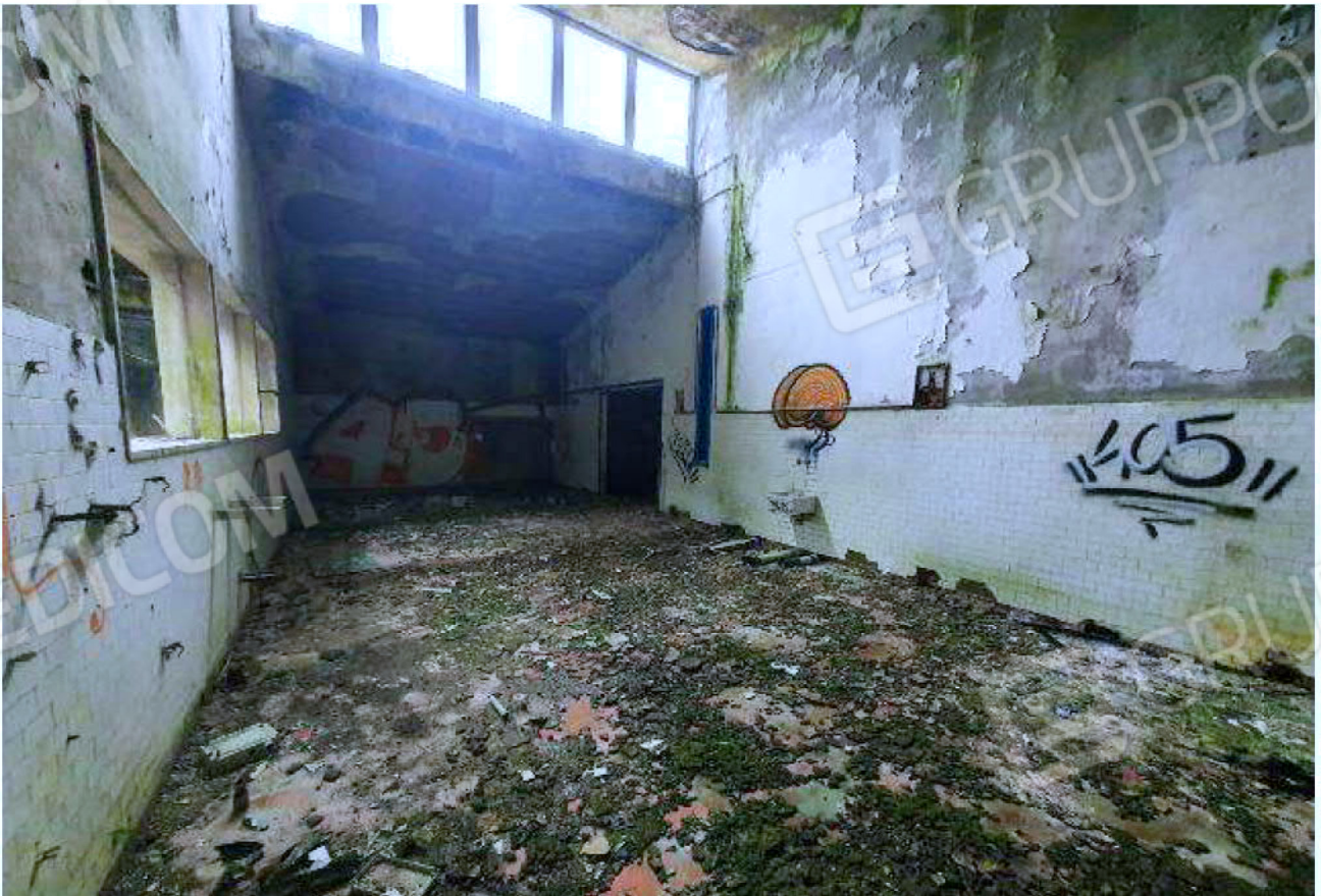
Immagine 22 – Piano rialzato - Area magazzino - Sala sciropi.