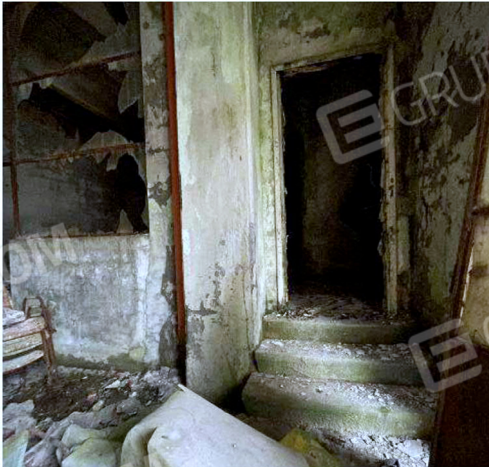
Immagine 50 – Piano Sottostrada - Spogliatoio.