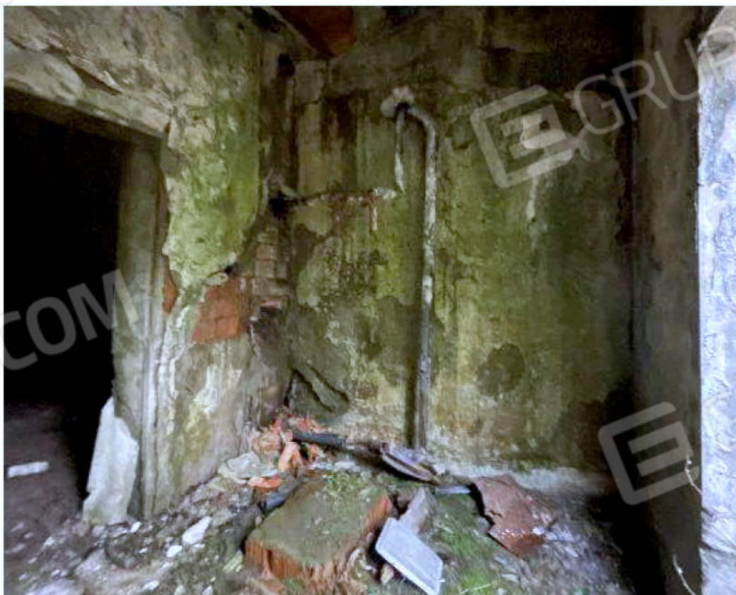
Immagine 65 – Piano Sottostrada – Area Centrale Termica.