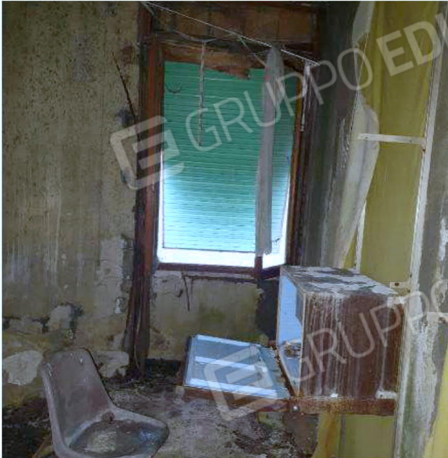
Immagine 39 – Piano rialzato - Area magazzino - Zona uffici.