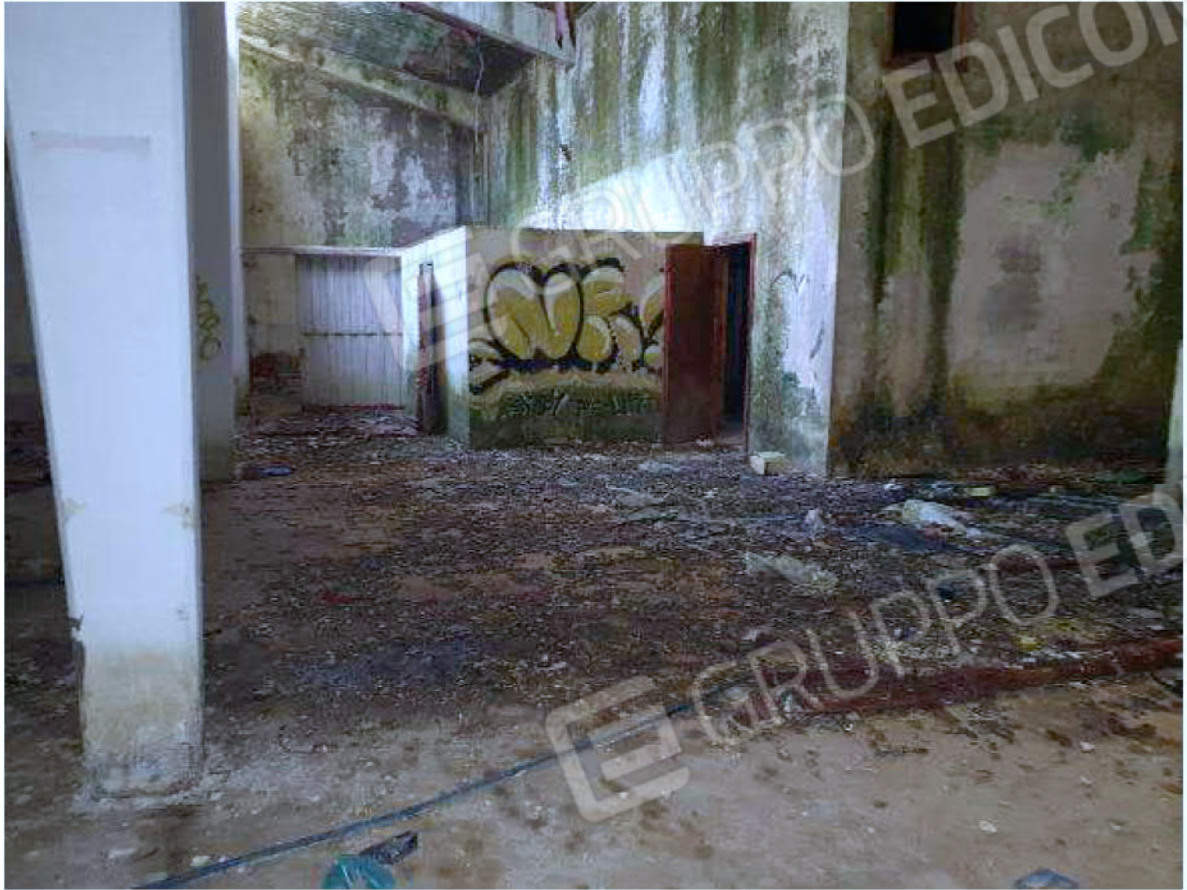
Immagine 27 – Piano rialzato - Area magazzino - Zona uffici.