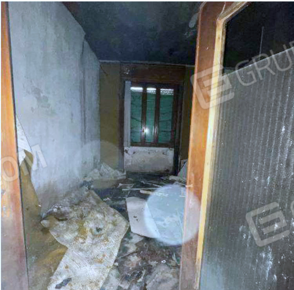
Immagine 38 – Piano rialzato - Area magazzino - Zona uffici.