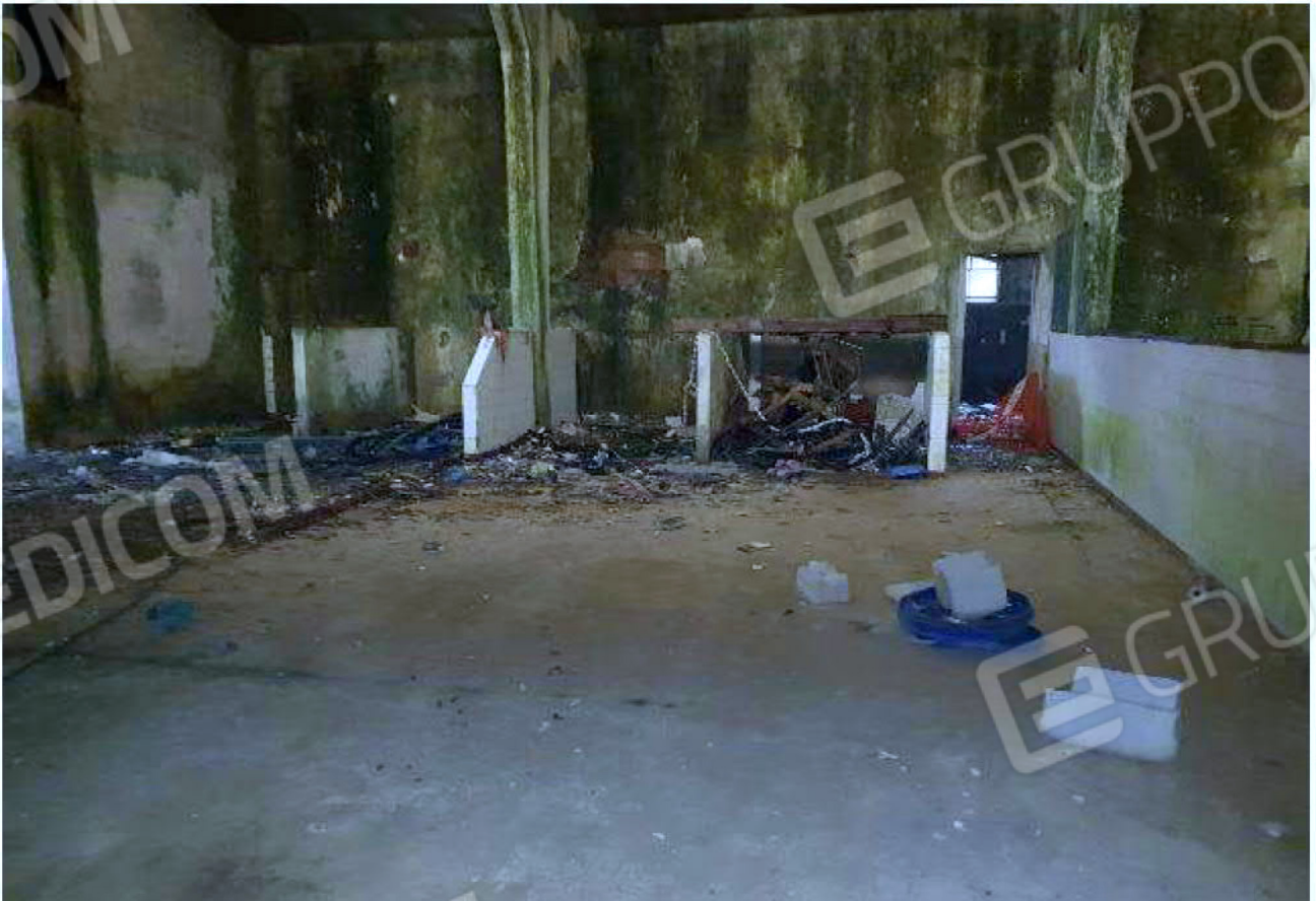
Immagine 26 – Piano rialzato - Area magazzino - Zona uffici.