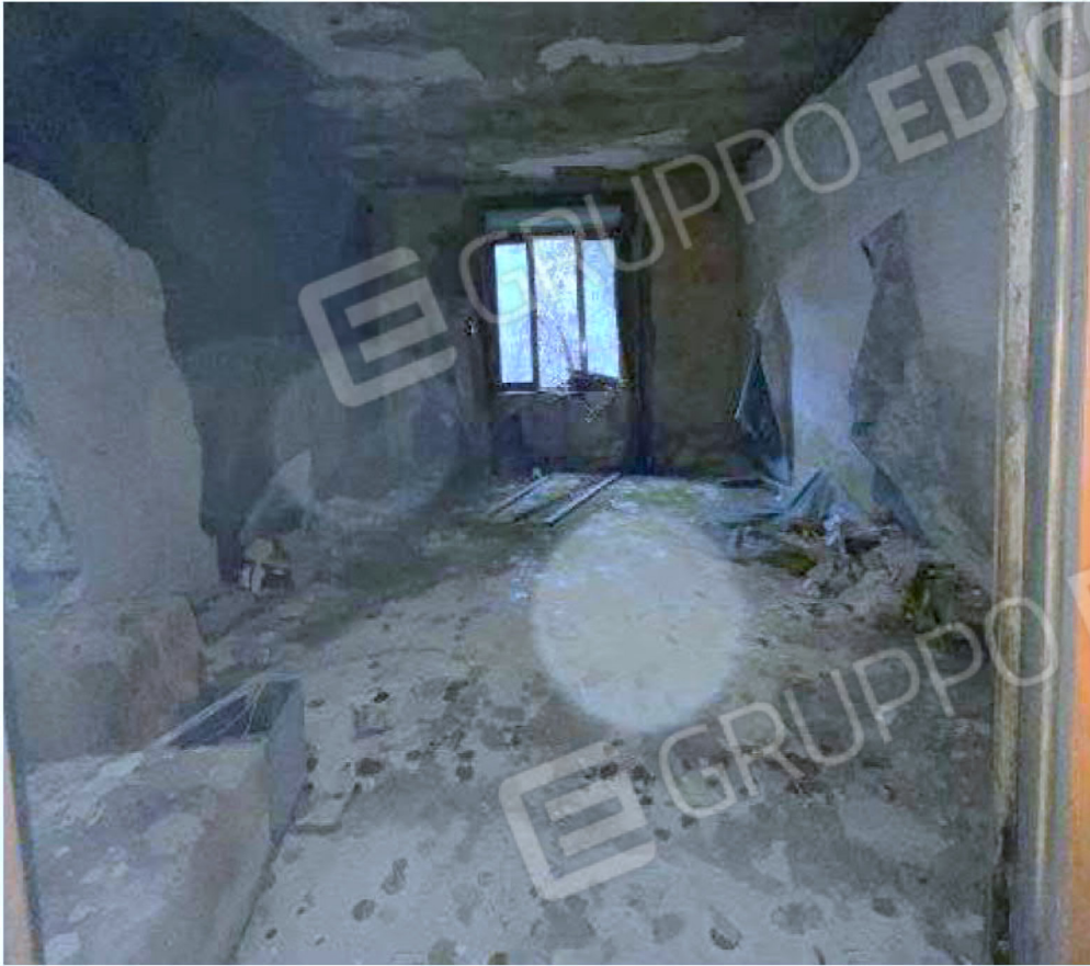
Immagine 43 – Piano rialzato - Area magazzino - Zona uffici.