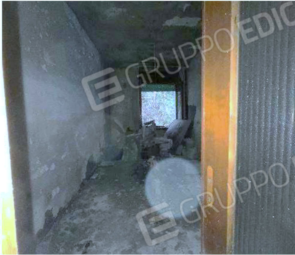
Immagine 45 – Piano rialzato - Area magazzino - Zona uffici.