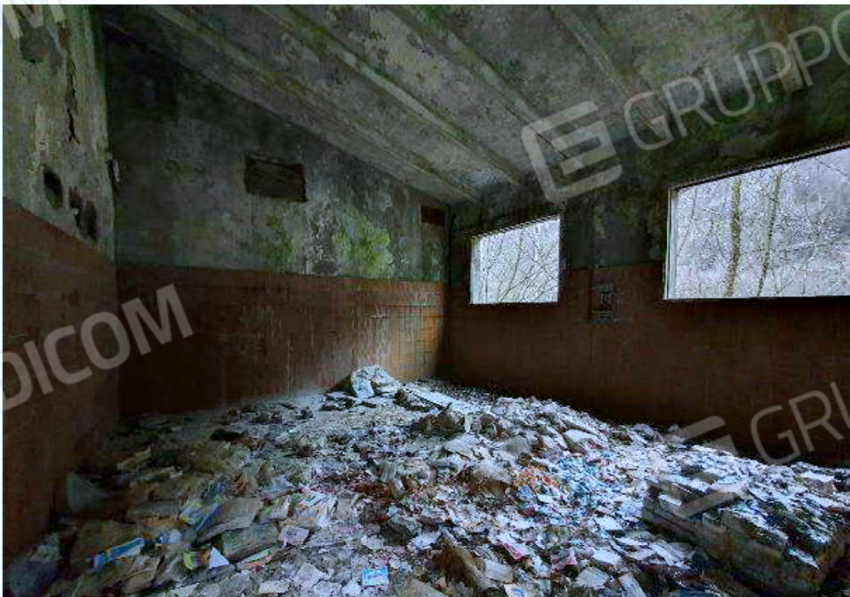
Immagine 16 – reparto lavaggio ed imbottigliamento- Locale Officina.