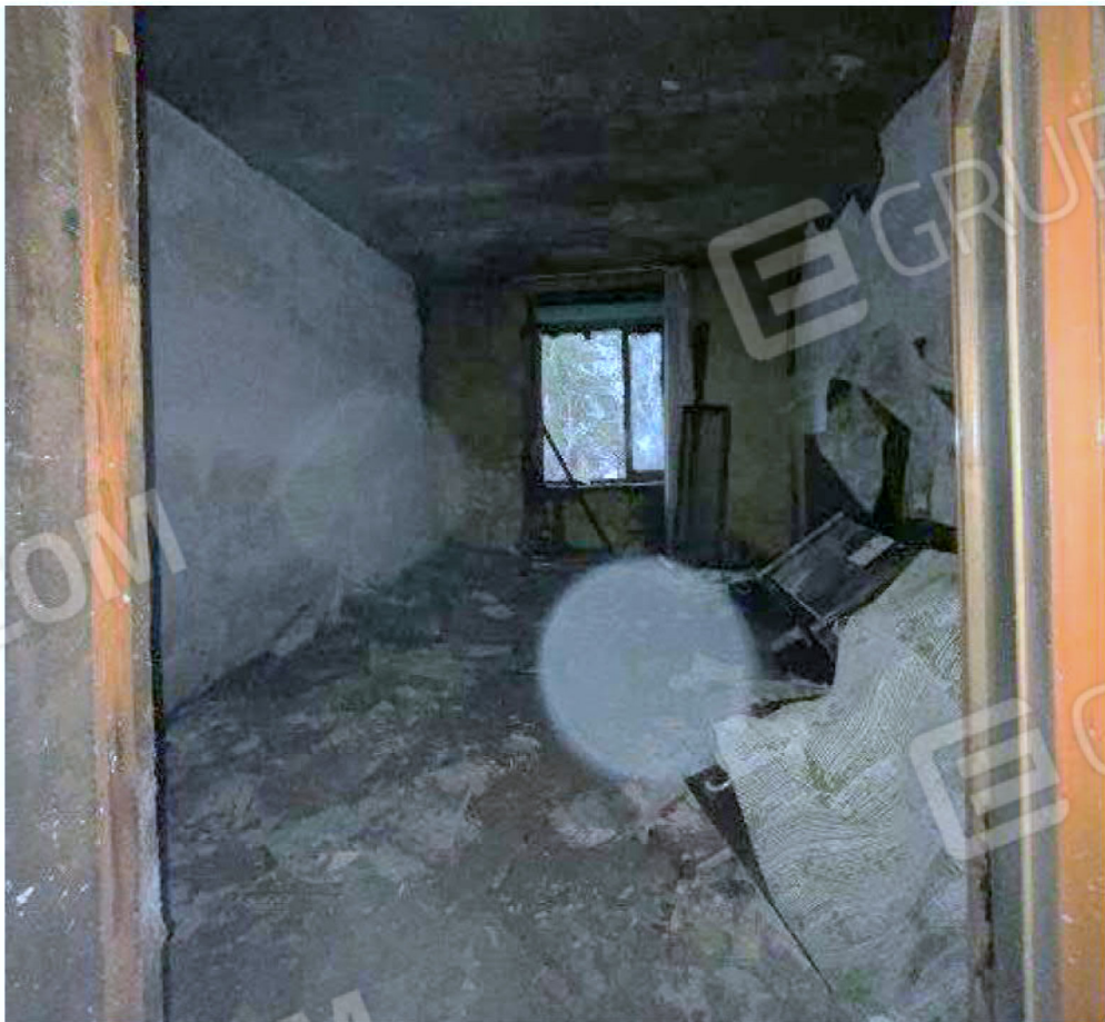
Immagine 44 – Piano rialzato - Area magazzino - Zona uffici.