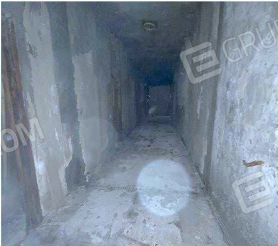
Immagine 42 – Piano rialzato - Area magazzino - Zona uffici.