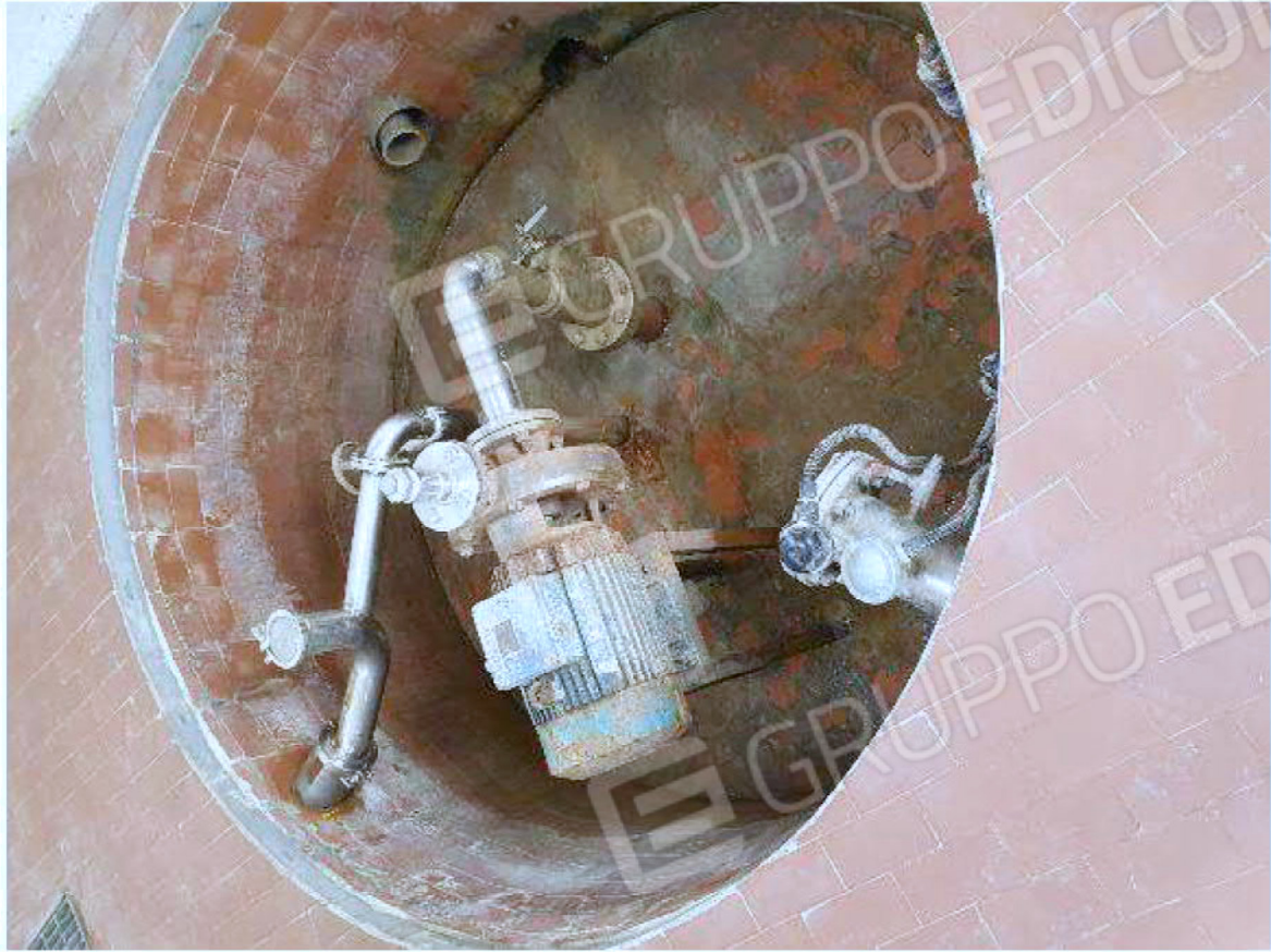
Immagine 70 - edificio captazione acque.