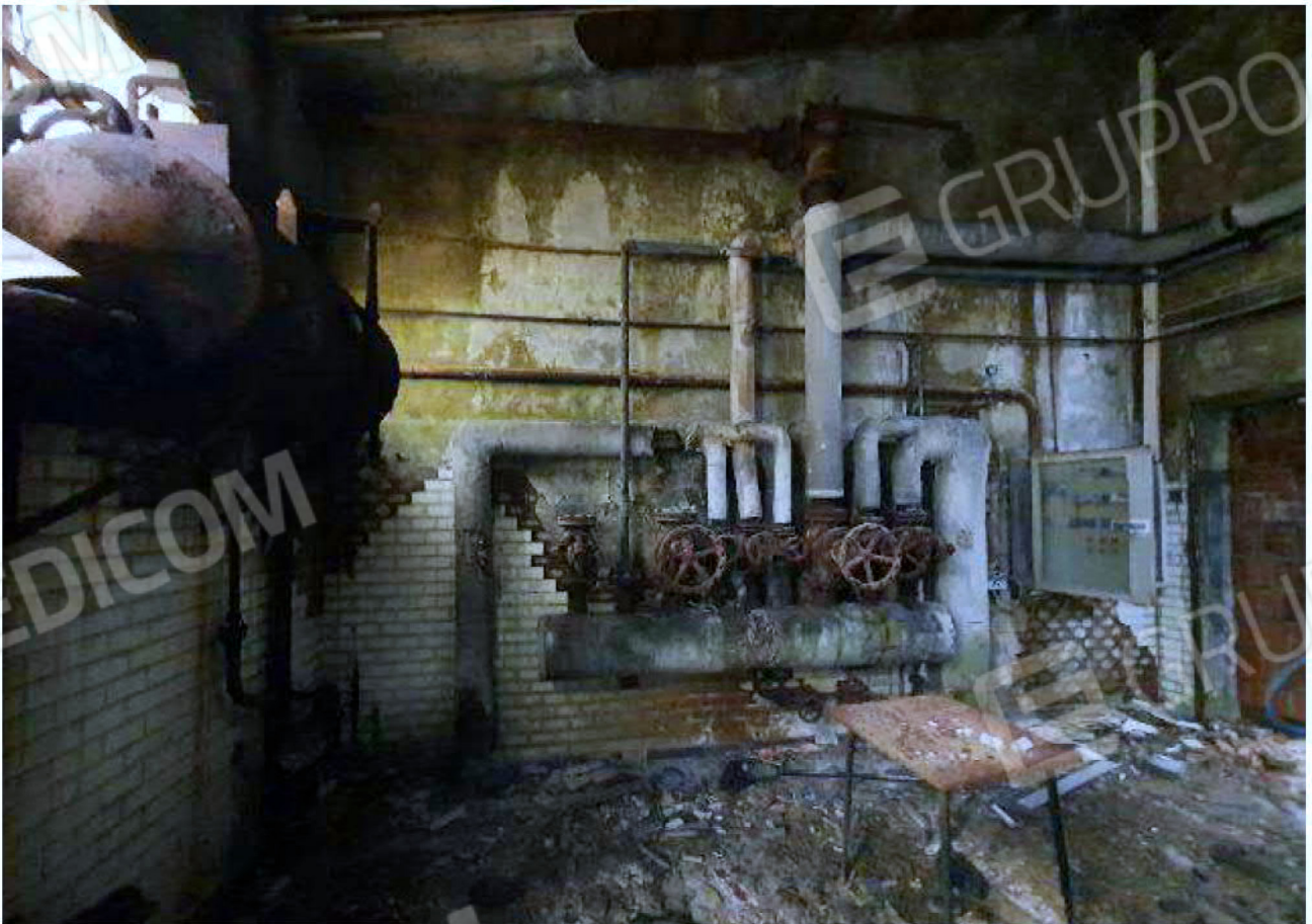
Immagine 20 – reparto lavaggio ed imbottigliamento - Locale Centrale Termica.