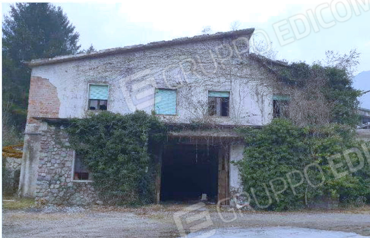
Immagine 47 – Vista verso Nord-Ovest - Capannone Piano Sottostrada.