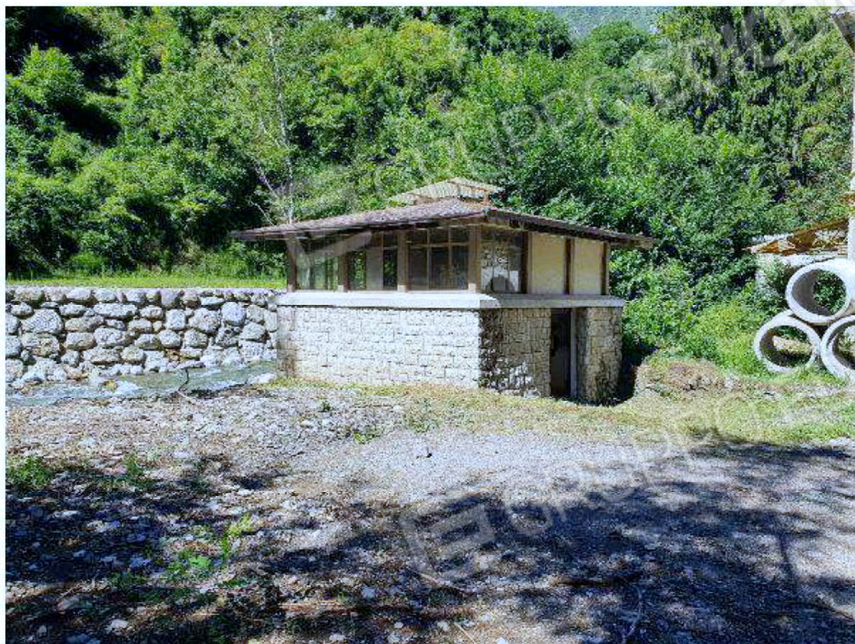
Immagine 66 – edificio captazione acque.