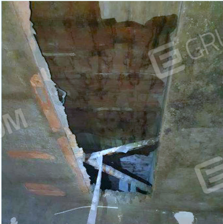
Immagine 40 – Piano rialzato - Area magazzino - Zona uffici – Soletta bucata.