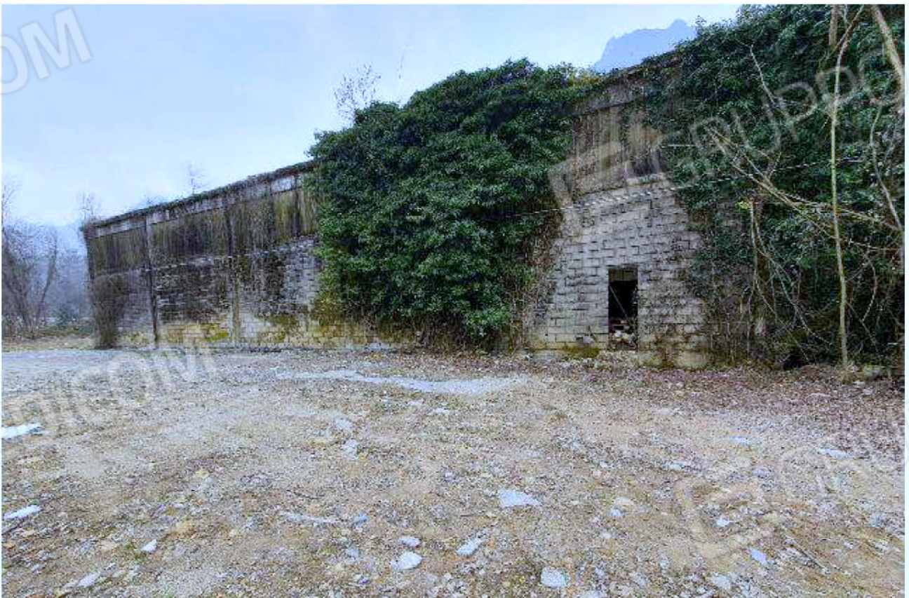
Immagine 8 – Vista verso Nord-Est - area deposito vuoti - capannone chiuso.