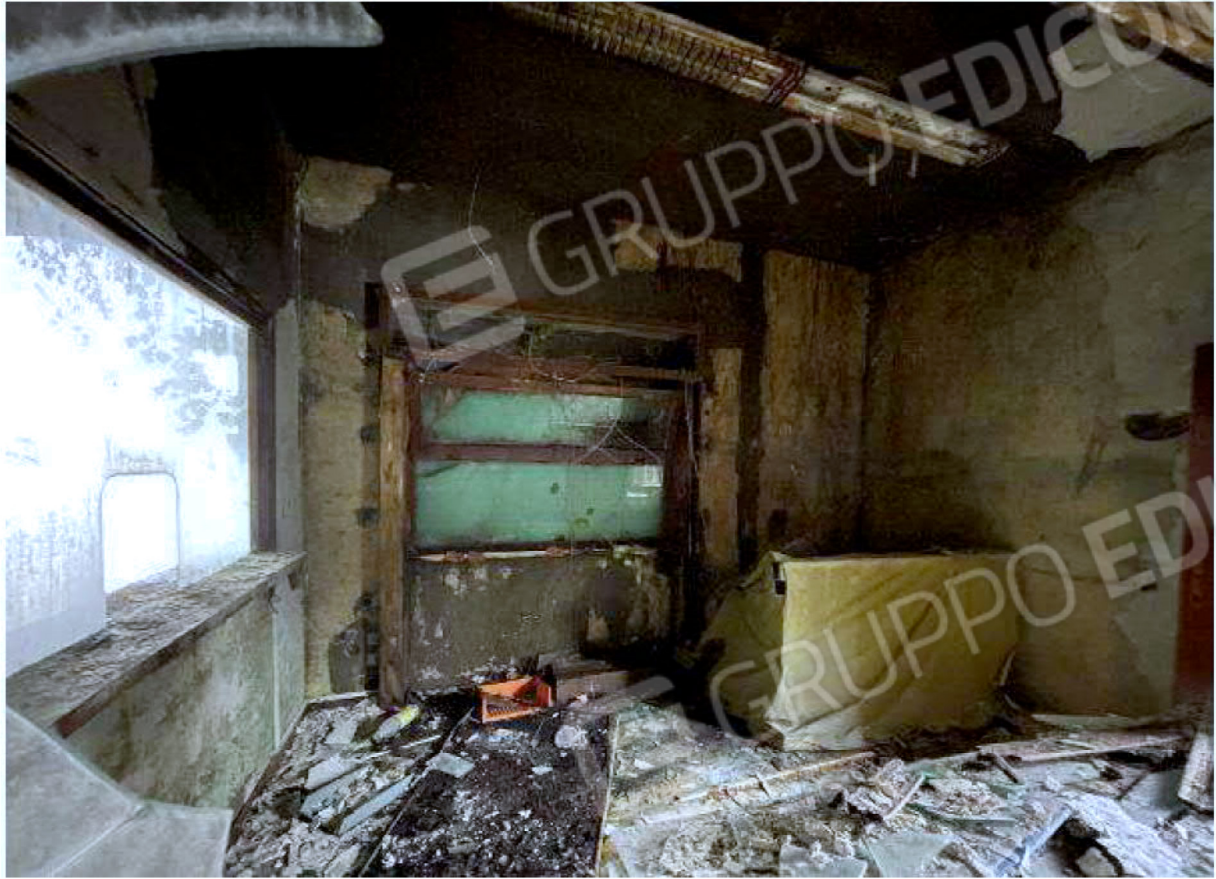
Immagine 35 – Piano rialzato - Area magazzino - Zona uffici.