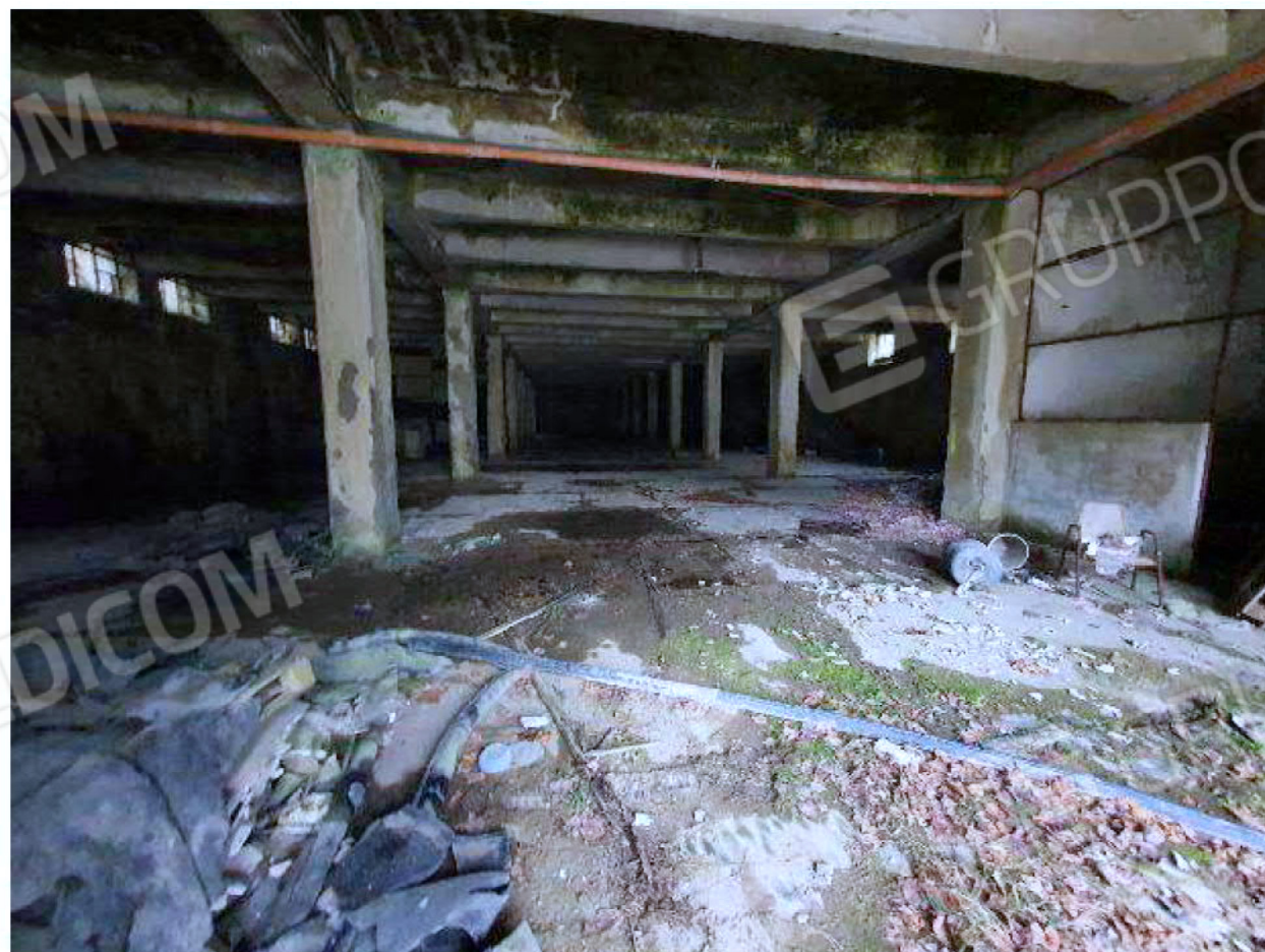
Immagine 48 – Piano Sottostrada - Area magazzino.