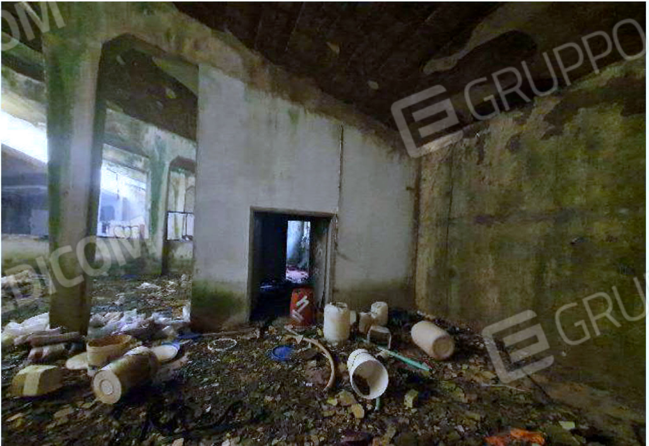
Immagine 24 – Piano rialzato - Area magazzino - Zona uffici.