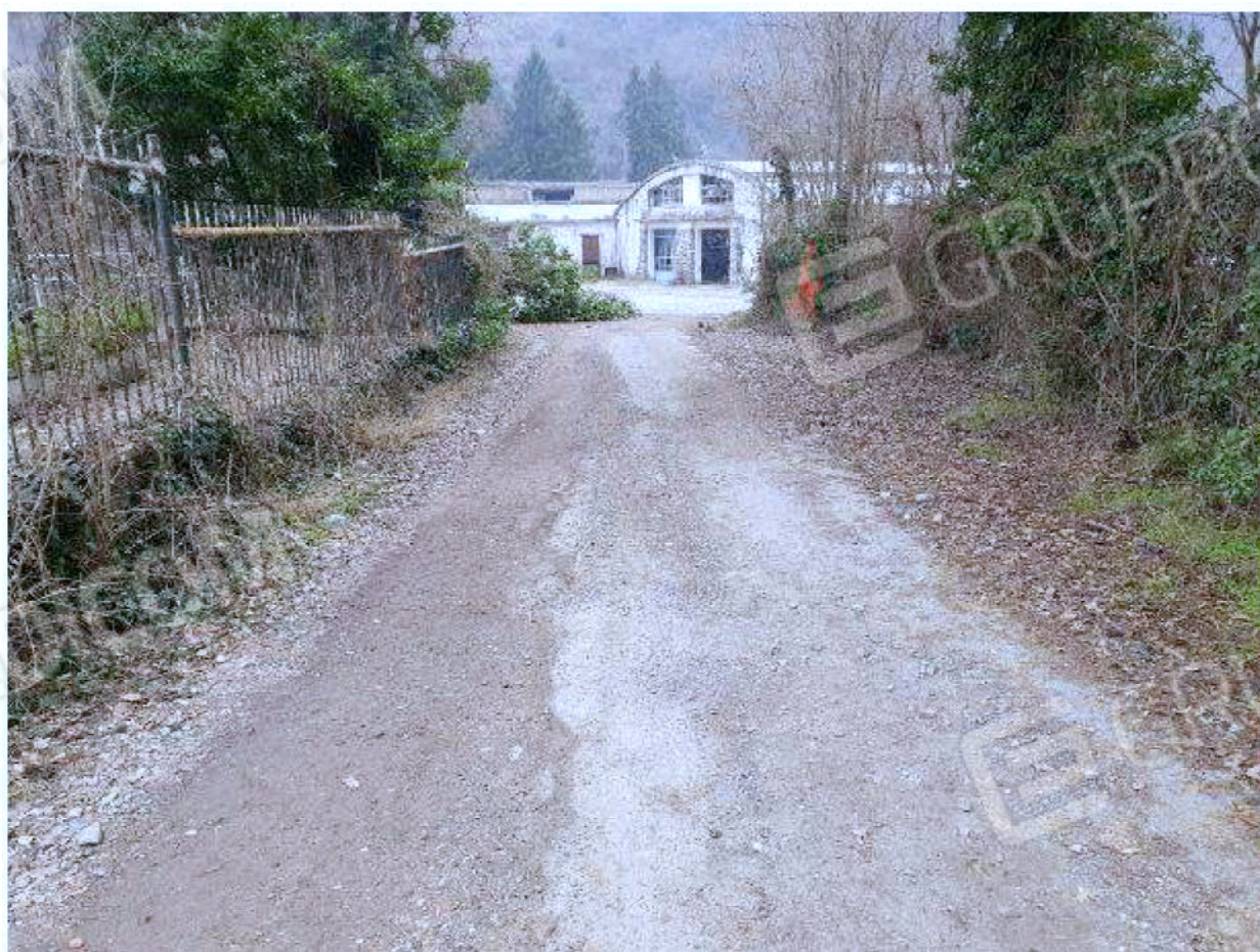
Immagine 2 - Foto ingresso.