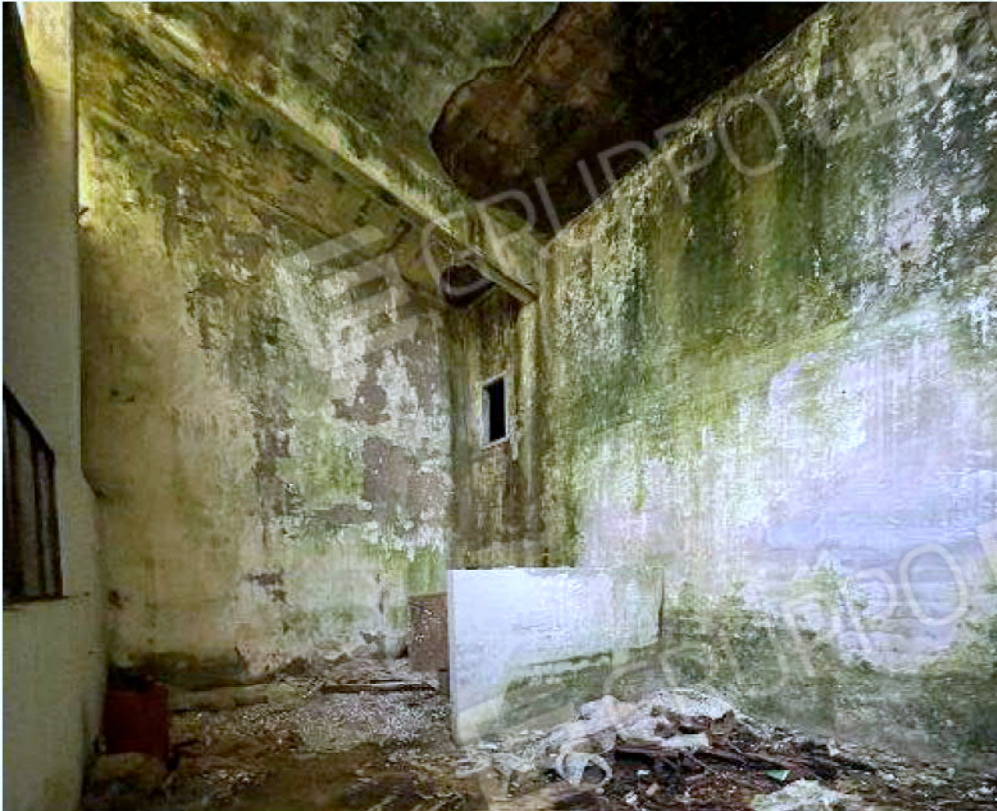
Immagine 29 – Piano rialzato - Area magazzino - Zona uffici (locale non presente sulle planimetrie).