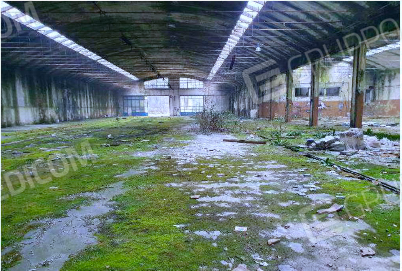
Immagine 12 – area reparti di confezione – stoccaggio e consegna.