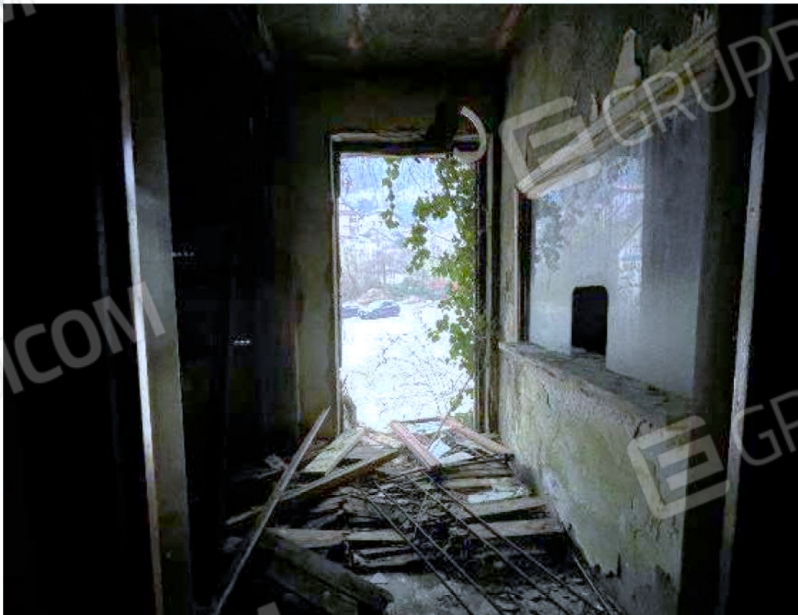
Immagine 32 – Piano rialzato - Area magazzino - Zona uffici (Atrio con accesso esterno).