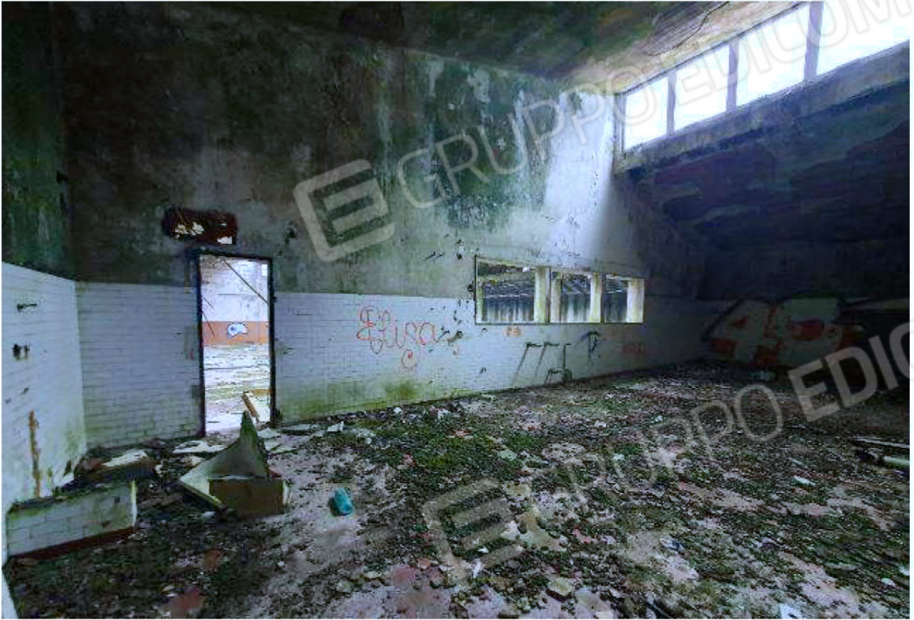
Immagine 21 – Piano rialzato - Area magazzino - Sala sciropi.