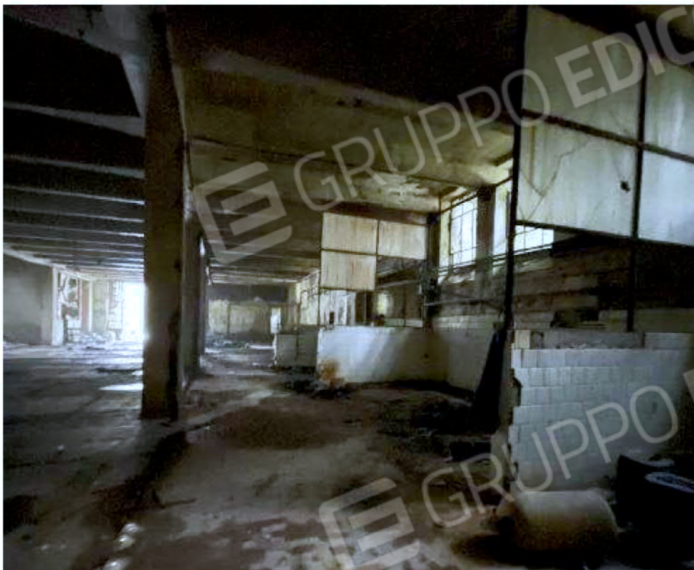
Immagine 57 – Piano Sottostrada - Area magazzino.