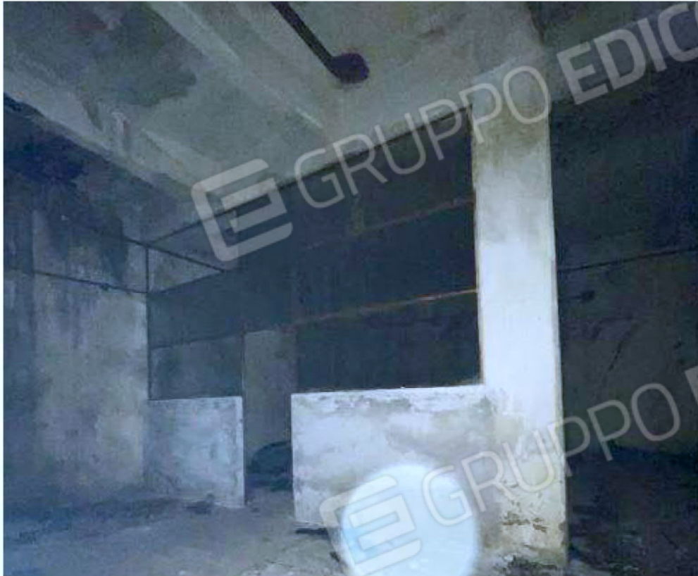
Immagine 55 – Piano Sottostrada - Area magazzino (Locale non presente sulle planimetrie).