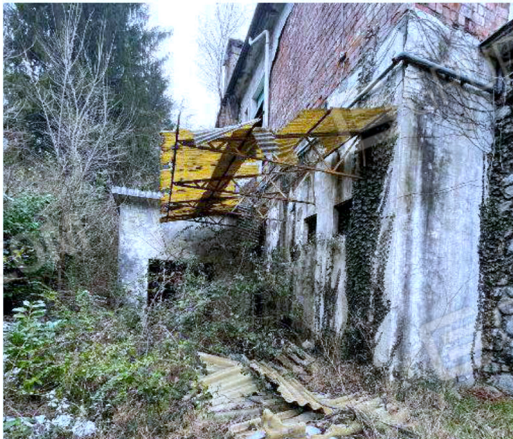
Immagine 63 – Vista Verso Nord-Ovest – Piano Sottostrada – Area Centrale Termica.