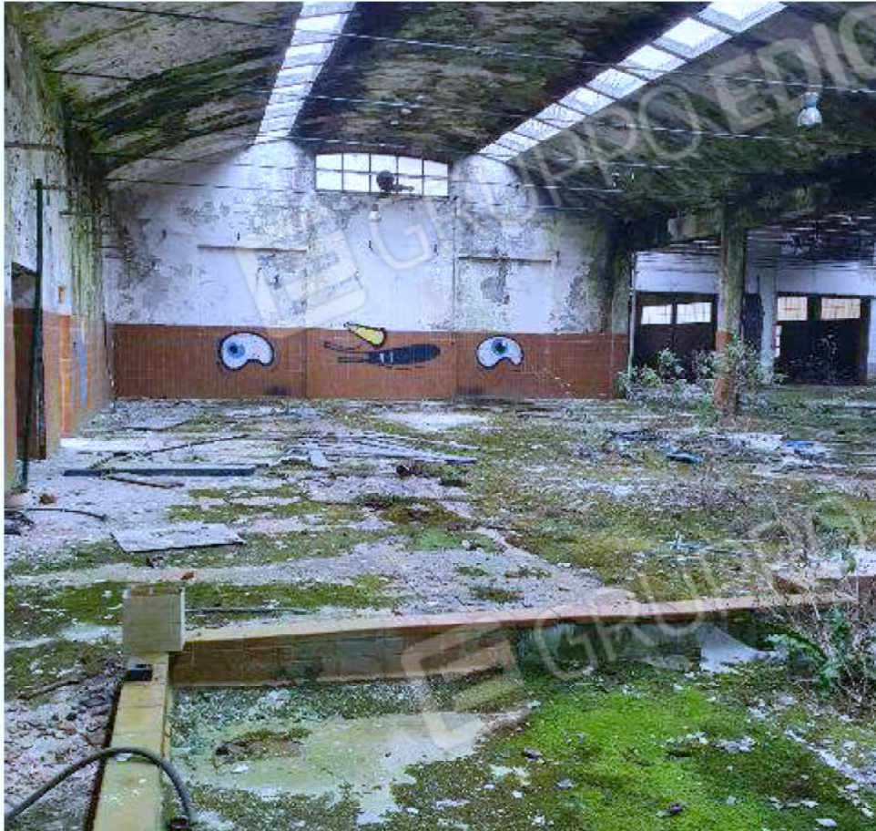
Immagine 15 – area impianto per acque minerali e bibite.