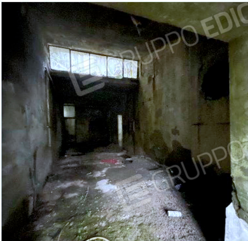
Immagine 64 – Piano Sottostrada – Area Centrale Termica.