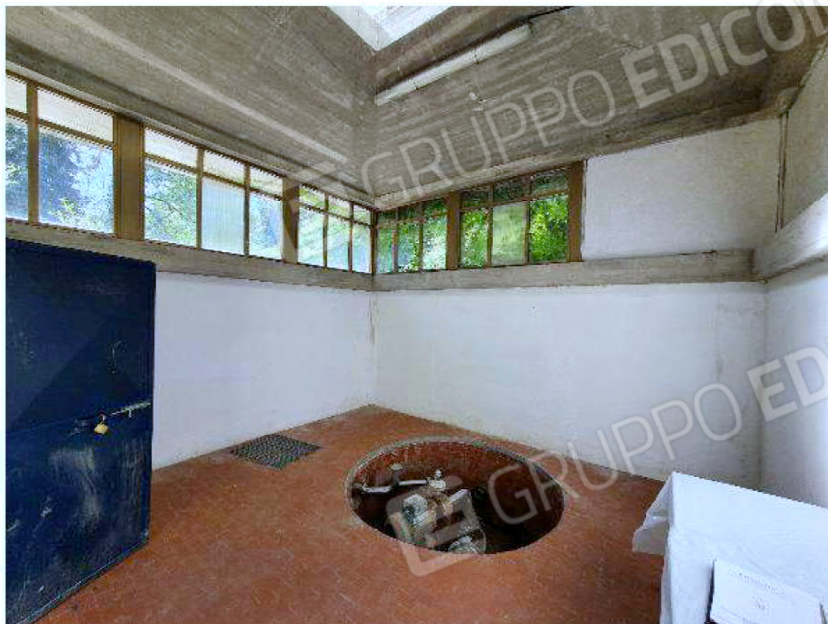
Immagine 68 - edificio captazione acque.