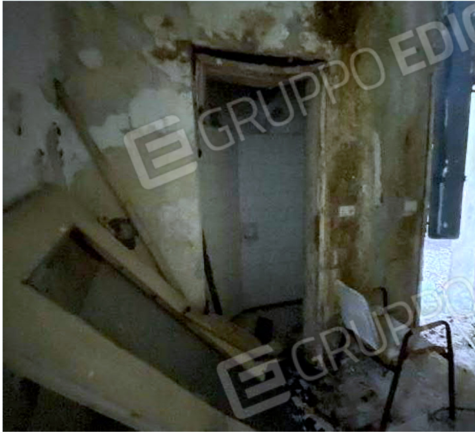
Immagine 51 – Piano Sottostrada - Spogliatoio.