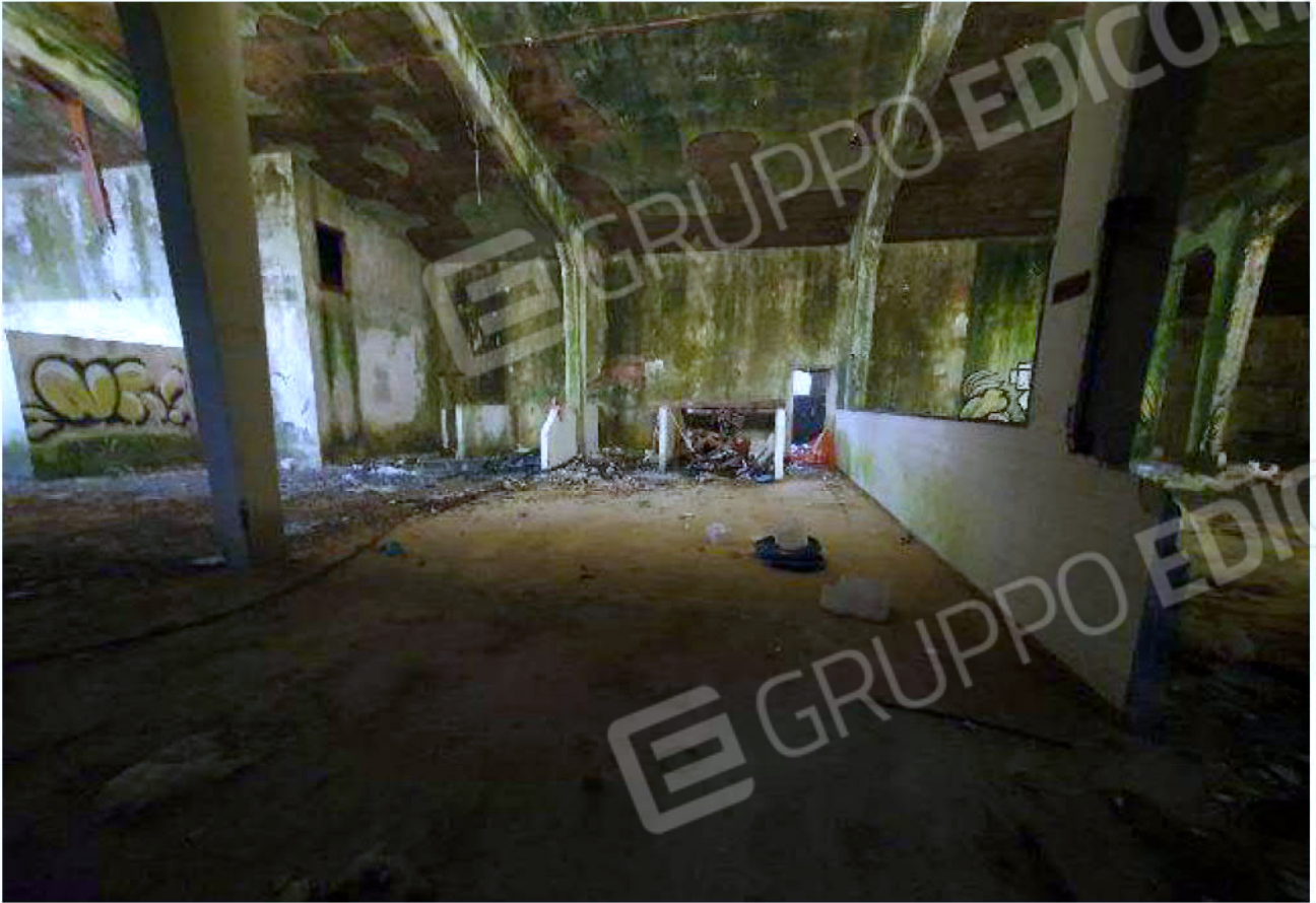
Immagine 25 – Piano rialzato - Area magazzino - Zona uffici.