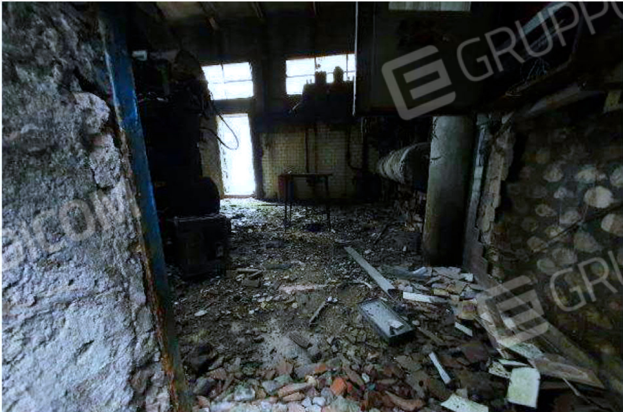
Immagine 18 – reparto lavaggio ed imbottigliamento - Locale Centrale Termica.