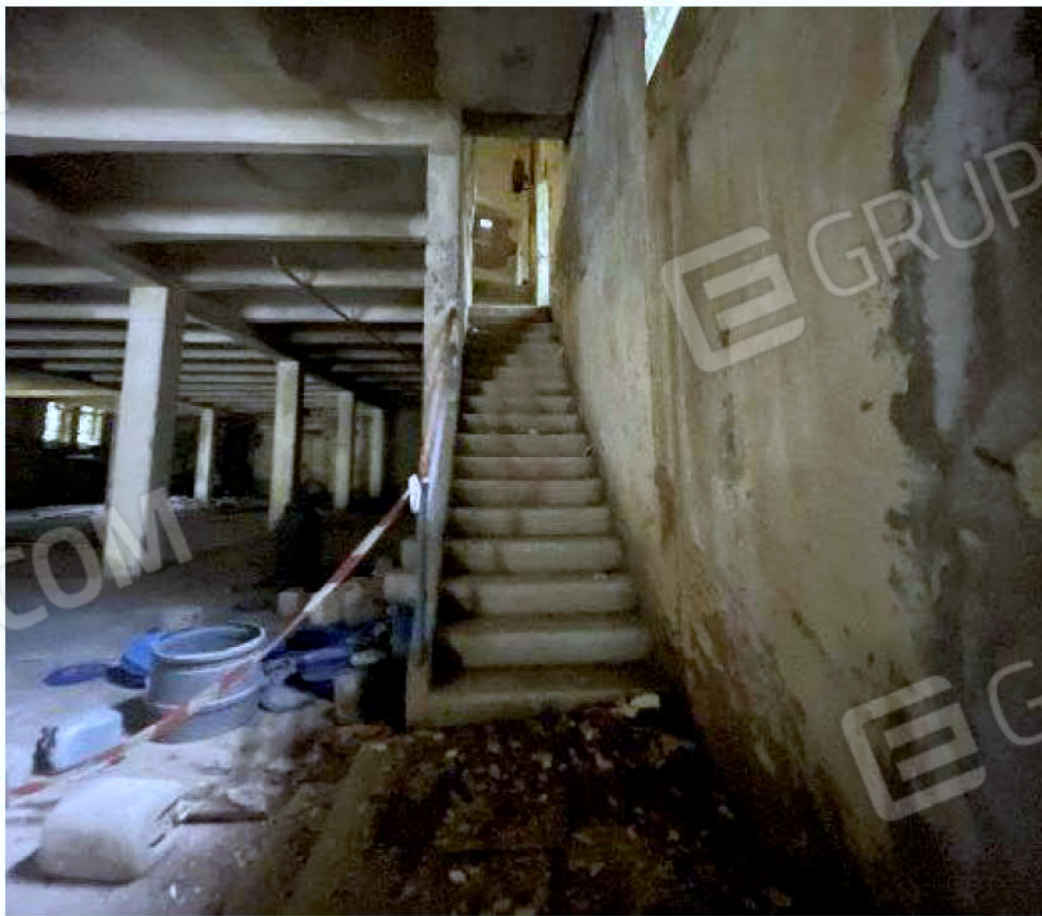
Immagine 54 – Piano Sottostrada - Area magazzino (scala di accesso al Piano Sovrastante).