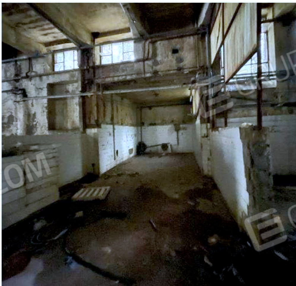
Immagine 58 – Piano Sottostrada - Area magazzino.