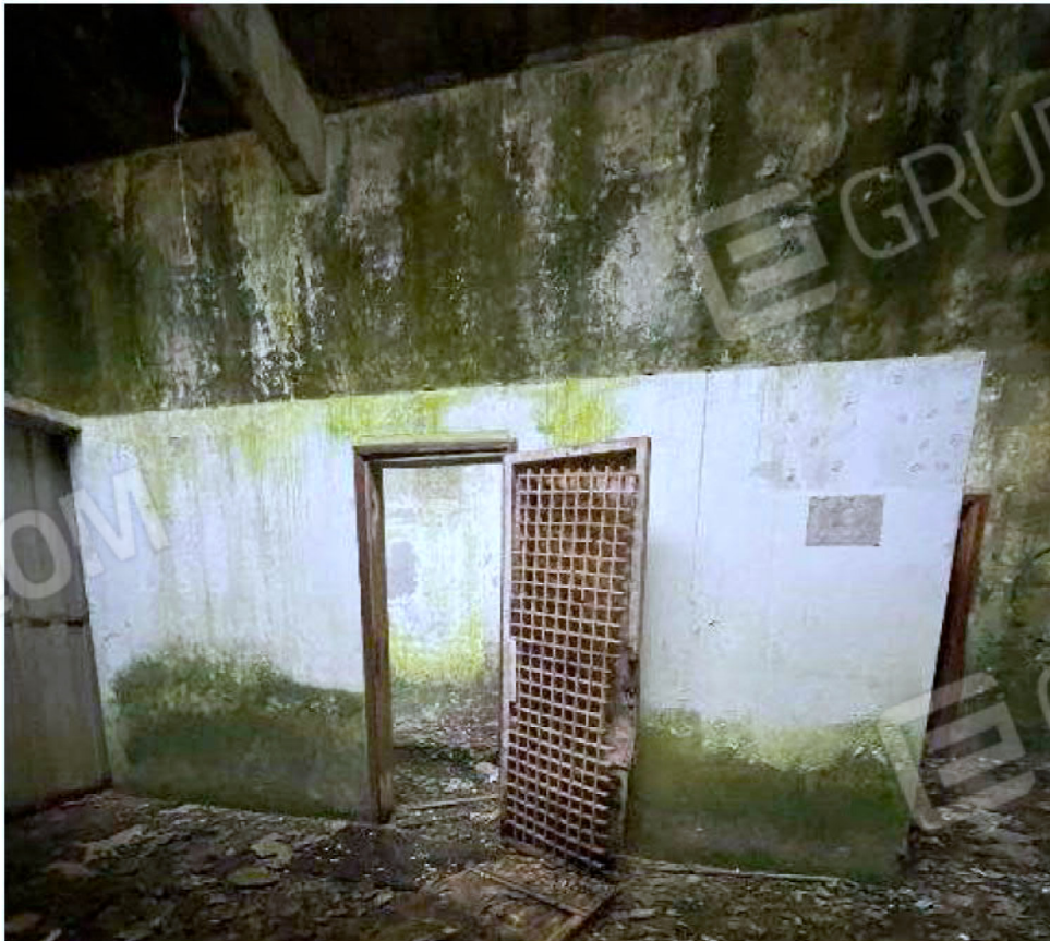
Immagine 28 – Piano rialzato - Area magazzino - Zona uffici (locale non presente sulle planimetrie).