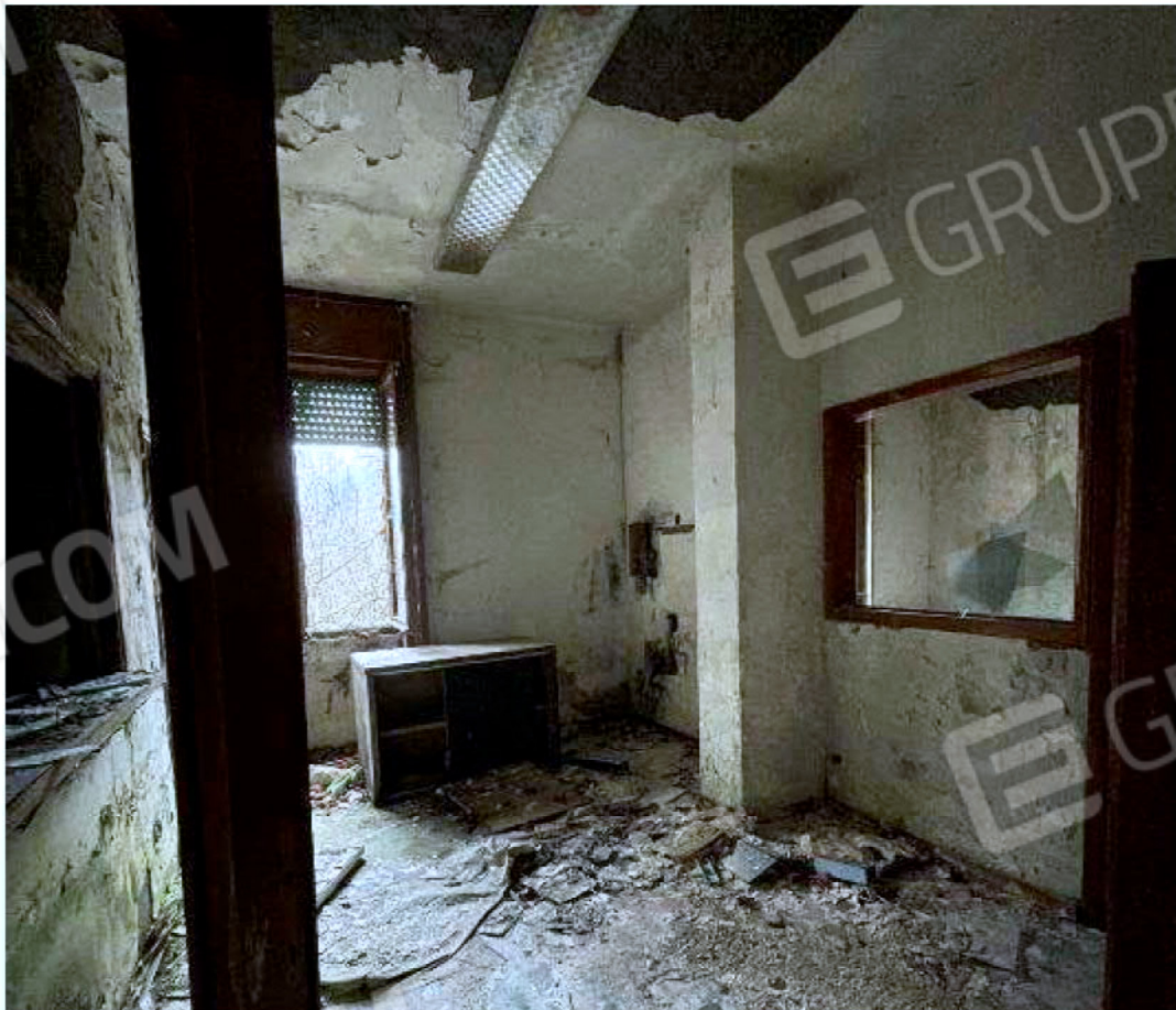
Immagine 36 – Piano rialzato - Area magazzino - Zona uffici.