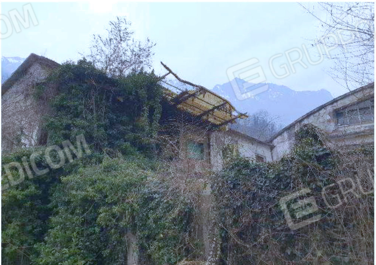
Immagine 34 – Vista dalla strada d'accesso al Piano Sottostrada - Area magazzino - Zona uffici.