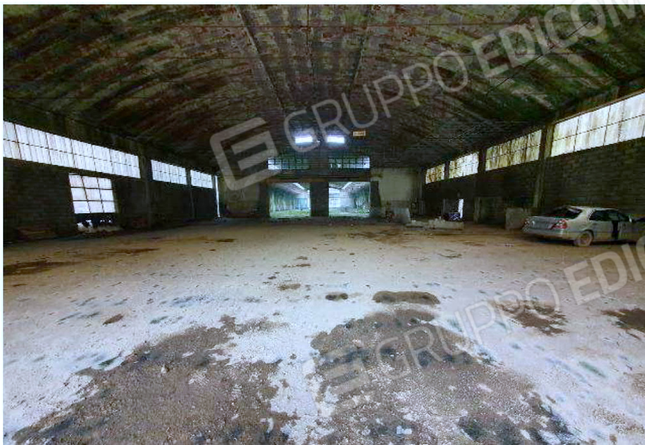
Immagine 9 –area deposito vuoti - capannone chiuso.