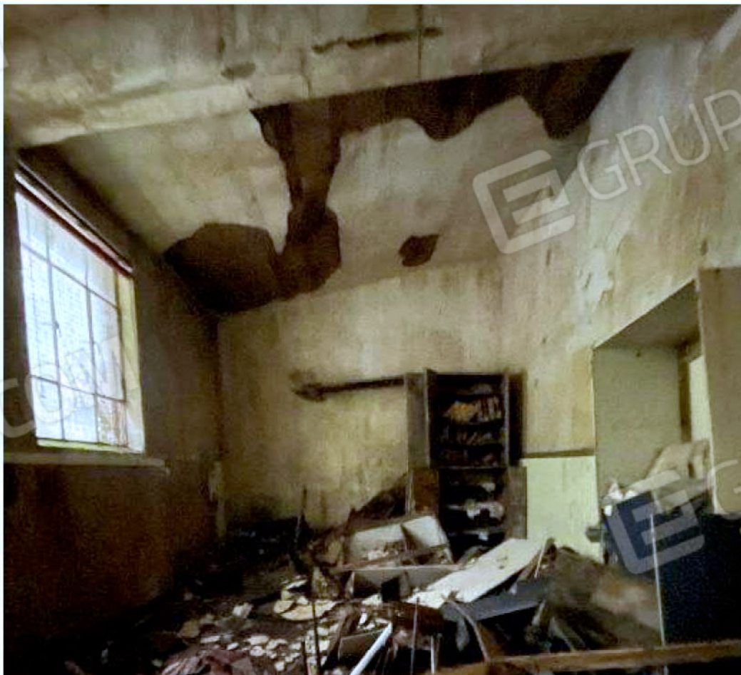
Immagine 46 – Piano rialzato - Area magazzino - Zona uffici.