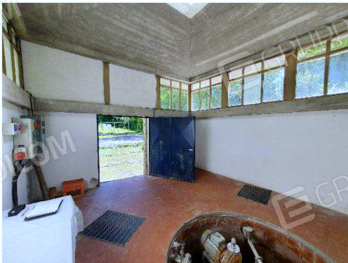
Immagine 69 - edificio captazione acque.