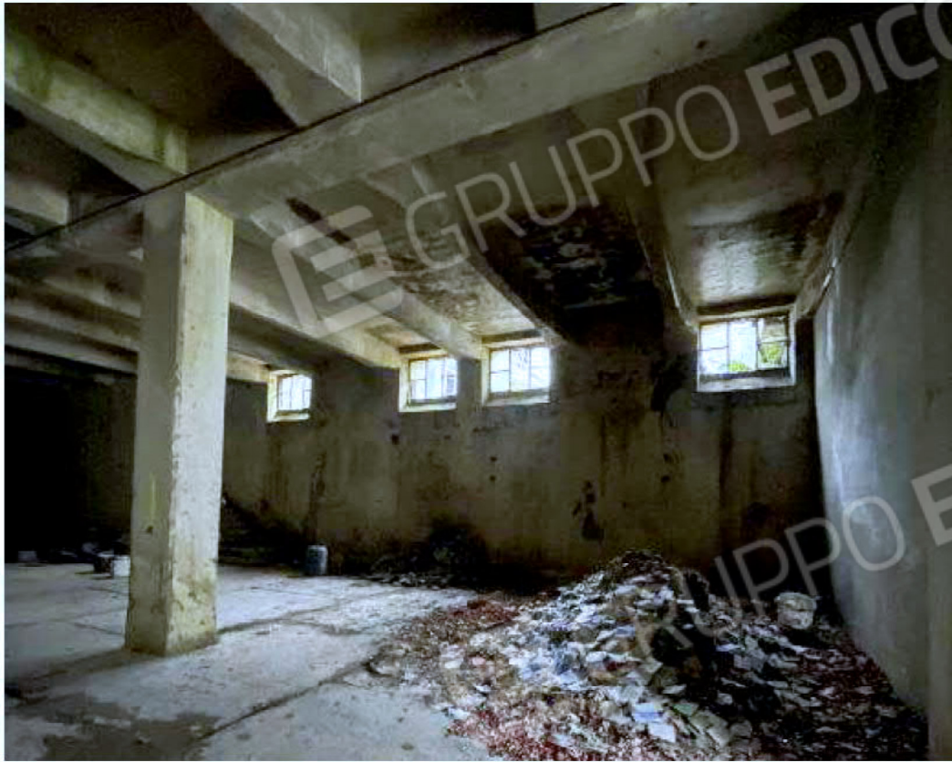
Immagine 53 – Piano Sottostrada - Area magazzino.