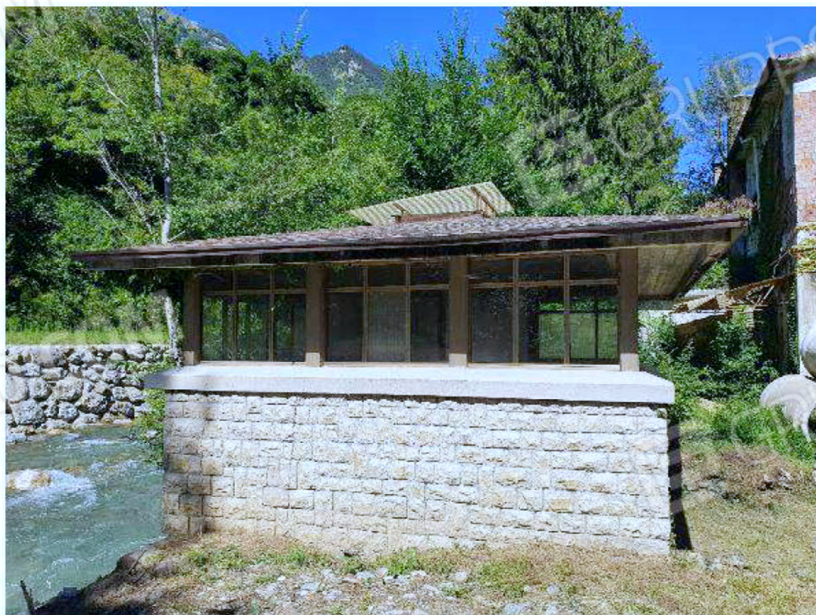
Immagine 67 - edificio captazione acque.