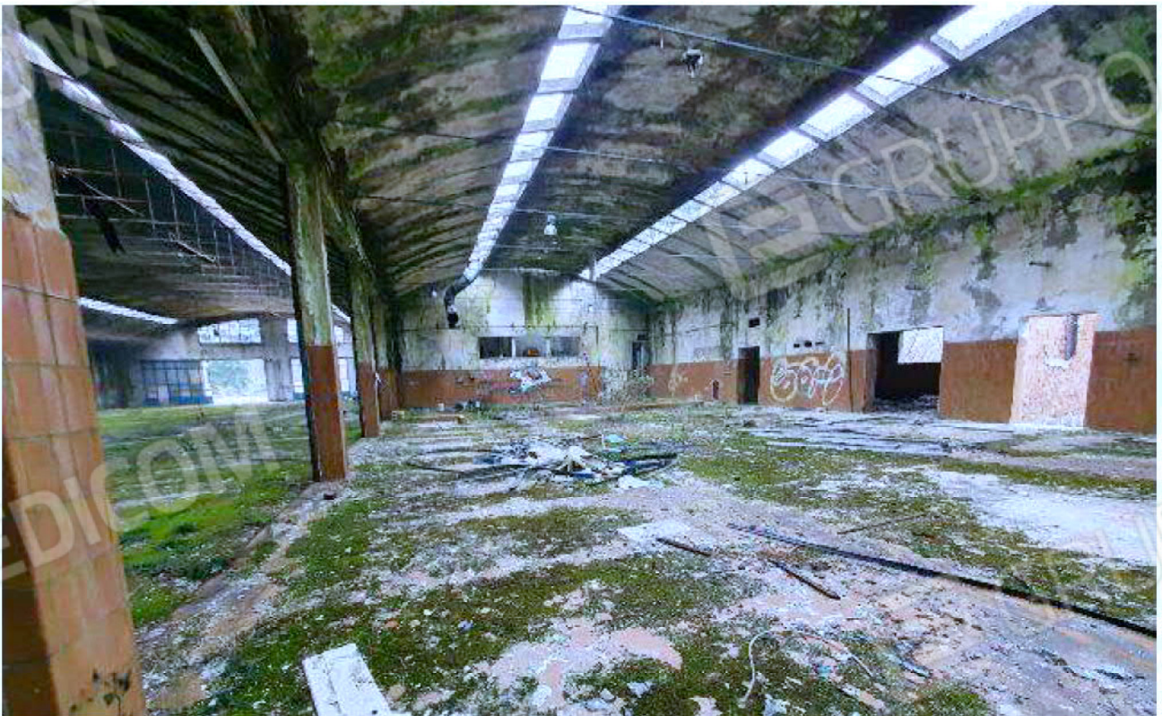
Immagine 14 – area impianto per acque minerali e bibite.