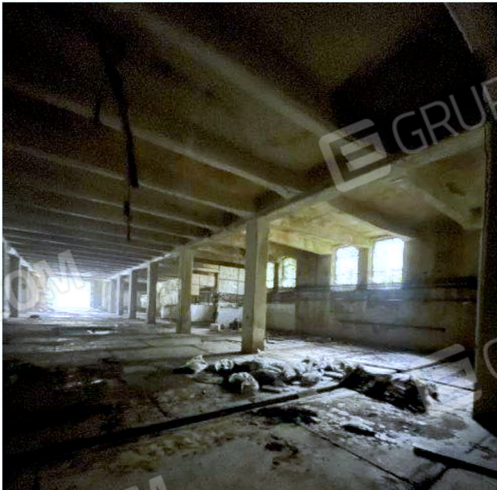
Immagine 56 – Piano Sottostrada - Area magazzino.