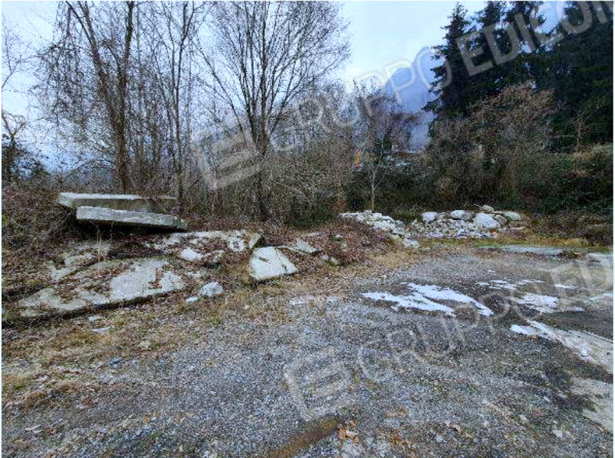
Immagine 72 - Terreno.