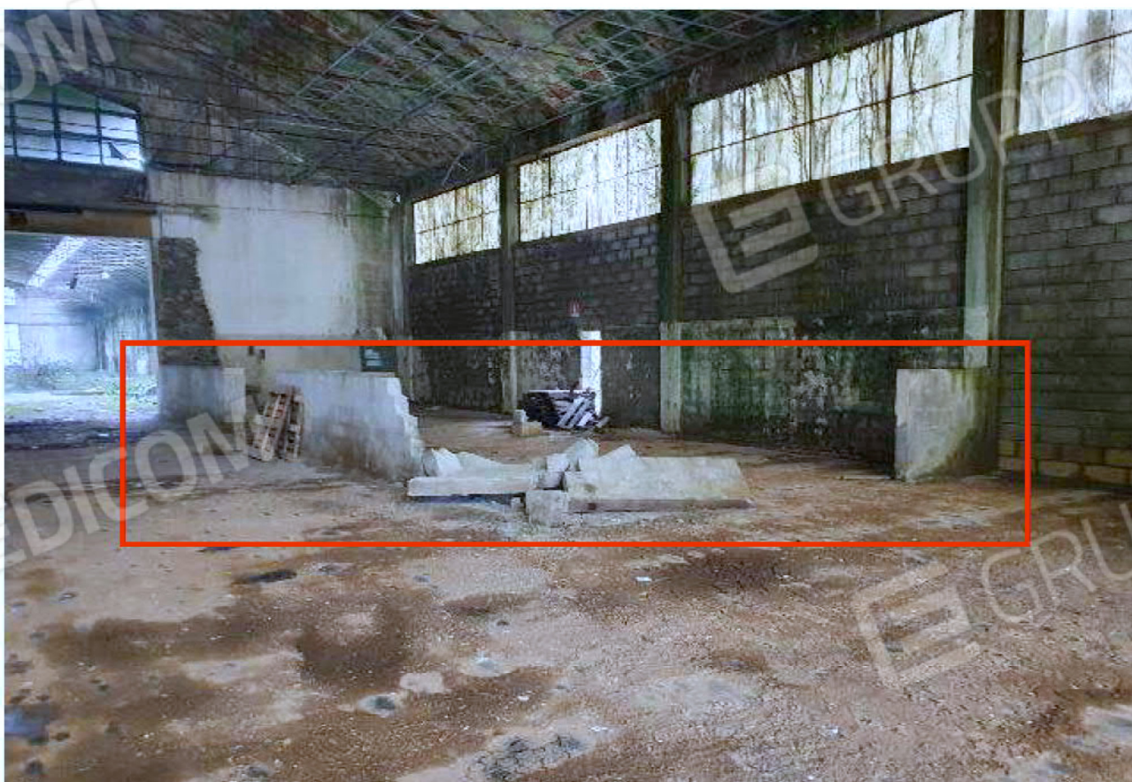
Immagine 10 –area deposito vuoti - capannone chiuso – in evidenza muro in costruzione non presente sulle planimetrie.