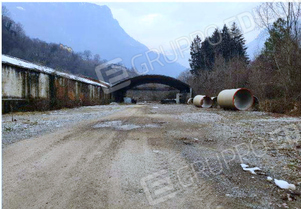
Immagine 3 – Vista verso Nord-Ovest - area deposito vuoti - capannone aperto.