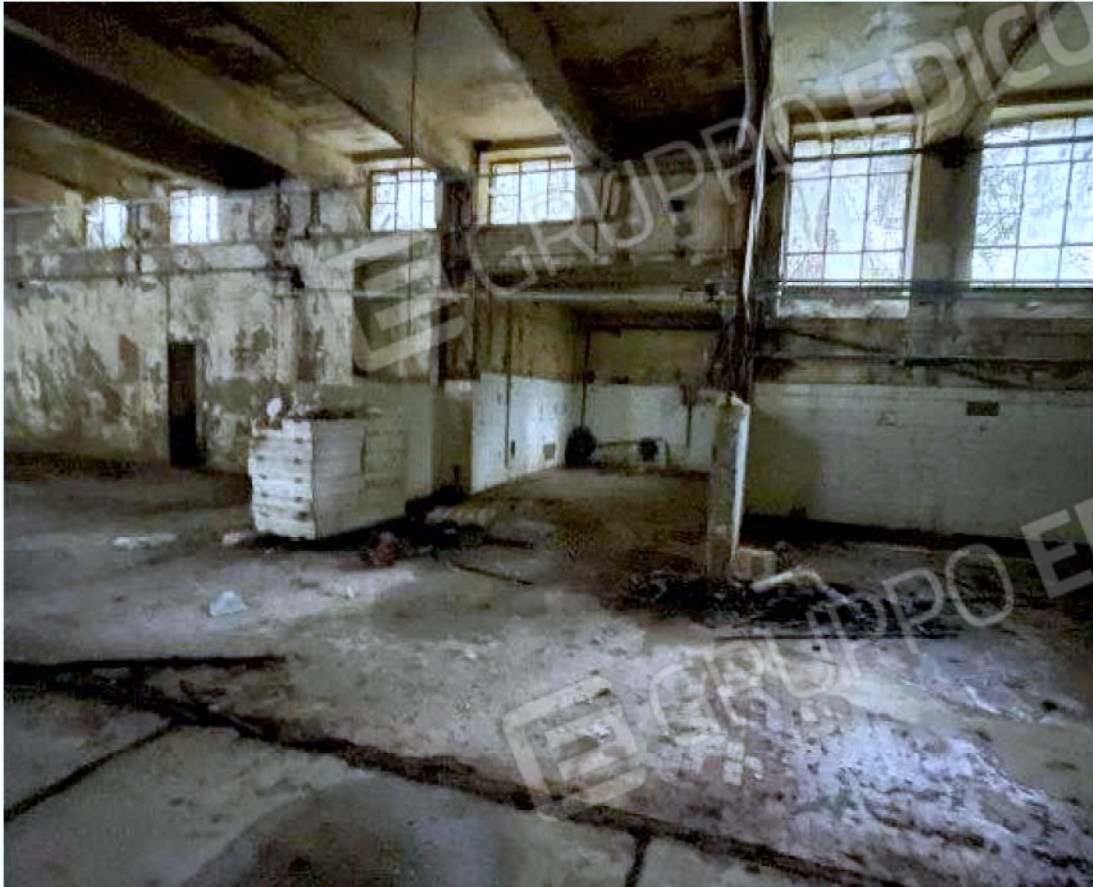
Immagine 59 – Piano Sottostrada - Area magazzino.