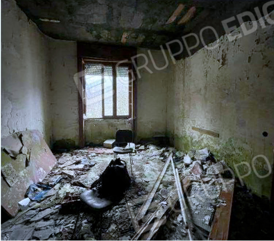
Immagine 37 – Piano rialzato - Area magazzino - Zona uffici.