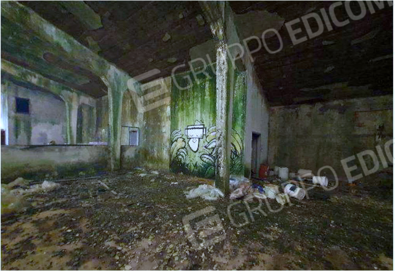
Immagine 23 – Piano rialzato - Area magazzino - Zona uffici.