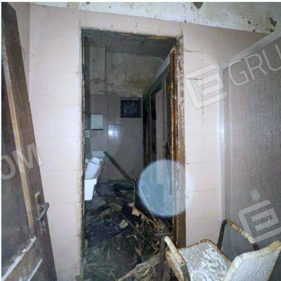
Immagine 52 – Piano Sottostrada - Spogliatoio.