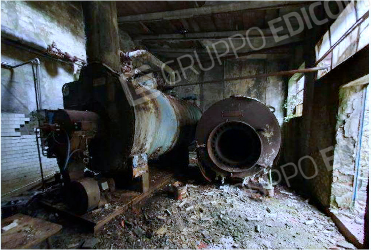
Immagine 19 – reparto lavaggio ed imbottigliamento - Locale Centrale Termica.