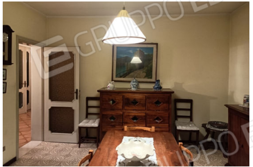
29. Sala da pranzo