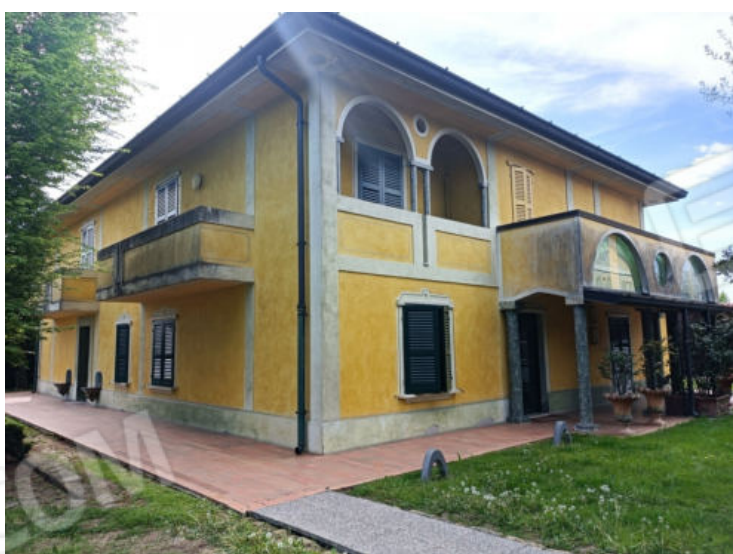
8. Vista nord est