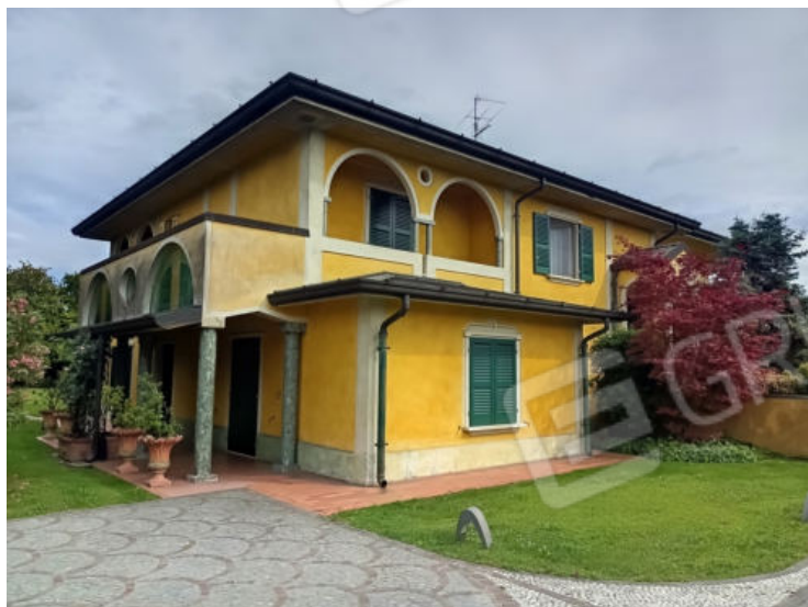
6. Vista nord ovest