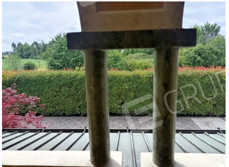
41. Vista dal balcone in lato est