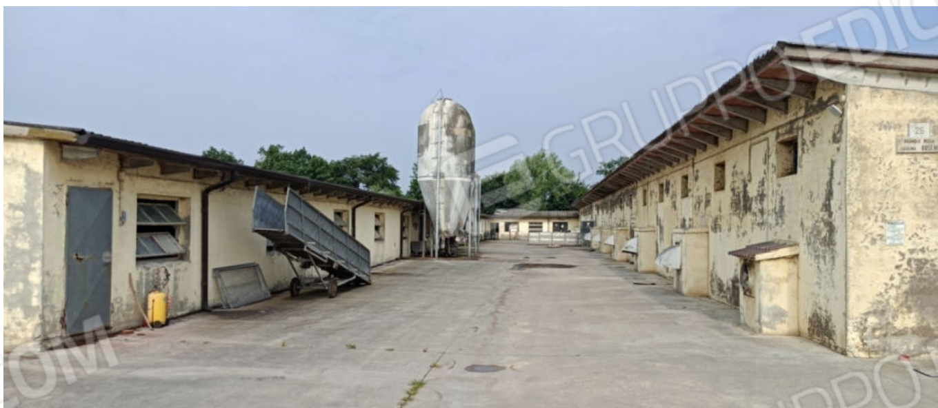
7. Corte interna alle stalle (vista verso ovest)