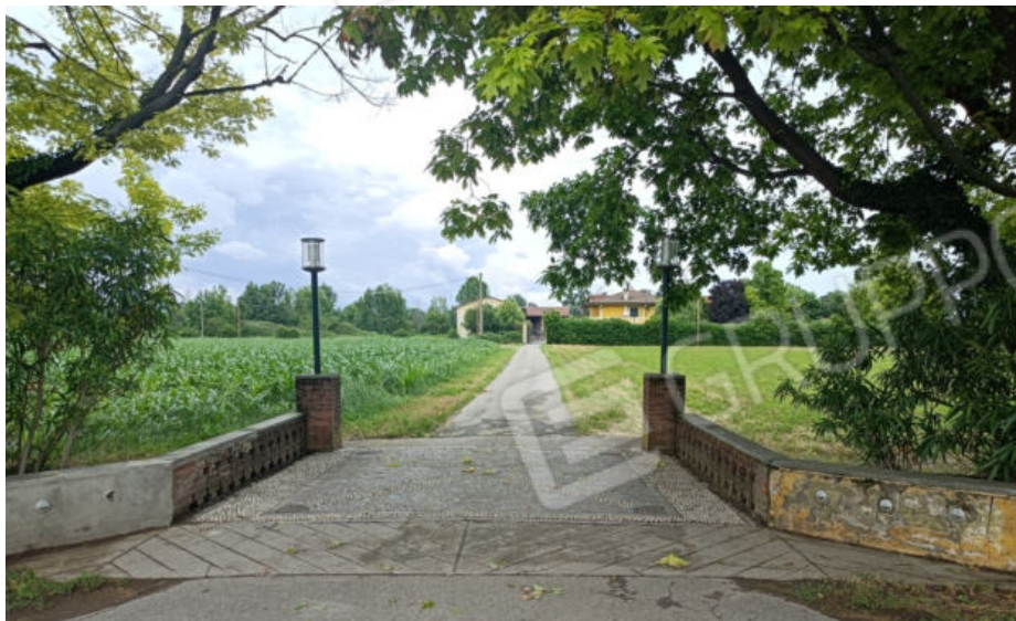
1. Strada di accesso alla casa in Cascina Comune, lato sud