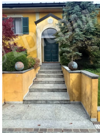
7. Ingresso alla scala comune