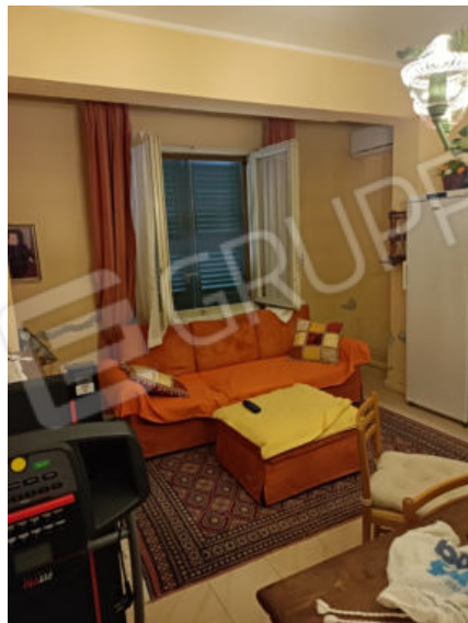
12. La taverna