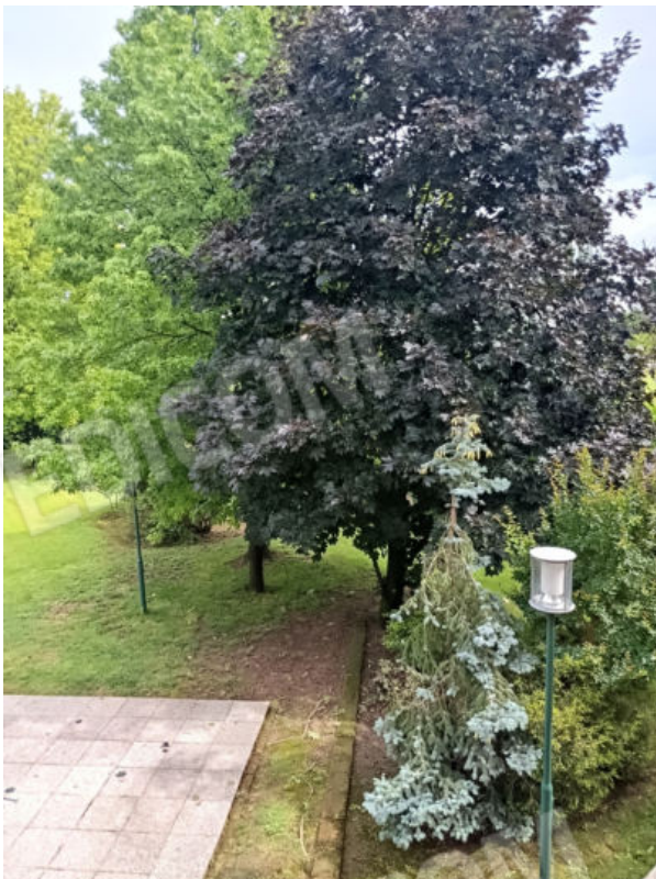
26. Balcone in lato sud