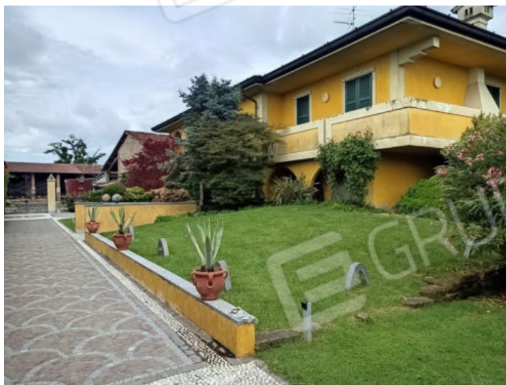
5. Vista sud-ovest