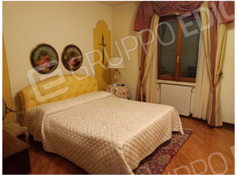
18. Camera in lato ovest