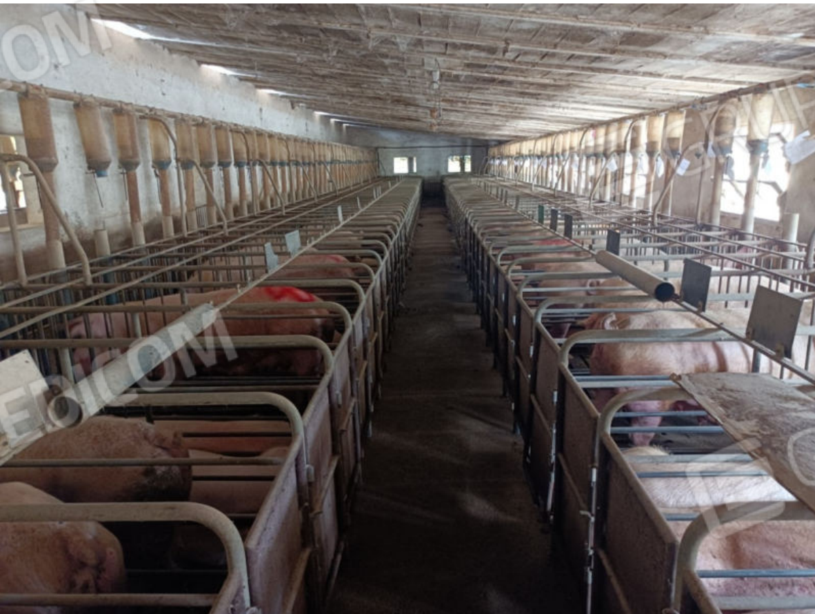
10. Vista interna dell'ala sud verso ovest