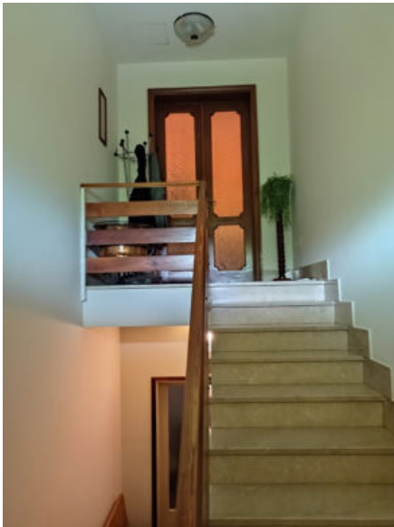
23. Scala di accesso