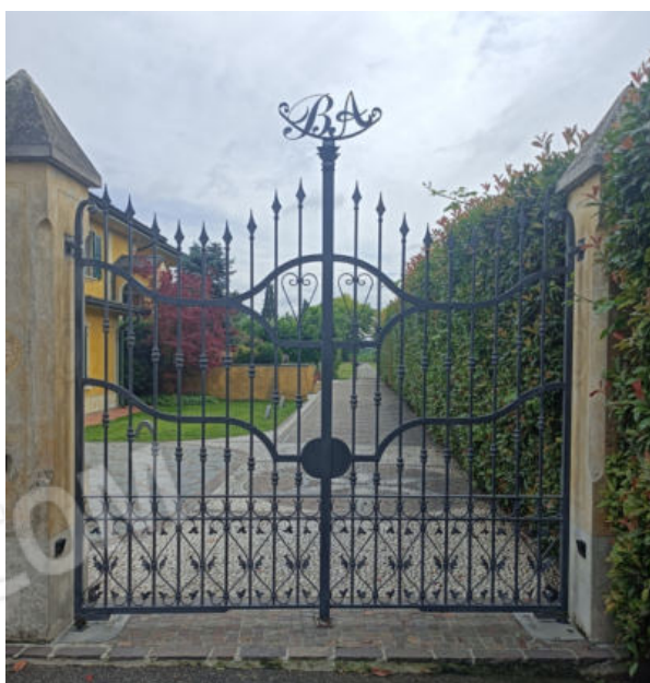
2. Cannello ingresso a nord