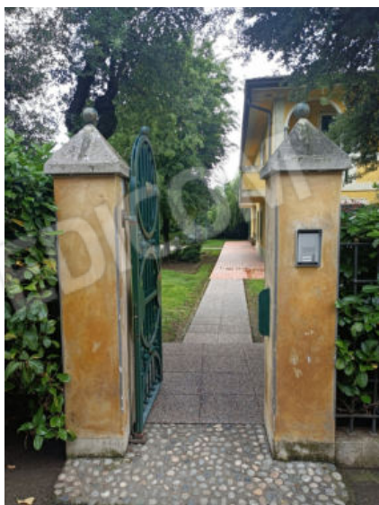
4. Ingresso pedonale a sud