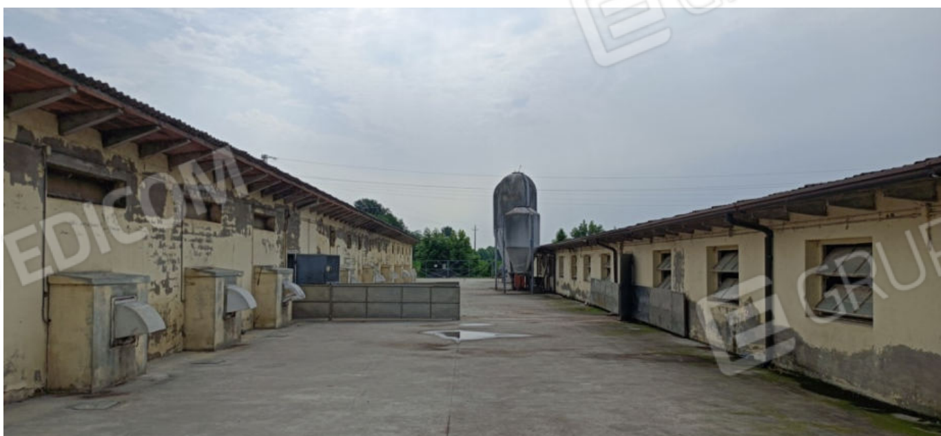
8. Corte interna alle stalle (vista verso est)