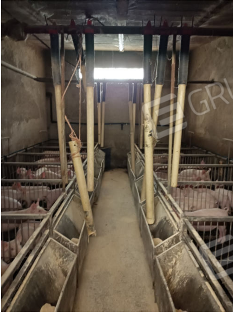
11. Vista interna dell'area di svezzamento