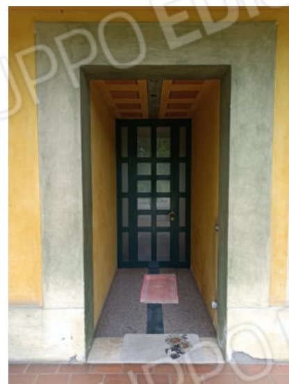
9. Ingresso al P.T.