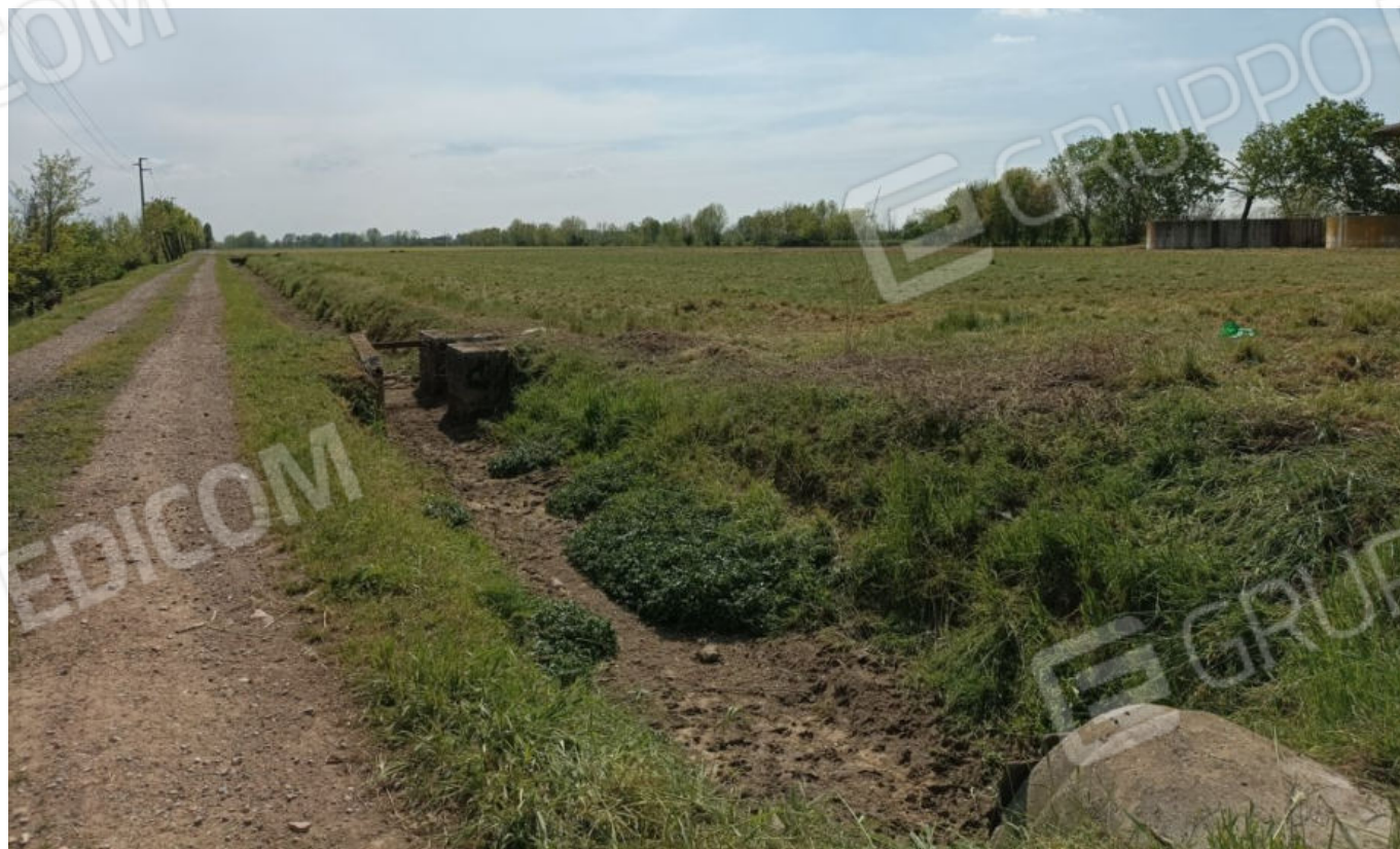
2. Terreno Fg. 33 Mapp. 96 a lato della strada, Mapp. 102 e sul fondo Mapp. 94 e 98 (vista verso sud)