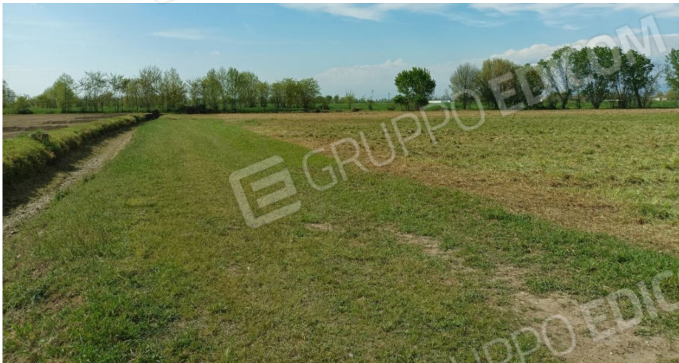
3. Terreno Fig. 33 Mapp. 94 e 98 (vista verso ovest)