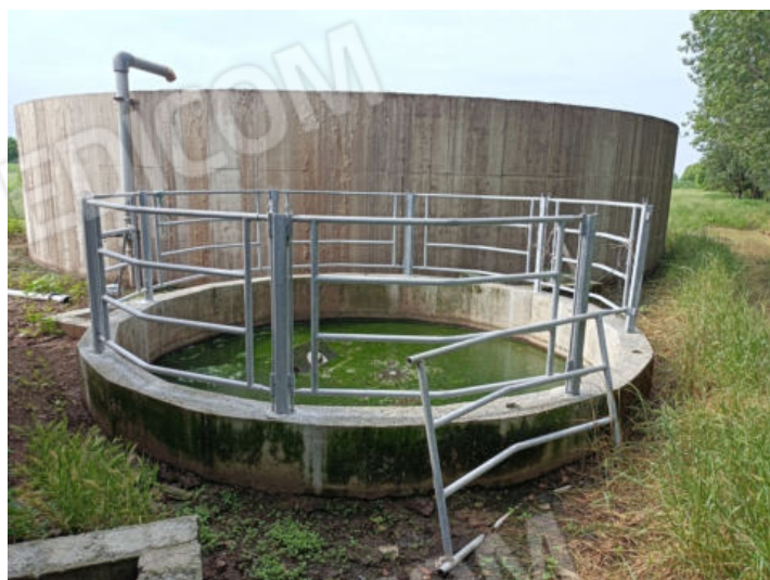
4 e 5. Vasche di raccolta dei liquami poste sul Fig. 33 Mapp. 82