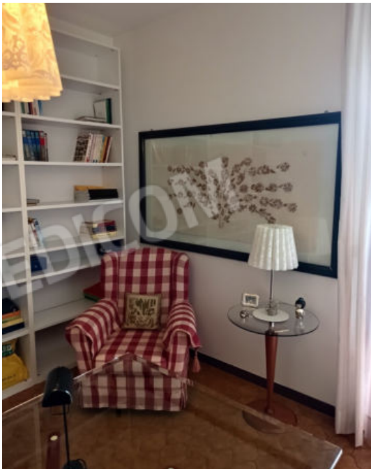
30. 31. Studio