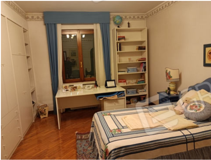
17. Camera in lato est