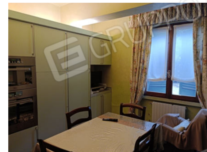
21. 22. Cucina