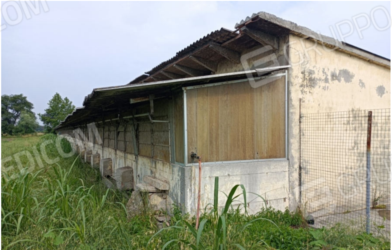
12. L'ala sud con il palchetto coperto di defecazione