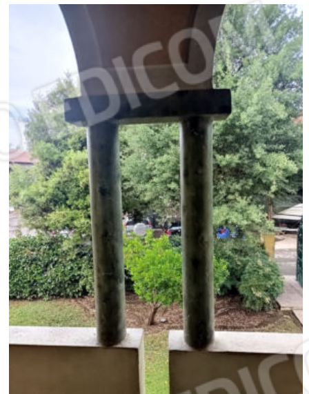
37. Balcone in lato nord