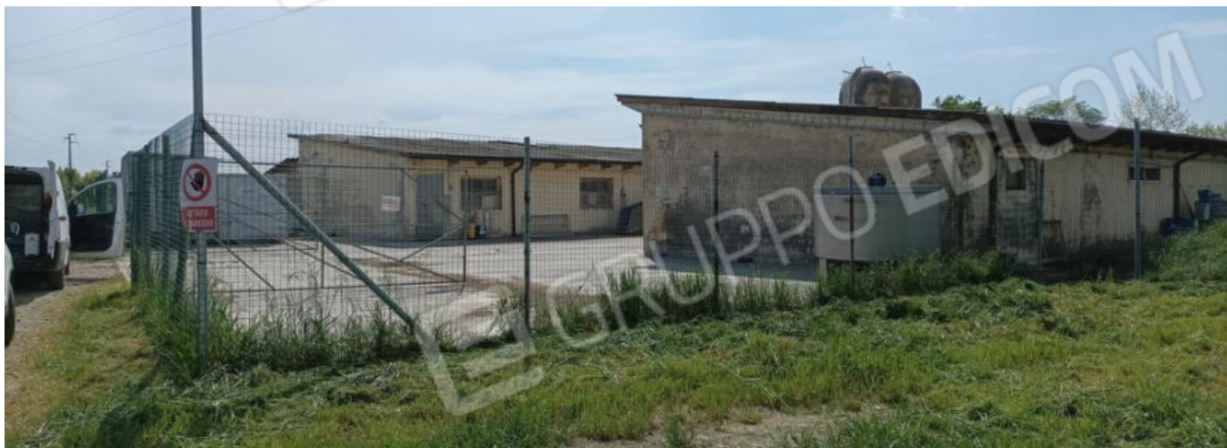
6. Le stalle viste dalla Via Offlaga