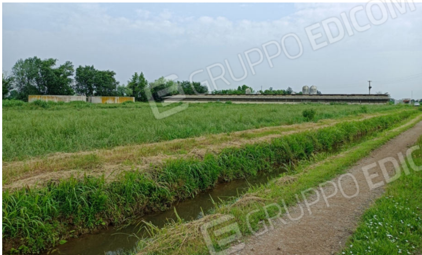
1. Terreno Fg. 33 Mapp. 102 e sul fondo Mapp. 82 (vista verso nord)