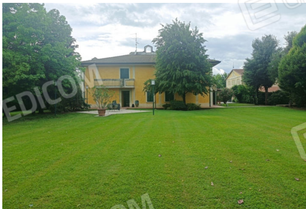
10. La corte comune