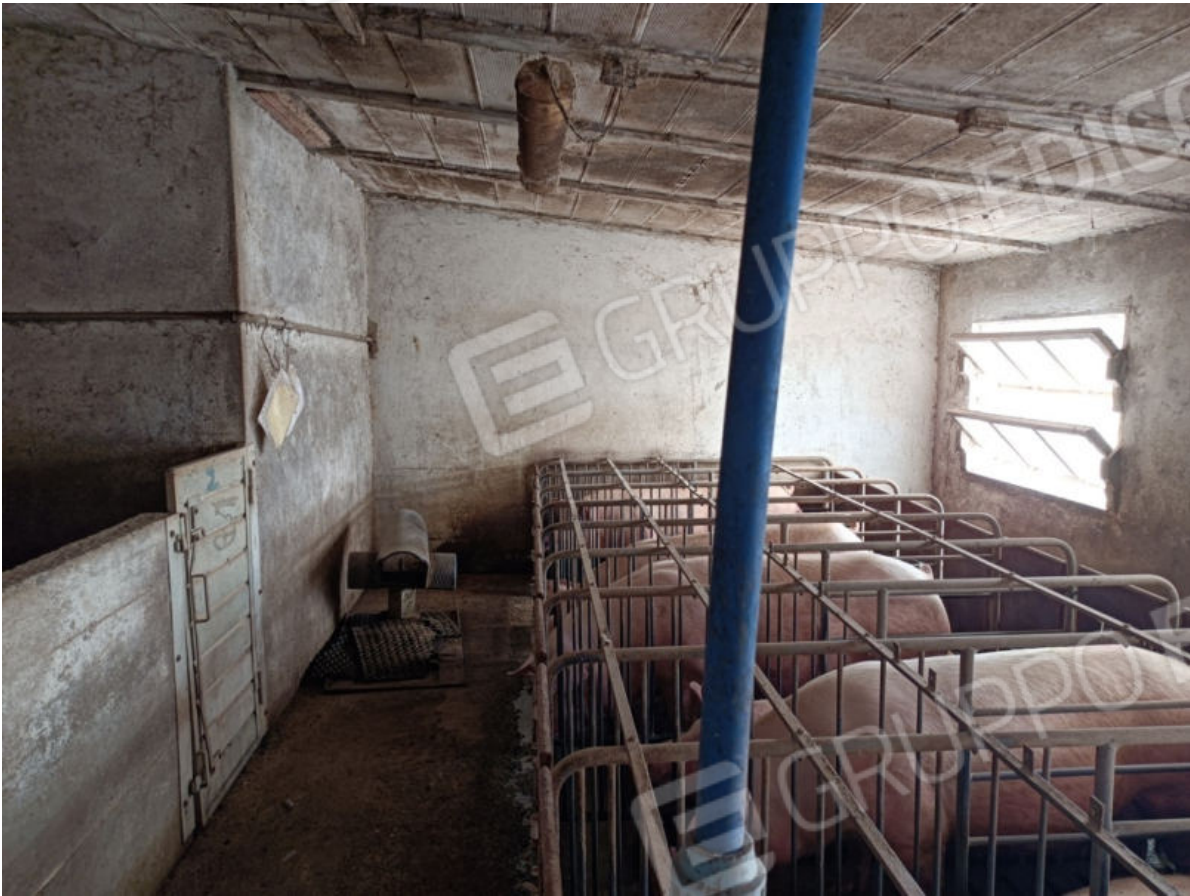
9. Sala di attesa della fecondazione