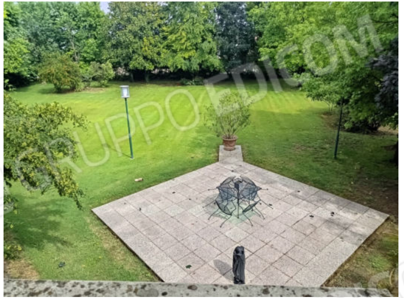
32. 33. 34. Balconi a est con vista sulla corte