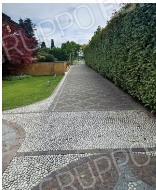
3. Strada interna