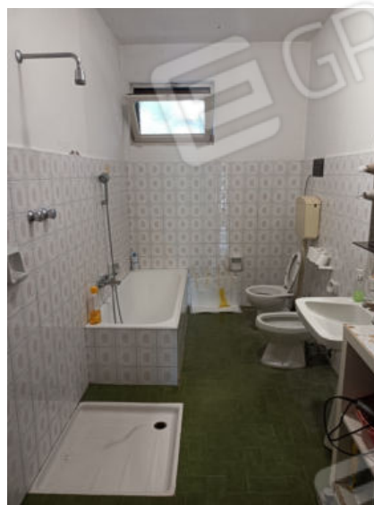
13. Il bagno