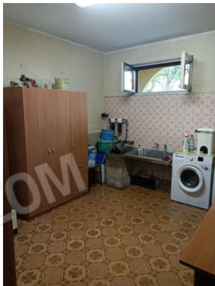
14. La lavanderia