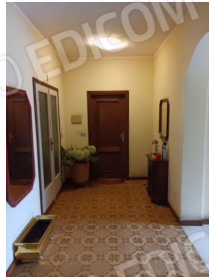
13. Il disimpegno