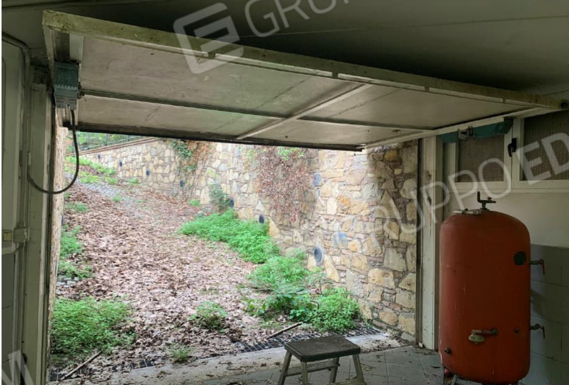
GARAGE INTERRATO-A DESTRA DELLA FOTOGRAFIA PORTA VANO IMPIANTI DELL'UNITA' CON SUBALTERNO 505 NON NELLA PROCEDURA