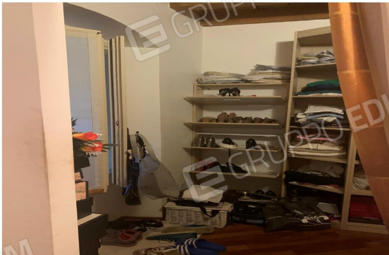
VANO SPOGLIATOIO ADIACENTE AL DISIMPEGNO

mapp.110/sub.501 - fg. 5 NCT BORGOSATOLLO (BS), Via Verdi,20 VANO ARMADI ADIACENTE AL DISIMPEGNO