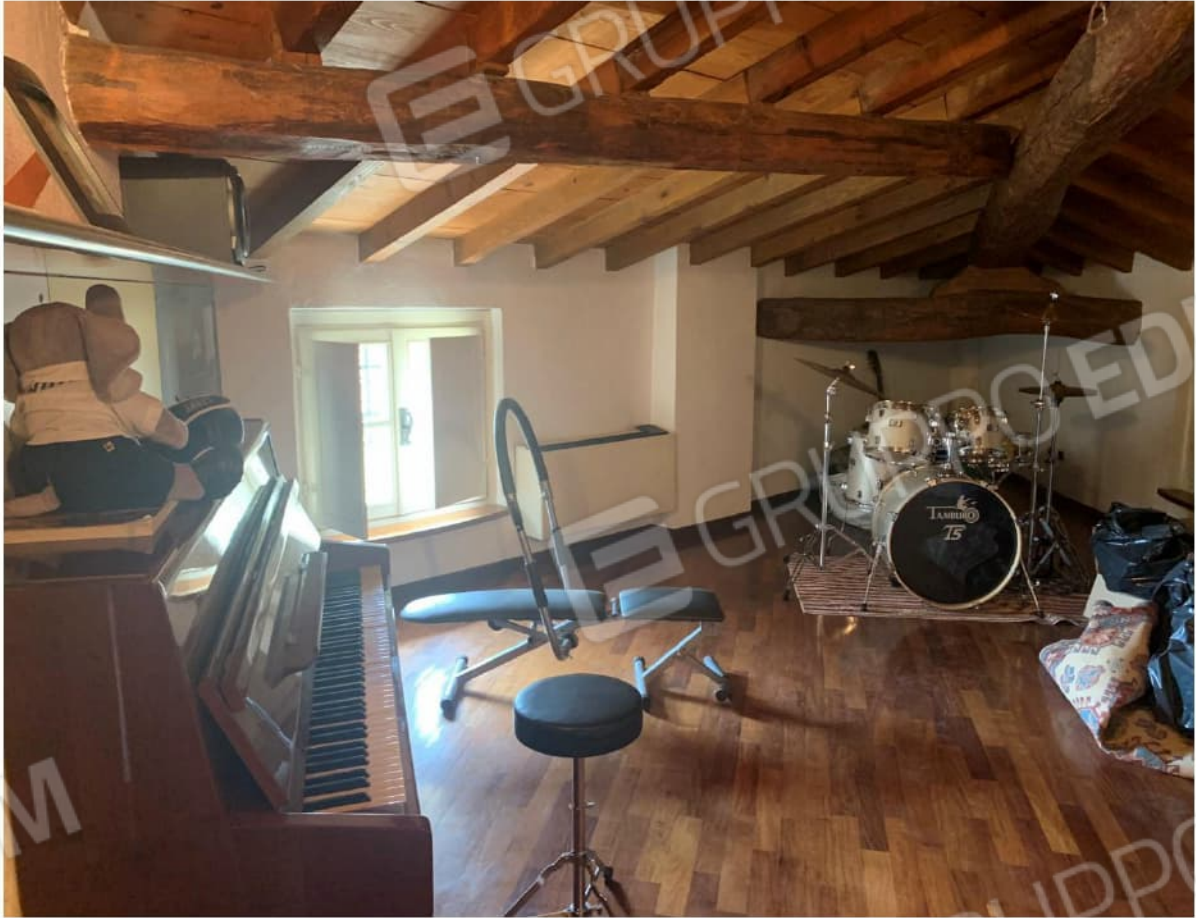
PIANO SOTTOTETTO INGRESSO DEL VANO

mapp.110/sub.501 - fg. 5 NCT BORGOSATOLLO (BS), Via Verdi,20 PIANO SOTTOTETTO VANO VERSO SUD A DISPOSIZIONE