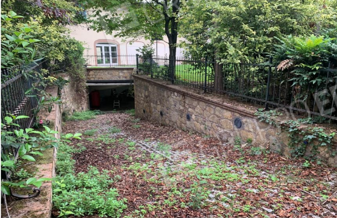
GARAGE INTERRATO FOTOGRAFIA VERSO L'USCITA VIA VERDI

GARAGE INTERRATO ACCESSO DALLA VIA VERDI,22 - RAMPA DISCESA