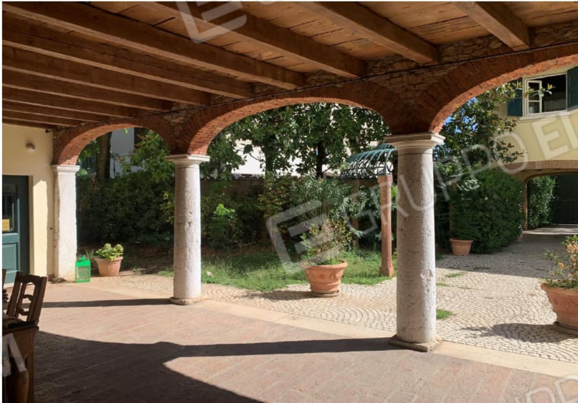
INGRESSO A DESTRA DELLA PROPRIETA' DEL SUB. 501