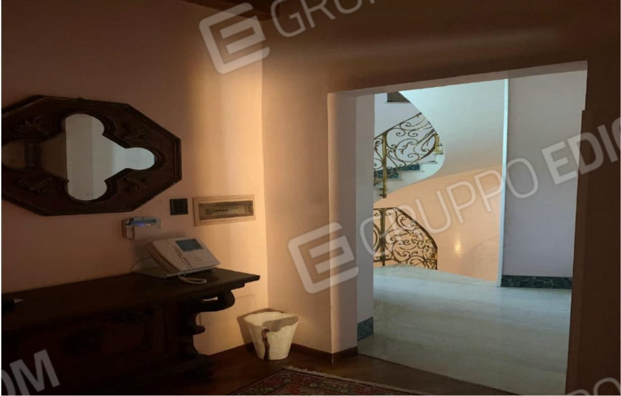
PIANO PRIMO - SOGGIORNO

mapp.110/sub.501 - fg. 5 NCT BORGOSATOLLO (BS), Via Verdi,20 PIANO PRIMO - ATRIO INGRESSO