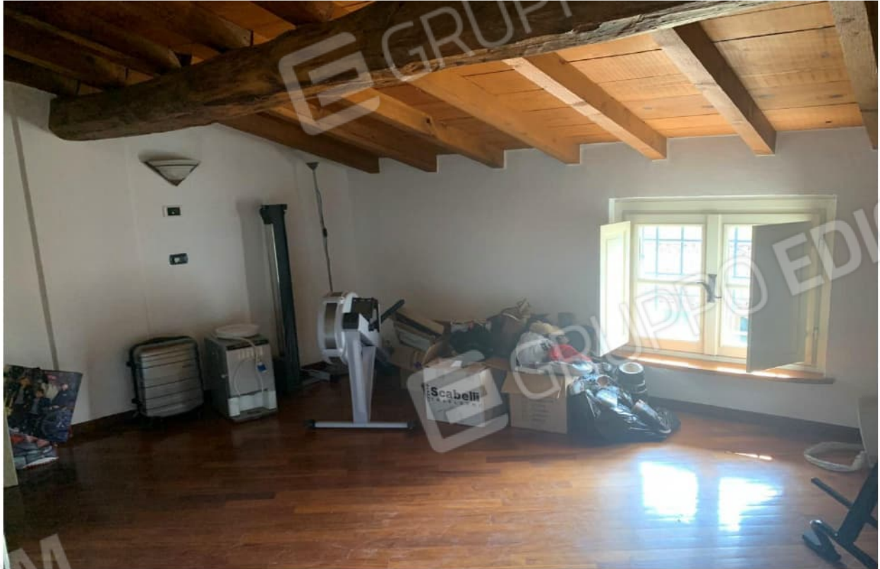
PIANO SOTTOTETTO VANO STUDIO - SALA GIOCHI

mapp.110/sub.501 - fg. 5 NCT BORGOSATOLLO (BS), Via Verdi,20 PIANO SOTTOTETTO ALTRO VANO VERSO SUD