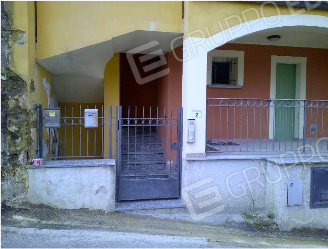
FOTO 4 PORTICO COMUNE AL PIANO RIALZATO (Fg. 6, mapp. 3619, sub. 8)