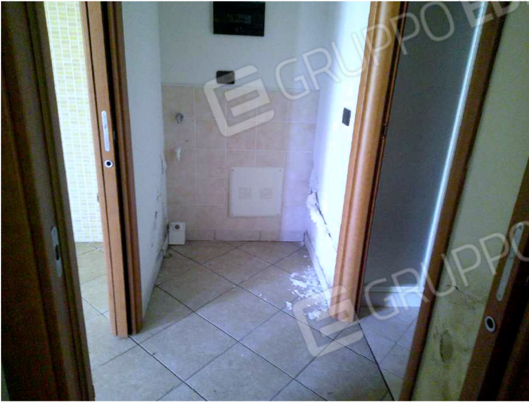
FOTO 8 SERVIZIO IGIENICO