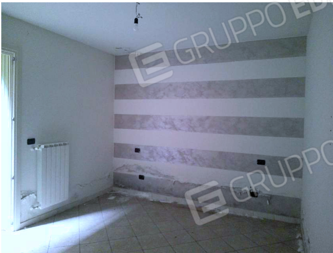
FOTO 10 CAMERA CON EVIDENTI PROBLEMI DI UMIDITA'