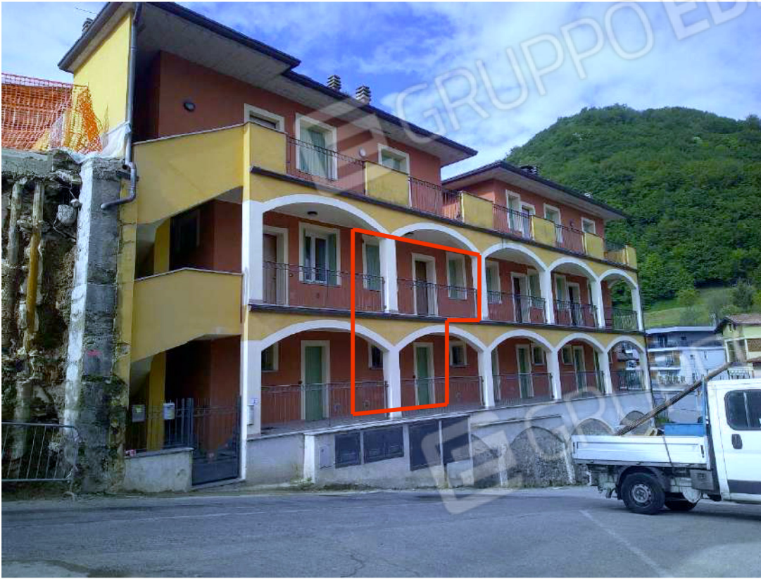
FOTO 2 ESTERNO DEL FABBRICATO