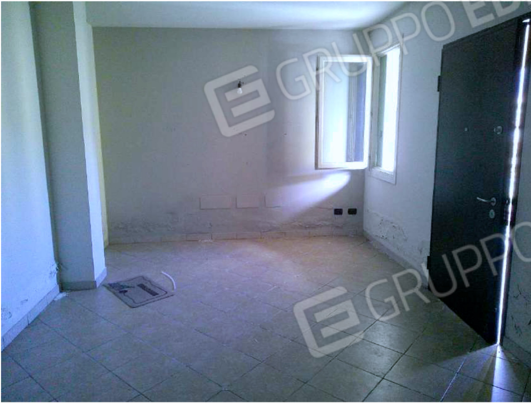
FOTO 6 SOGGIORNO (ANGOLO COTTURA) CON EVIDENTI PROBLEMI DI UMIDITA'