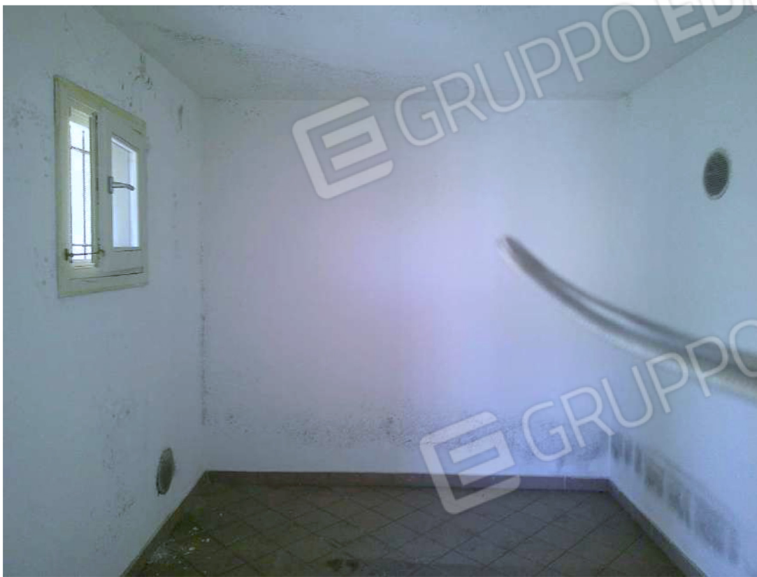
FOTO 14 CANTINA AL PIANO SEMINTERRATO CON EVIDENTI PROBLEMI DI UMIDITA'