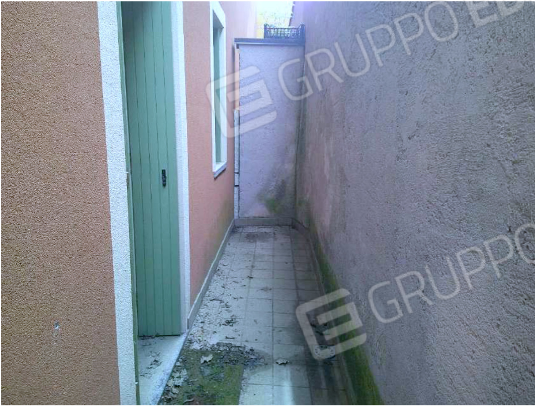
FOTO 12 FOTO 4 PORTICO COMUNE AL PIANO SEMINTERRATO (Fg. 6, mapp. 3619, sub. 7)