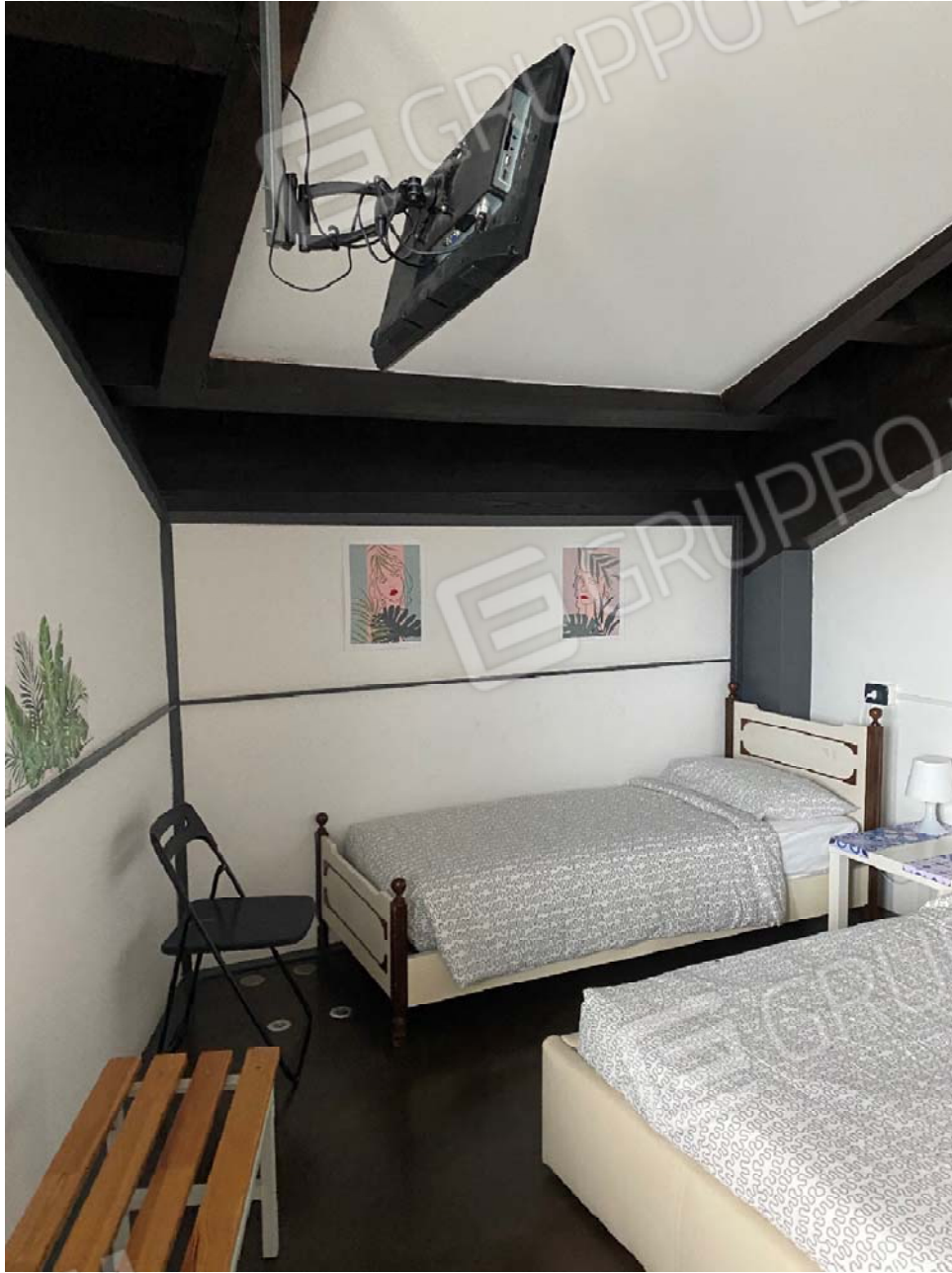
Piano secondo - Fg. 17, mapp 923, sub.47