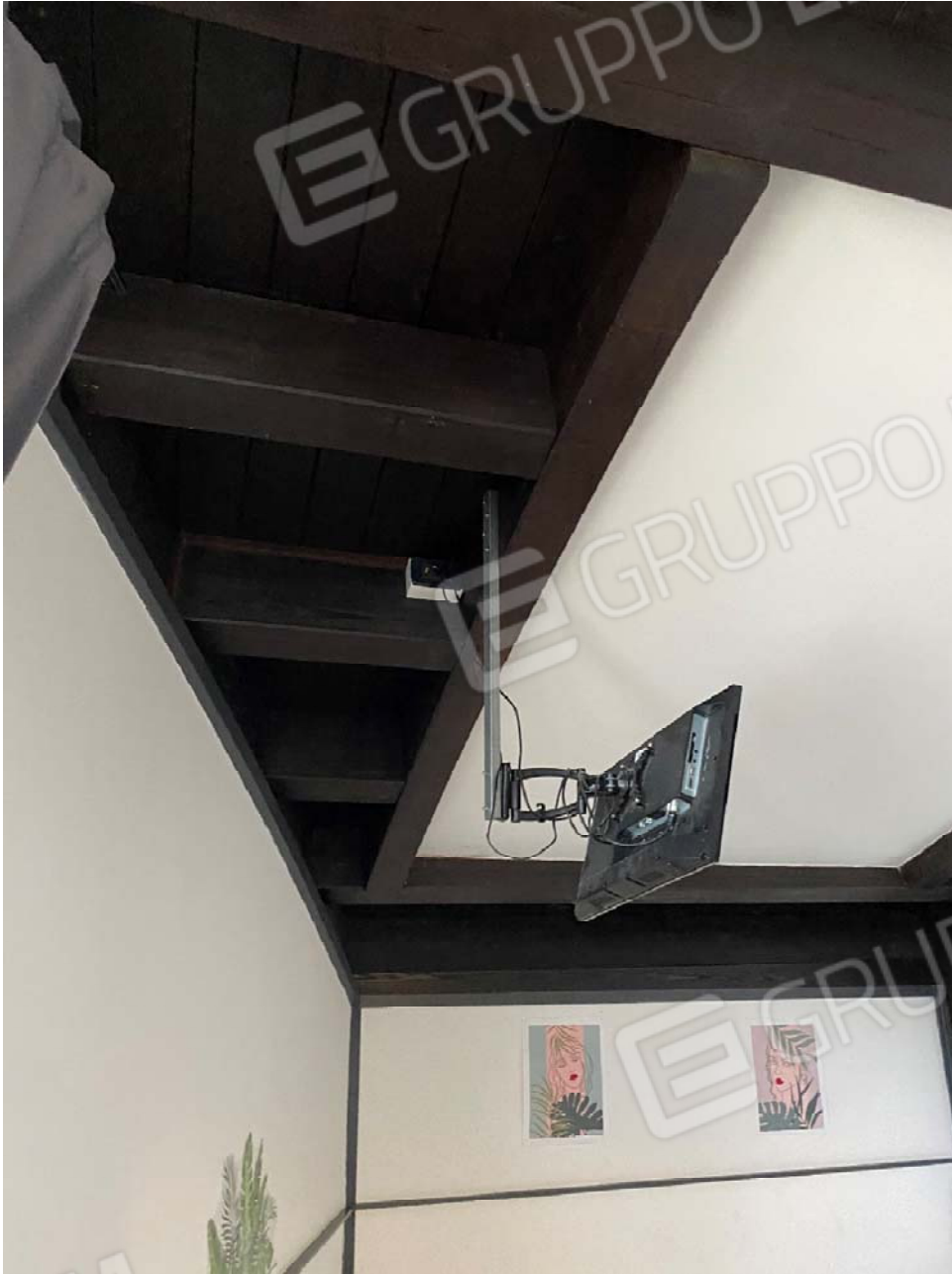
Piano secondo - Fg. 17, mapp 923, sub.47 – particolare del lucernario in corrispondenza della terrazza autorizzata