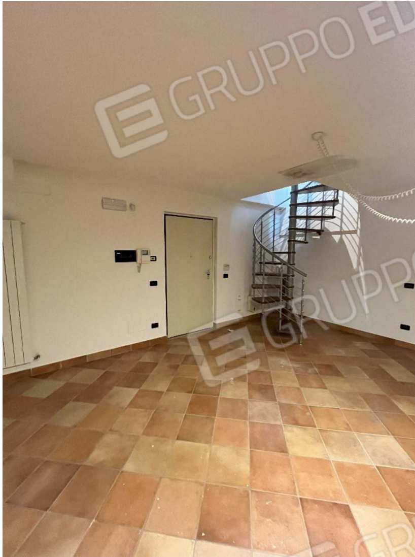
Piano interrato - Fg. 17, mapp 923, sub.23