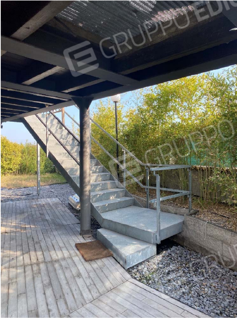
Particolare della scala esterna da demolire