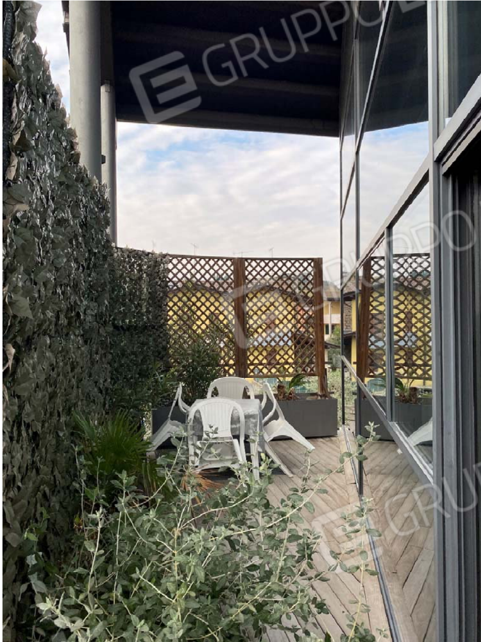
Terrazza di accesso al piano primo