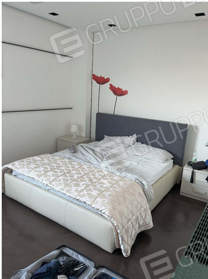
Piano primo - Fg. 17, mapp 923, sub.46