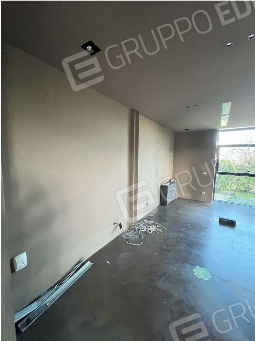
Piano terra - Fg. 17, mapp 923, sub.45