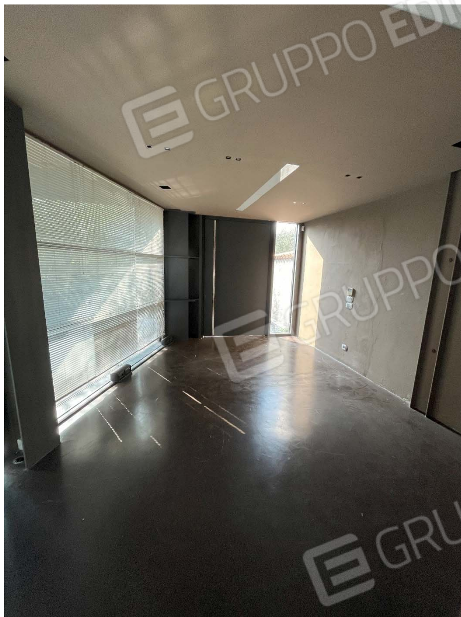
Piano terra - Fg. 17, mapp 923, sub.45