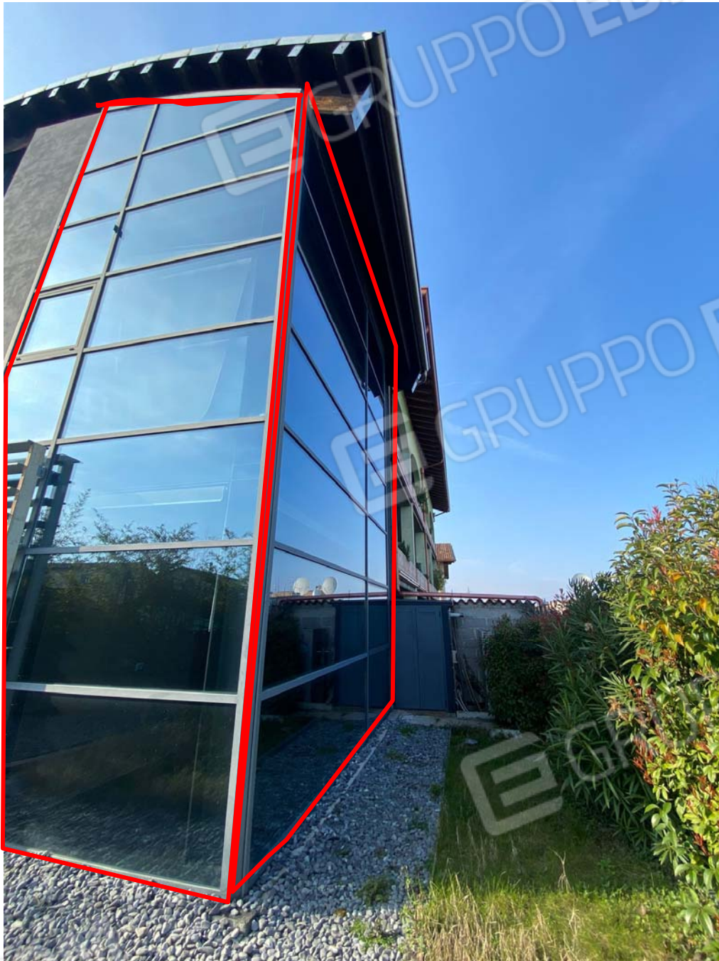
Prospetto est con evidenziata la porzione di volume abusivo