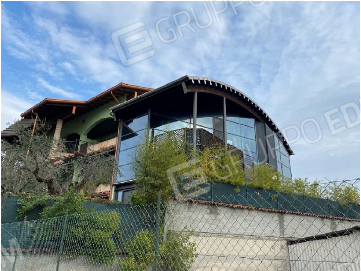
Prospetti sud e ovest