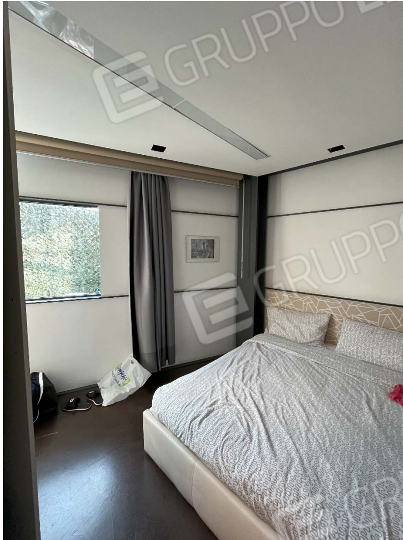
Piano primo - Fg. 17, mapp 923, sub.46