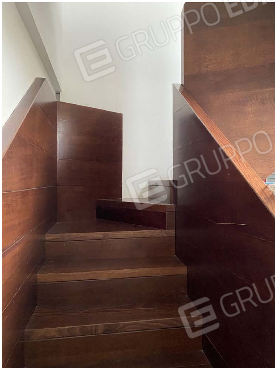
Scala interna tra piano primo e piano secondo