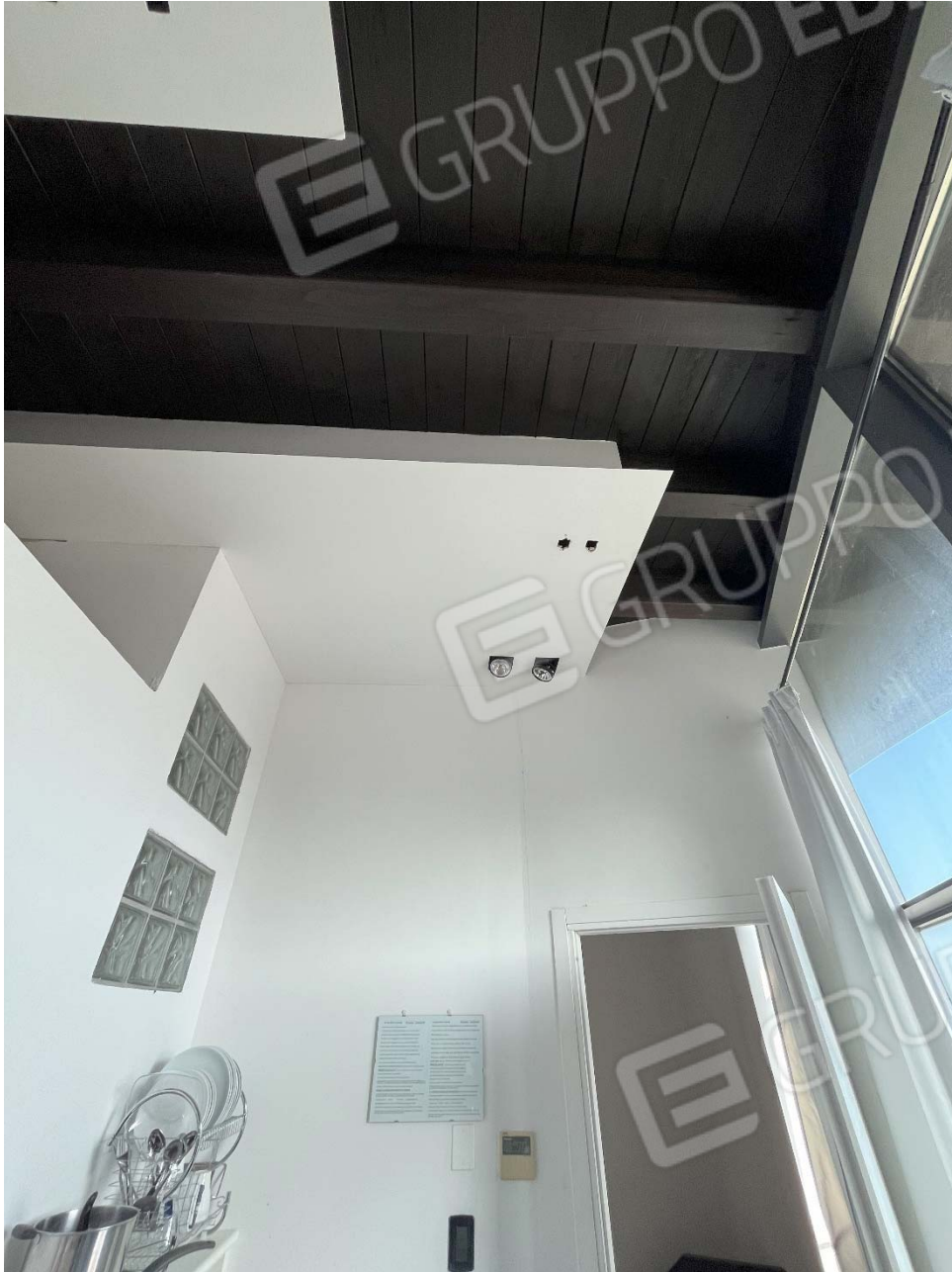
Piano secondo - Fg. 17, mapp 923, sub.47