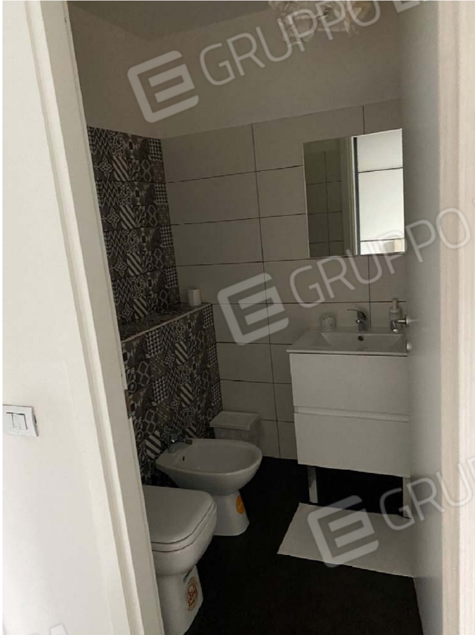
Piano primo - Fig. 17, mapp 923, sub.46 – particolare di un bagno