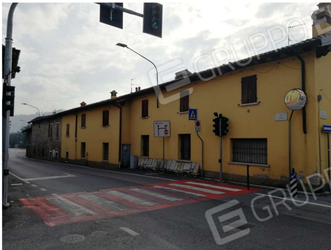
VISTA STRADA VIA RONCO