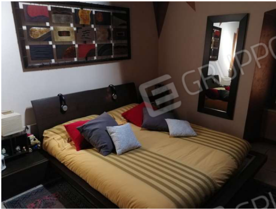
CONDIZIONATORE CAMERA MATRIMONIALE