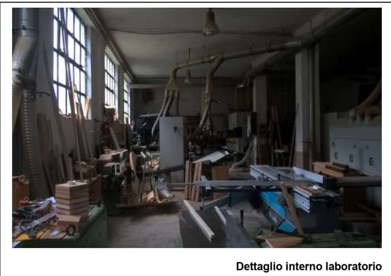
Dettaglio interno laboratorio