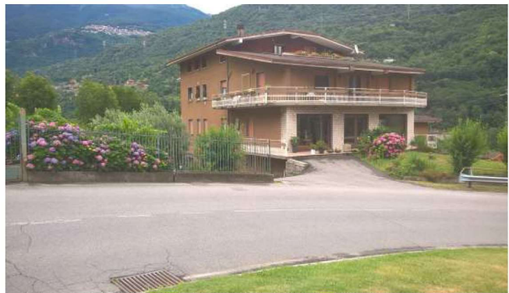
Vista fabbricato da via s. Maria