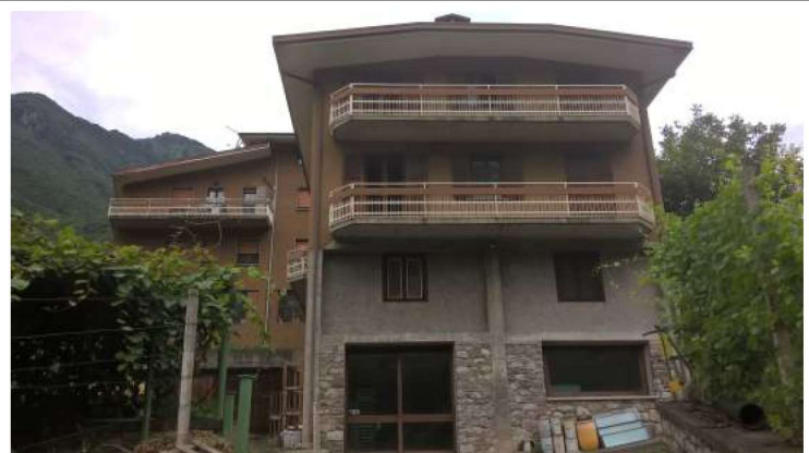
Insieme edificio visto da Est

prossimi alla strada comunale via S.Maria ed un retrostante fabbricato accessorio destinato ad autorimesse e centrale termica. Il compendio è stato edificato, in epoche diverse a partire dal 1972 in forza di titoli amministrativi che ne autorizzavano la realizzazione rilasciati dal comune di Sellero. In particolare si precisa che le unità imm.ri oggetto della presente e cioè i mappali nn. 25 sub. 4, 25 sub 5 e 25 sub 6, sono contenuti nel corpo di fabbrica realizzato con il primo titolo edilizio