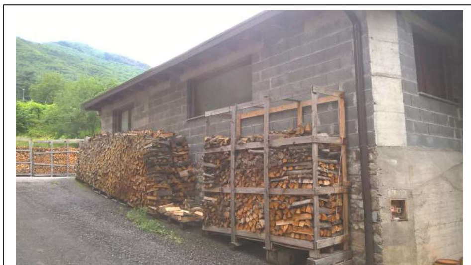
Dettaglio fabbricato accessorio