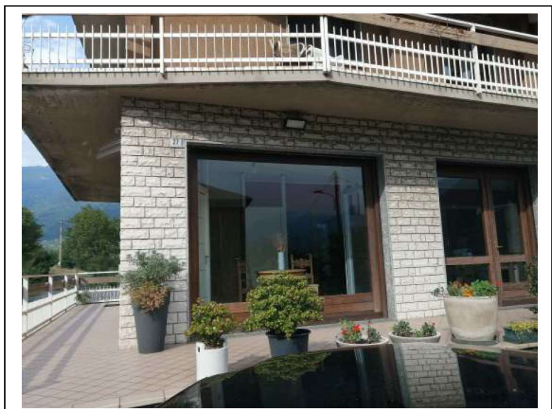
Dettaglio Via e n.civico

B.1) Proceda all'identificazione dei beni pignorati previo accesso ai luoghi, comprensiva dei confini e dei dati catastali, indicando analiticamente eventuali pertinenze, accessori, parti comuni e condominiali, anche con specifico esame in merito del titolo di provenienza e del regolamento di condominio ove esistente. All'uopo alleggi planimetrie dello stato dei luoghi ed idonea rappresentazione fotografica ed eventualmente video filmati epurati delle persone occupanti degli immobili pignorati e delle pertinenze.