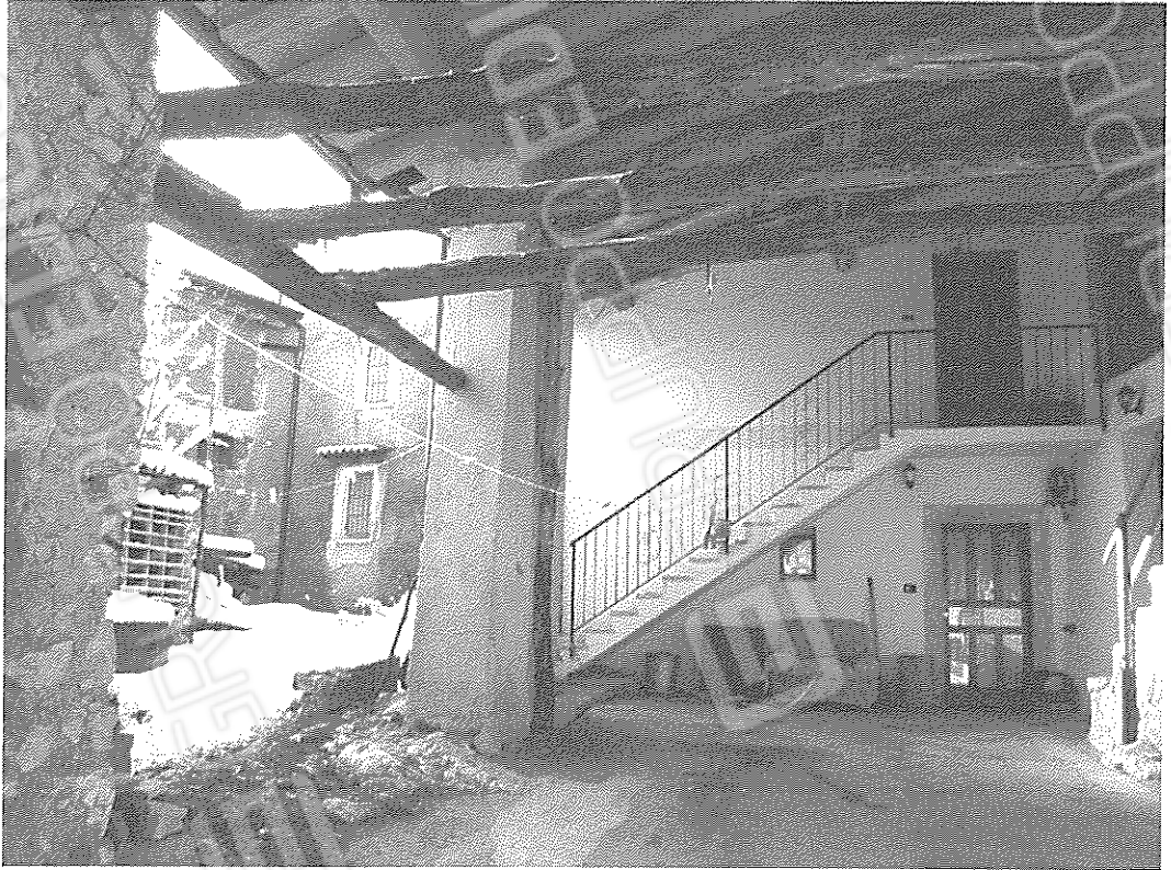
Ingresso dal porticato e veduta corte interna