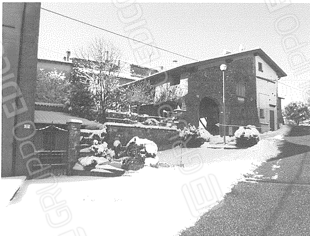
Veduta del complesso immobiliare di cui parte è oggetto di esecuzione: in evidenza l'ingresso da Via Villa n. 9