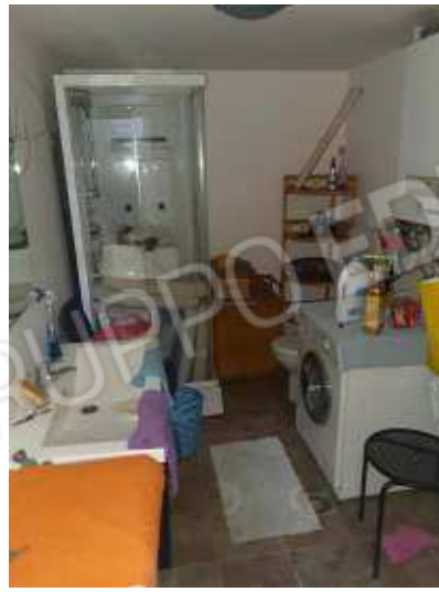
interno disimpegno sub 13