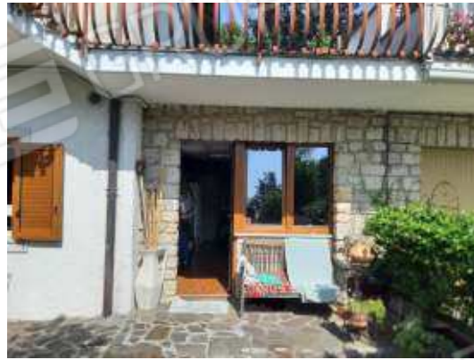
esterno disimpegni piano terra di uso escluso dell'appartamento piano primo sub 13