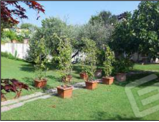
giardino comune alle due unità immobiliari – sub 15