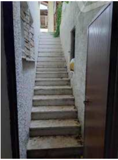
Scala di collegamento appartamento piano primo sub 13 con disimpegno posto al piano terra di uso esclusivo. Formalmente è una rimessa, il cambio di destinazione d'uso non è stato autorizzato abuso