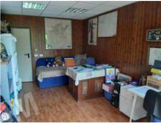
Interno secondo disimpegno Formalmente è una rimessa, il cambio di destinazione d'uso non è stato autorizzato abuso