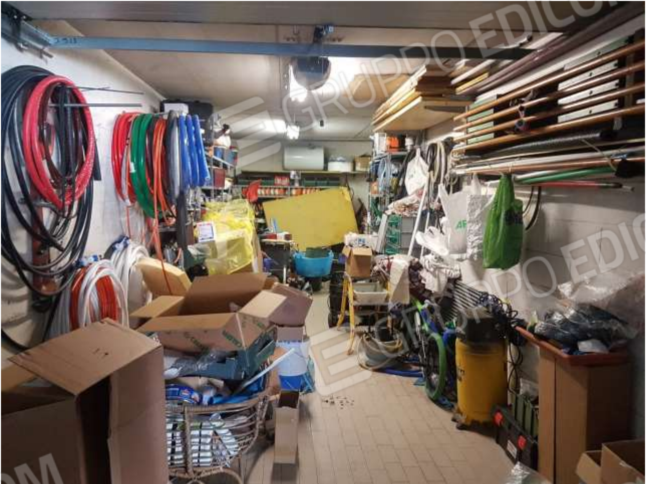
Vista interno autorimessa piano primo interrato.