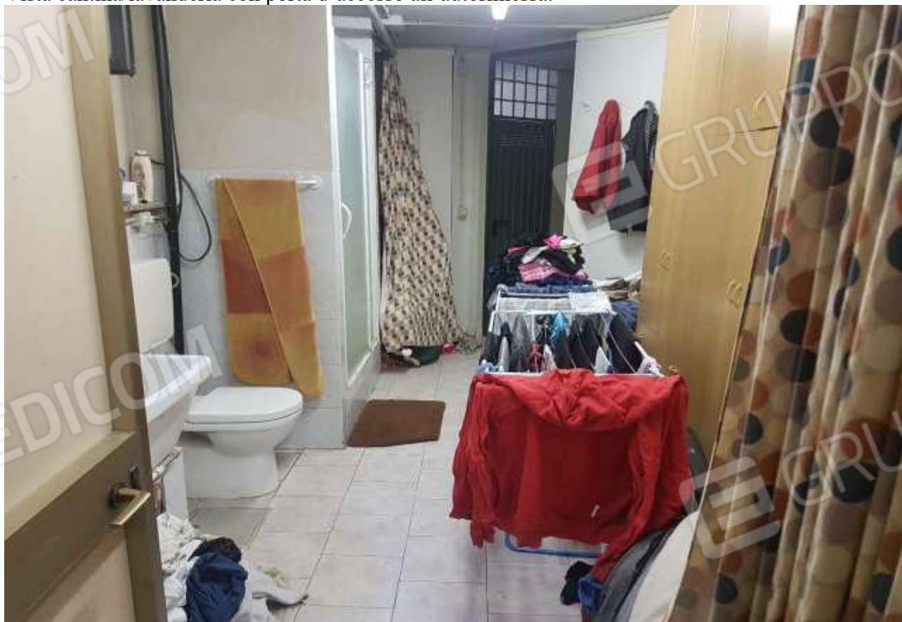
Vista cantina/lavanderia con porta d'accesso da disbrigo condominiale.