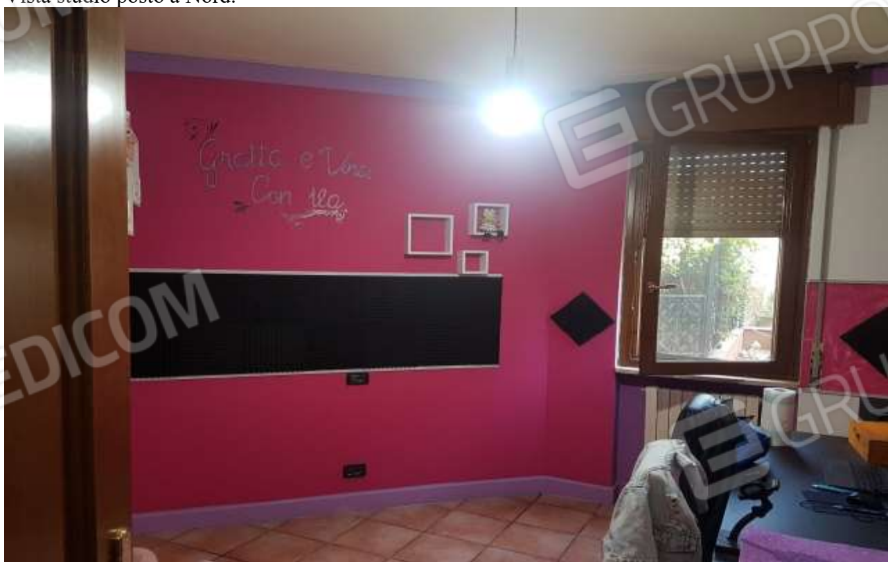
Vista studio posto a Nord.