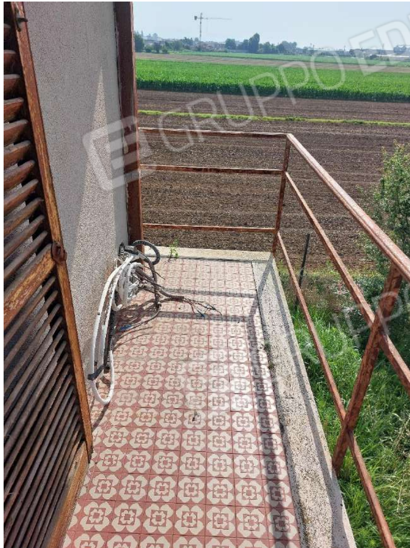
Immagine 14 – Balcone lato Sud.