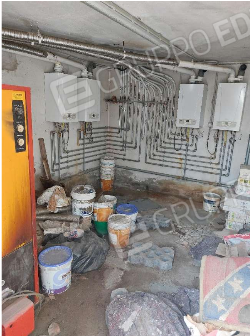
Immagine 22 – Locale tecnico comune.