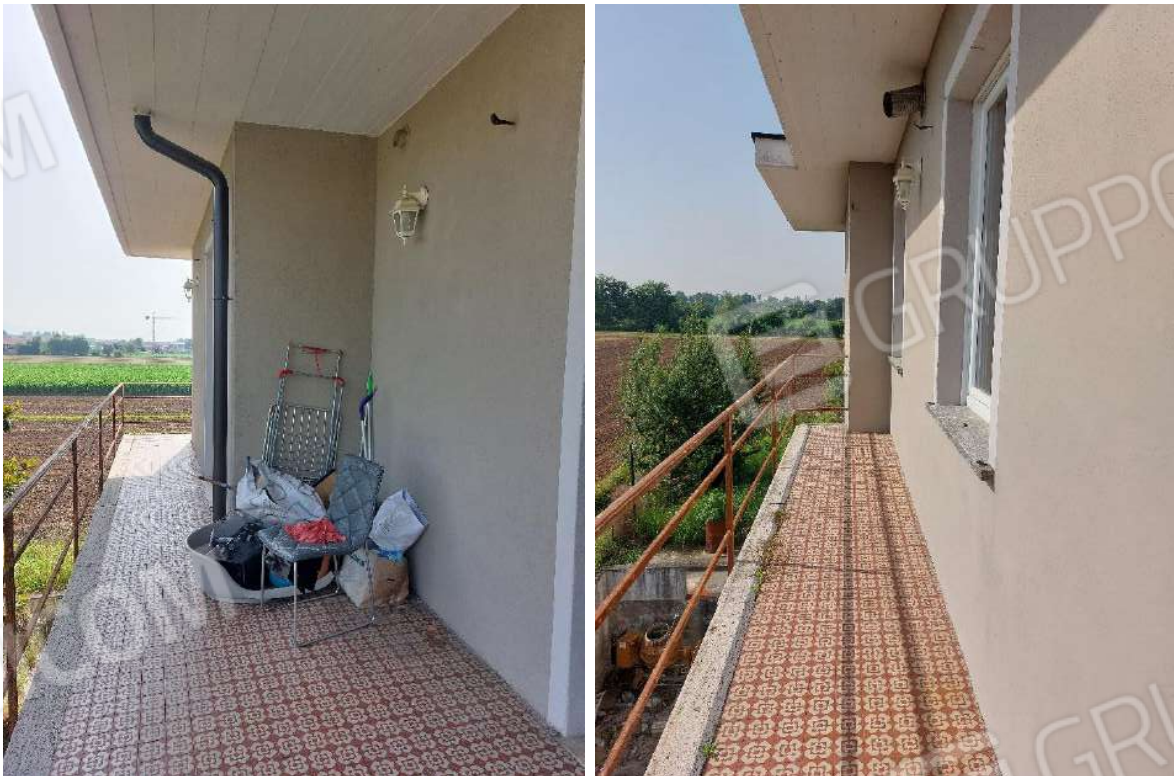
Immagine 5 – Balcone lato Nord e Est.