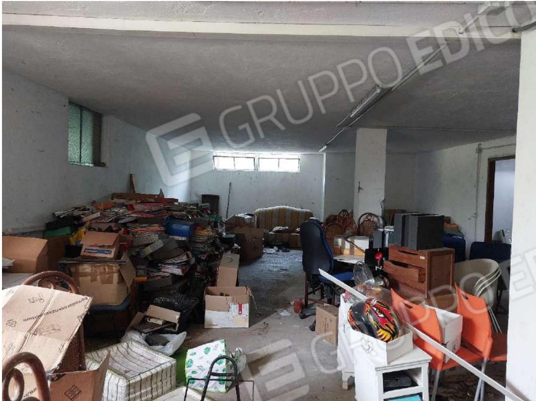
Immagine 17 – Cantina comune.