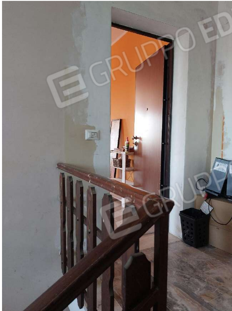
Immagine 3 – Ingresso all'appartamento dal vano scala comune.