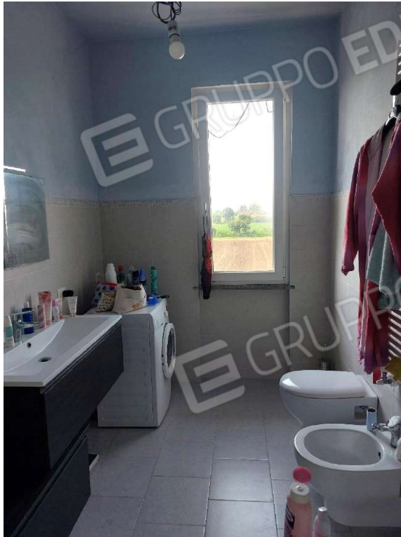
Immagine 9 – Bagno.