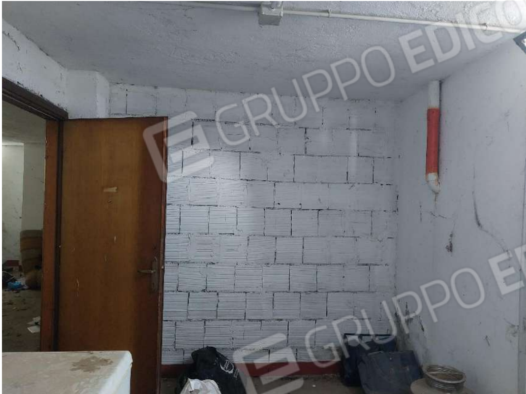
Immagine 20 – Cantina comune.