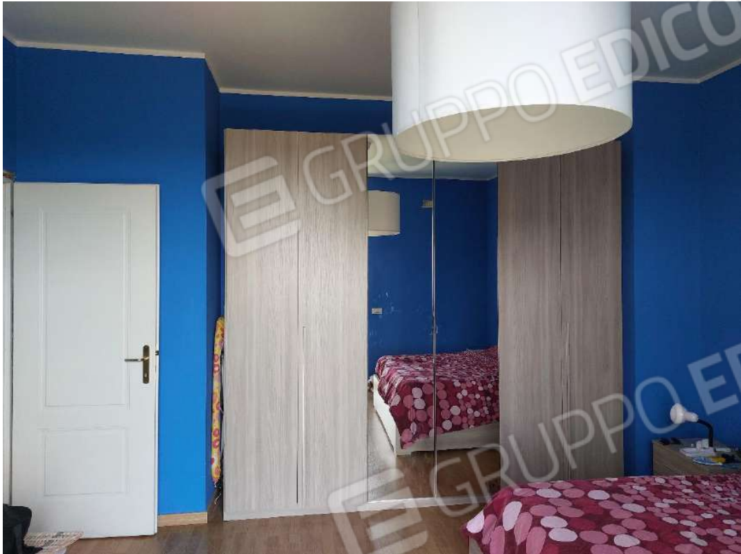
Immagine 13 – Camera matrimoniale.