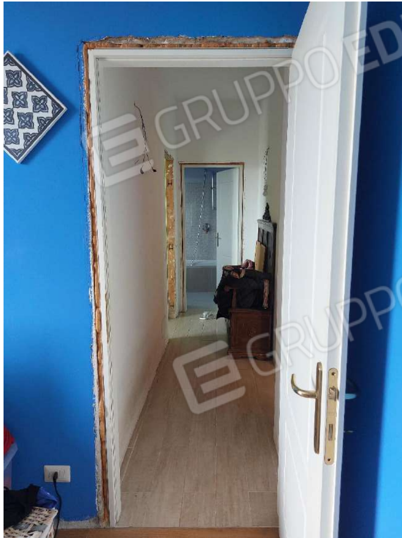
Immagine 8 – Disimpegno zona notte.