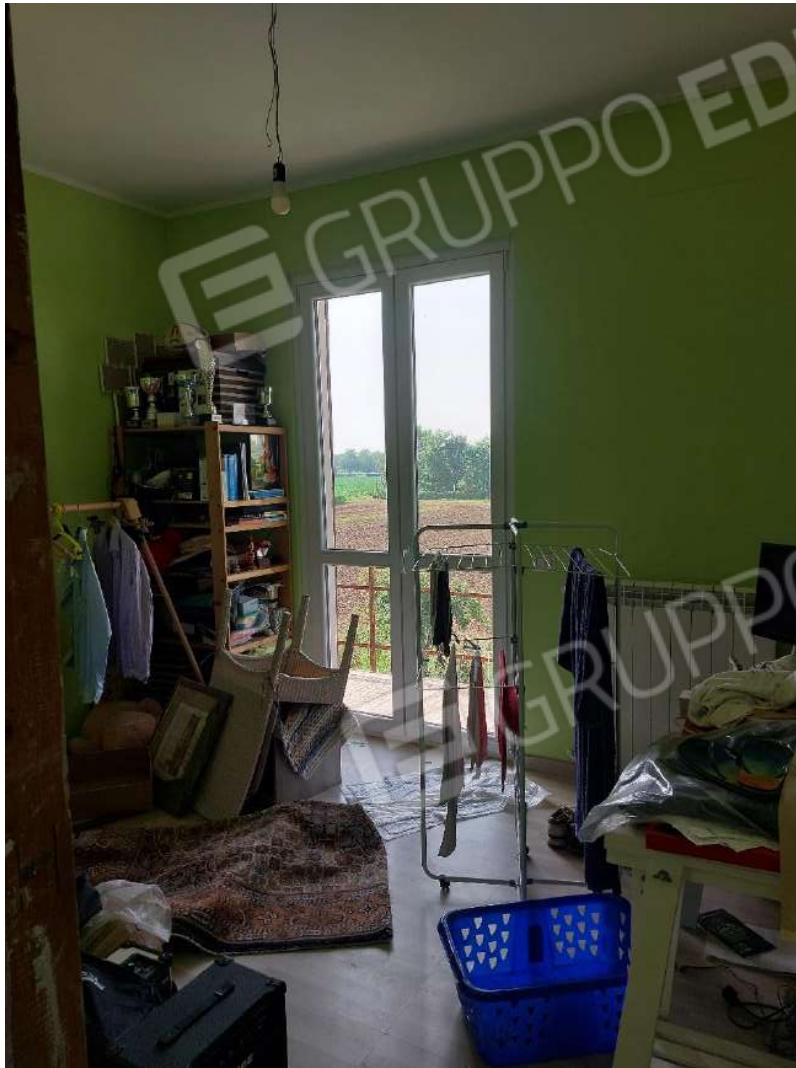
Immagine 11 – Camera.