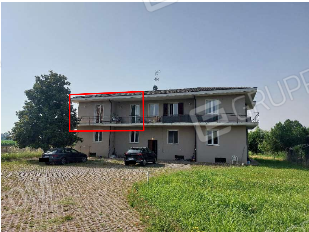
Immagine 2 - Prospetto Nord.