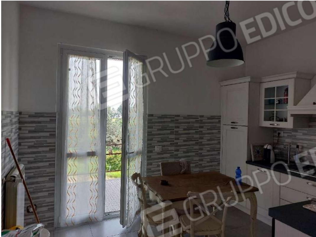
Immagine 4 – Cucina.