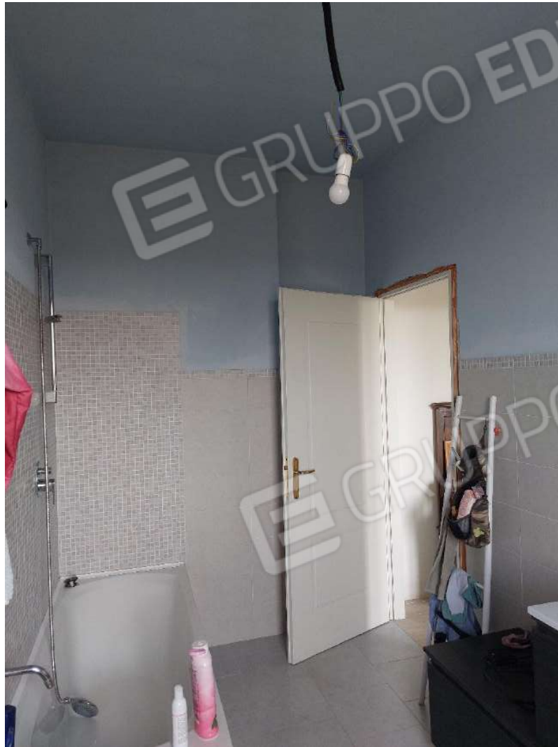
Immagine 10 – Bagno.