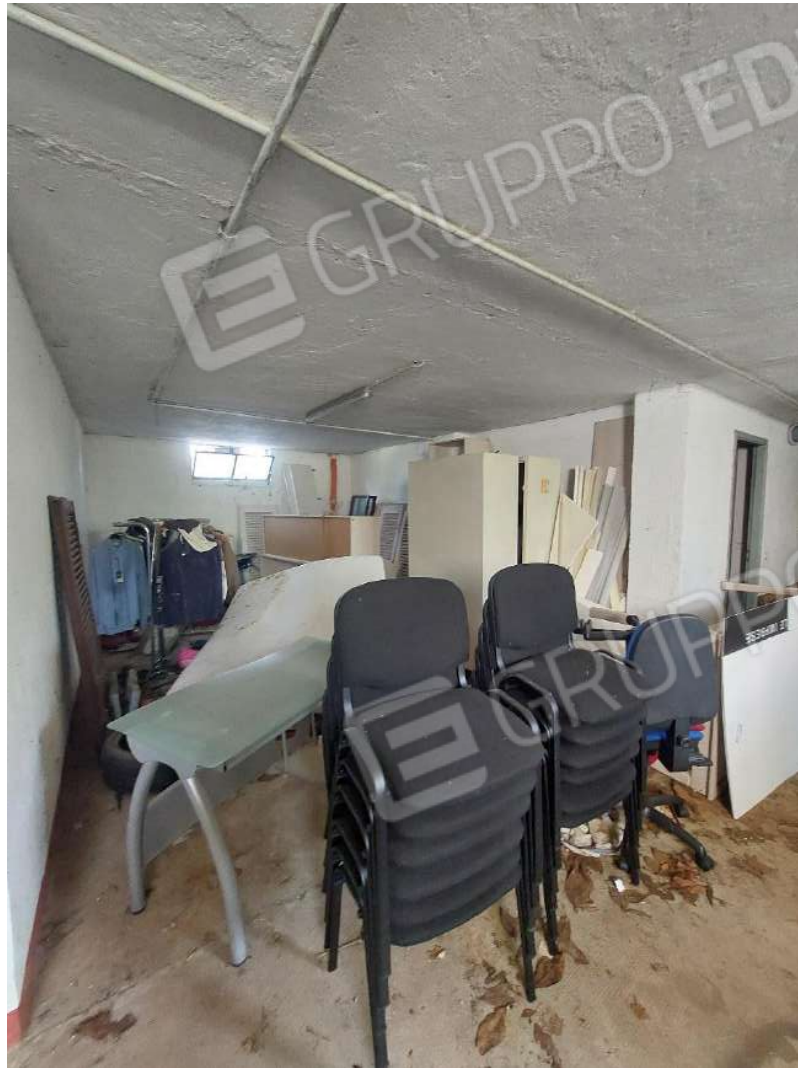
Immagine 16 – Ripostiglio comune.