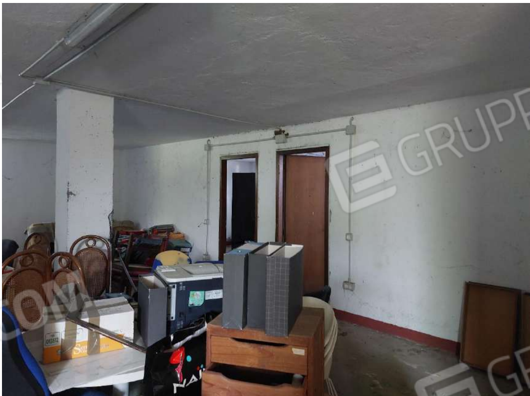
Immagine 18 – Cantina comune: accesso ai due locali ricavati lungo il lato Nord.