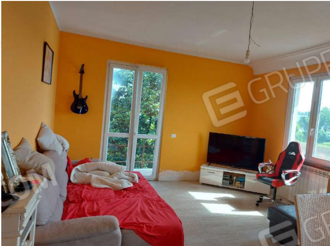
Immagine 7 – Soggiorno.