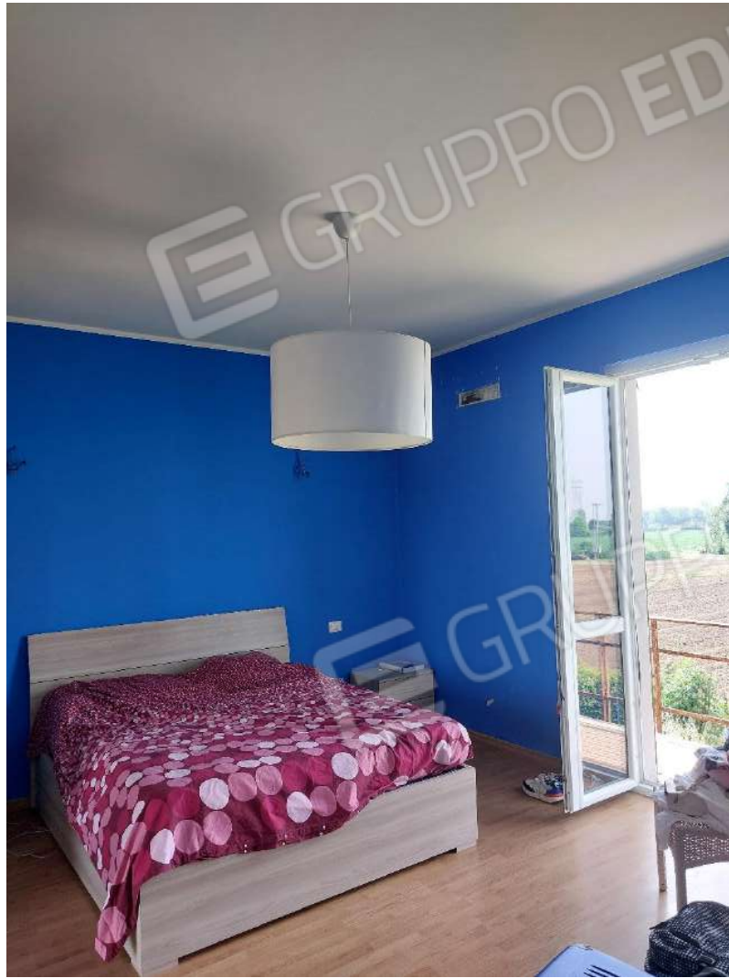
Immagine 12 – Camera matrimoniale.