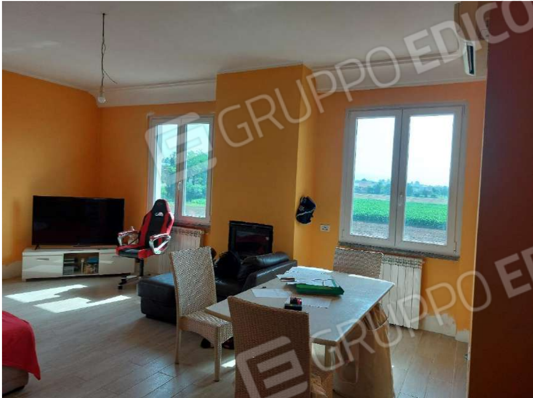
Immagine 6 – Soggiorno.