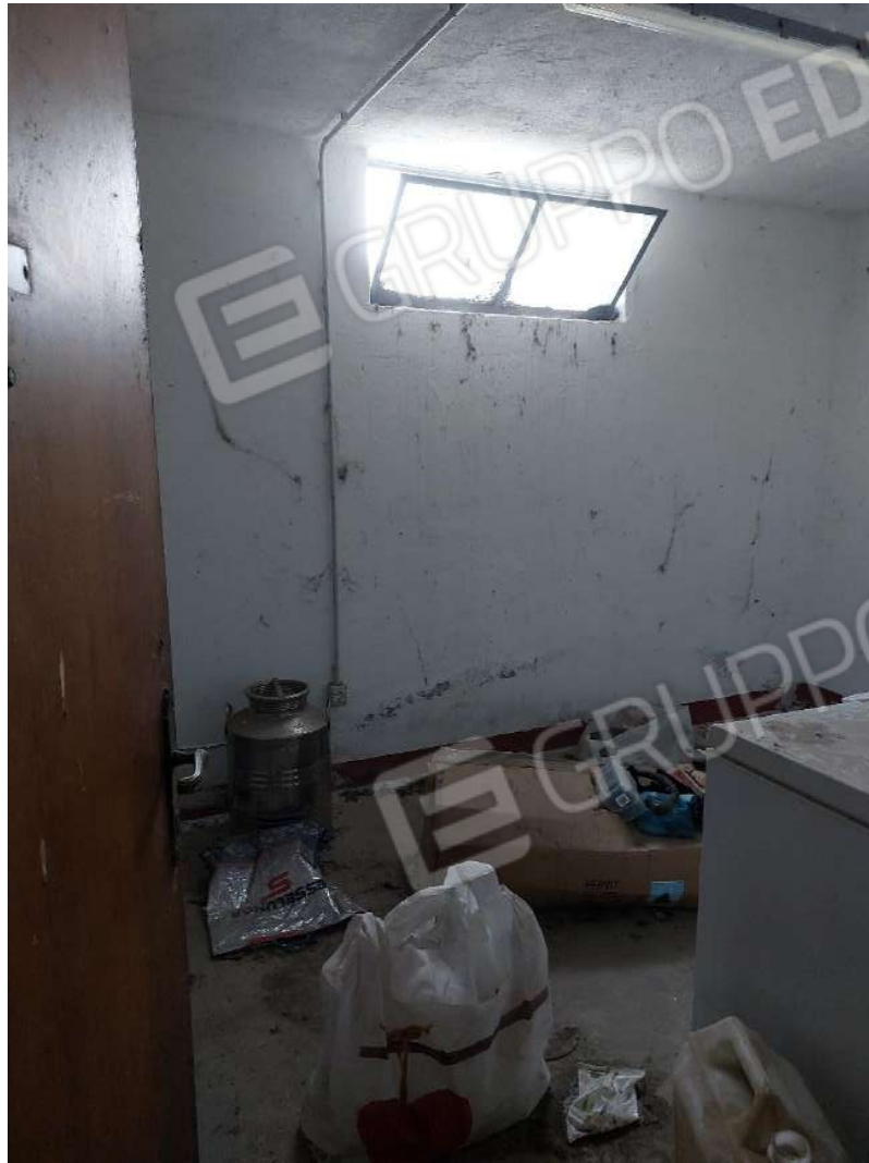
Immagine 19 – Cantina comune.