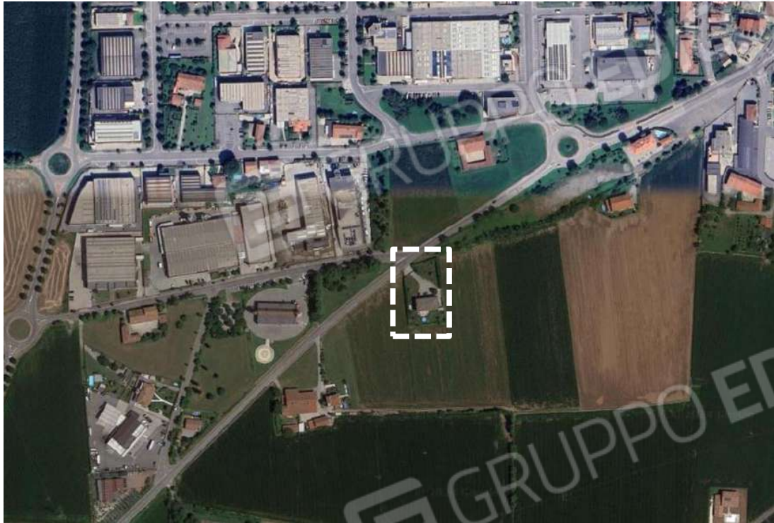
Immagine 1 - Foto satellitare: in evidenza il fabbricato a cui appartiene l'unità immobiliare oggetto di stima.