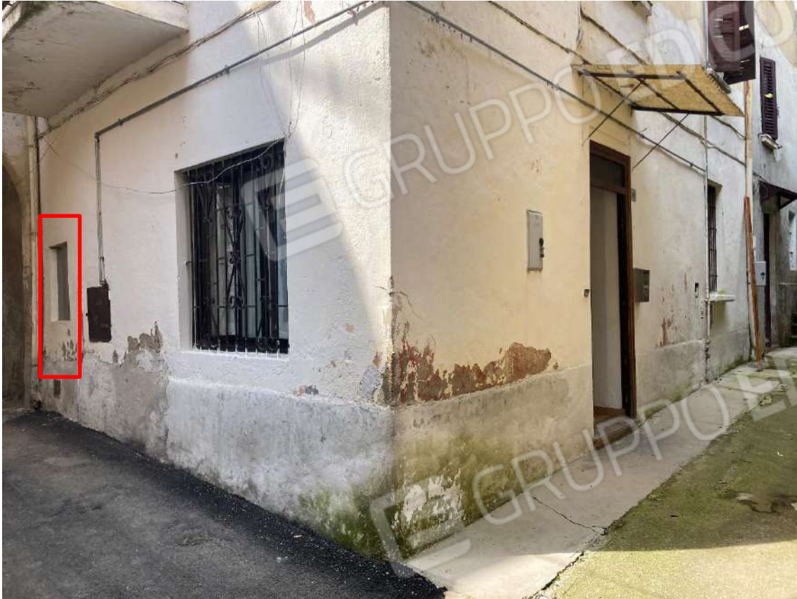
Figura 1: veduta d'insieme del piano terra dell'immobile, sui fronti nord ed est. Individuazione di apertura non autorizzata.