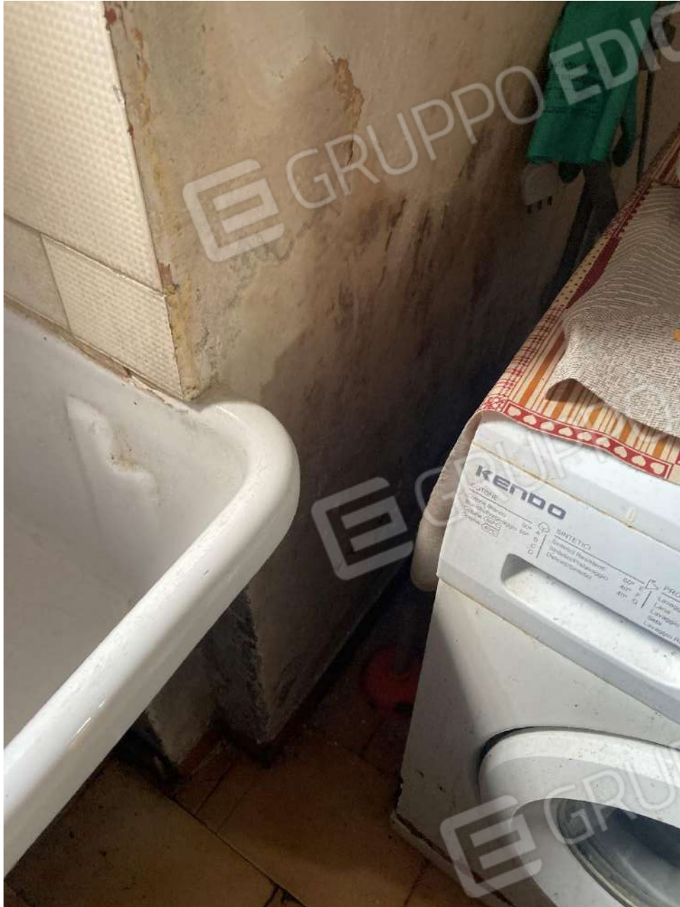
Figura 17: dettaglio umidità di risalita nel sottoscala