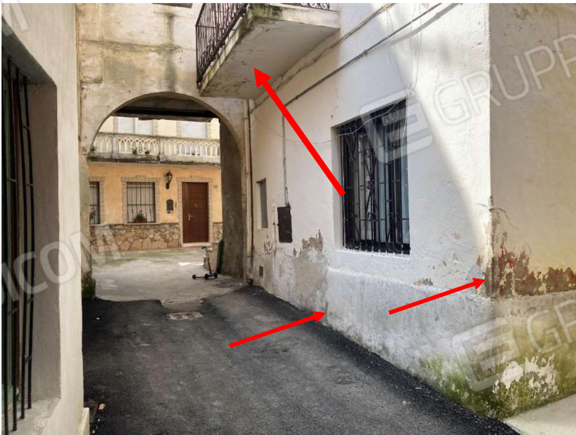
Figura 2: veduta del fronte est, sopra la finestra balcone non autorizzato. Si evidenzia l'importante risalita capillare di acqua nelle murature a piano terra