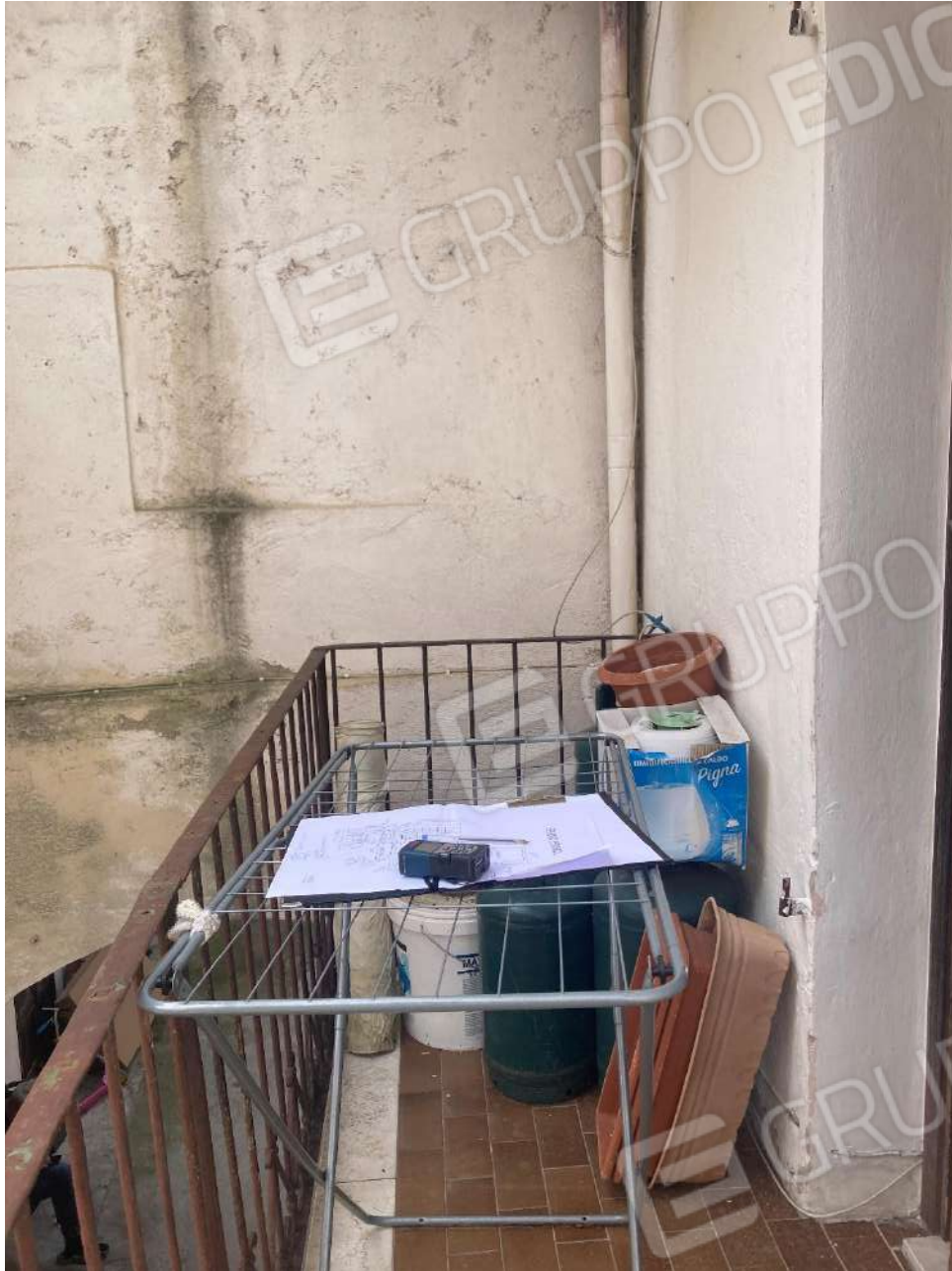
Figura 14: balcone, al quale si accede dalla camera al piano 1° con affaccio a est, rappresentata in fig. 13