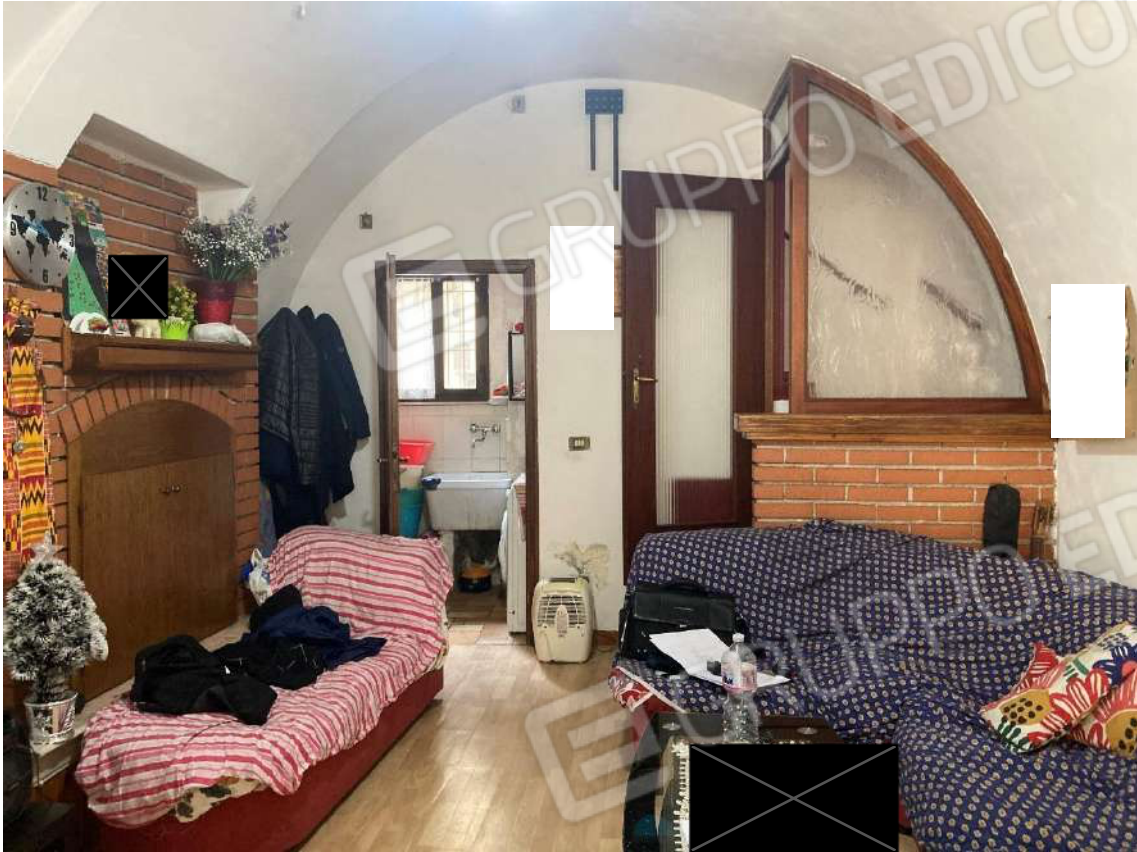
Figura 18: locale soggiorno. In fondo visibile la lavanderia nel sottoscala