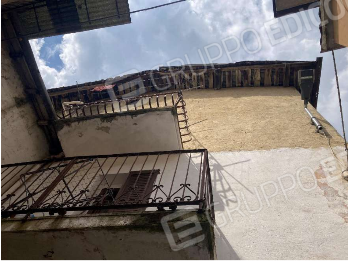
Figura 5: tetto in legno del fabbricato (fronte est) e balcone al piano 1°, non autorizzato