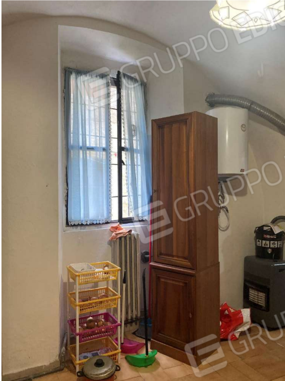
Figura 22: boiler elettrico in cucina per la produzione di a.c.s.