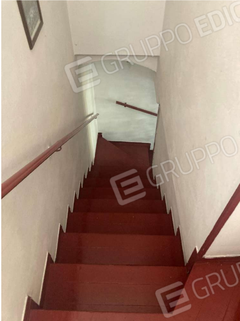
Figura 15: scala in legno, di collegamento tra piano terra e piano 1°