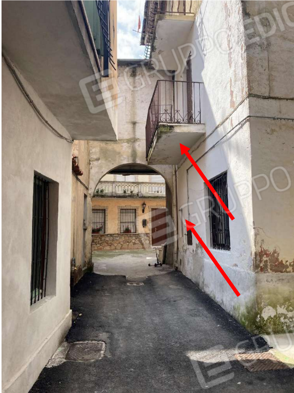
Figura 3: vista complessiva del fronte est