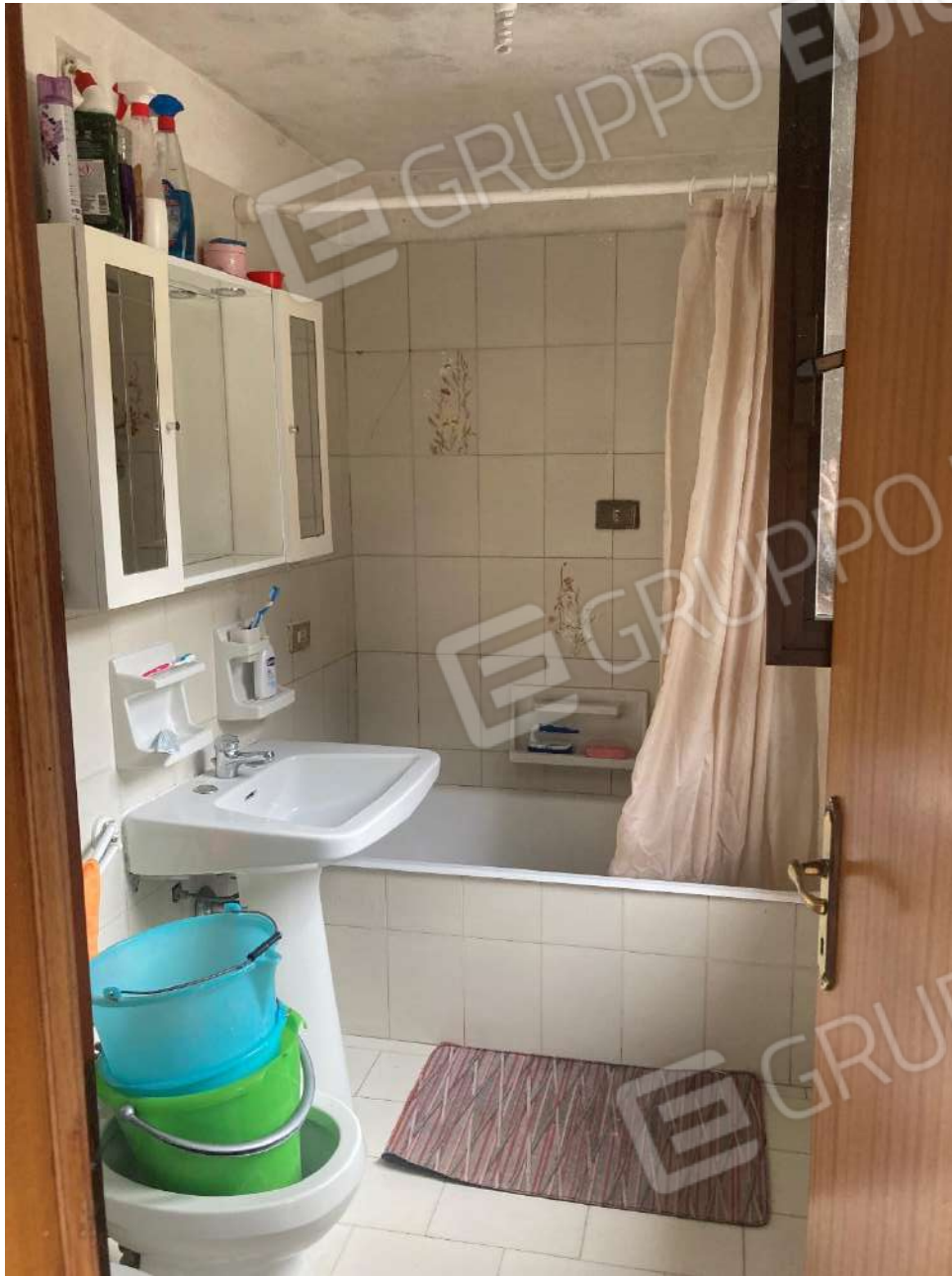
Figura 10: servizio igienico