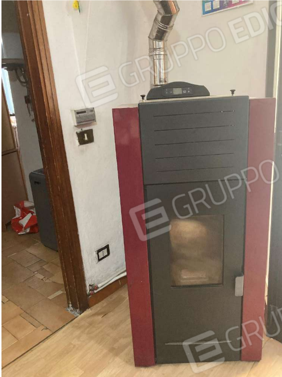
Figura 20: stufa a pellet in soggiorno