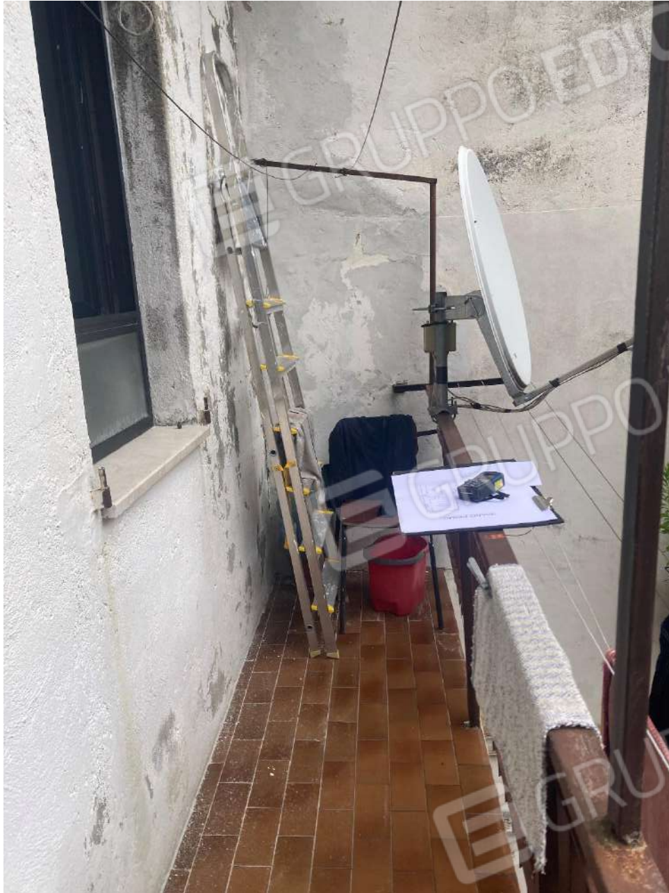
Figura 8: balcone ricavato dall'ex legnaia