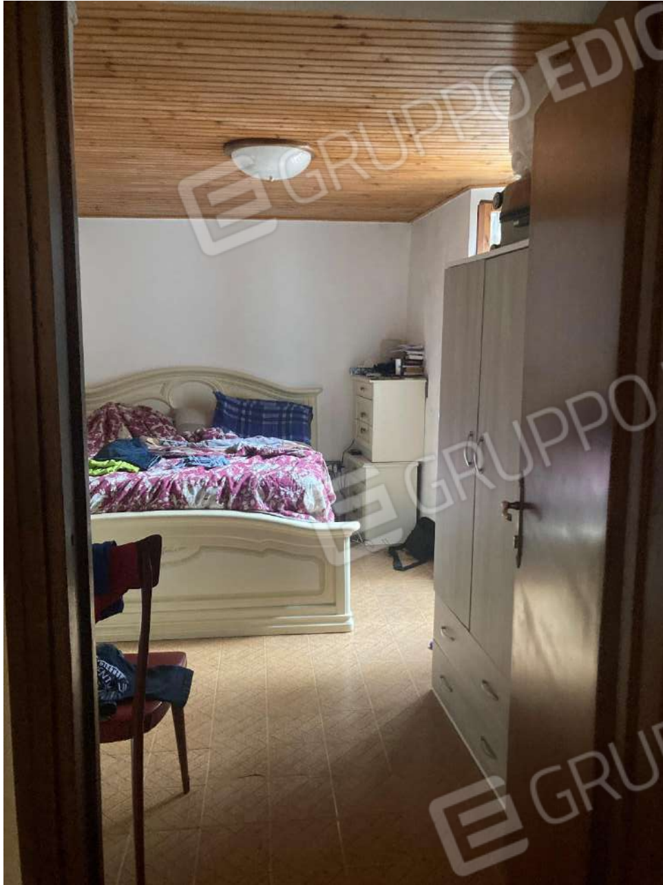
Figura 12: camera al piano 1°, con affaccio a nord