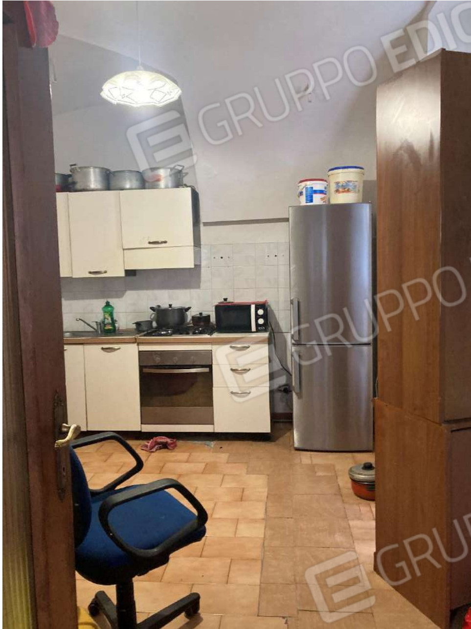
Figura 21: cucina