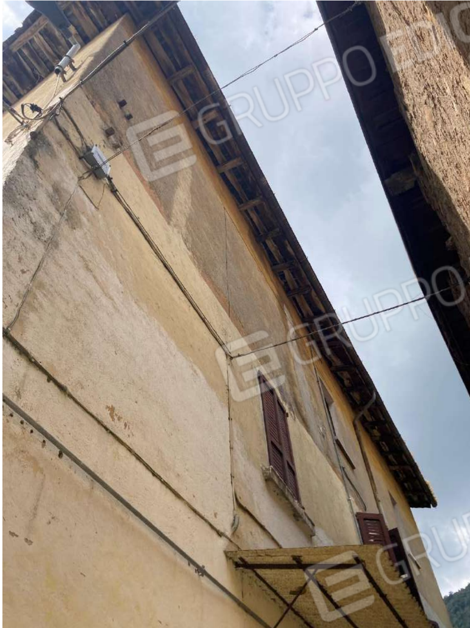
Figura 6: tetto condominiale in legno, fronte nord