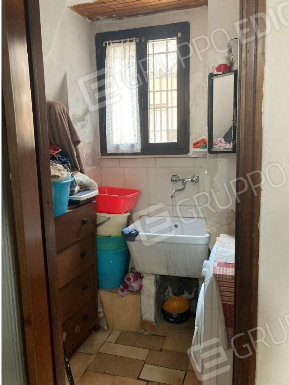
Figura 16: angolo lavanderia nel sottoscalac