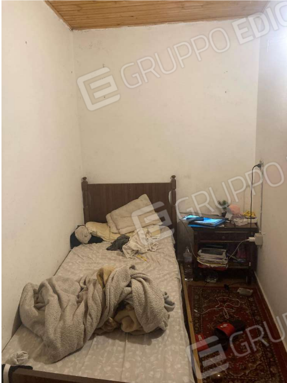
Figura 11: ripostiglio adibito a camera al piano 1°. La tramezzatura per la formazione di questa stanza non è stata autorizzata da alcun titolo edilizio