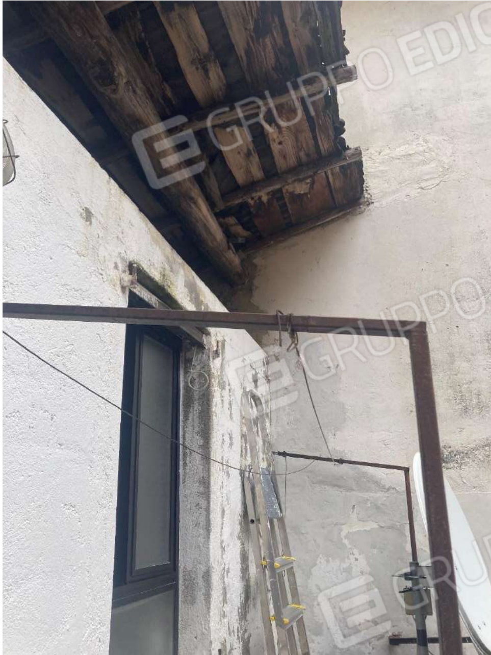
Figura 9: copertura dell'ex legnaia, ora servizio igienico