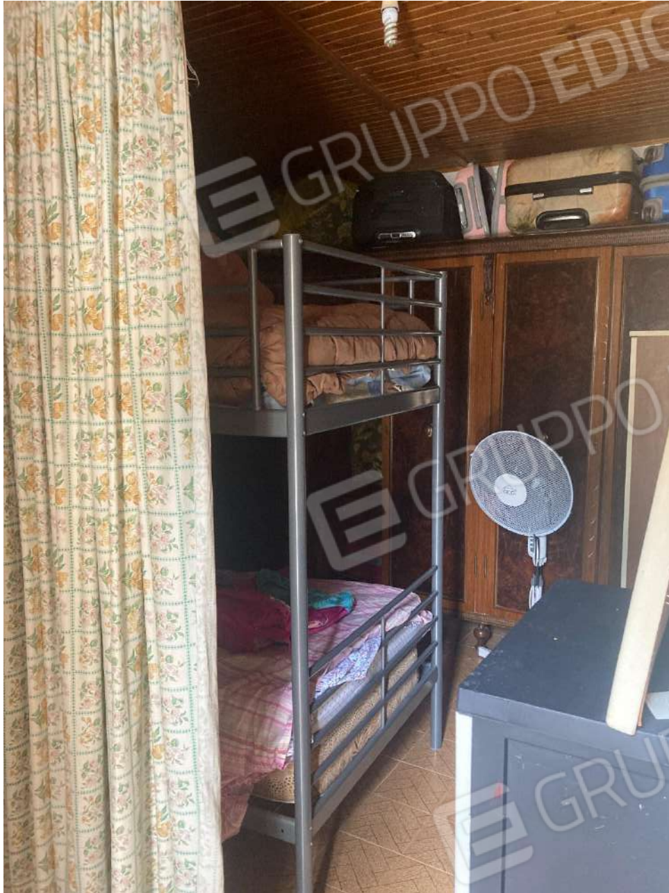
Figura 13: camera al piano 1°, con affaccio a est, sul balcone non autorizzato. Dalla riduzione di questa camera si è ricavato il ripostiglio, adibito a ulteriore cameretta