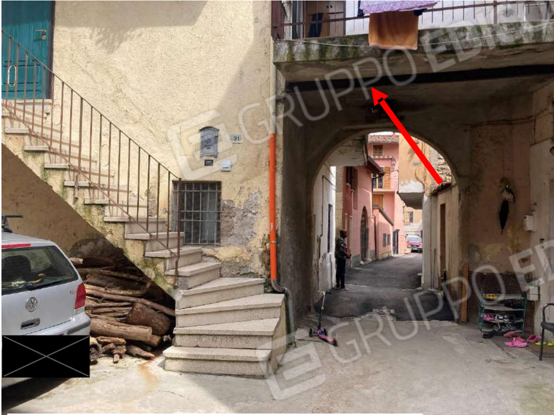
Figura 7: ex-legnaia, ora occupata in parte dal servizio igienico, in parte da balcone