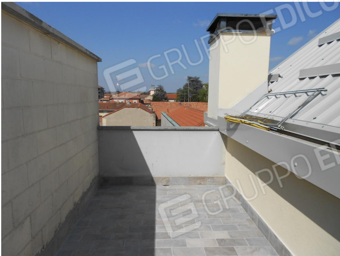
TERRAZZO (PIANO SOTTOTETTO)