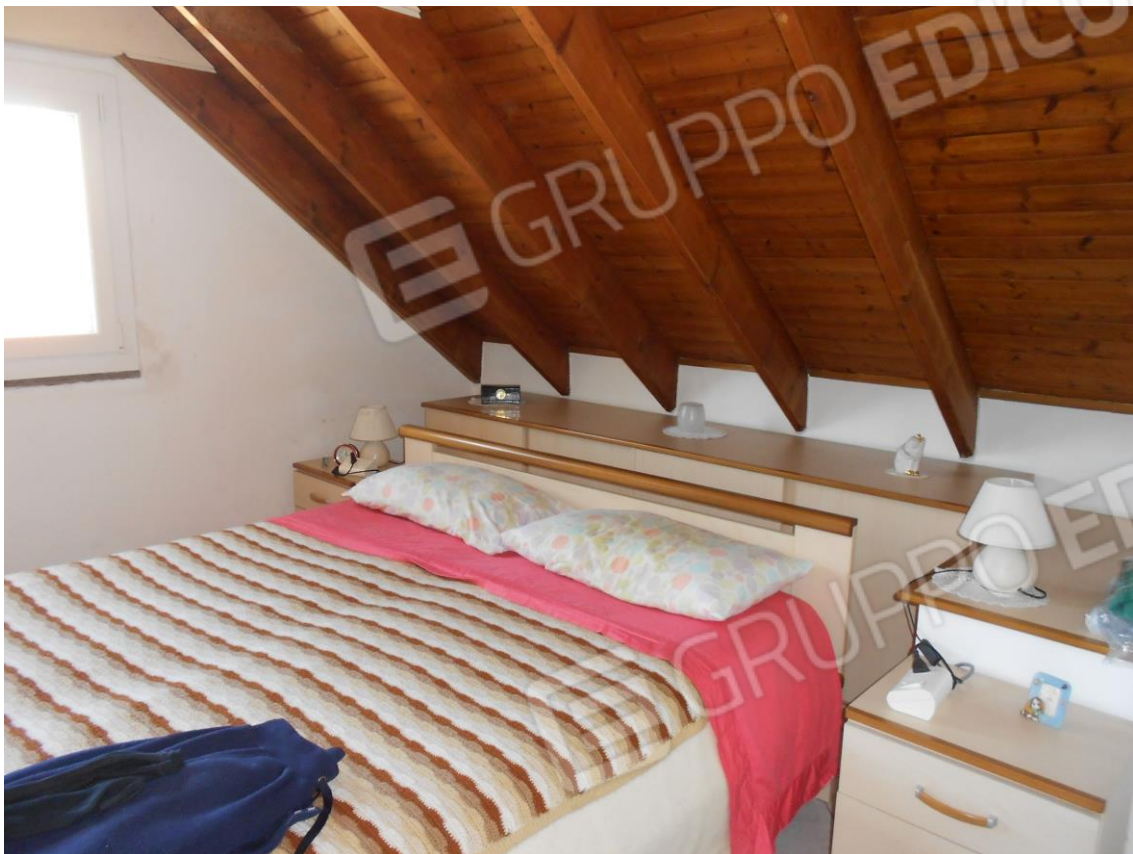
CAMERA DA LETTO (PIANO SOTTOTETTO)