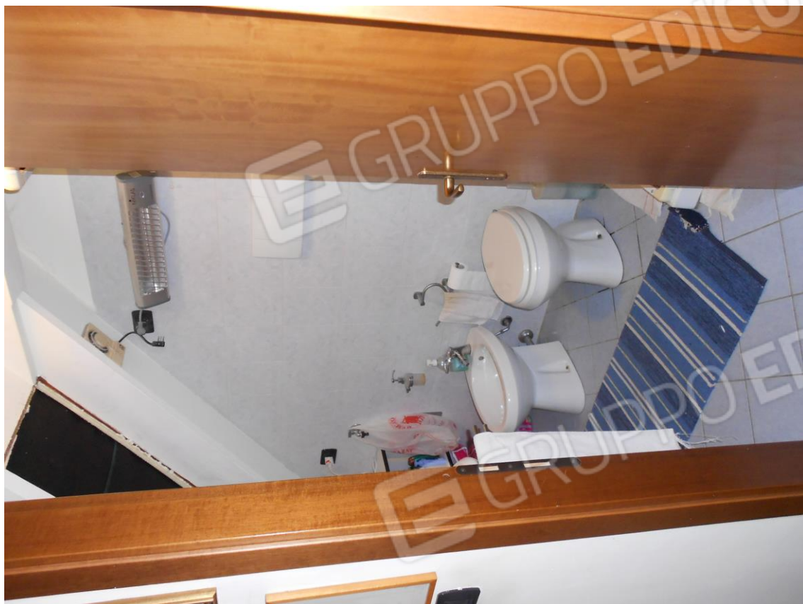
SERVIZIO IGIENICO (PIANO SOTTOTETTO)