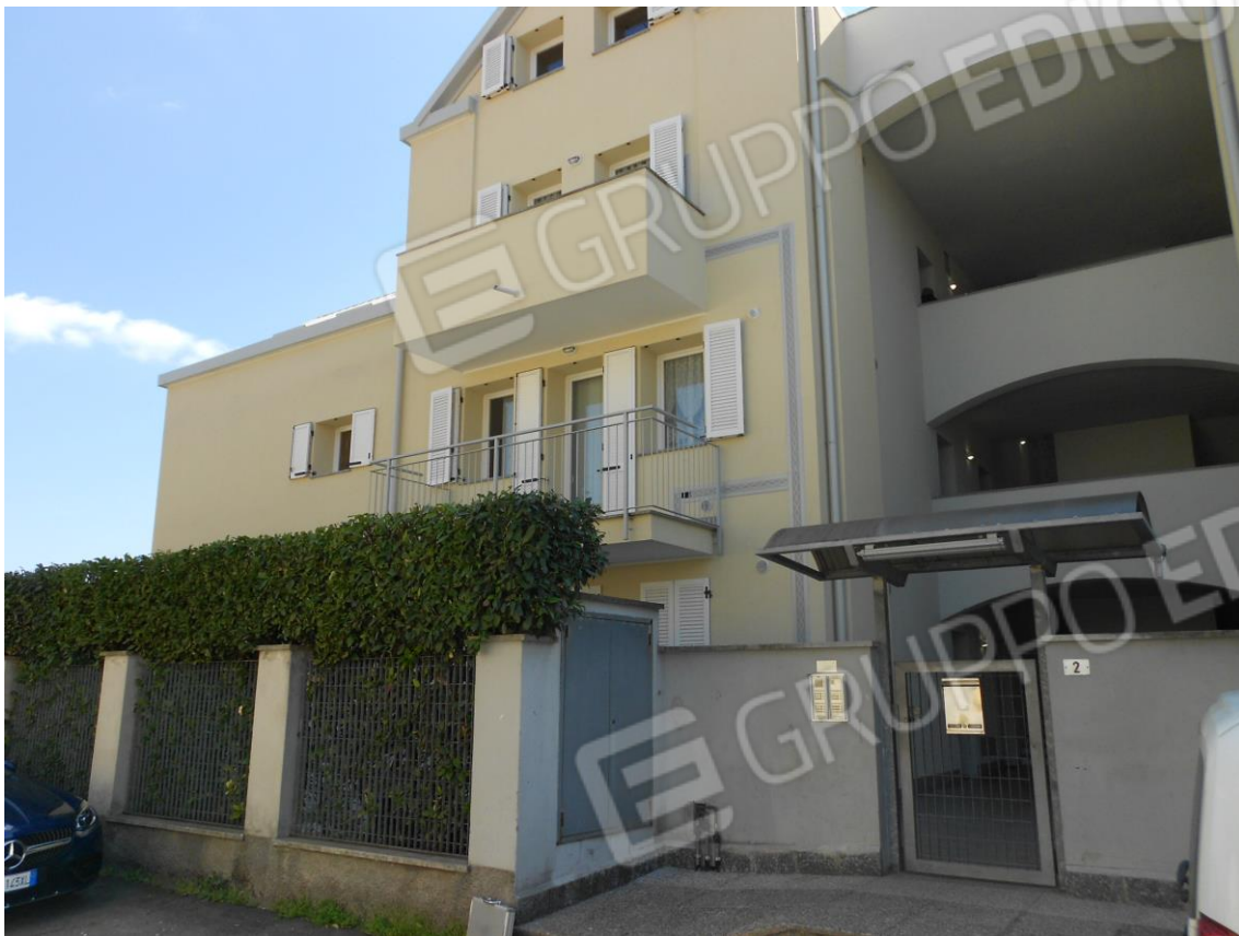
PROSPETTO INGRESSO da Via Nobile della Croce