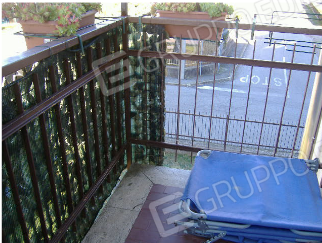
Balcone prospetto ovest