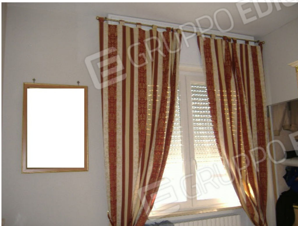
Camera 2 (finestra su prospetto sud)