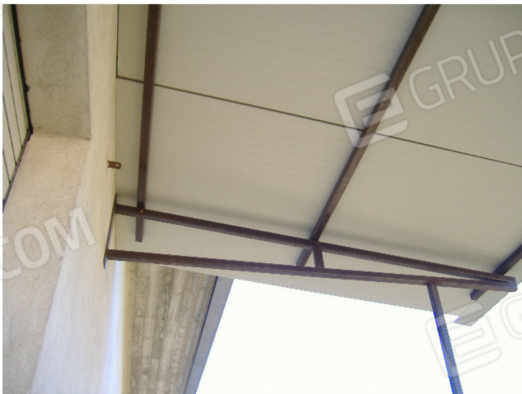
Pensilina su balcone prospetto ovest