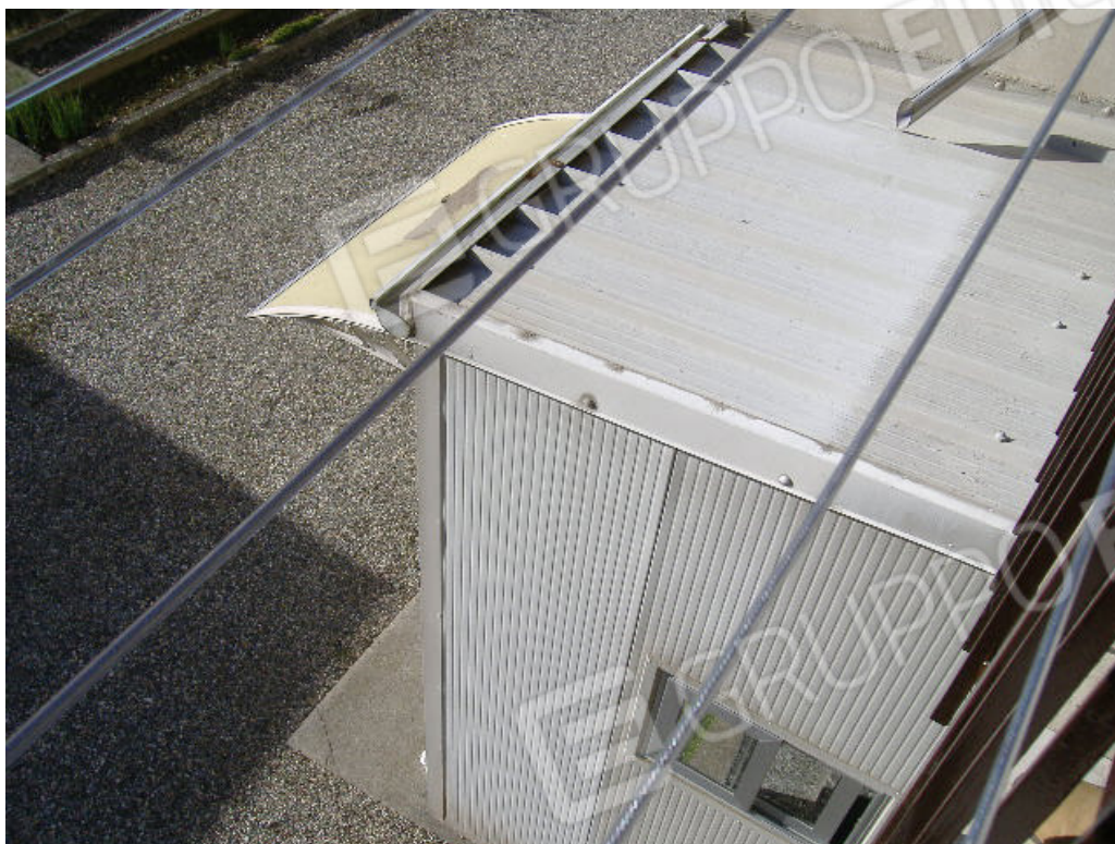
Bussola di ingresso all'unità immobiliare