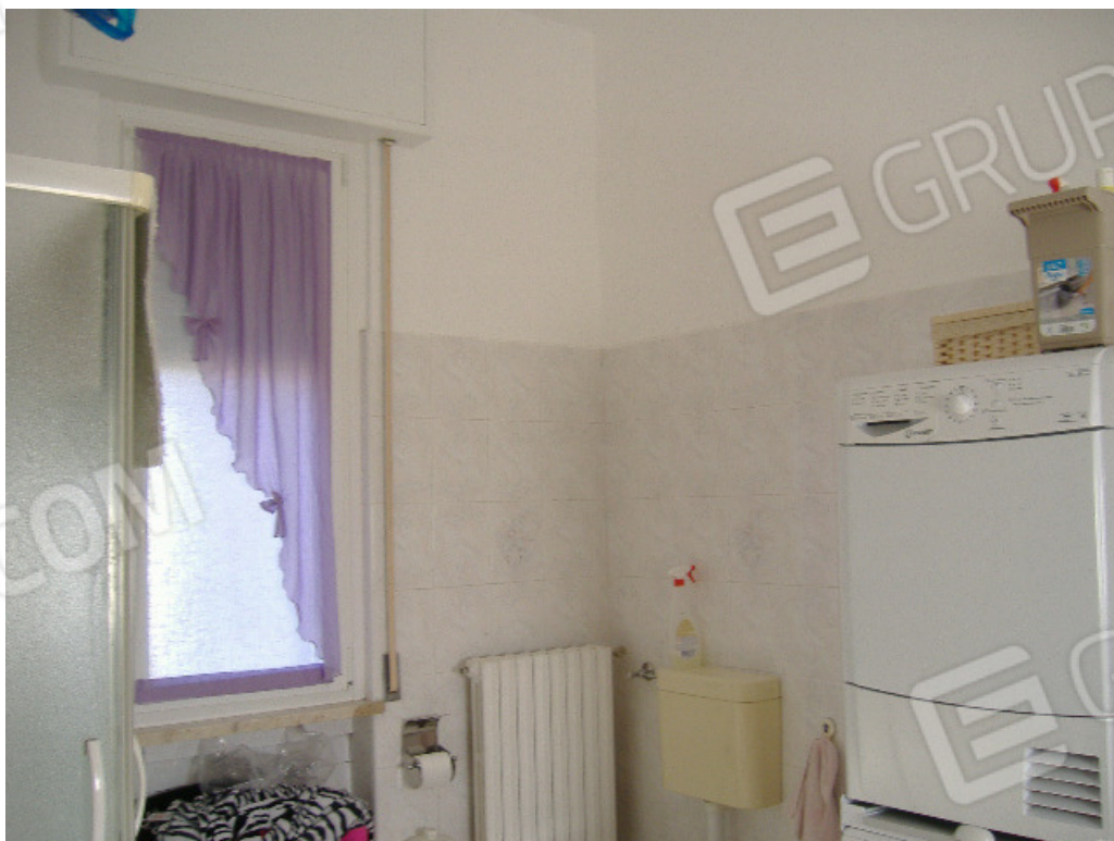
Bagno (finestra su prospetto nord)