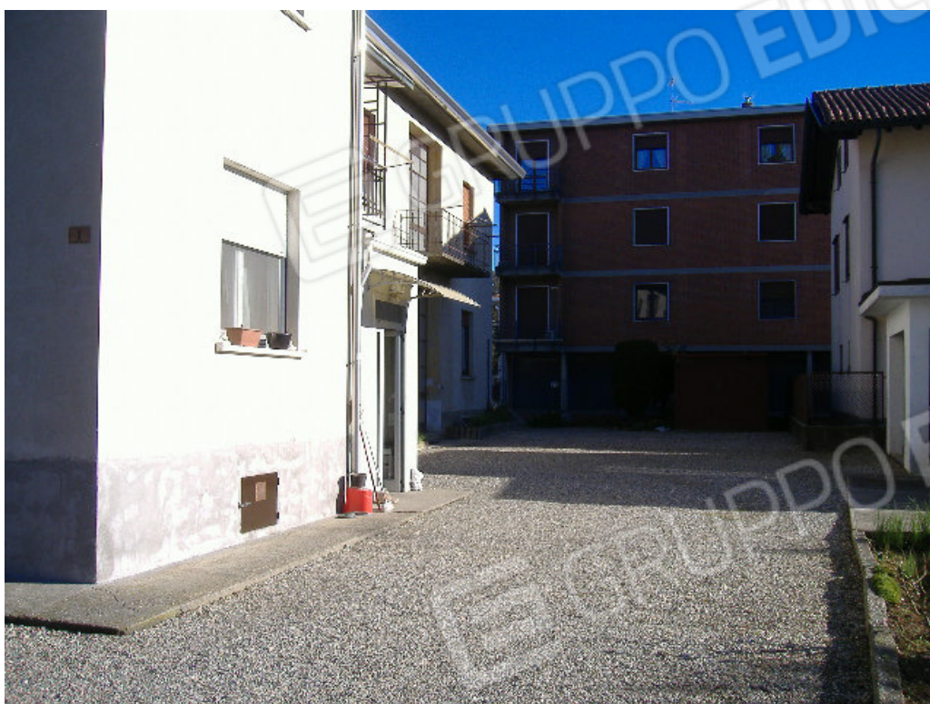
Fig. 9 Particella 1637