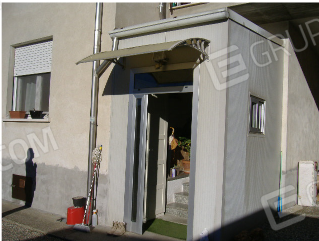
Bussola di ingresso all'unità immobiliare