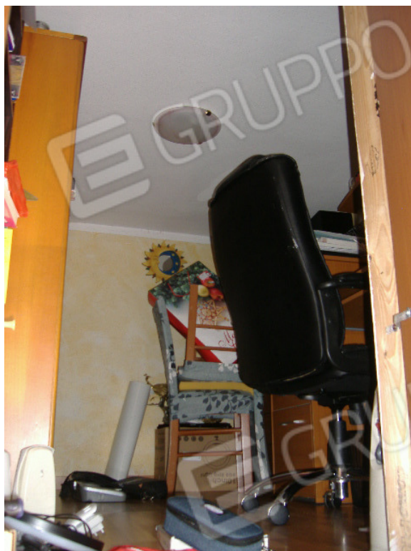
Soppalco sul vano scala a P.1