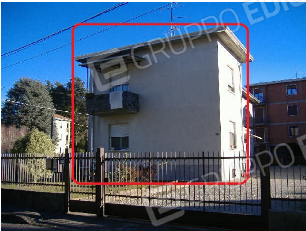
Prospetto ovest e sud