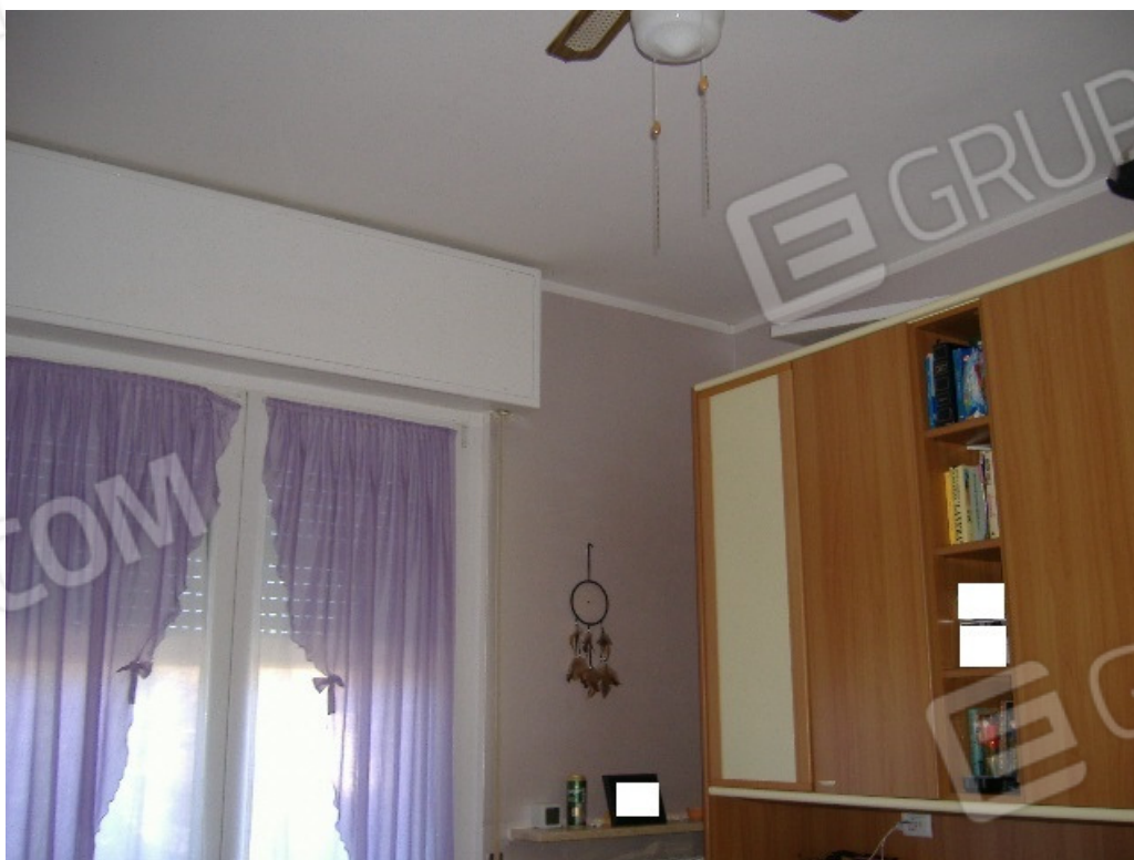
Camera 1 (porta finestra su prospetto ovest)