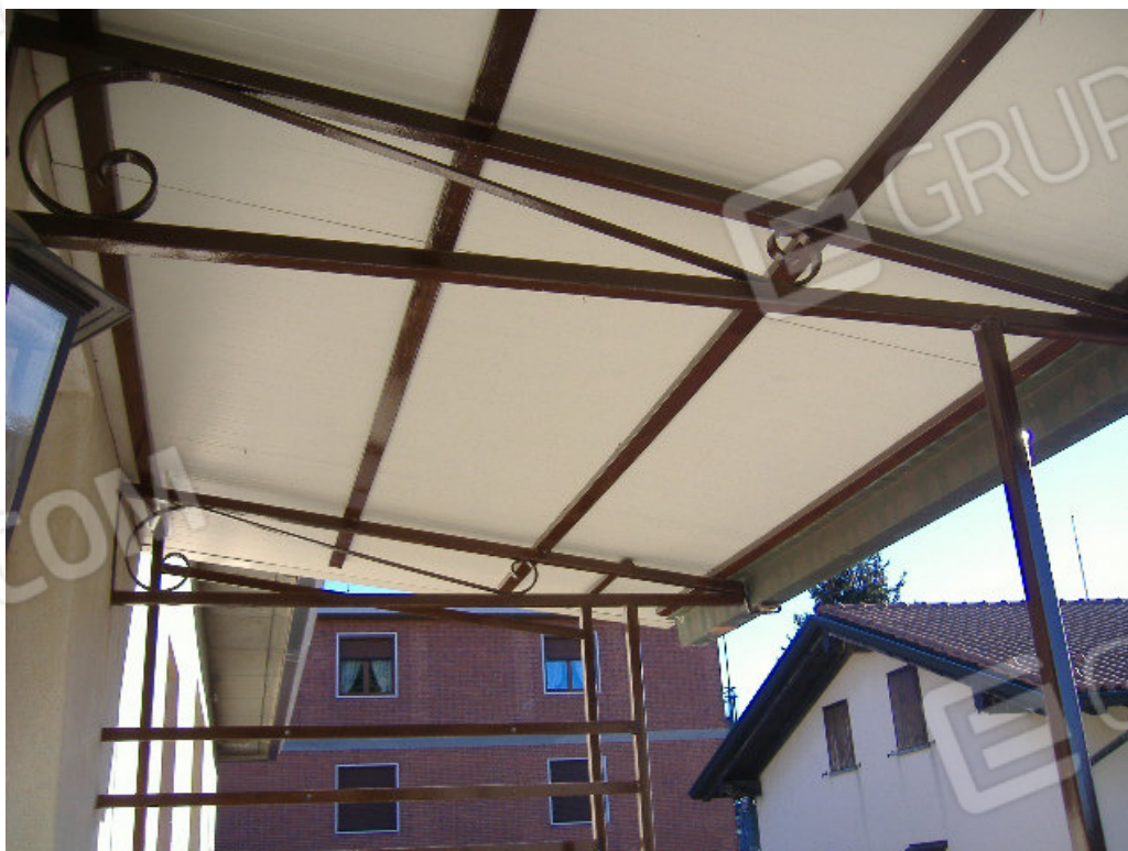
Pensilina su balcone prospetto sud