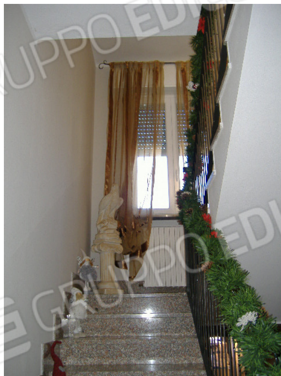
Scala interna P.T – P.1