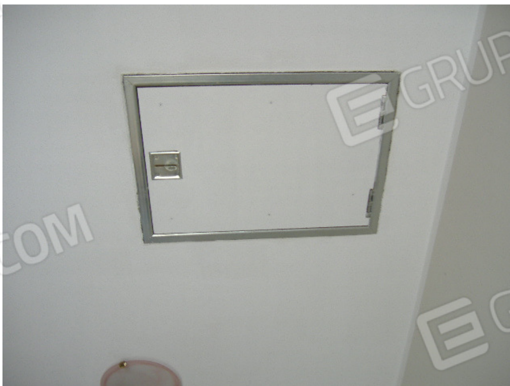
Botola di accesso al sottotetto