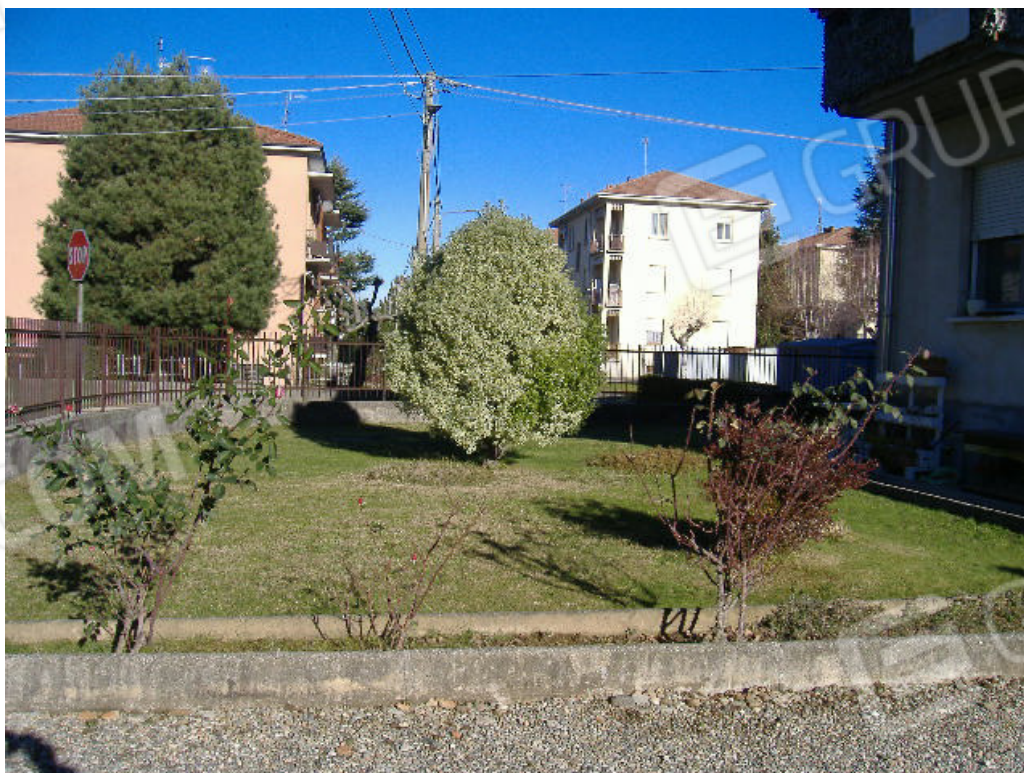
Fig. 9 Particella 1637