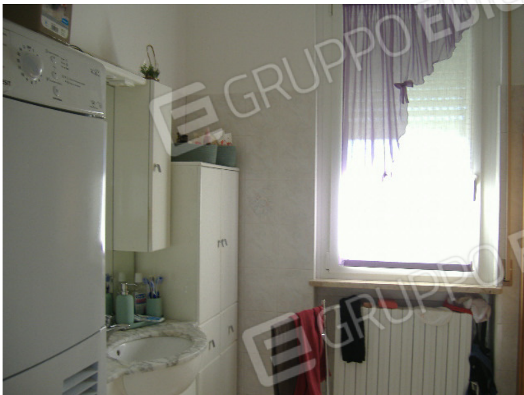
Bagno (finestra su prospetto sud)