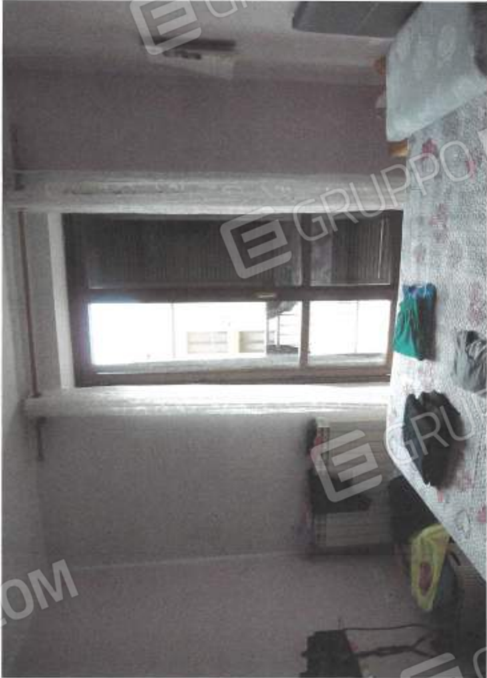
VISTA INTERNA CAMERA