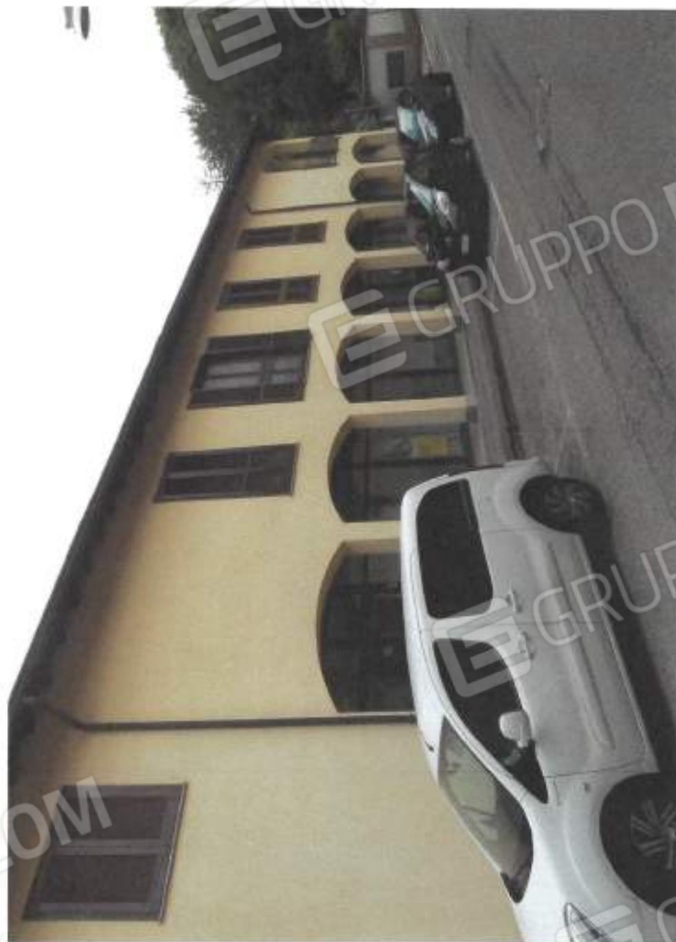
VISTA ESTERNA DA VIA GIASSI