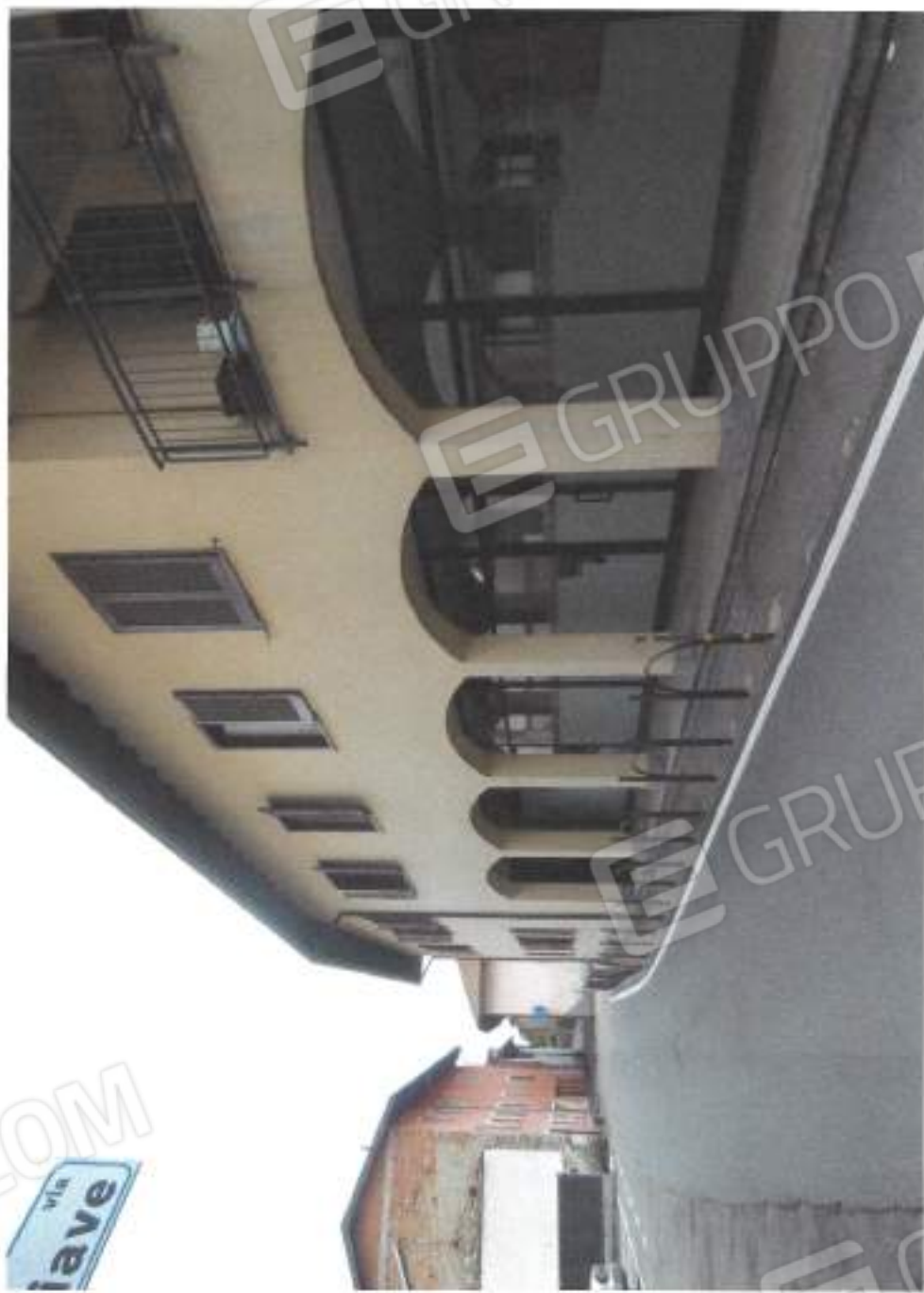
VISTA ESTERNA DA VIA PIAVE