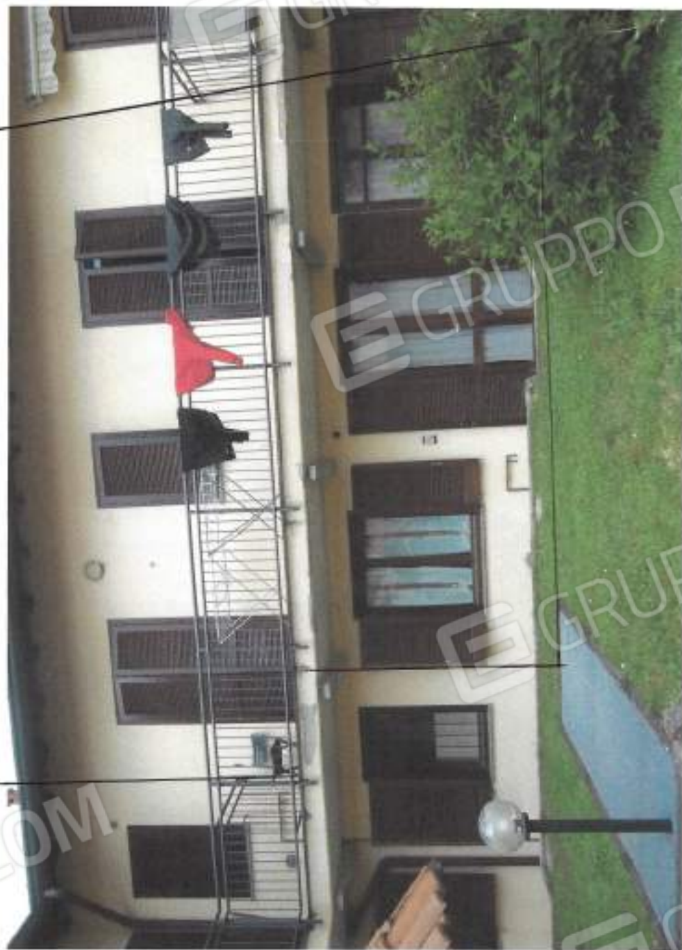
VISTA ESTERNA DELLA U.I.M. AD USO ABITATIVO OGGETTO DELLA ROCCEDURA