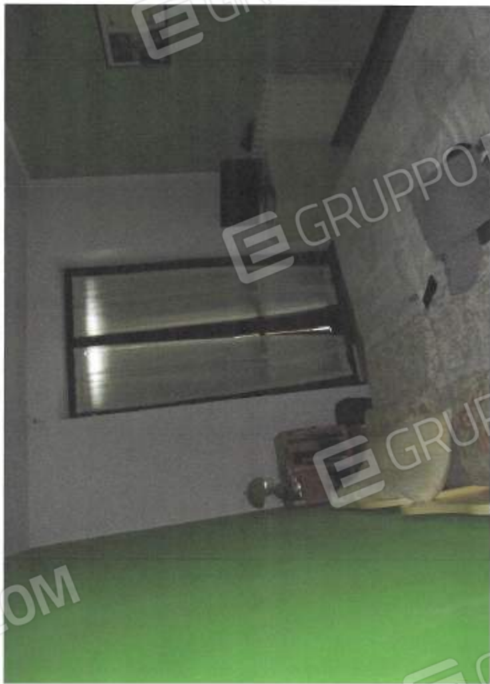
VISTA INTERNA CAMERA