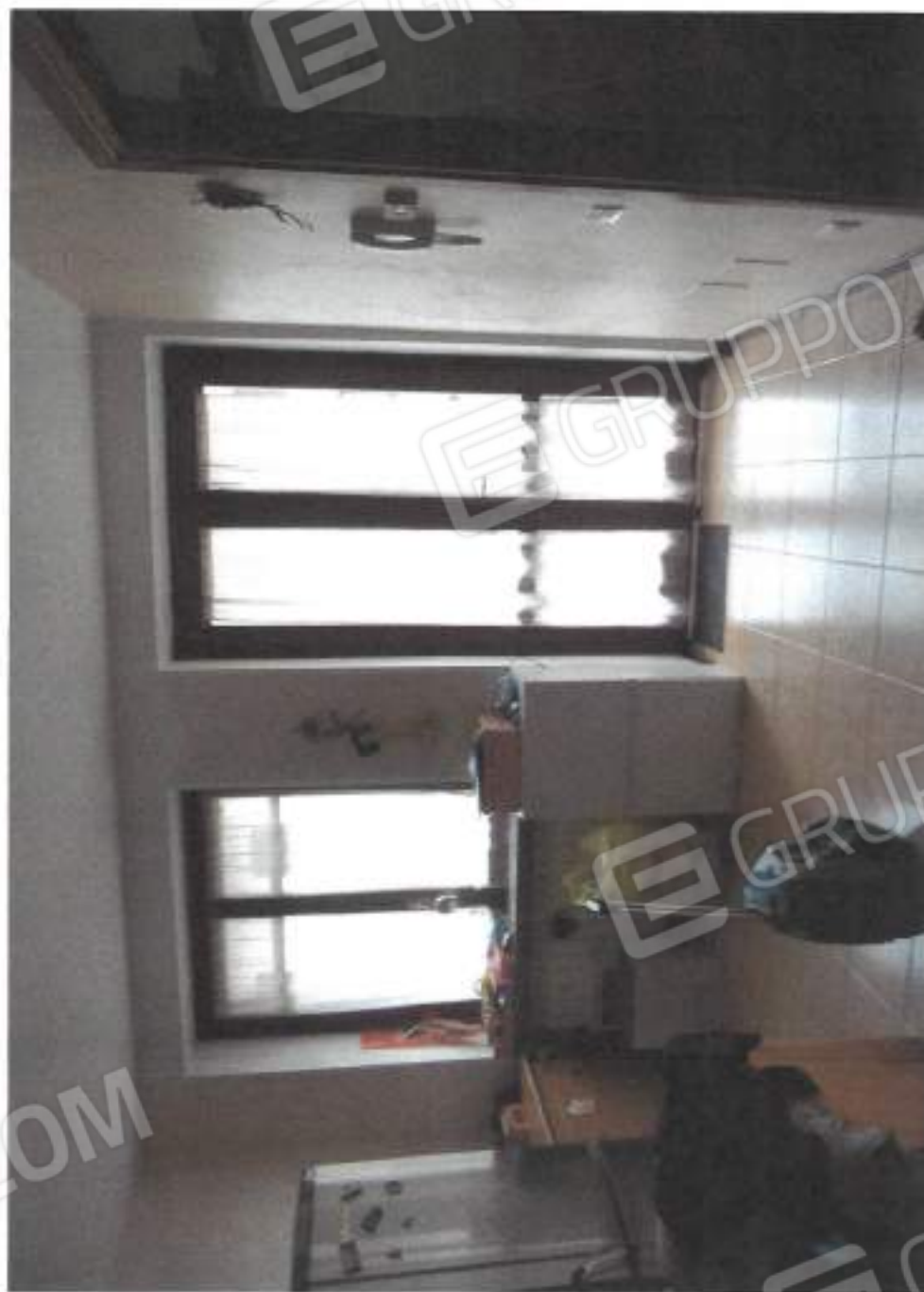
VISTA INTERNA SOGGIORNO