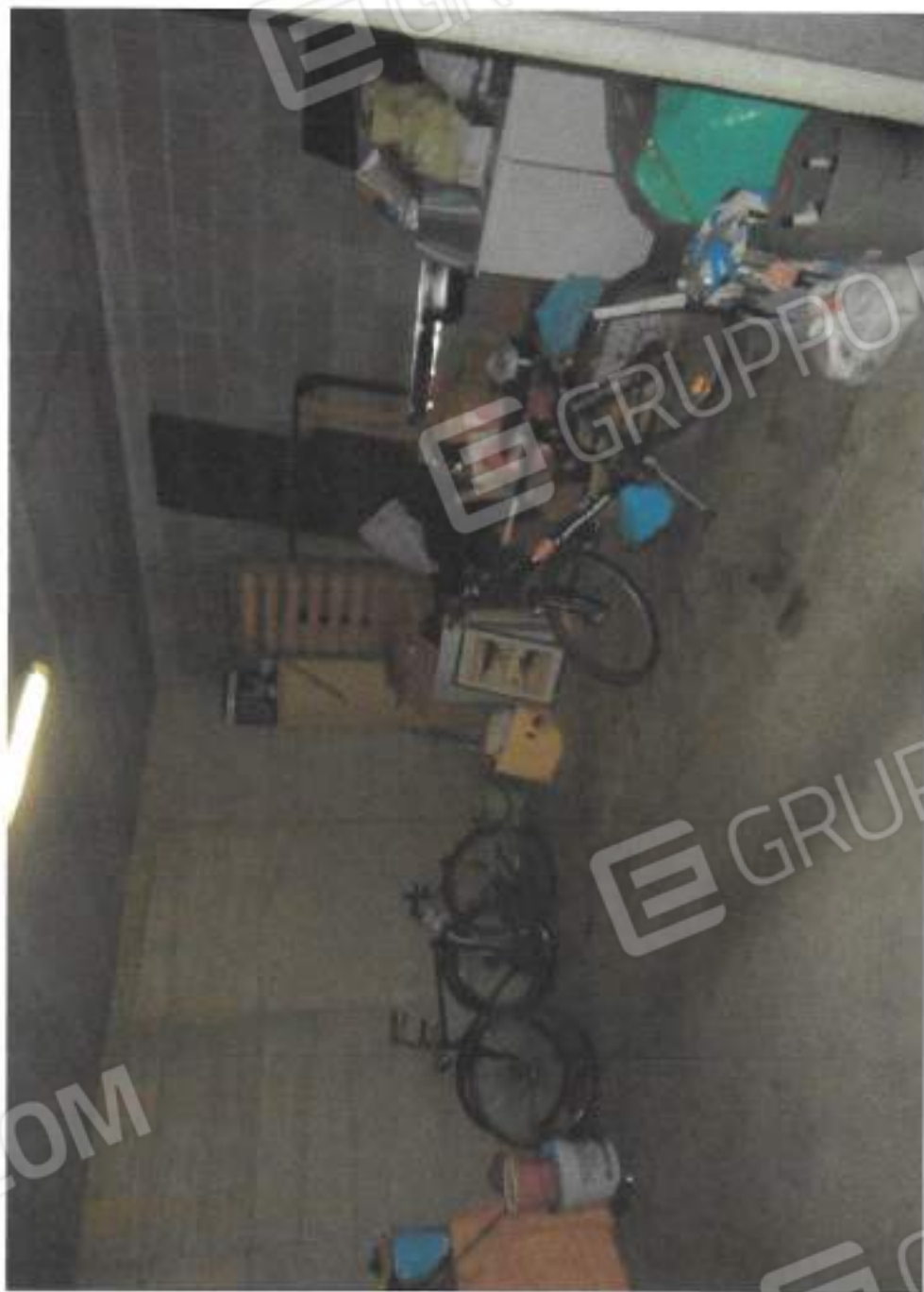
VISTA INTERNA BOX