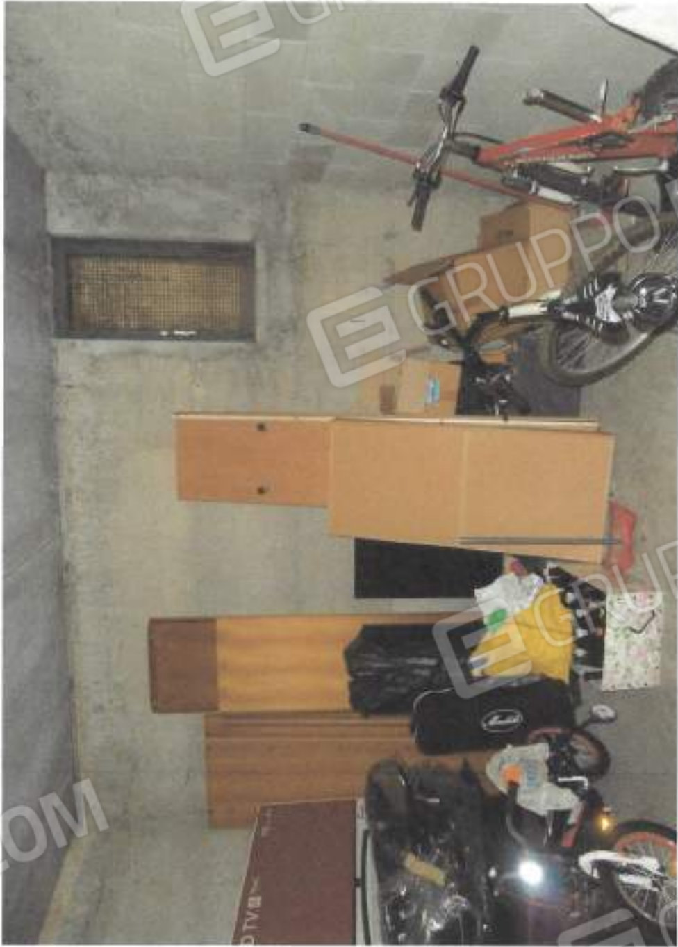
VISTA INTERNA CANTINA