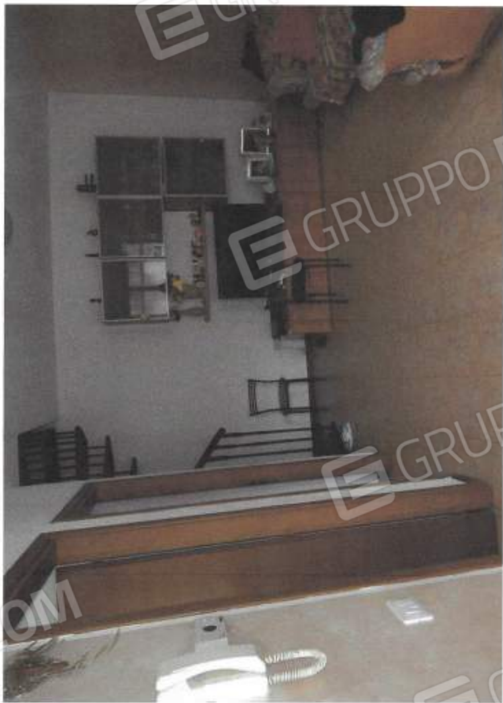
VISTA INTERNA SOCIANDO