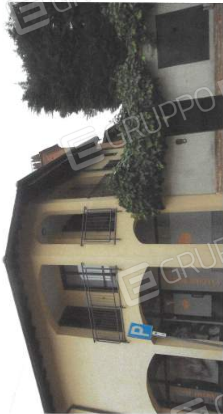
VISTA ESTERNA DA VIA GIASSI