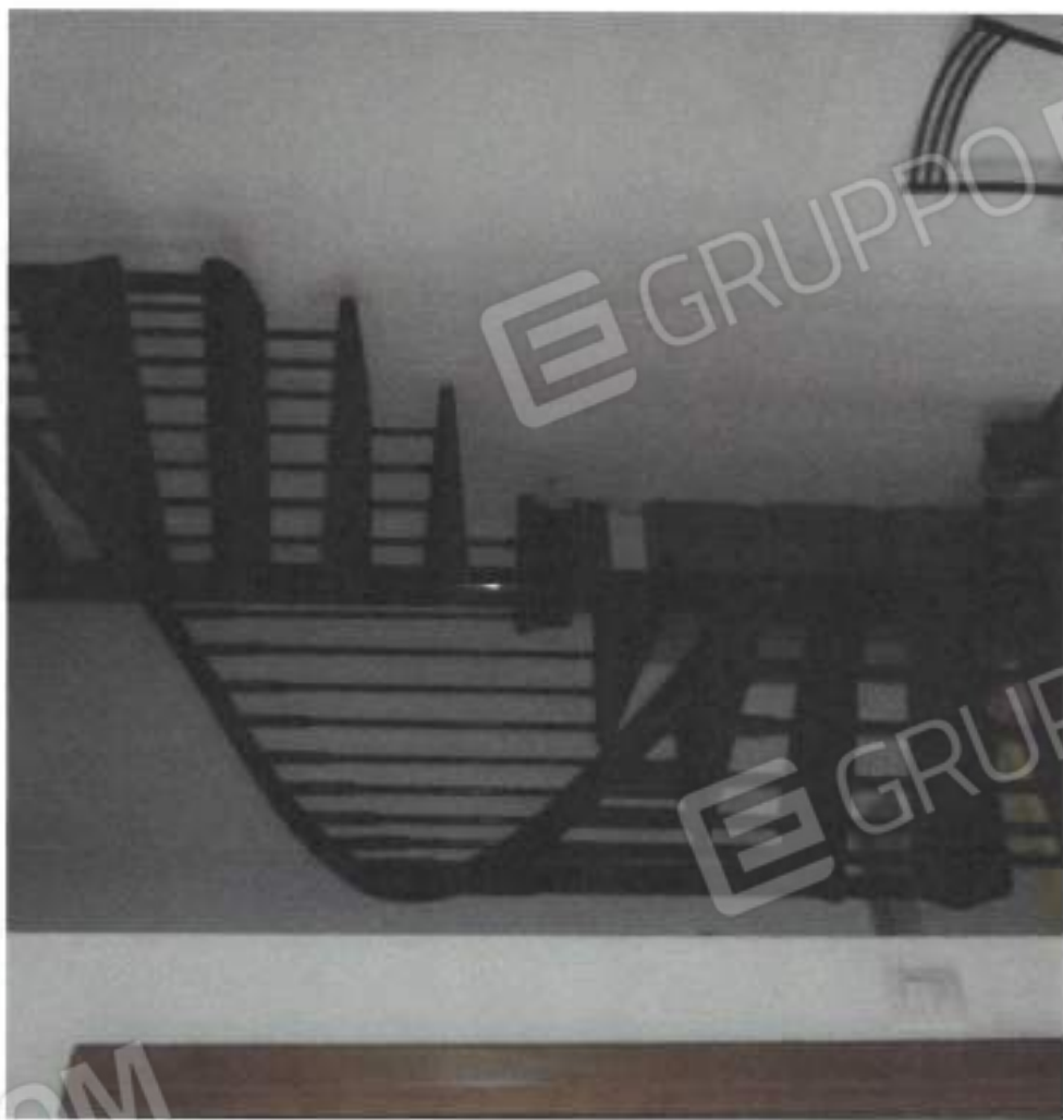
SCALA A CHIOCCHIAIA AL PIANO PRIMO