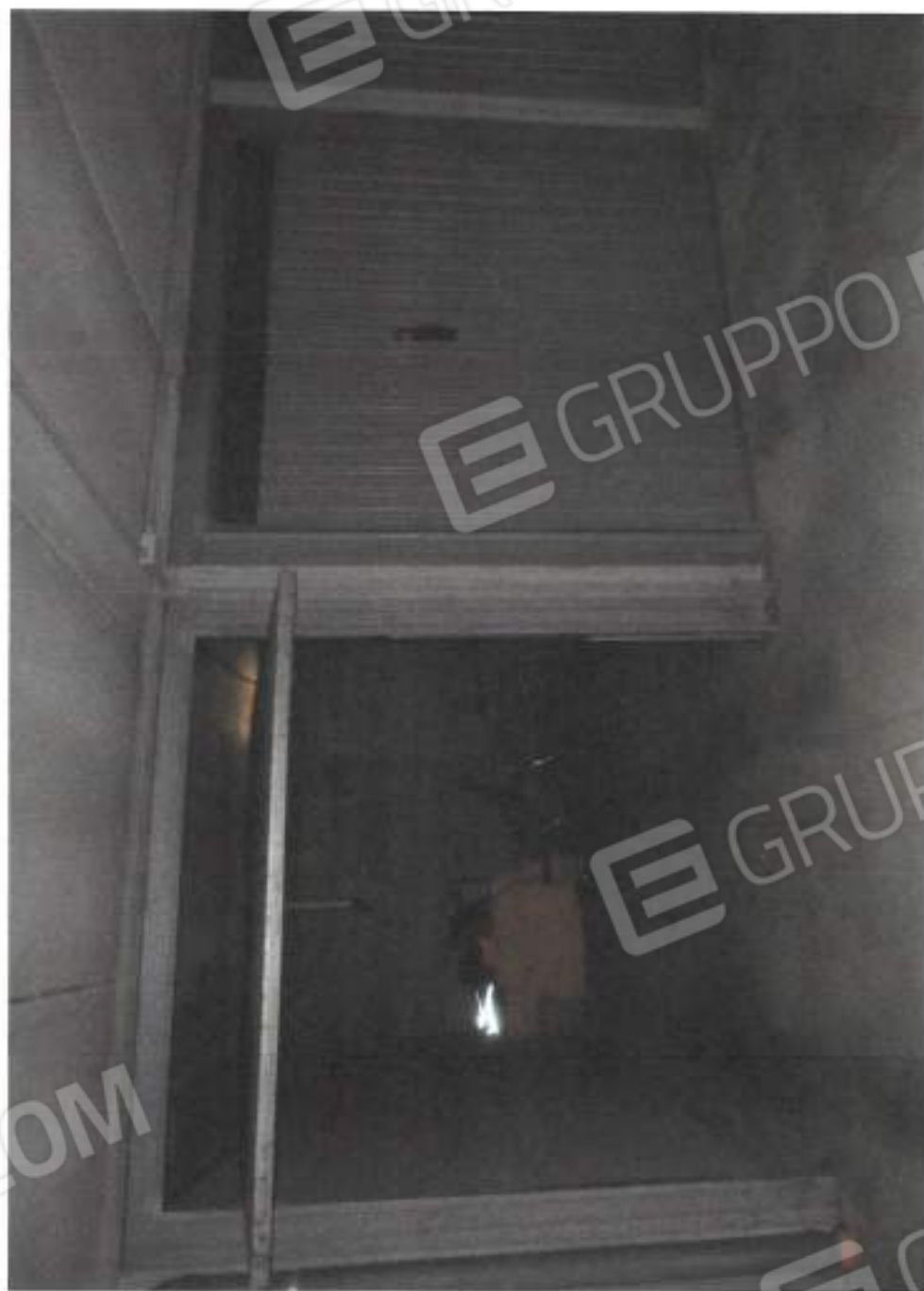
VISTA BASCULANTI BOX