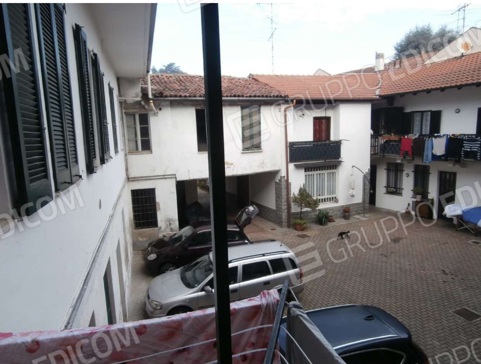
Vista della corte