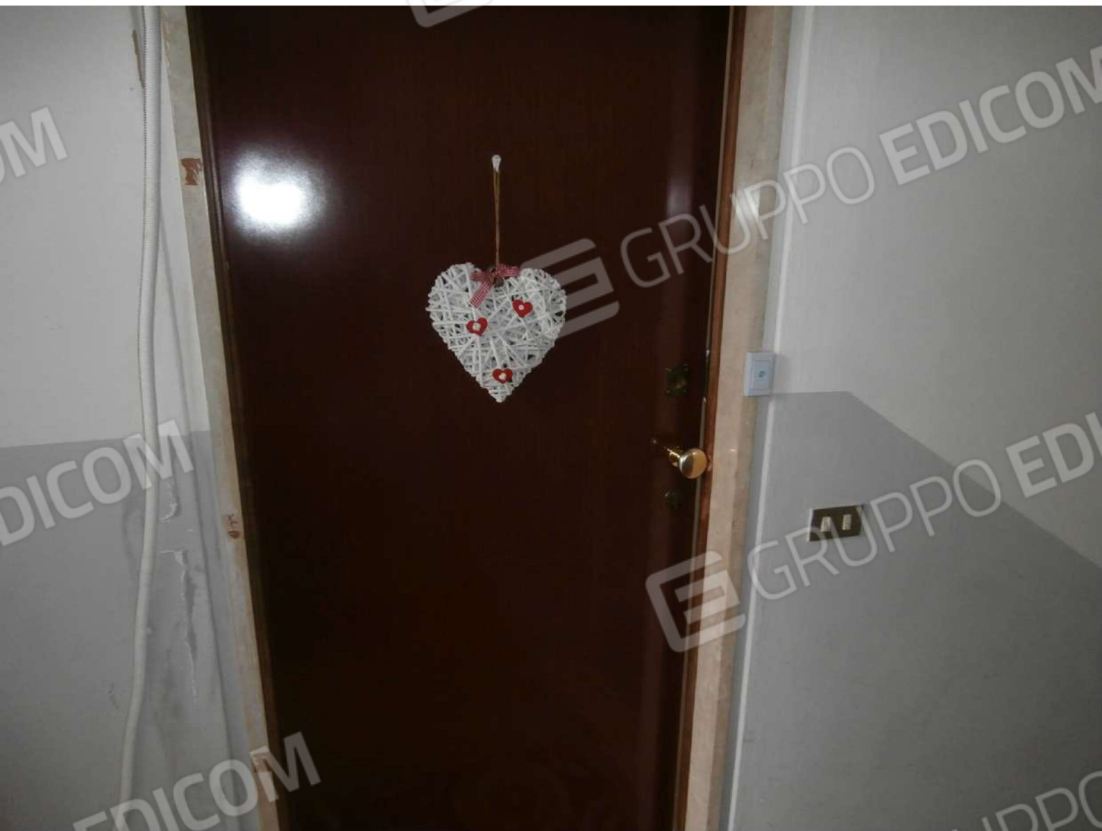
Porta di ingresso all'appartamento