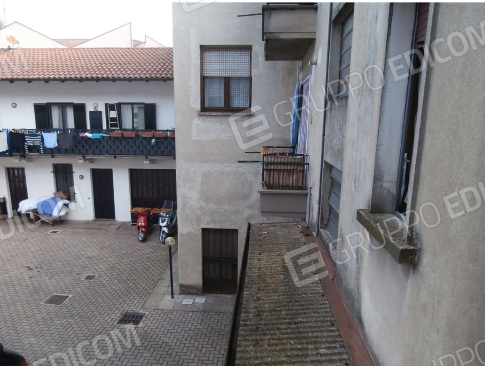
Vista della corte