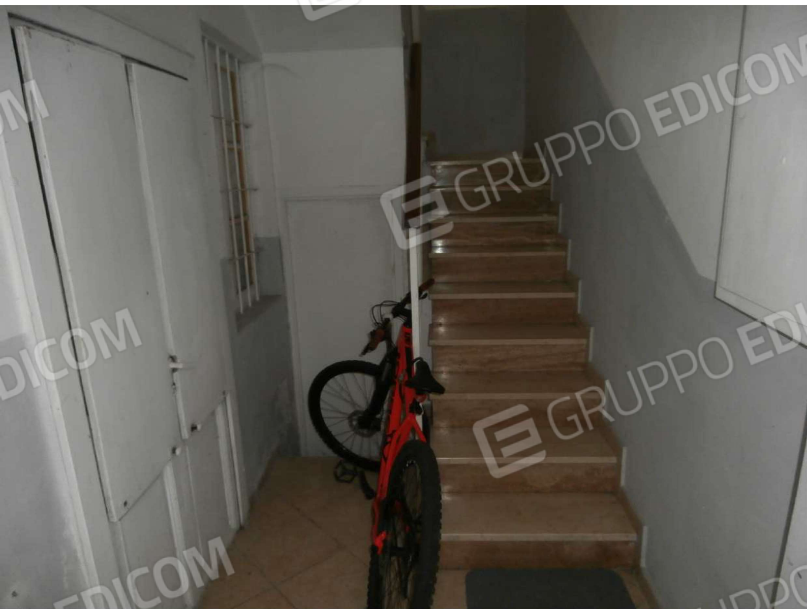
Atrio scala a piano terreno