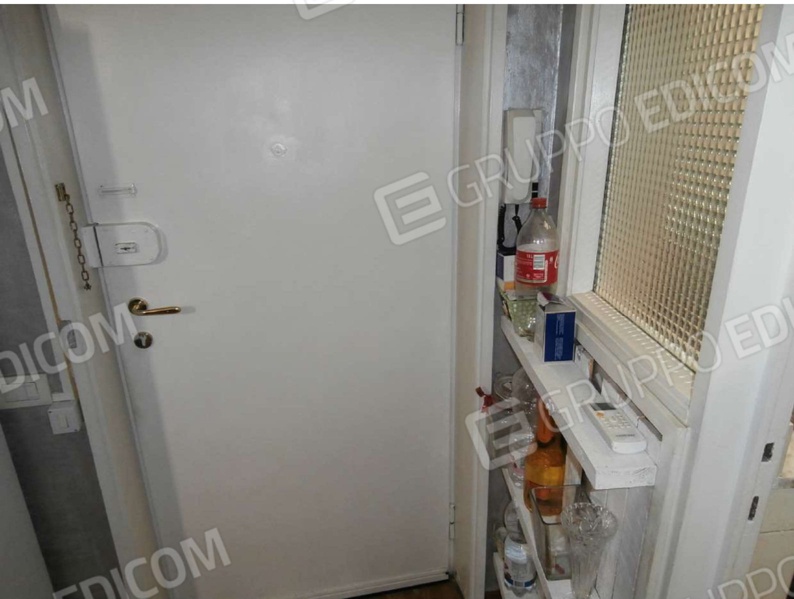
Vista interna porta di ingresso