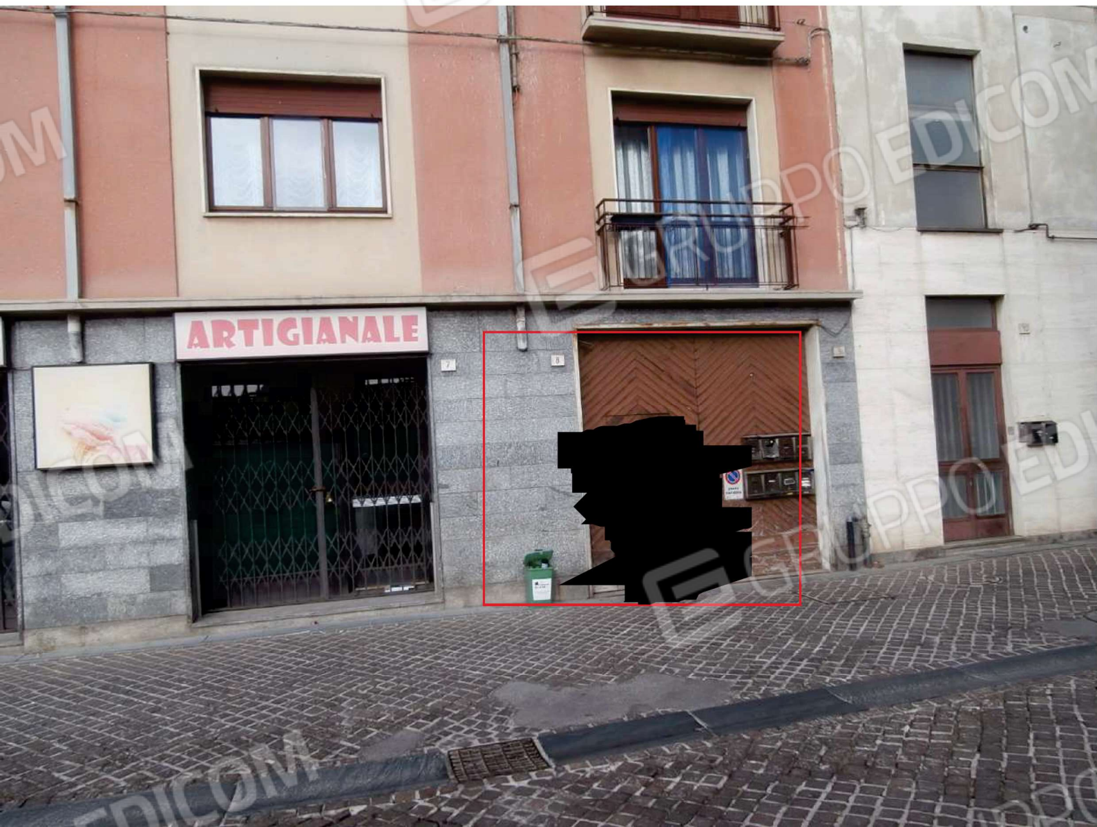
Portone di ingresso al civico n. 9 di Piazza San Giulio