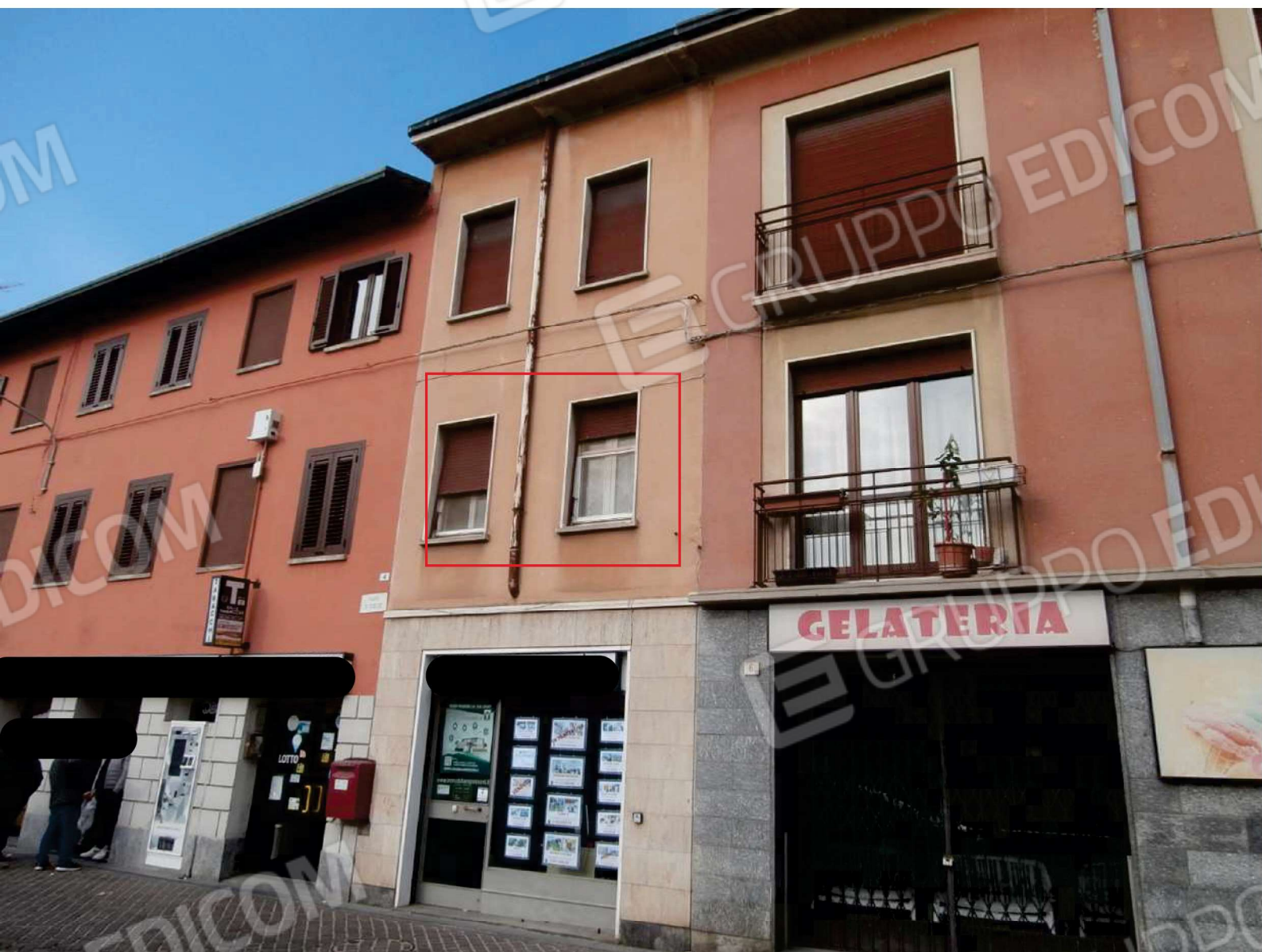
Finestre dell'appartamento con affaccio su Piazza San Giulio