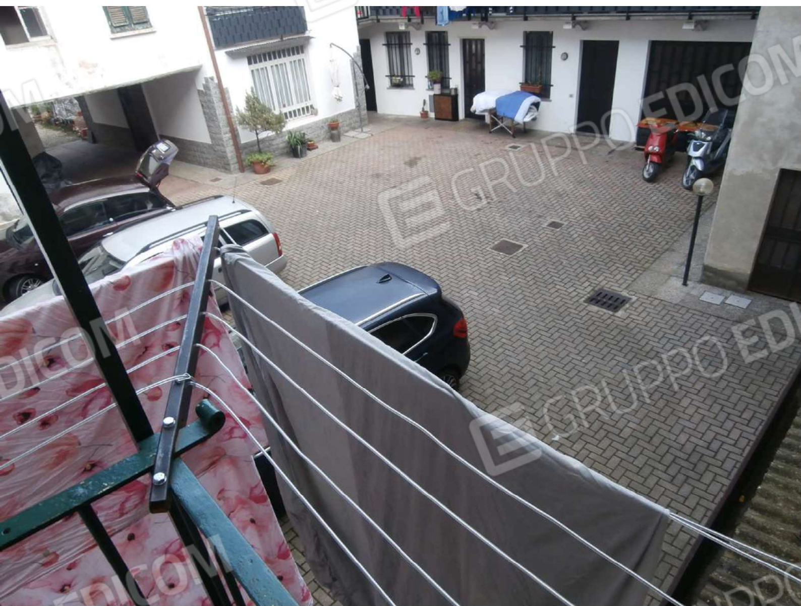
Vista della corte