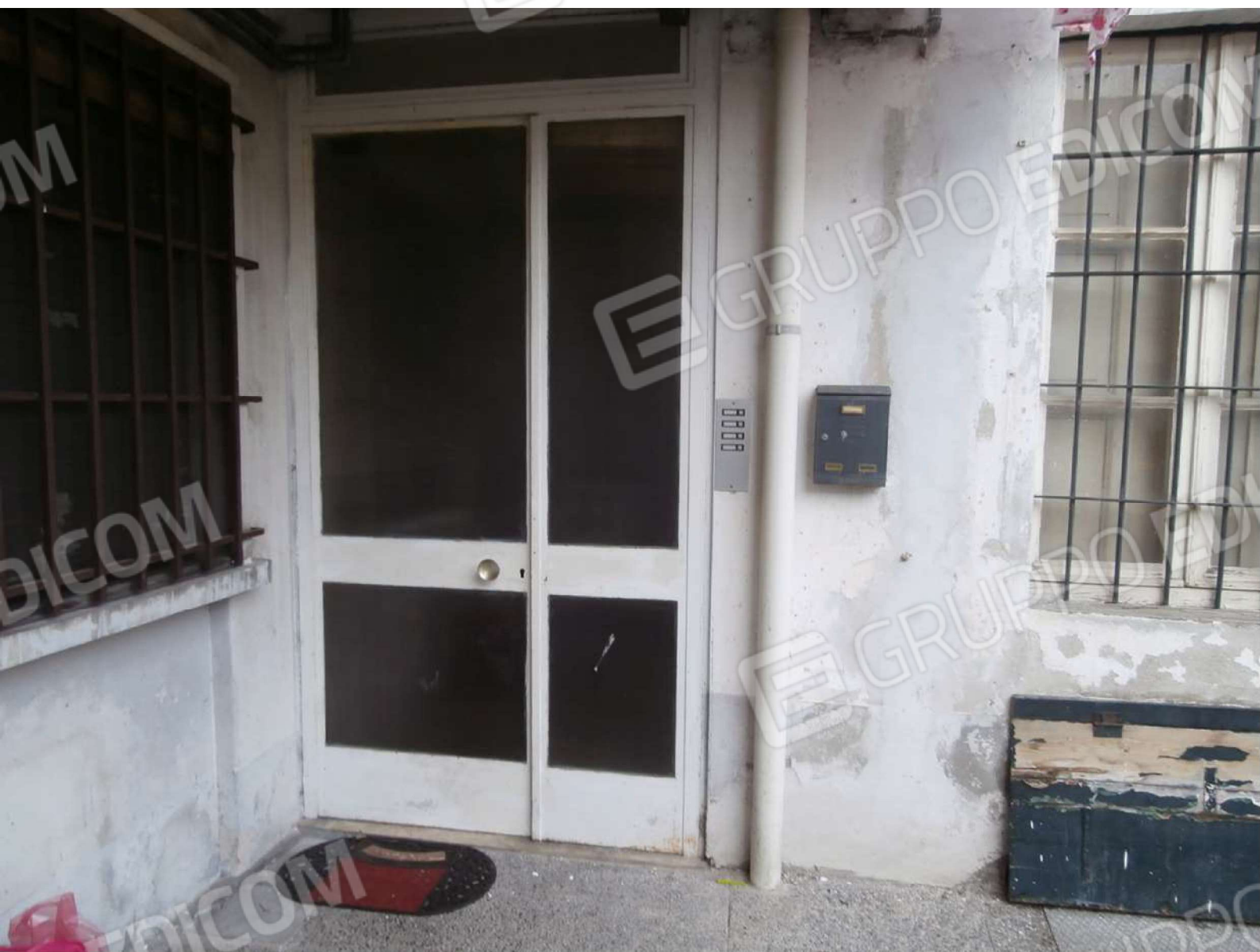
Porta di accesso al vano scala