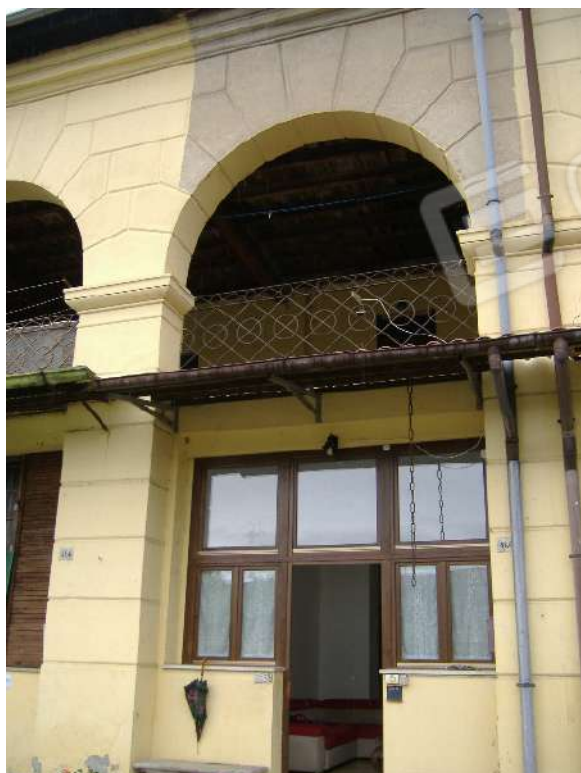
Prospecto sud P.T-1