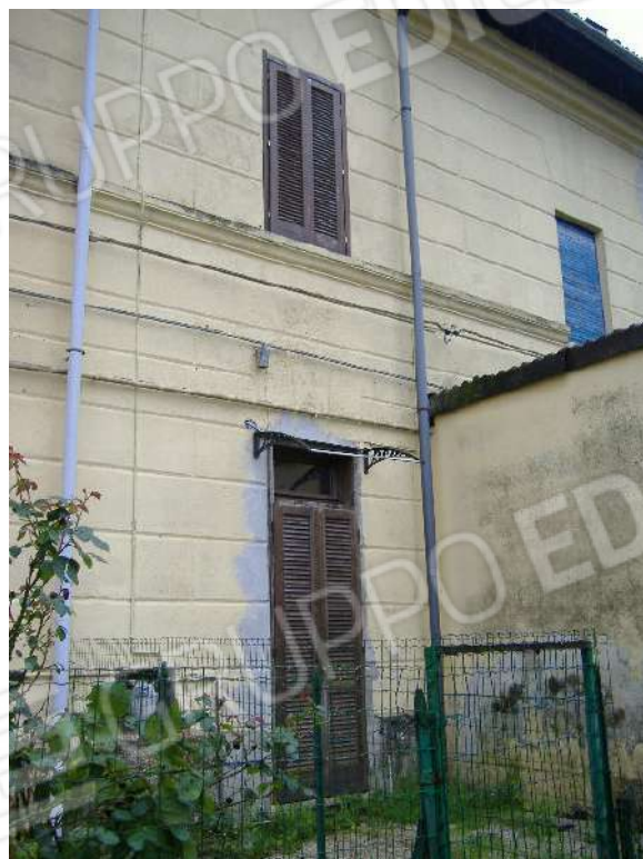
Prospecto nord P.T-1