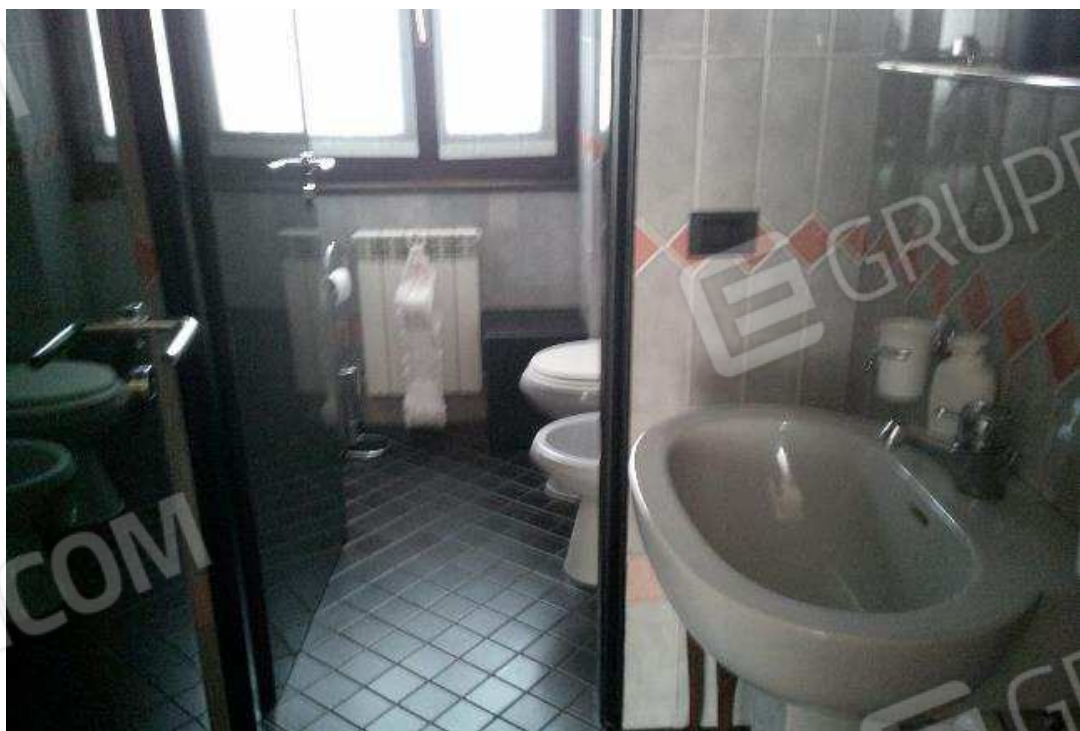
BAGNO UFFICIO SUB. 502