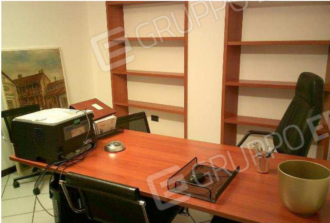
ABITAZIONE SUB. 36