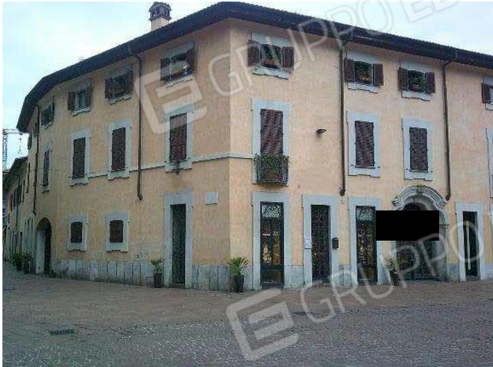
VISTA DA PIAZZA SAN GIOVANNI ANG. VIA CAVOUR