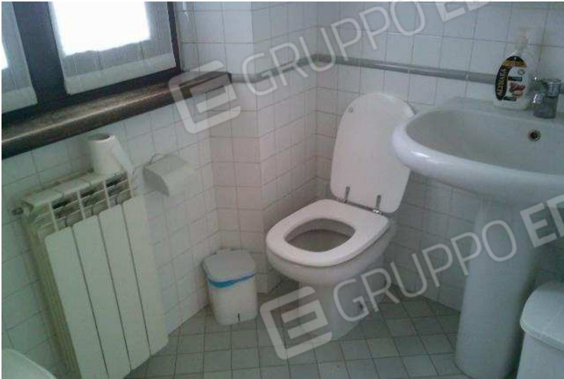
VISTA BAGNO ABITAZIONE SUB. 36