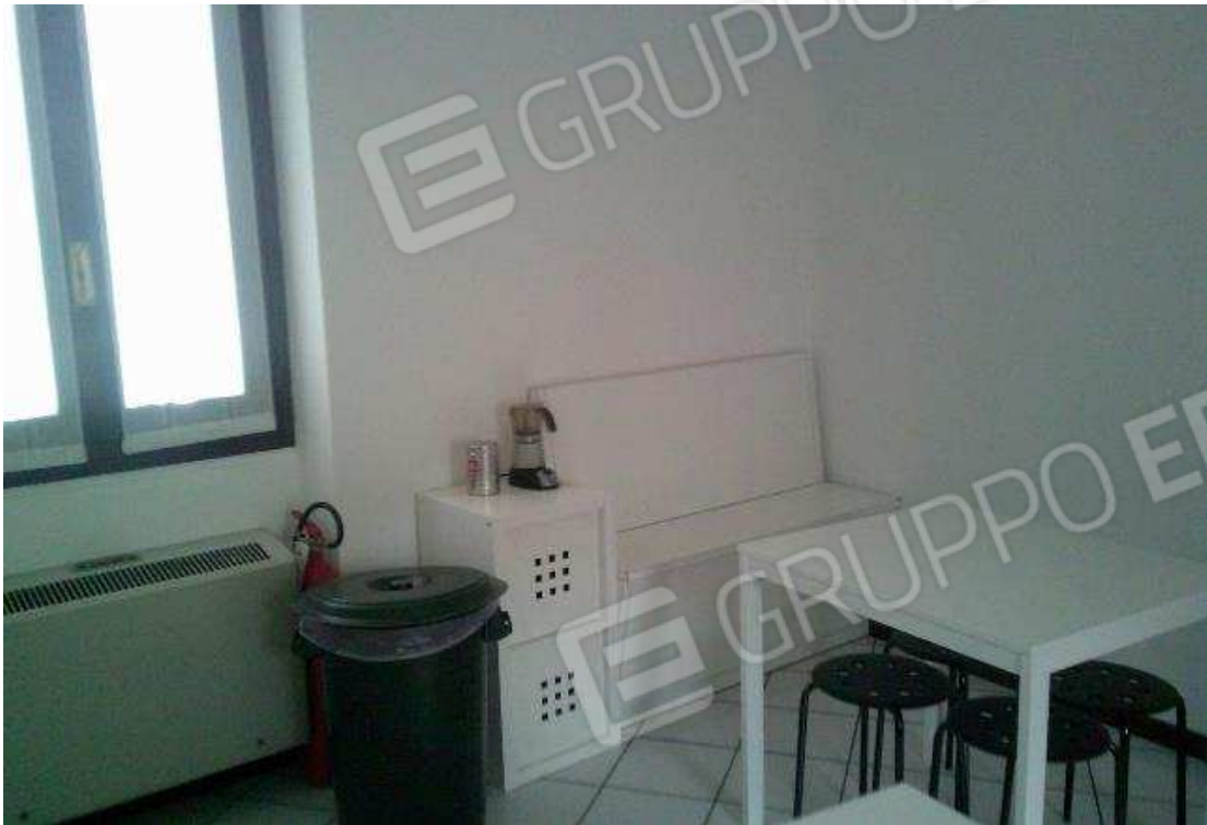
VISTA ABITAZIONE SUB. 36