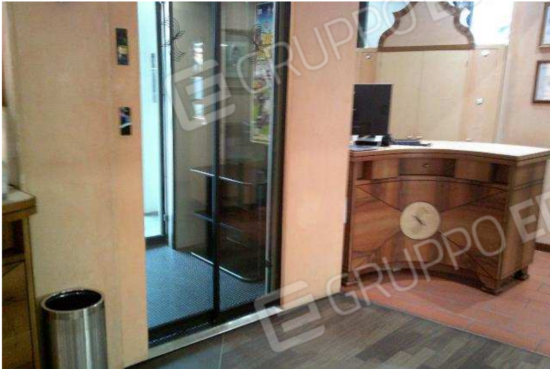
INGRESSO NEGOZIO PT SUB.49