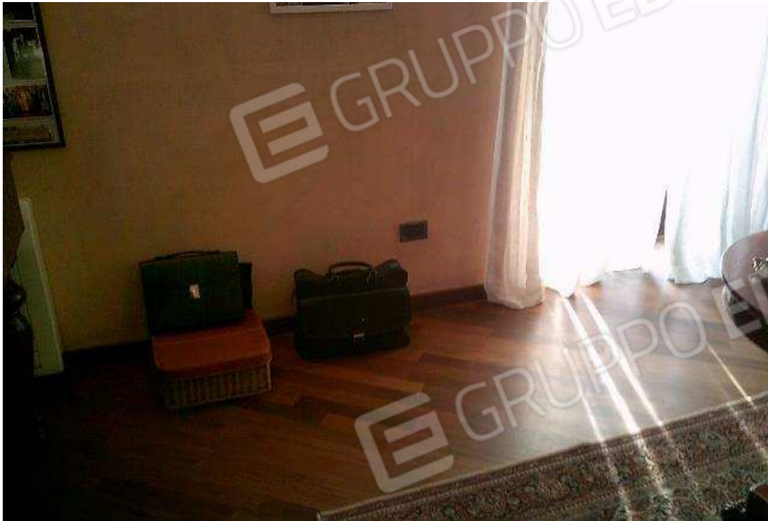
UFFICIO PIANO PRIMO SUB. 502