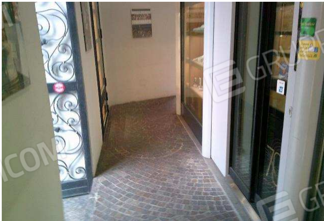
VISTA PORTICO NEGOZIO PT SUB. 49