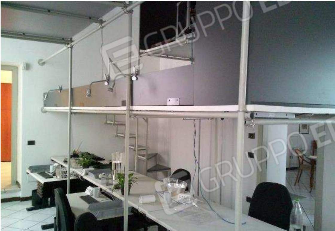
VISTA ABITAZIONE SUB. 36