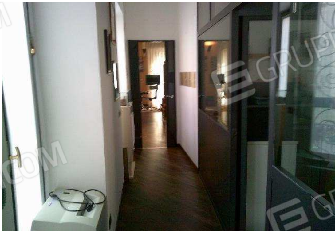
VISTA UFFICIO SUB. 52