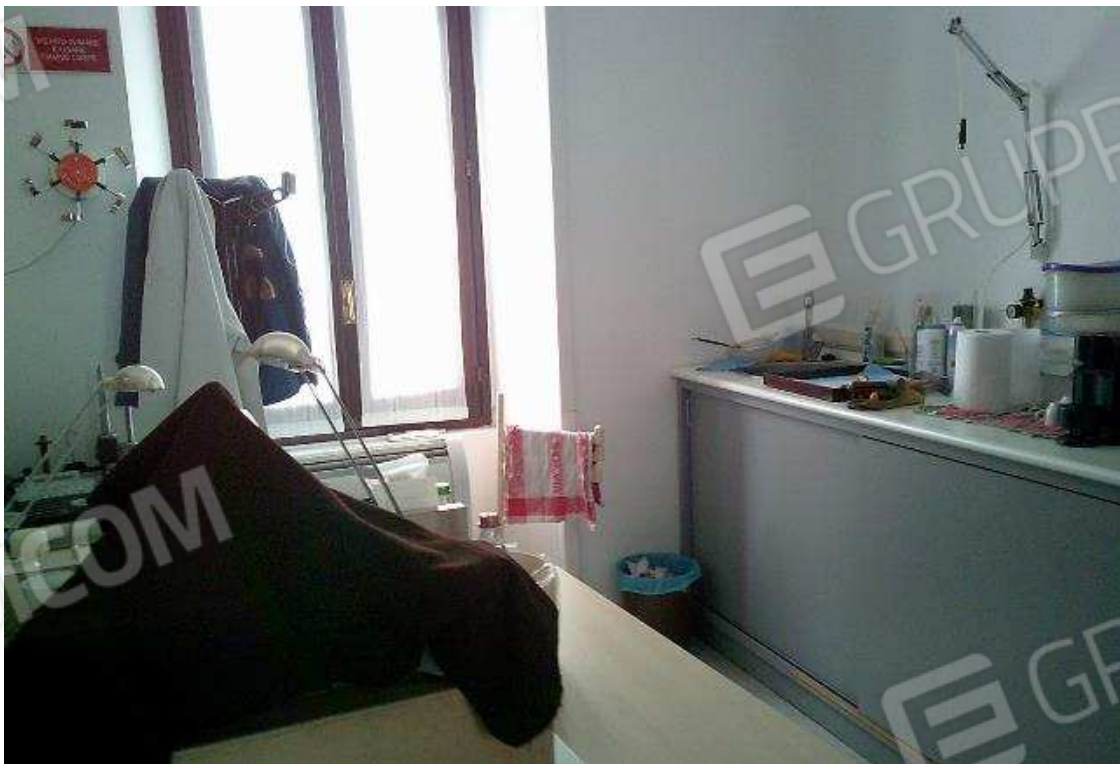
VISTA UFFICIO SUB. 52