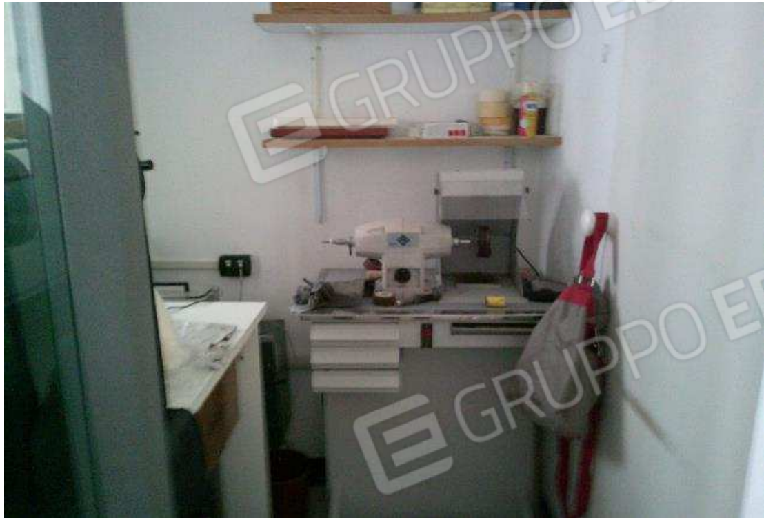
VISTA UFFICIO SUB, 52