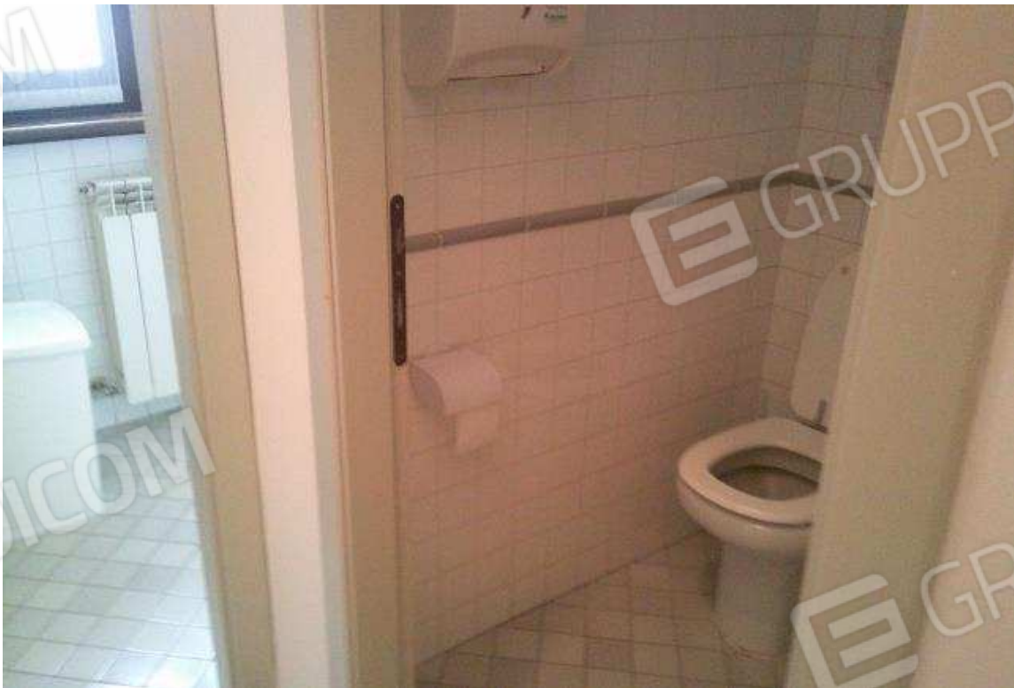
VISTA BAGNO SUB. 36