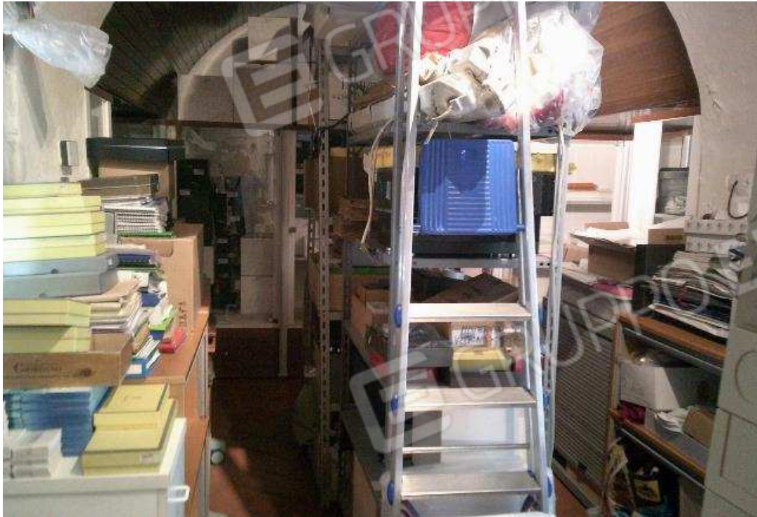
VISTA NEGOZIO INTERRATO SUB. 503