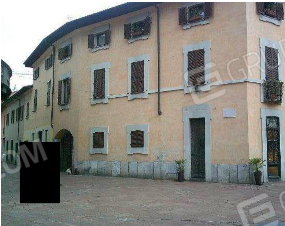
VISTA DA VIA CAVOUR