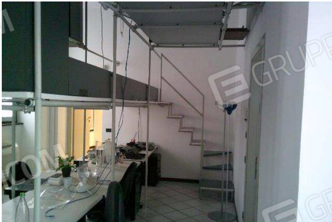
VISTA ABITAZIONE SUB. 36