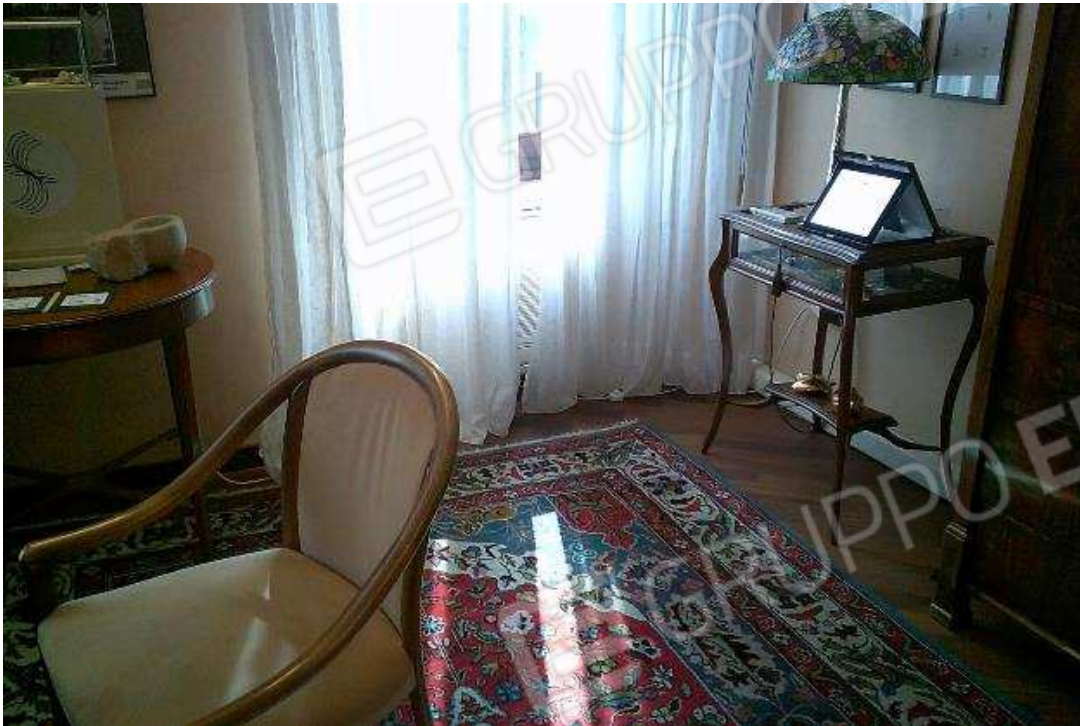
NEGOZIO PIANO PRIMO SUB. 501