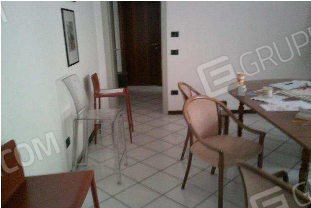
VISTA ABITAZIONE SUB. 36