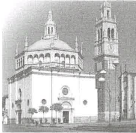
santuario di Santa Maria

limitrofe si trovano in un'area mista residenziale/commerciale (i più importanti centri limitrofi sono Legnano, Varese, Milano). Il traffico nella zona è vietato (zona pedonale), i parcheggi sono con parchimetro. Sono inoltre presenti i servizi di urbanizzazione primaria e secondaria, le seguenti attrazioni storico paesaggistiche: santuario di S. Maria in Piazza.