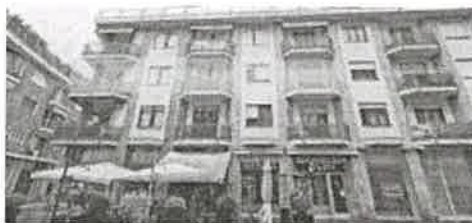
PROSPETTO SULLA VIA SAN GREGORIO