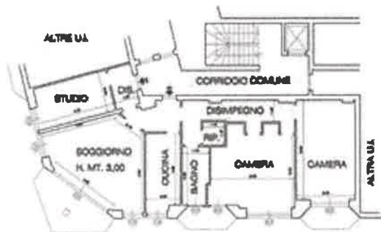
PLANIMETRIA APPARTAMENTO COME DA P.E. 914/2018