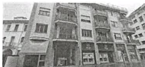
PROSPETTO SULLA VIA SAN GREGORIO - LATERALE