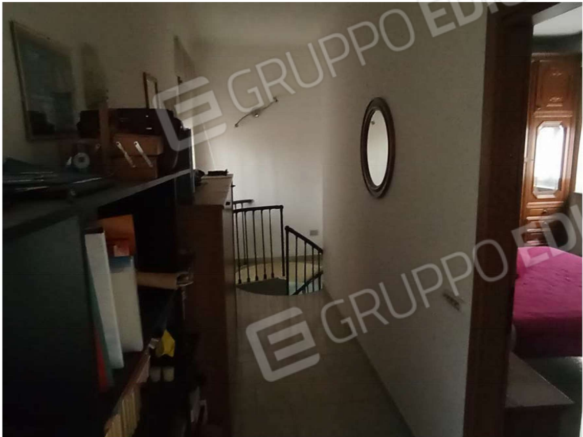
F6 CORPO A PIANO PRIMO – CAMERA