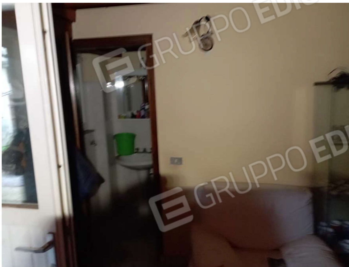
F16 CORPO C PIANO PRIMO