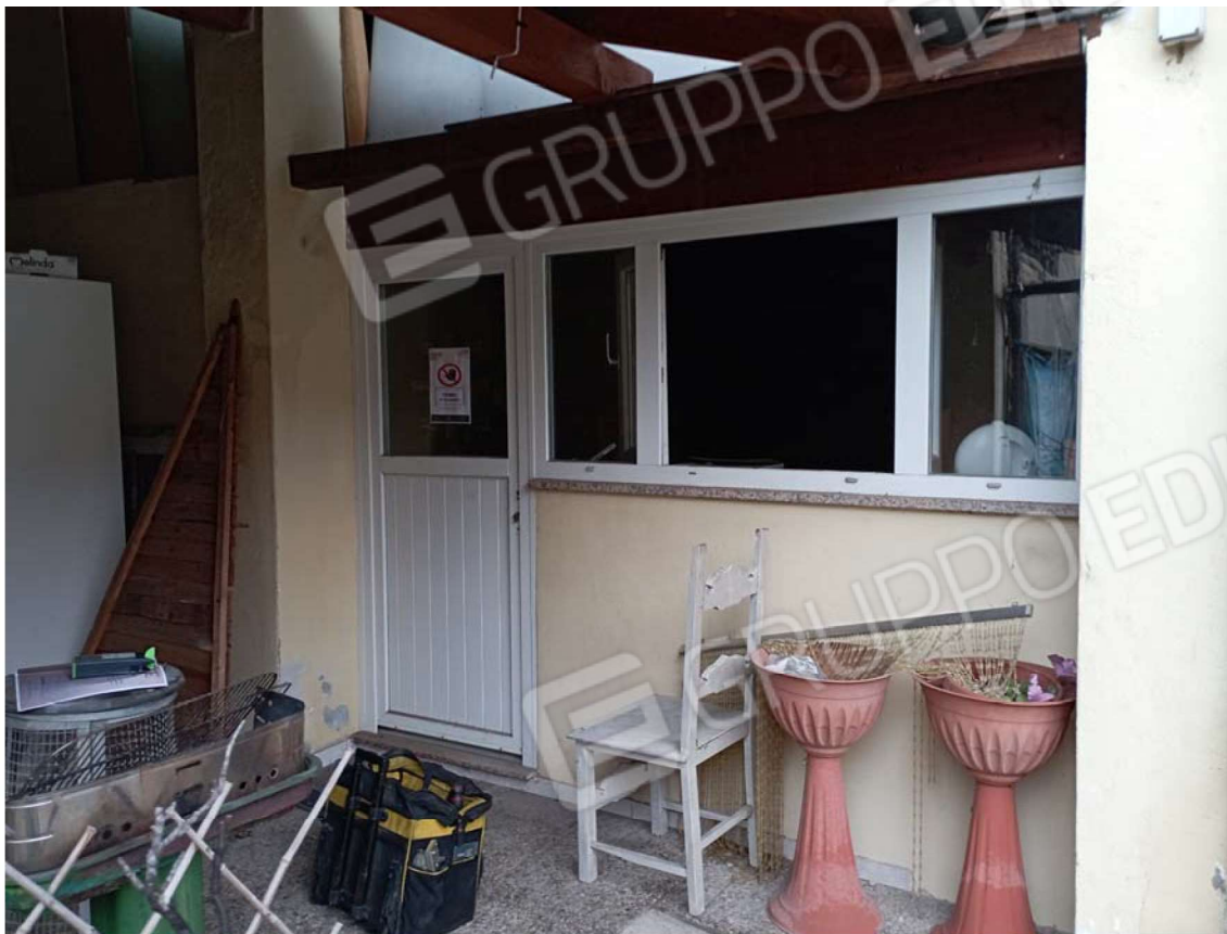
F12 CORPO C PIANO TERRA