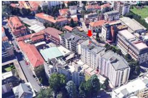
Vista aerea con localizzazione / identificazione della palazzina cui appartengono le uu.ii. oggetto di stima - FRONTE NORD