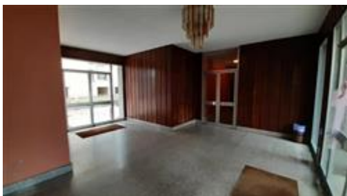
Vista dell'atrio di ingresso alla palazzina