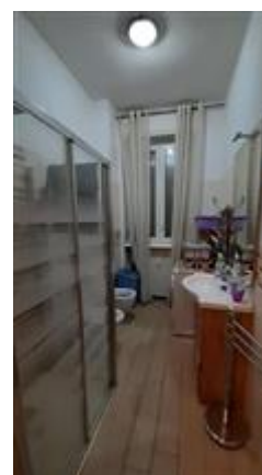
Vista del bagno