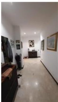
Vista del disimpegno d'ingresso