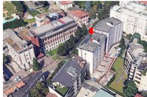
Vista aerea con localizzazione / identificazione della palazzina cui appartengono le uu.ii. oggetto di stima - FRONTE EST