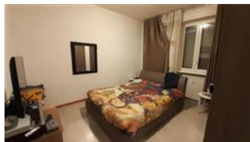
Vista della camera da letto n.2