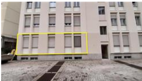
Vista dello stabile condominiale dal cortile comune/condominiale - Alloggio evidenziato