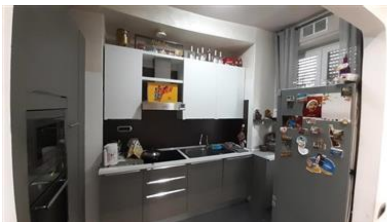
Vista della cucina