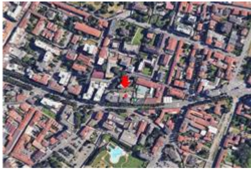
Vista aerea con localizzazione / identificazione della palazzina cui appartengono le uu.ii. oggetto di stima