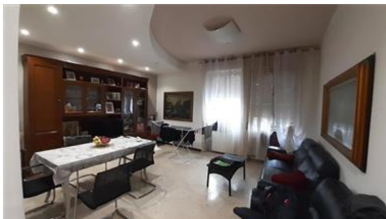
Vista del soggiorno-pranzo