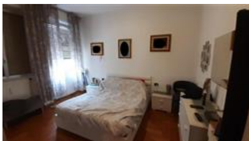
Vista della camera da letto n.1