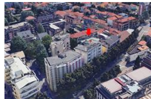
Vista aerea con localizzazione / identificazione della palazzina cui appartengono le uu.ii. oggetto di stima - FRONTE OVEST