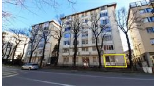
Vista dello stabile condominiale da V.le Luigi Cadorna - Alloggio evidenziato