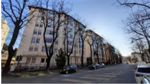
Vista dello stabile condominiale da V.le Luigi Cadorna

L'intero edificio sviluppa 8 piani, 7 piani fuori terra, 1 piano interrato. Immobile costruito nel 1971 ristrutturato nel 2023.