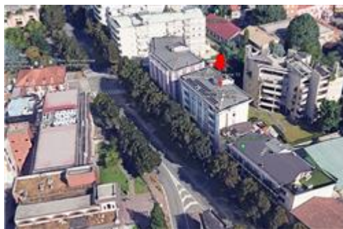
Vista aerea con localizzazione / identificazione della palazzina cui appartengono le uu.ii. oggetto di stima - FRONTE SUD