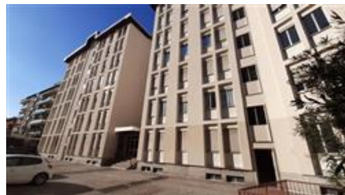
Vista dello stabile condominiale dal cortile comune/condominiale