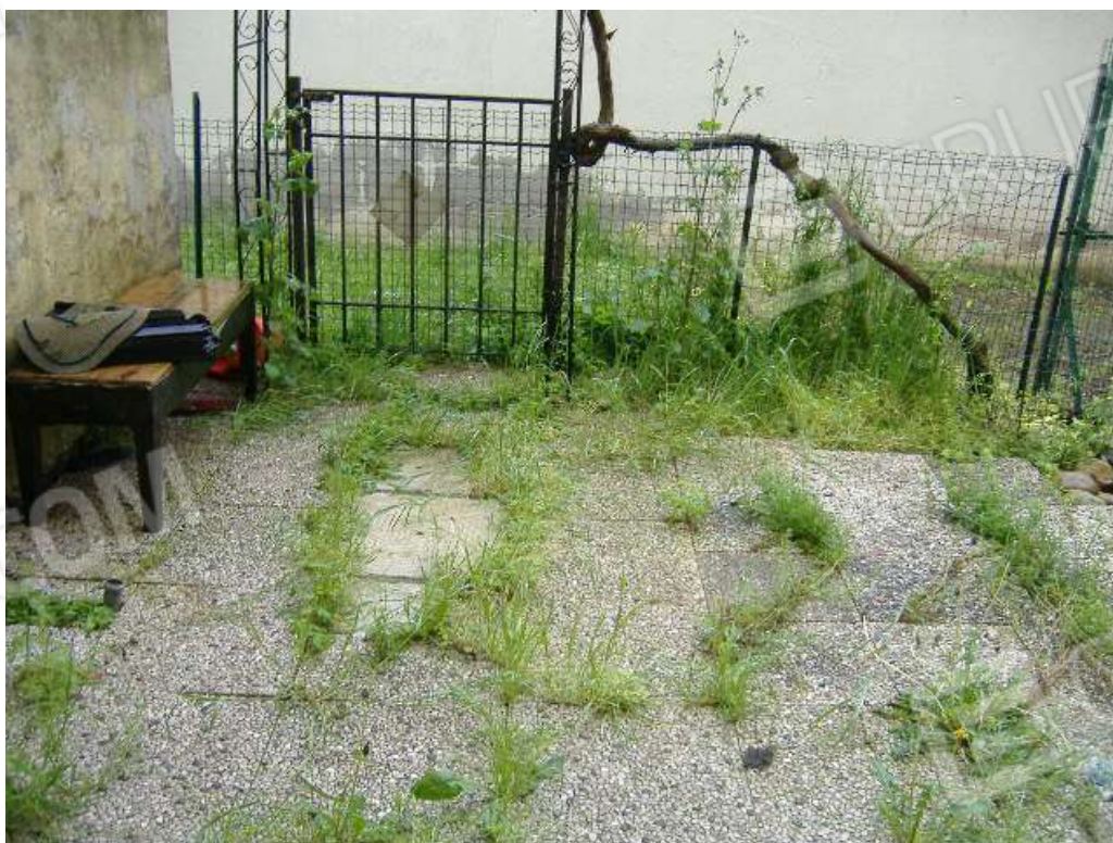
Area esclusiva (lato nord)