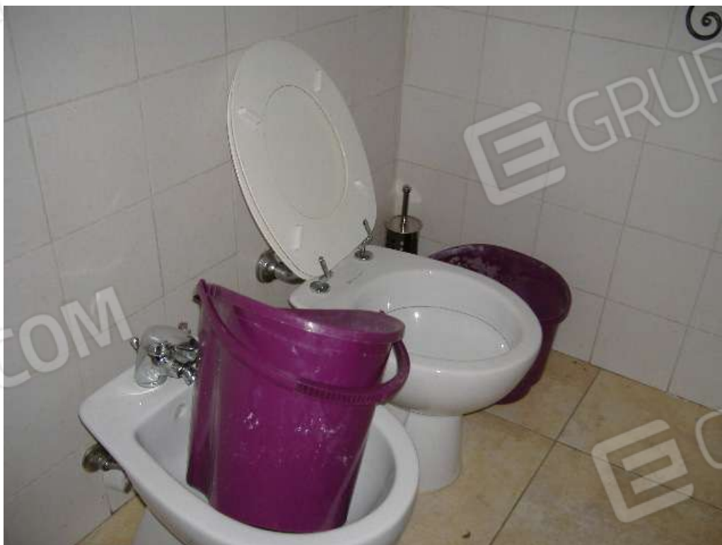
P.2 – Lavanderia