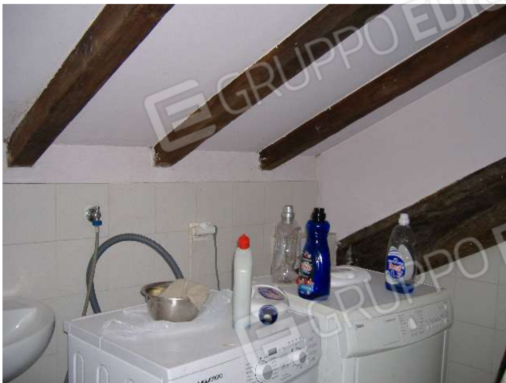
P.2 – Lavanderia