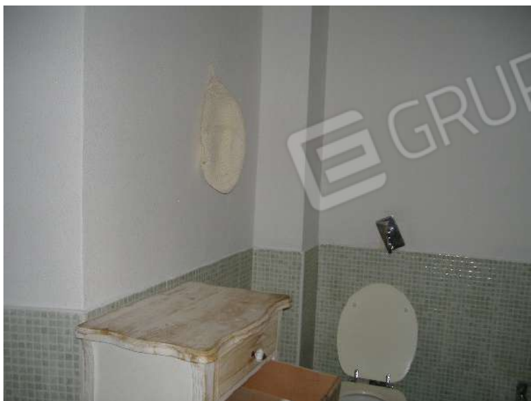
P.1 – Bagno