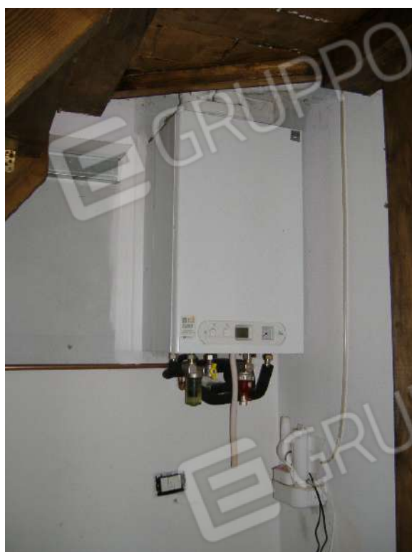
P.2 – Ripostiglio