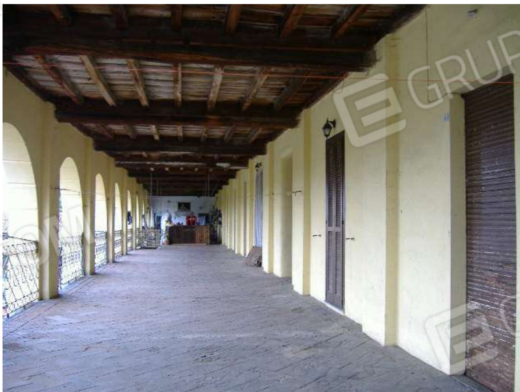
P.1 – Prospetto sud (ballatoio comune)