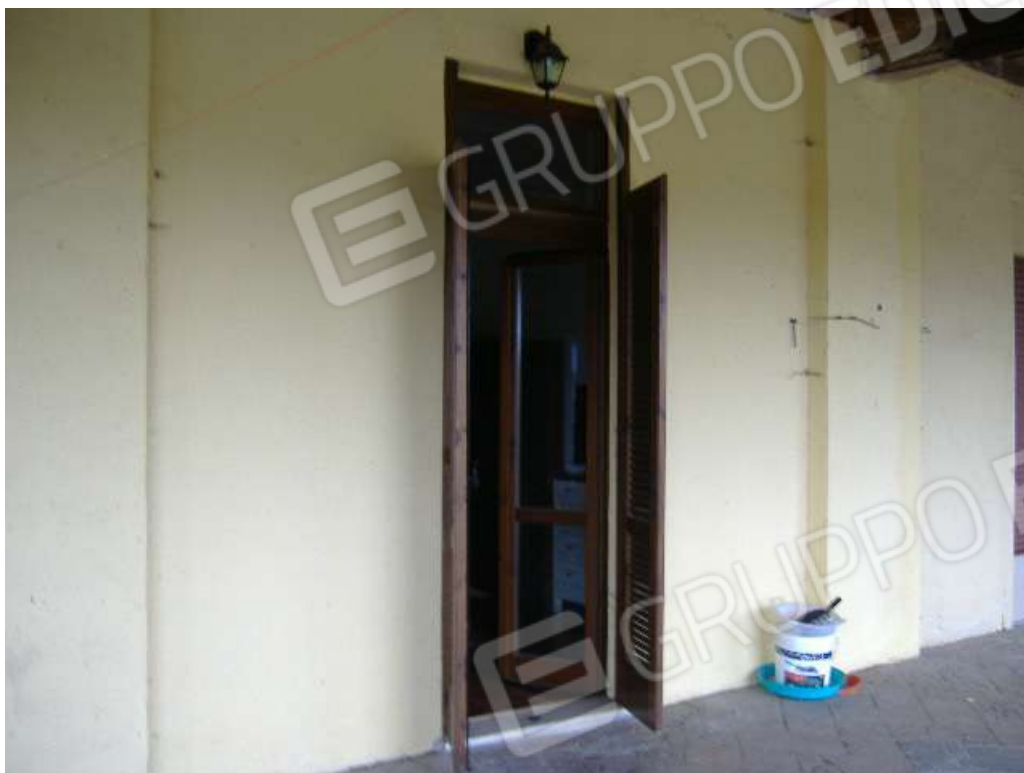
P.1 – Prospetto sud (lato camera)