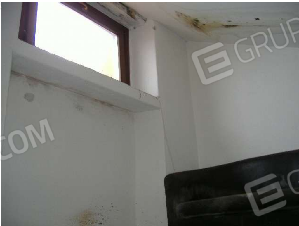
P.2 – Soppalco