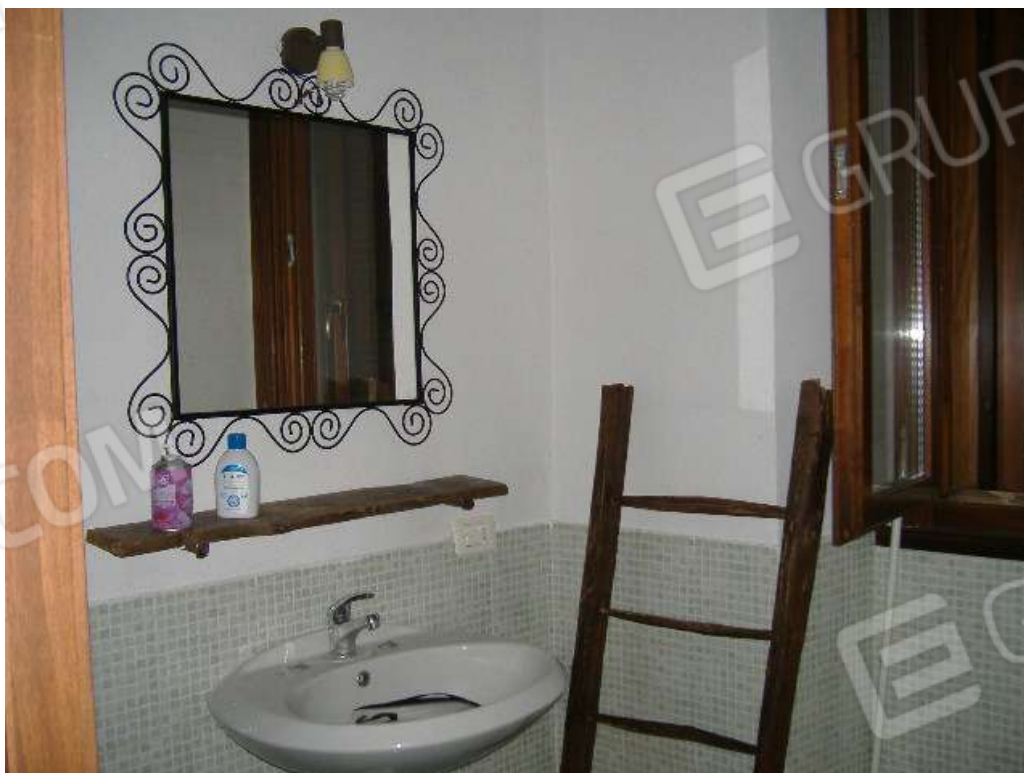
P.1 – Bagno (lato nord)