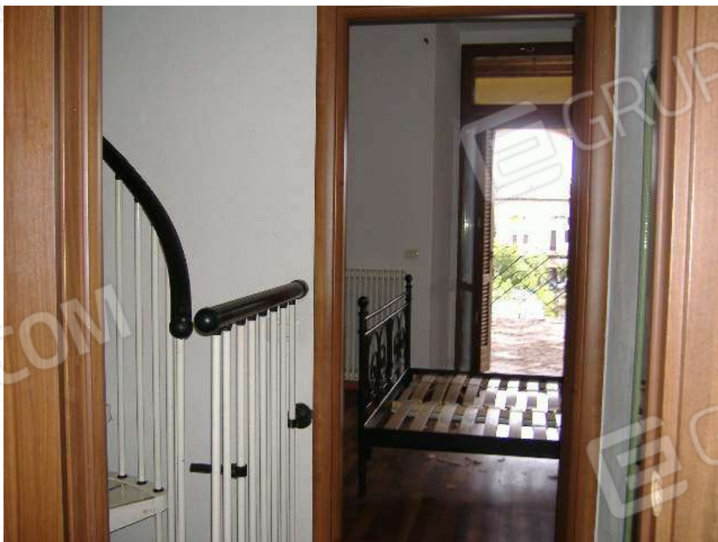
P.1 – Disimpegno