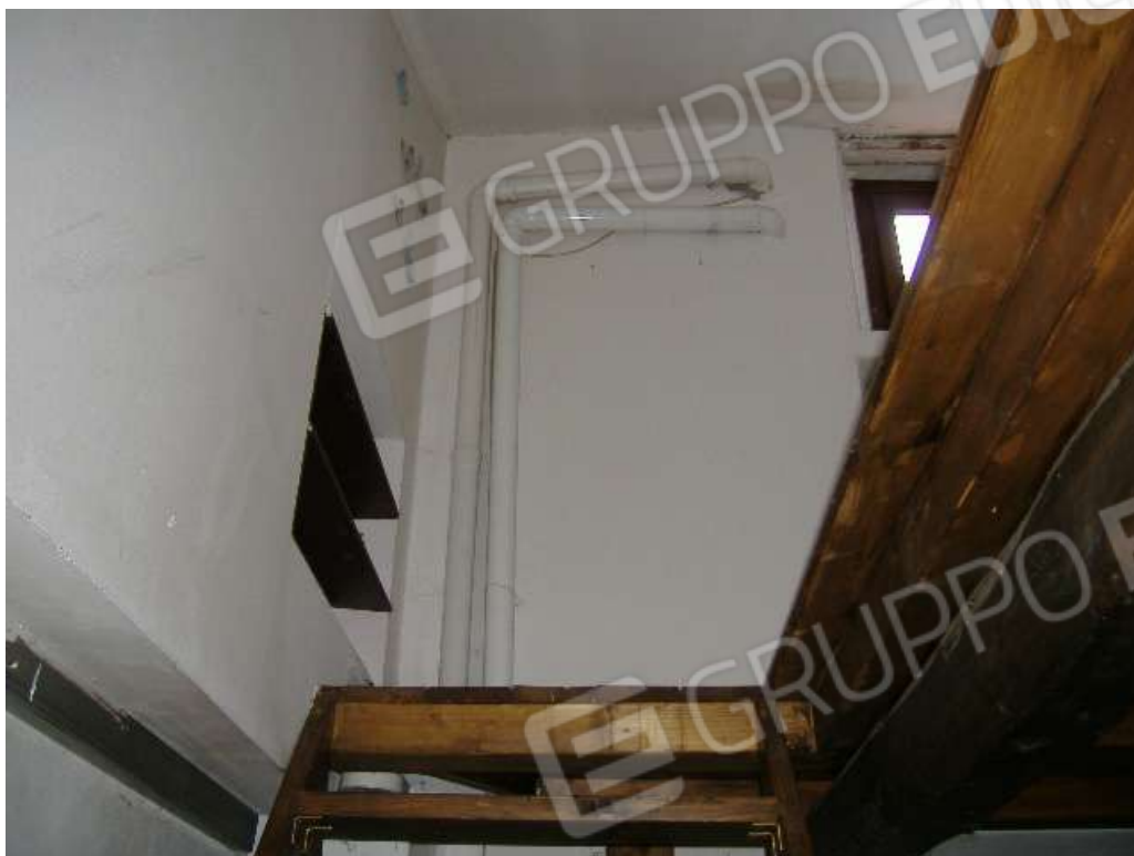
P.2 – Soppalco