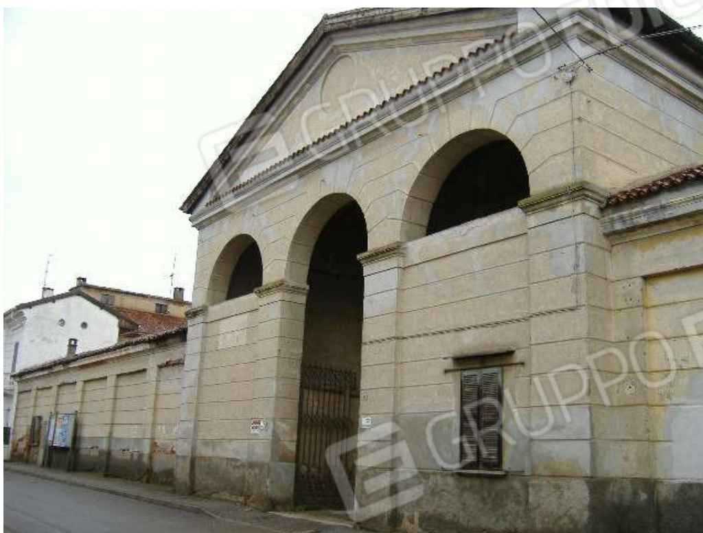
Accesso pedonale e carraio da via Arese n. 48