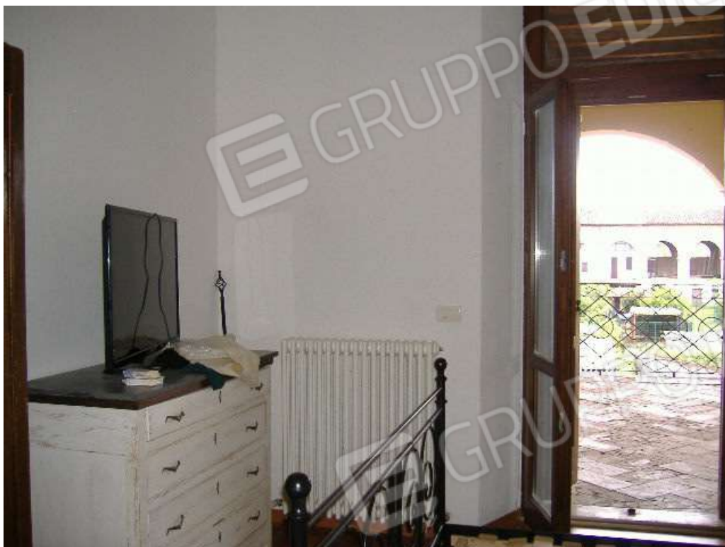
P.1 – Camera (lato ballatoio comune)