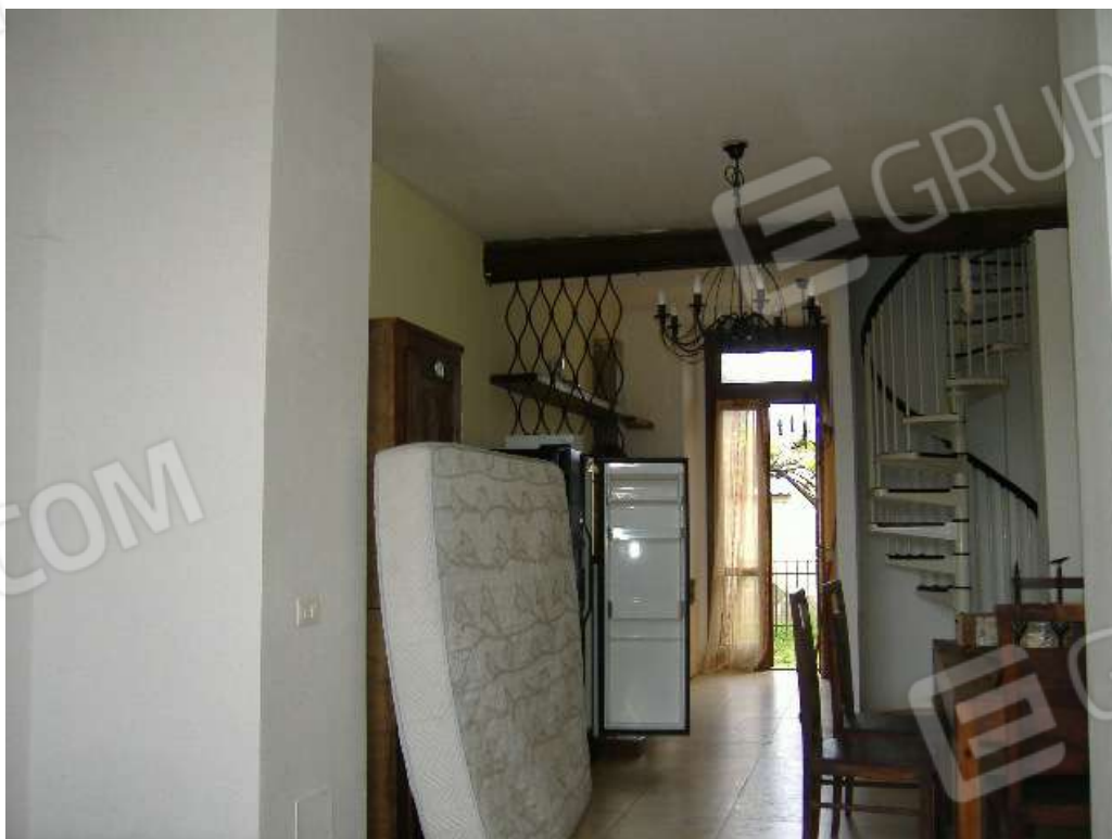
P.T – Pranzo e angolo cottura