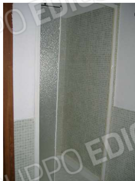
P.1 – Bagno