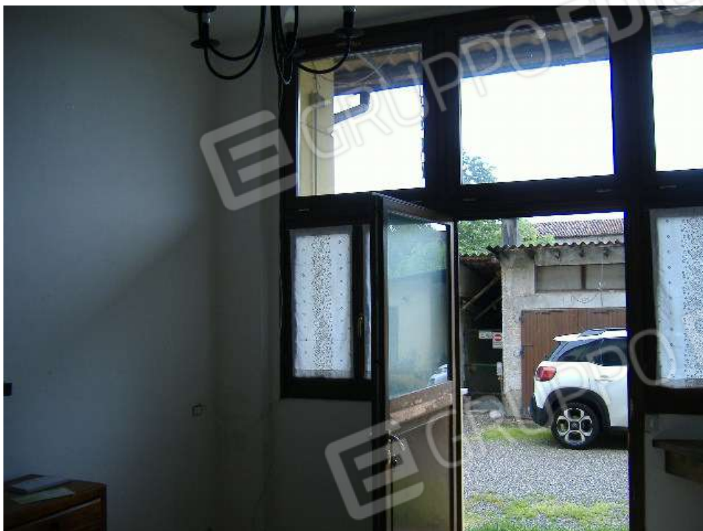
P.T – Zona giorno