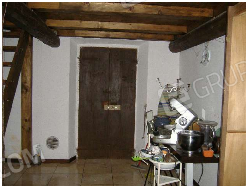
P.2 – Ripostiglio