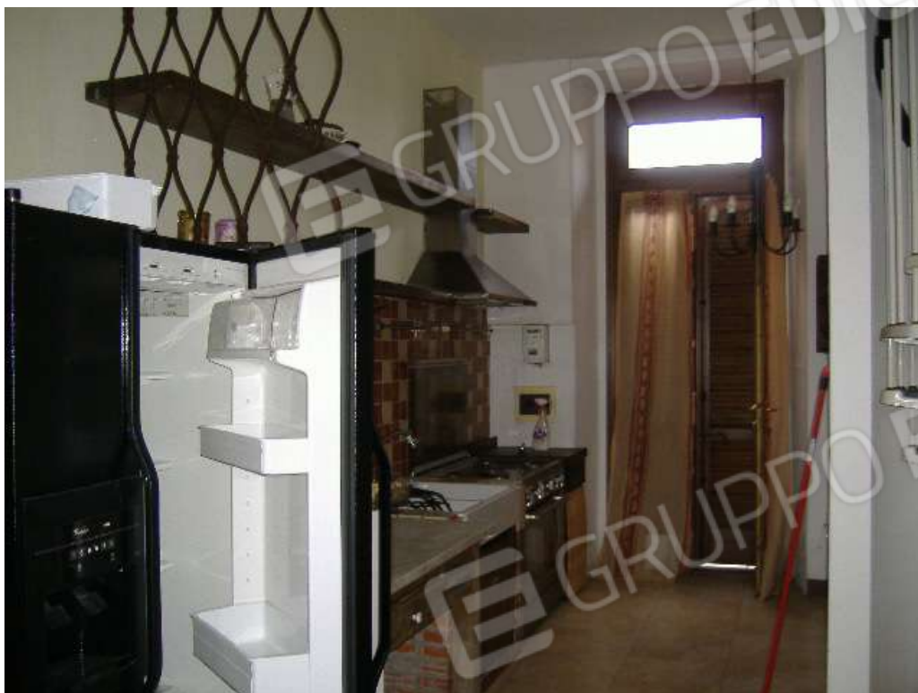
P.T – Angolo cottura