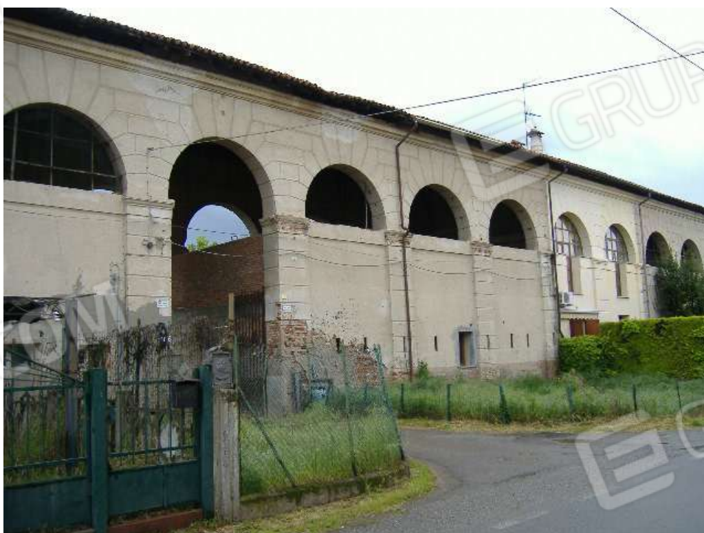
Accesso pedonale e carraio da via Garibaldi