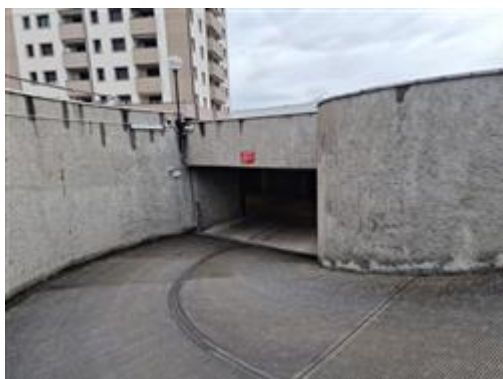
Rampa di accesso al corsello box

Coerenze: Da nord in senso orario; terrapieno, terrapieno, corsia box comune, altra unità immobiliare