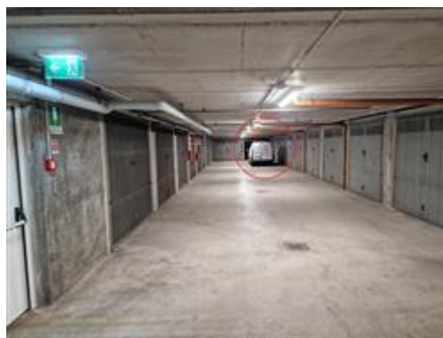
Vista da corsello box