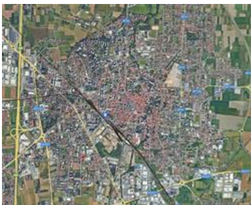
inquadramento nel territorio comunale

I beni sono ubicati in zona semicentrale in un'area residenziale, le zone limitrofe si trovano in un'area residenziale. Il traffico nella zona è locale, i parcheggi sono buoni. Sono inoltre presenti i servizi di urbanizzazione primaria e secondaria.