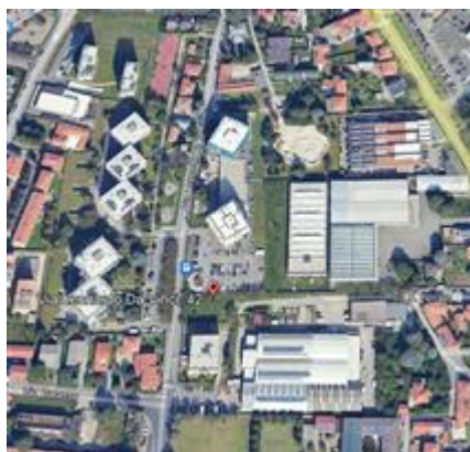
inquadramento nel quartiere