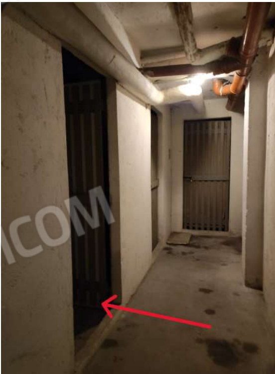
Ingresso alla cantina