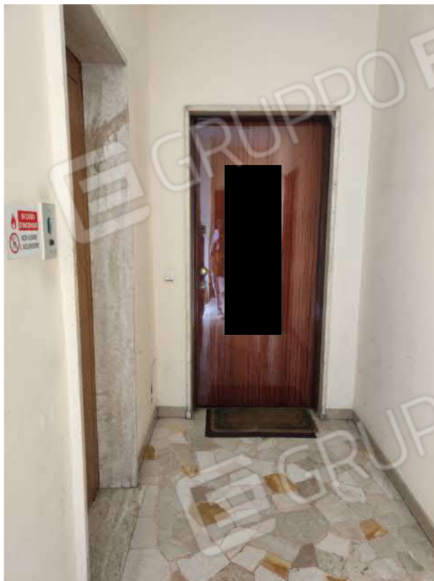
Portoncino dell'appartamento del piano 1°(viste dal vano scala dall' interno)