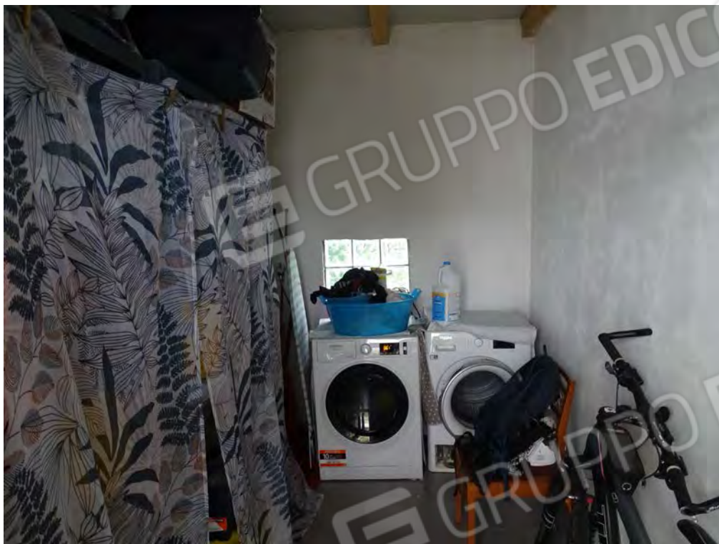
Vista interna ripostiglio