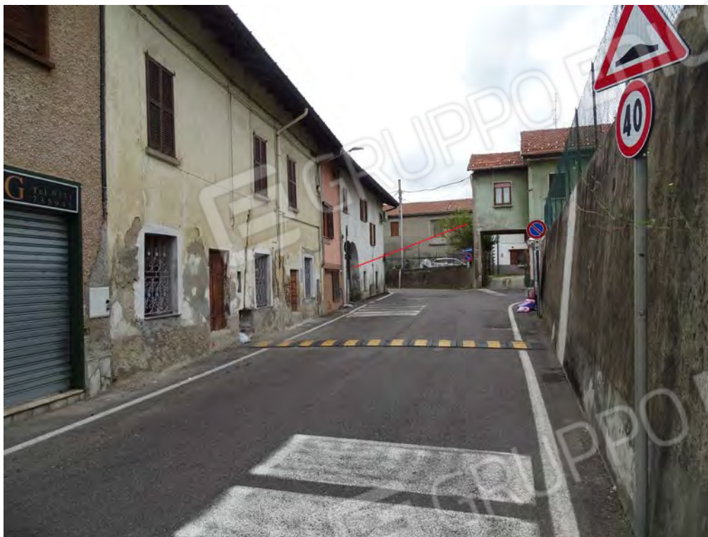
Vista via IV Novembre ingresso carraio/pedonale