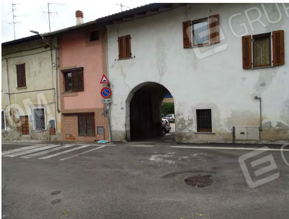
Vista ingresso carraio/pedonale da via IV Novembre