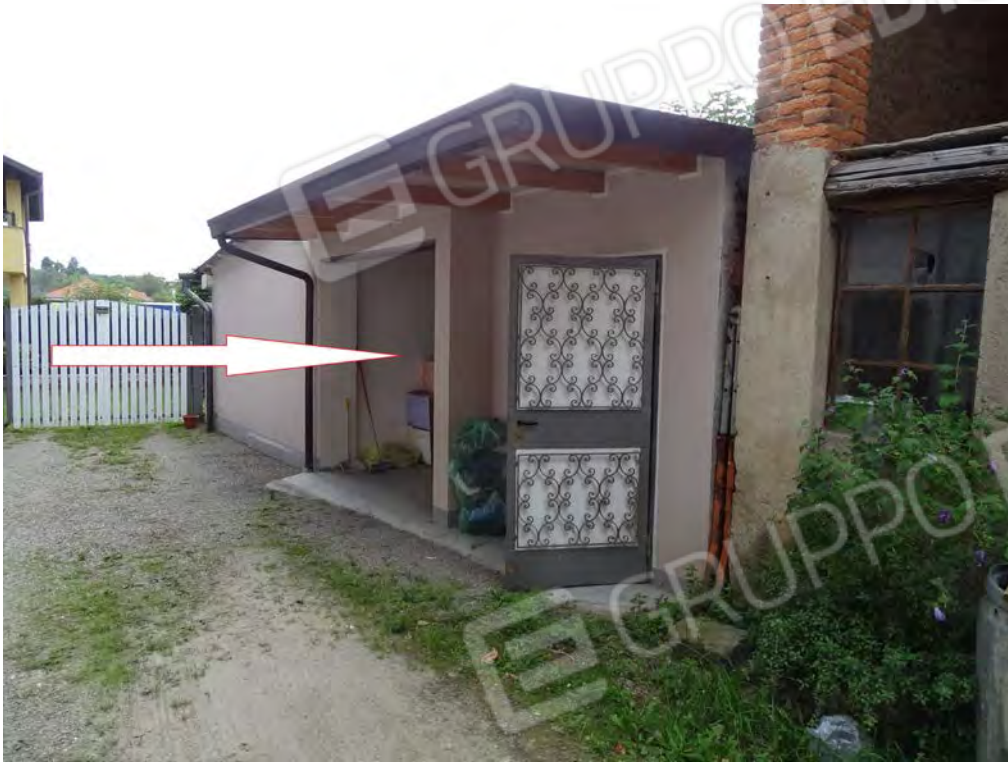
Vista ingresso cortile