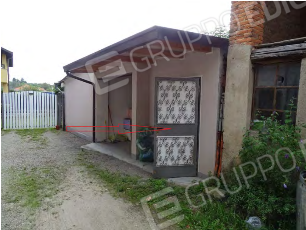
Vista ingresso ripostiglio dal cortile