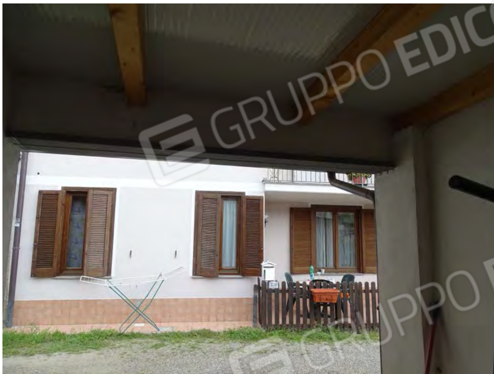
Vista box interna