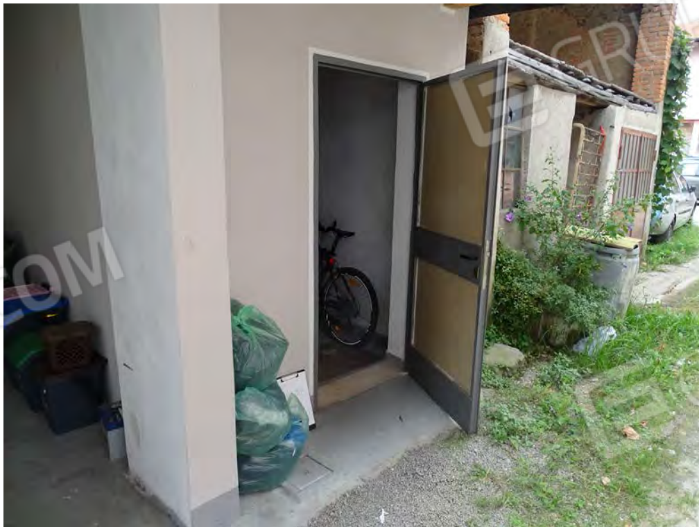
Vista ingresso ripostiglio dal cortile