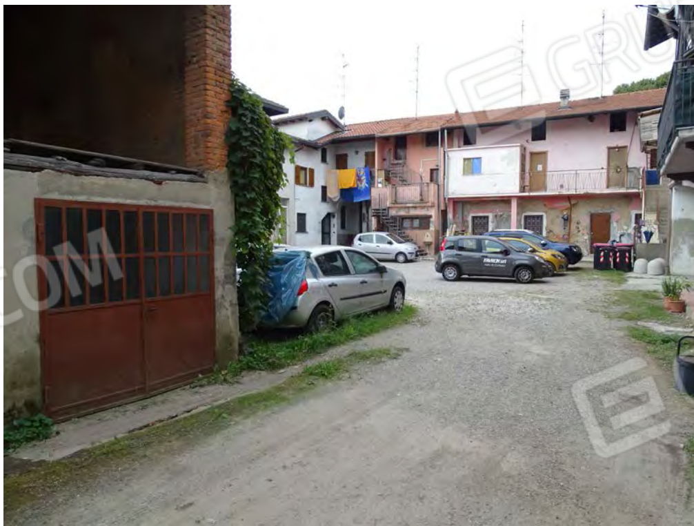
Vista interna cortile verso passo carraio