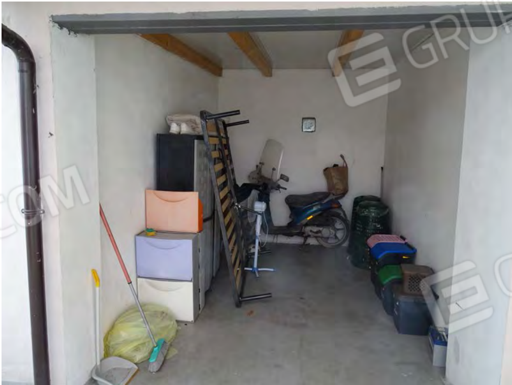
Vista box interna