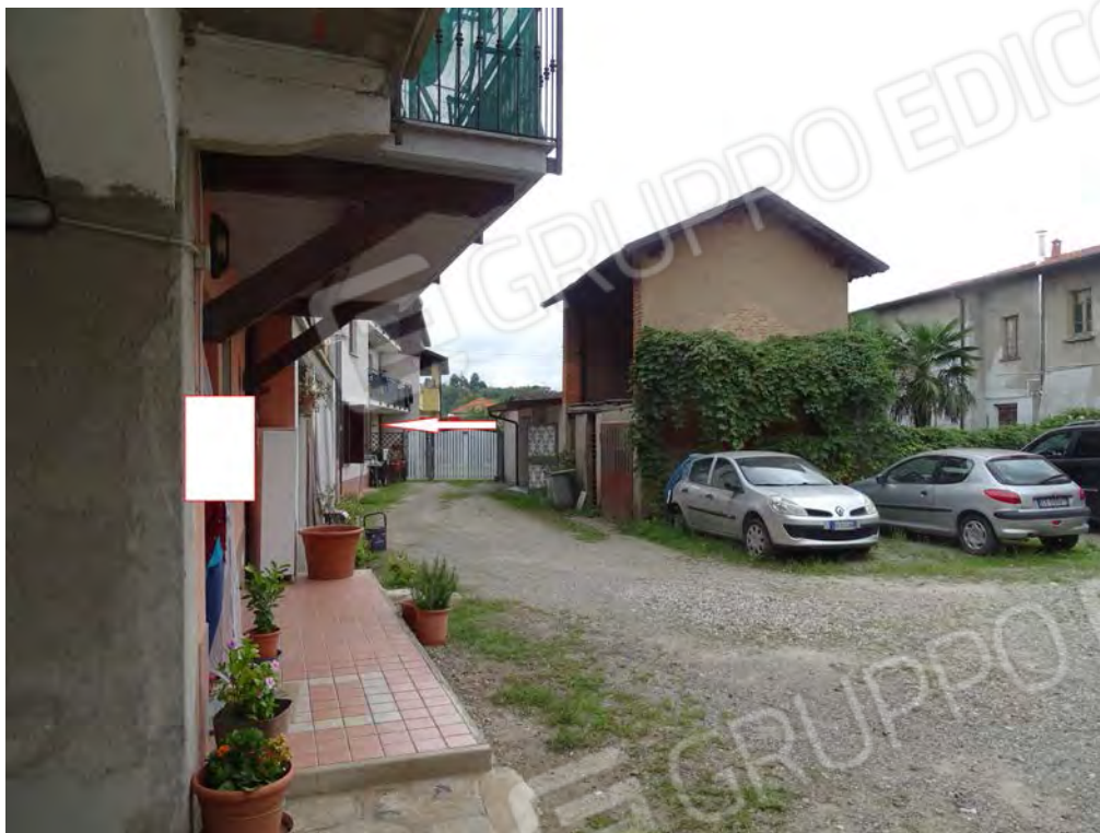
Vista interna cortile e posizione appartamento