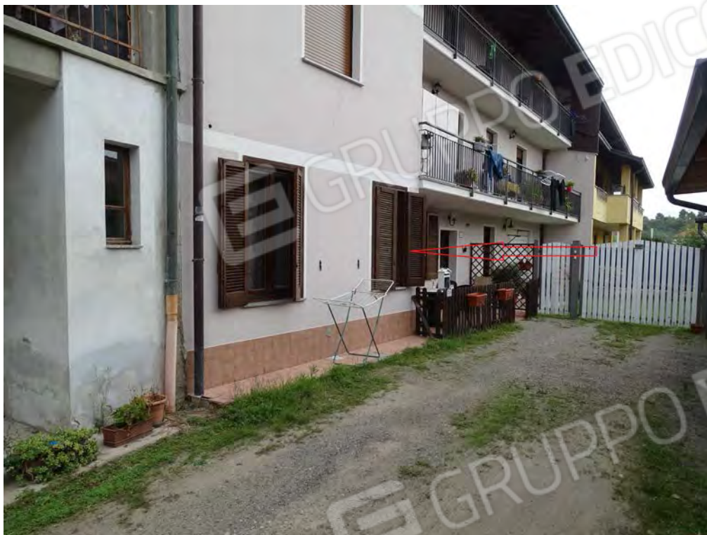
Vista appartamento interno cortile