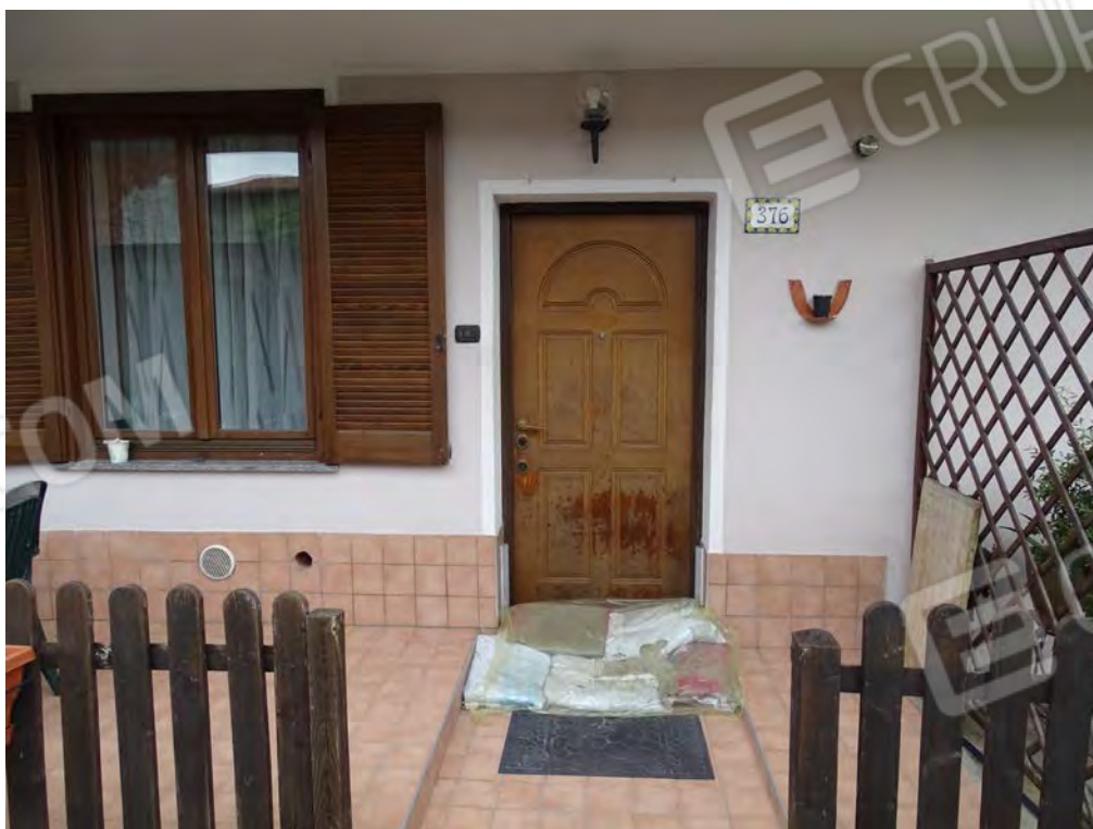
Vista ingresso appartamento