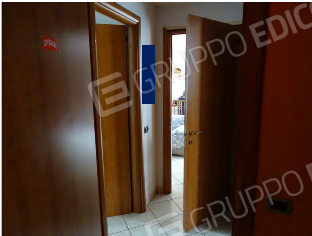
Vista corridoio norre