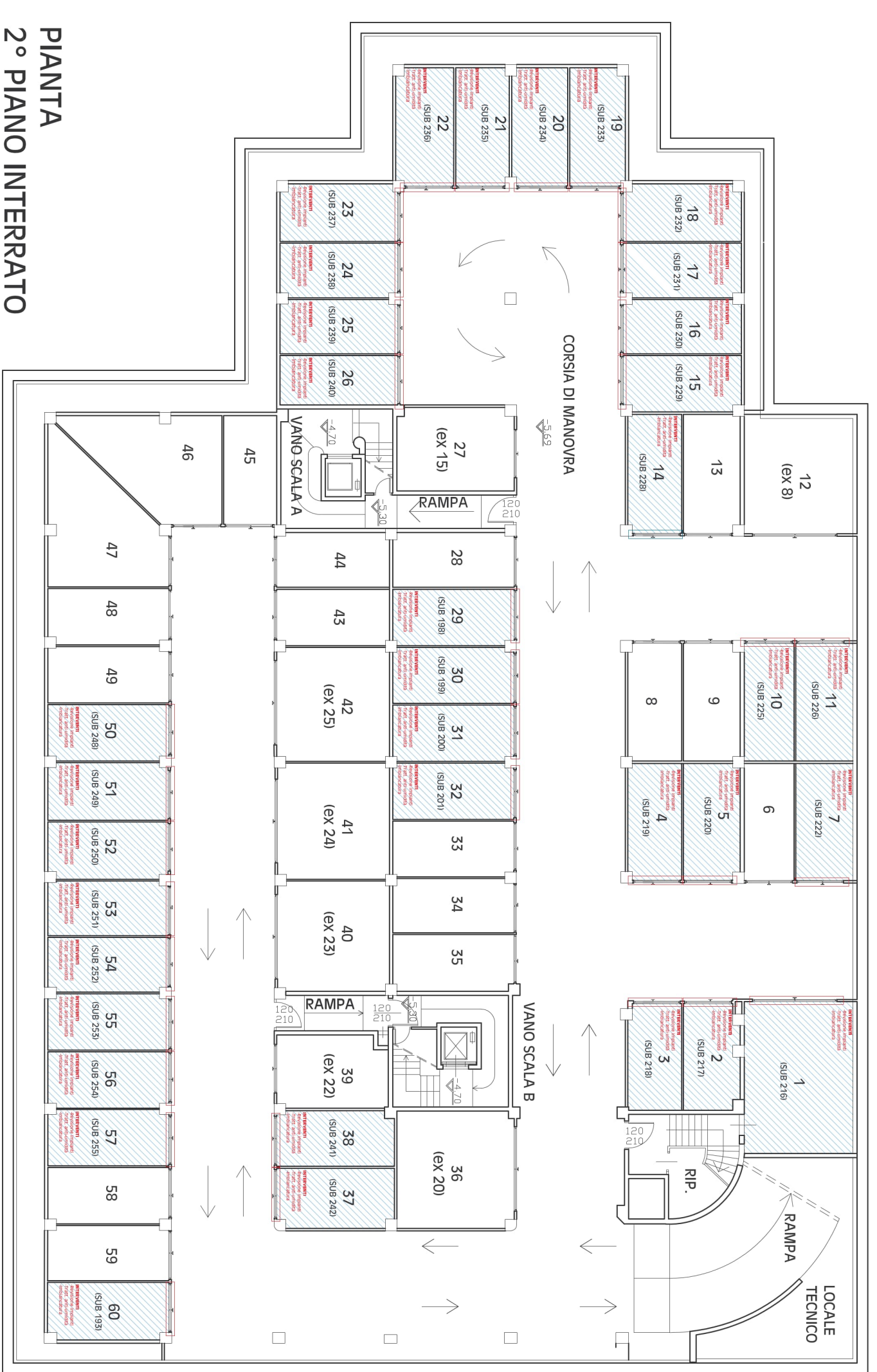
PIANTA 2° PIANO INTERRATO